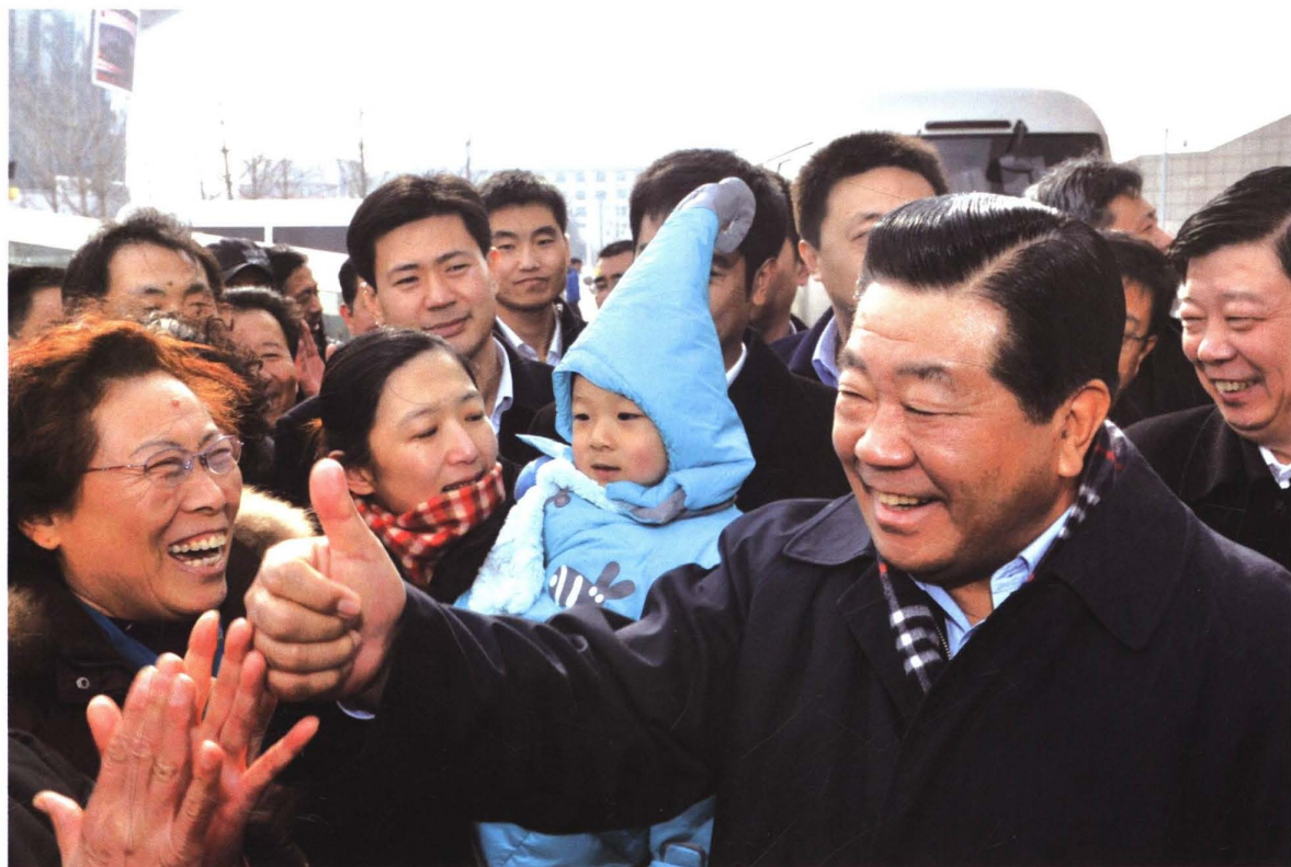
2010年12月18日,全国政协主席贾庆林(右一)到菏泽视察