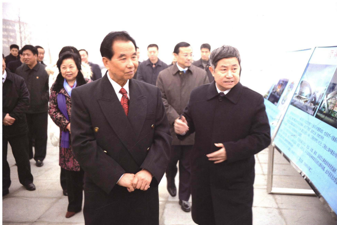
2009年12月11日,原中共中央政治局常委、中央纪律检查委员会书记吴官正(前左)到菏泽视察