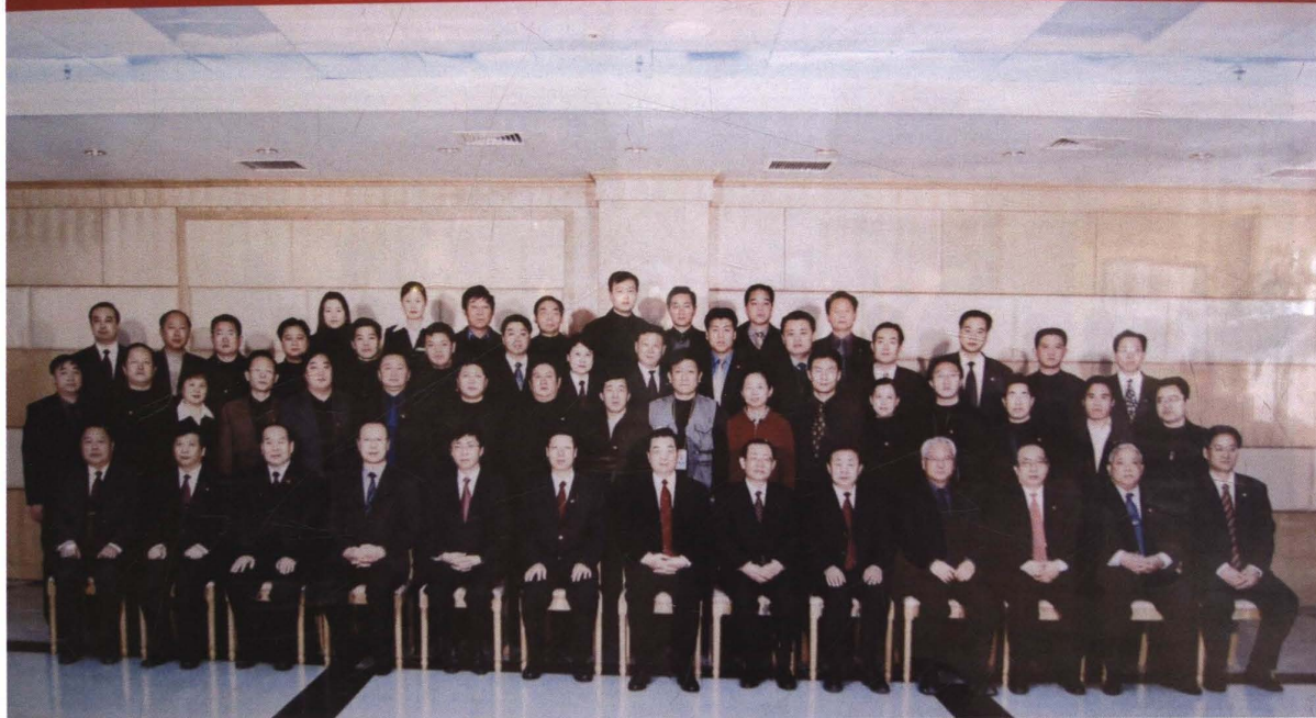
2003年12月14日,中共中央总书记、国家主席胡锦涛(前排中)视察菏泽