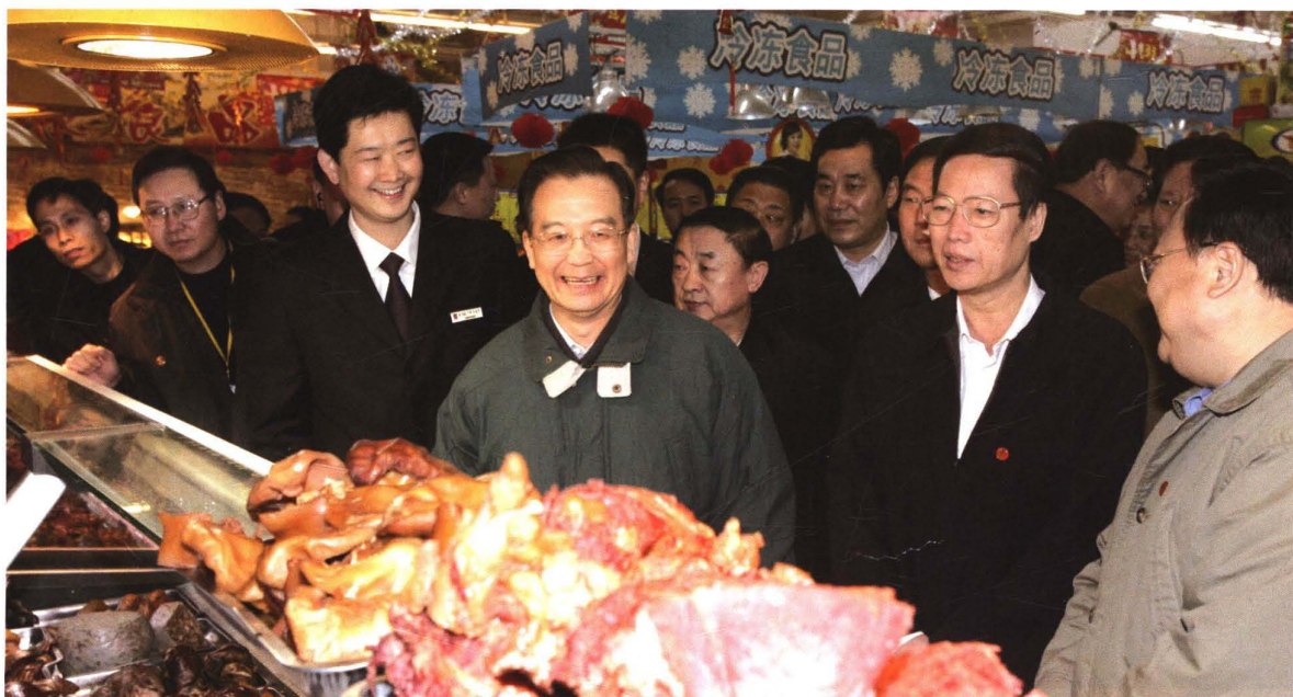
2006年1月28日,国务院总理温家宝(左二)视察鲁能副食品超市