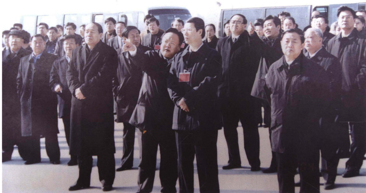
2003年2月3日,中共山东省委书记张高丽(右二)、省长韩寓群(右一)到菏泽视察