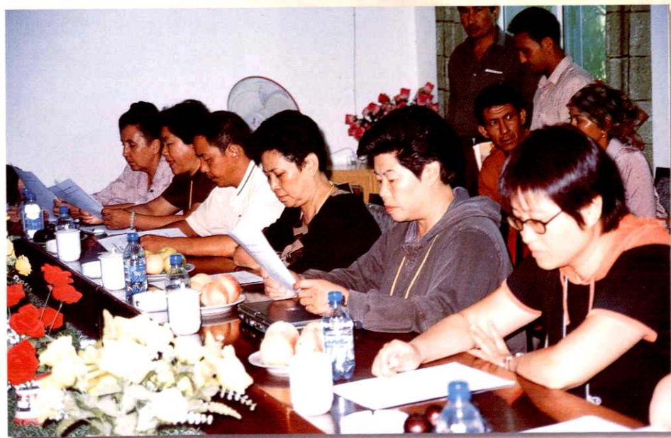
地区计生委到县（市）检查与指导工作