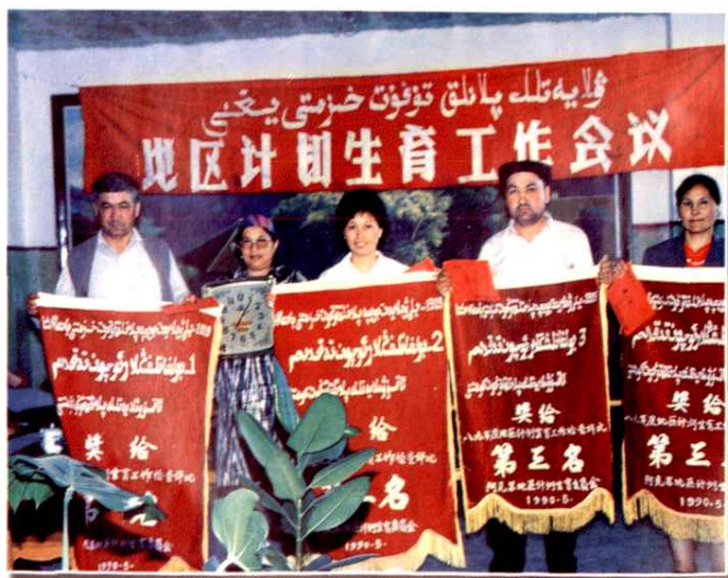
1988年阿克苏地区计划生育工作会