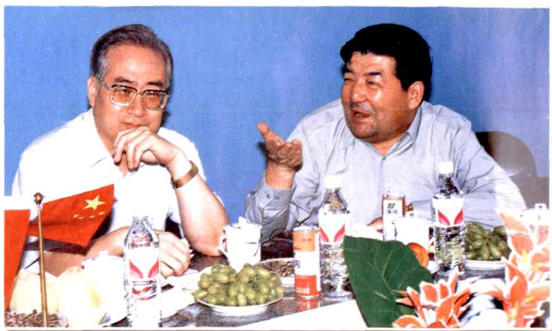
国家计生委主任张维庆（左一）、自治区人民政府副主席买买提明·扎克尔听取阿克苏地区人口与计划生育工作汇报