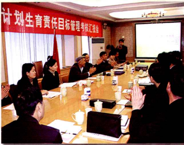
自治区人口与计划生育目标管理考核组听取阿克苏地区的工作汇报