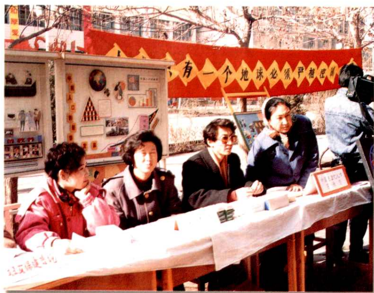
阿克苏地区计生委组织开展宣传咨询服务活动