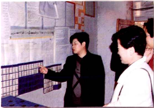
自治区人口与计划生育考核组检查乡村人口与计划生育工作