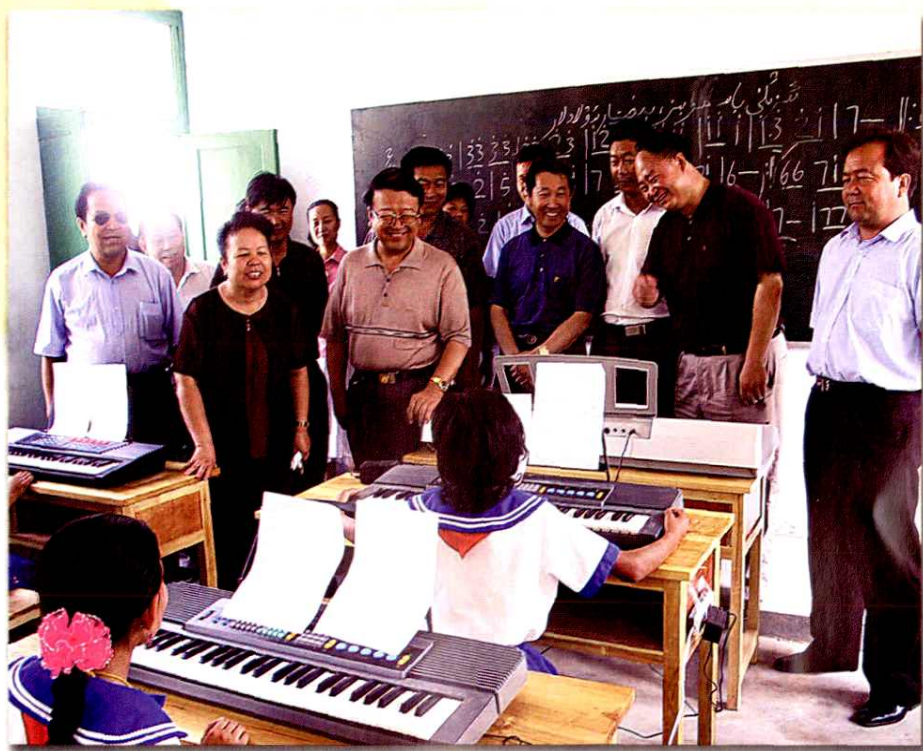
地委、行署领导视察莎吉木汗小学