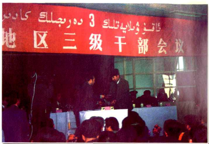
地区召开的三级干部会上， 专员和县（市）长签订《人口 与计划生育目标管理责任书》