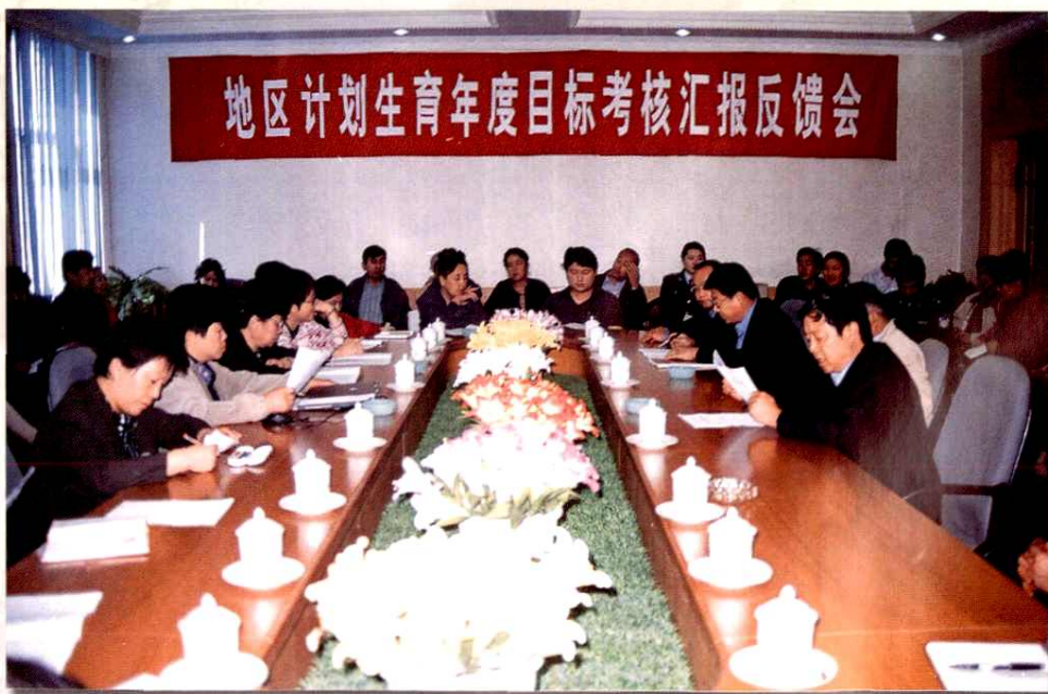
地区对各县（市）人口与计划生育目标完成情况进行考核与反馈