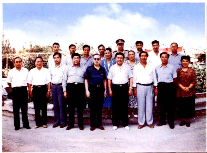
1998年国家计生委主任张维庆（前排中）、自治区党委副书记克尤木·巴吾东（前排右四）、自治区人民政府副主席买买提明·扎克尔（前排左四）等领导视察阿瓦提县英艾日克乡计划生育工作，与县、乡领导合影