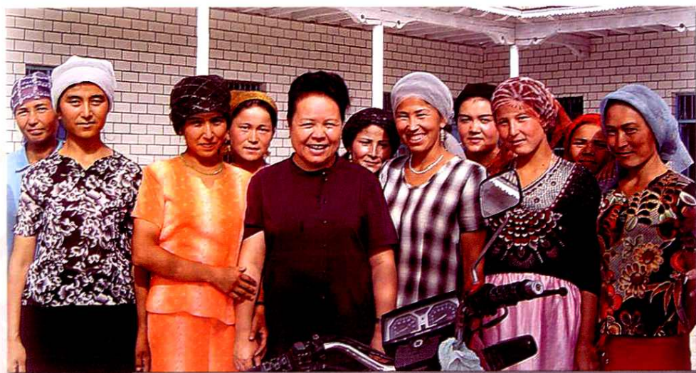
行署副专员迪来赛木·热西提深入基层调研，和育龄妇女在一起