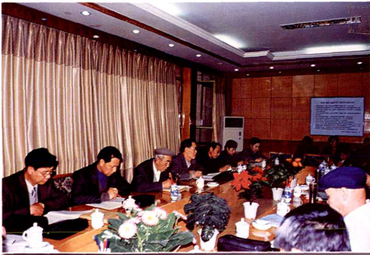
自治区计生委领导到阿克苏地区指导工作