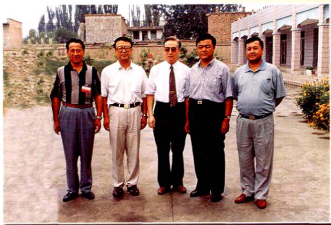
1998年国家计生委主任张维庆（中）视察阿克苏地区时与地区领导合影