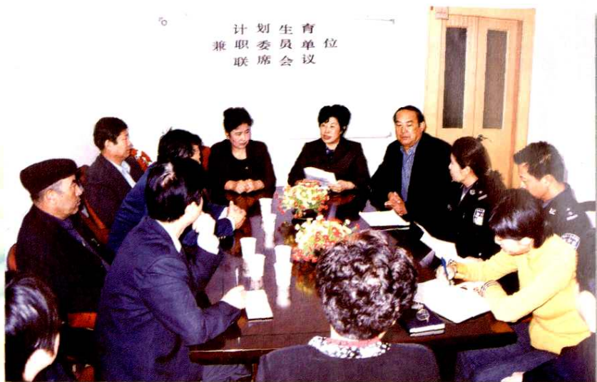
阿克苏地区计划生育工作领导小组定期召开计划生育兼职委员单位联席会议