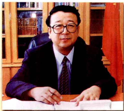
地区计划生育工作领导小组组长 地 委 书 记 侯长安