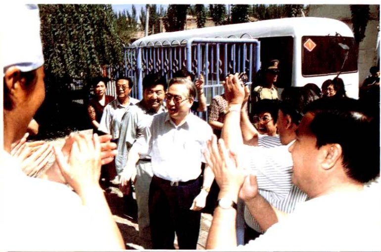
国家计生委主任张维庆（中）视察阿克苏地区计划生育宣传技术指导所