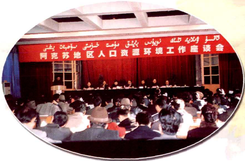
2001年阿克苏地区召开人口资源环境工作座谈会