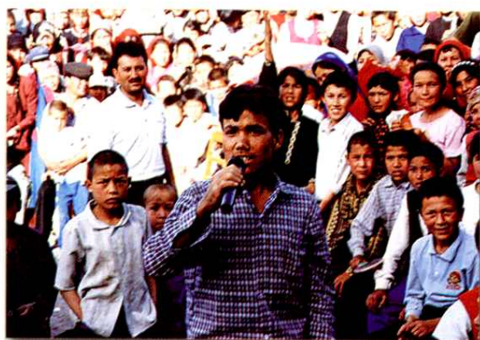
各族青年踊跃参加“婚育新风进万家”有奖知识竞赛活动