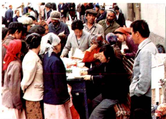
县(市)计生委开展宣传咨询服务活动