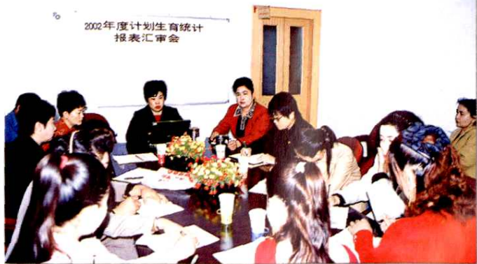
阿克苏地区计生委召开年度统计报表汇审会