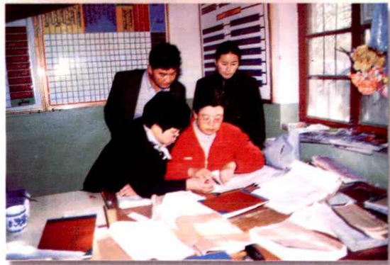
自治区计生委考核地区人口与计划生育工作