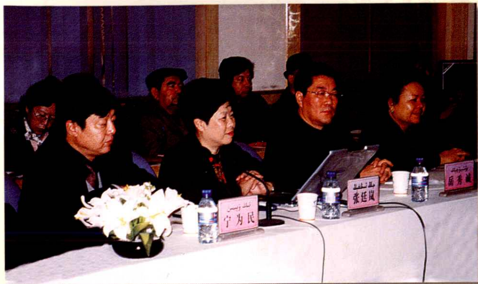
地区人口与计划生育目标管理考核组考核阿克苏市