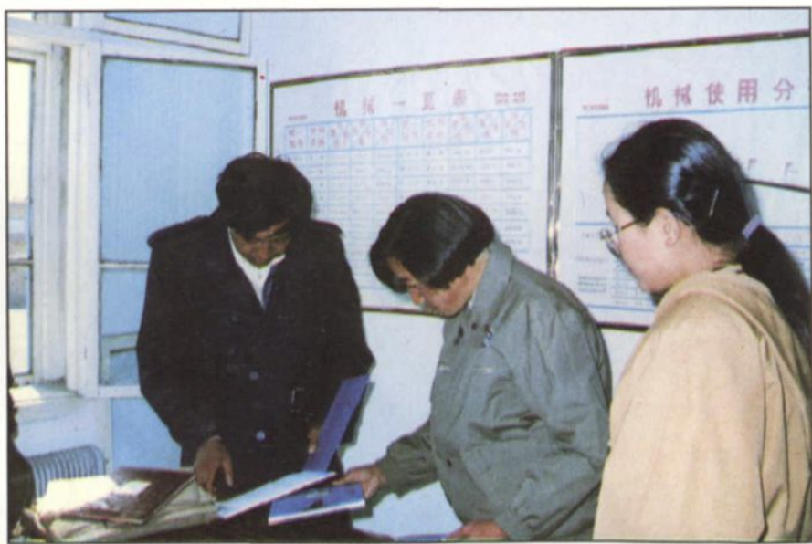
上级领导检查工作