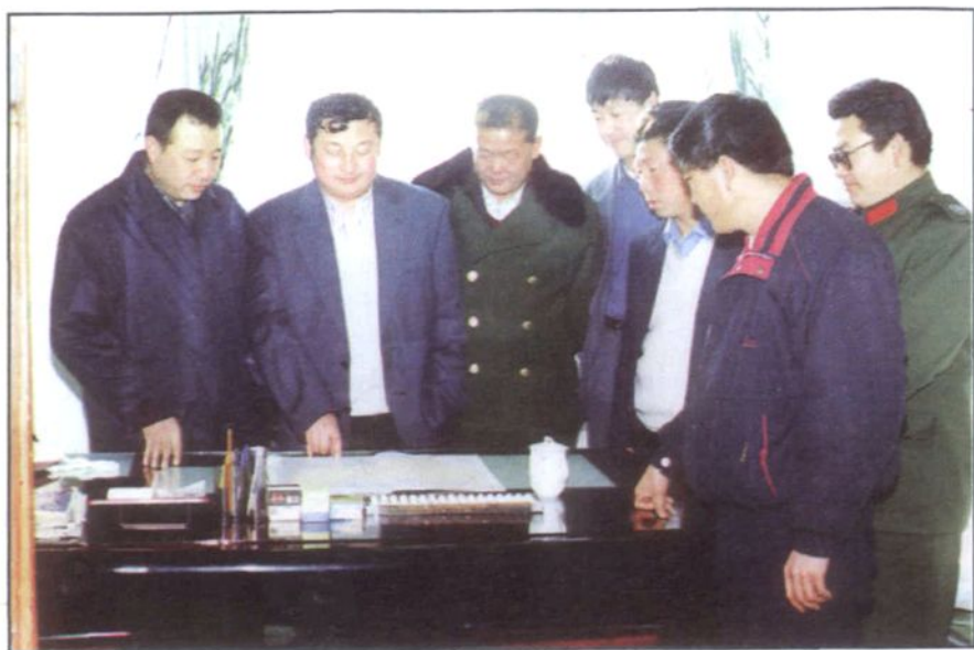
阿旗交通系统领导班子