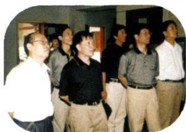
2004年国家工商总局纪检组长石见元在省工商局局长杨正国陪同下在遵义两城区视察工作