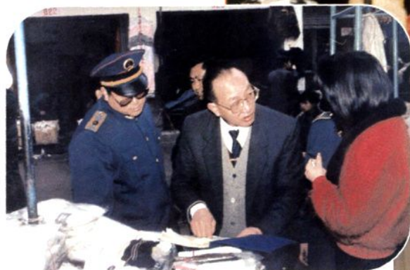
1992年省工商局副局长刘祖刚在遵义检查工作