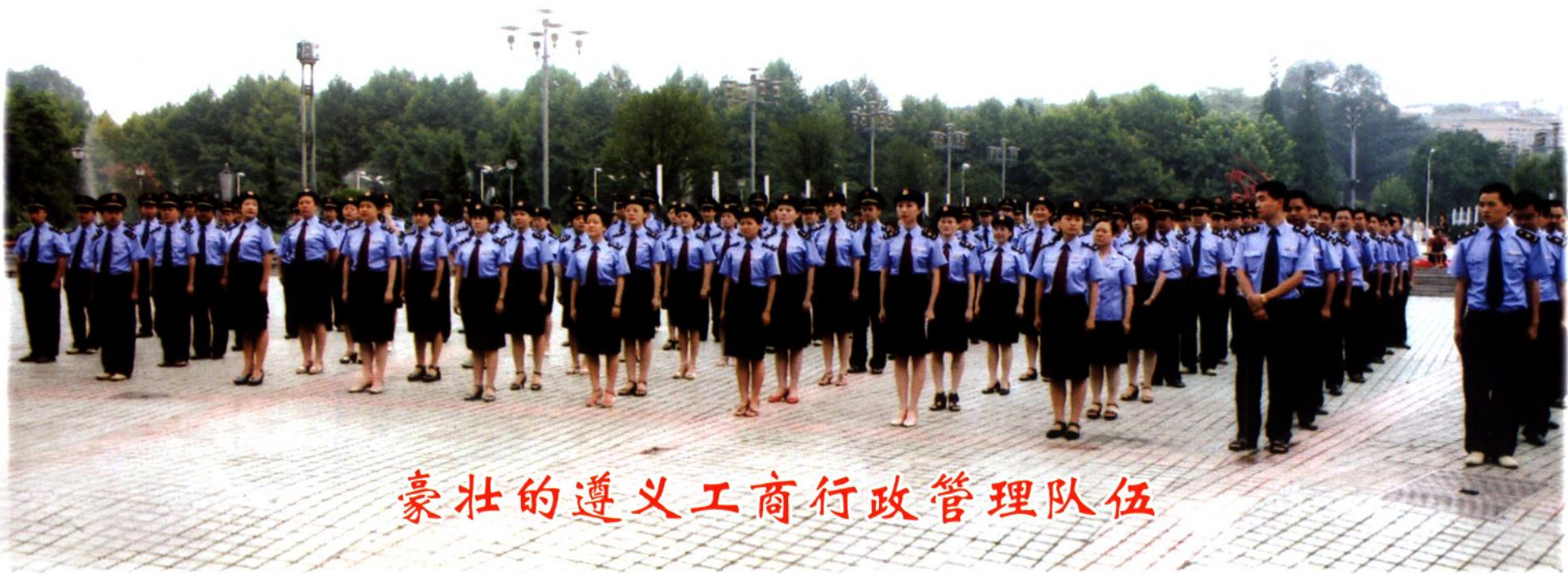
豪壮的遵义工商行政管理队伍