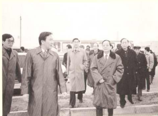
1989年12月24日，中共中央政治局委员、国务院副总理田纪云考察天津开发区。