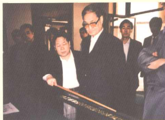
1989年4月29日，国务委员宋平考察天津开发区。