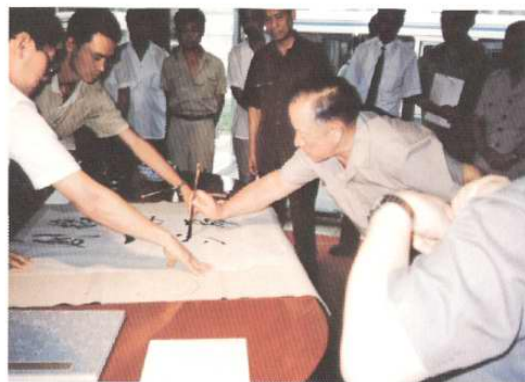
1993年8月16日，中共中央政治局委员、国务委员、国防部长迟浩田考察天津开发区并题词。