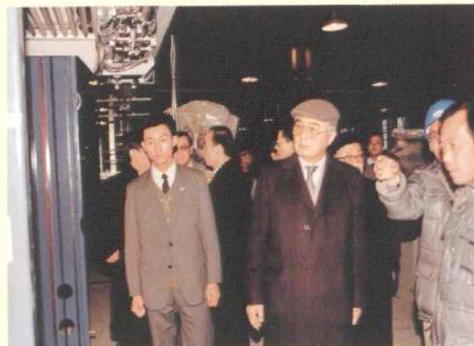
1986年12月2日，全国人大常委会副委员长荣毅仁到天津开发区考察。