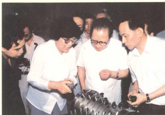
1991年9月10日,中共中央政治局常委乔石考察天津开发区。