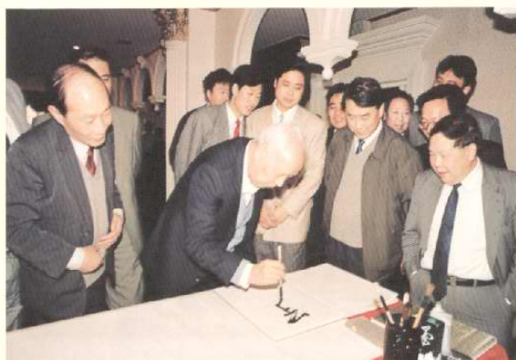
1994年4月9日,原全国人大常委会委员长万里考察天津开发区并题词。