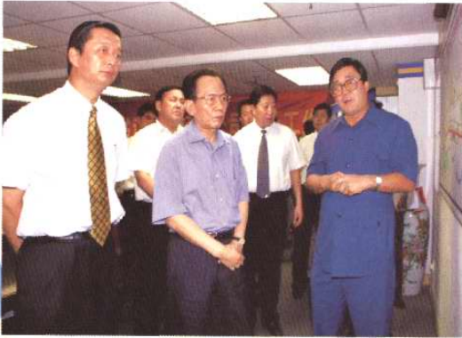
2002年8月20日，天津市委书记张立昌检查指导津滨轻轨工程。