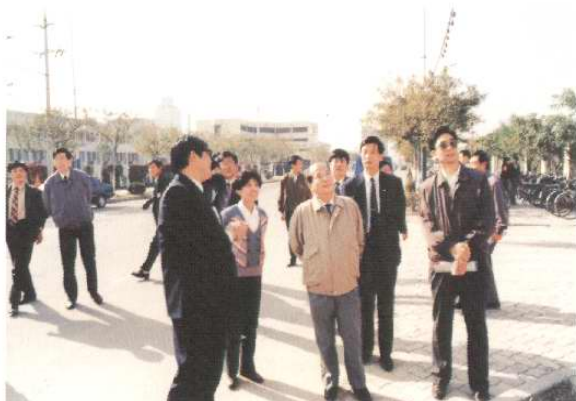
1993年10月21日，中共中央政治局常委、中纪委书记尉健行考察天津开发区。