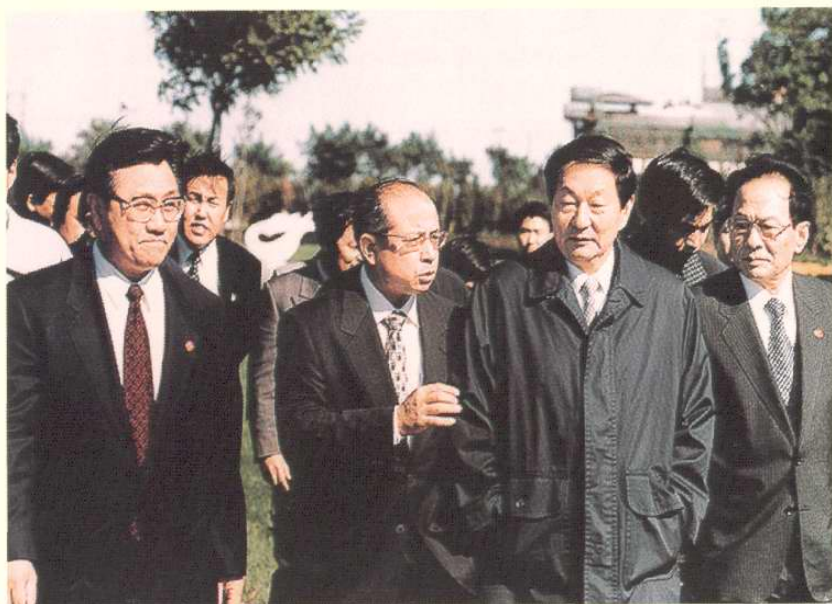
1999年10月16日，中共中央政治局常委、国务院总理朱镕基考察天津开发区。图为参观天津市“十大美景”之一的泰丰公园。