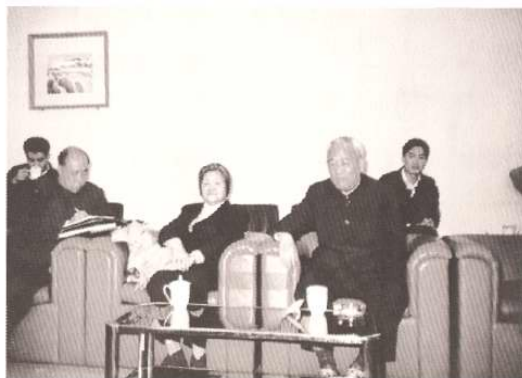
1991年3月16日，中顾委常委余秋里考察天津开发区。