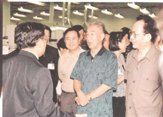
1996年7月23日，国务院副总理邹家华考察天津开发区。