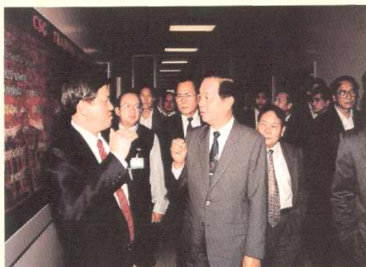
1994年10月14日，国务院副总理、外交部长钱其琛考察天津开发区。