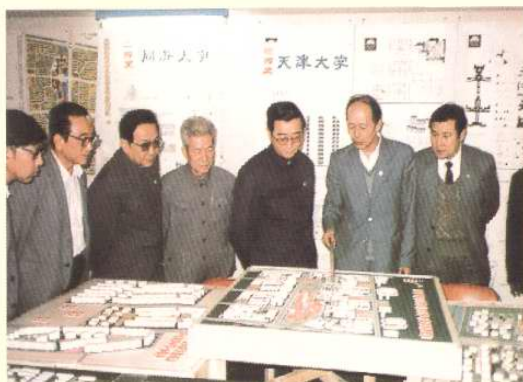
1985年10月13日，中共中央政治局委员、书记处书记胡启立考察天津开发区。