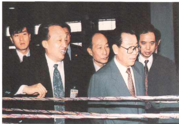
1994年11月10日，中共中央政治局常委、全国政协主席李瑞环考察天津开发区。