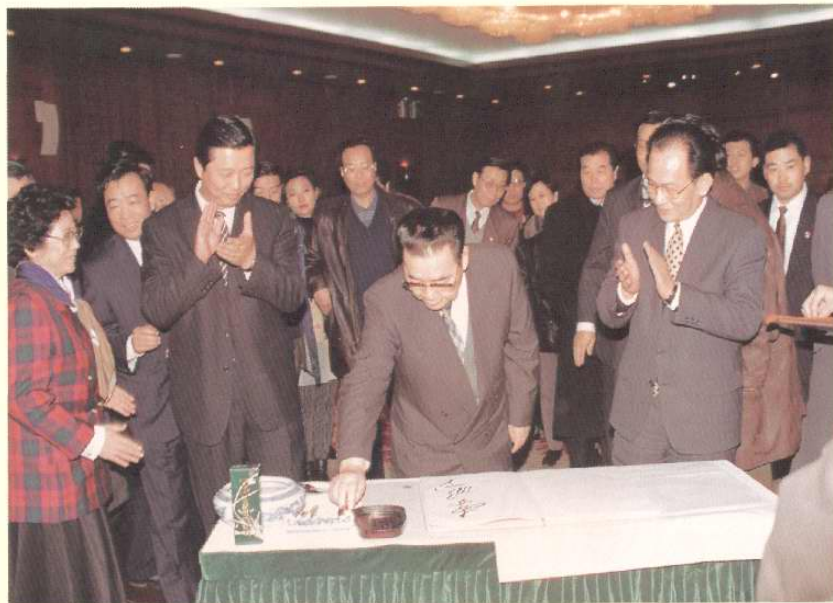
1997年12月20日，中共中央政治局常委、国务院总理李鹏考察天津开发区并题词。