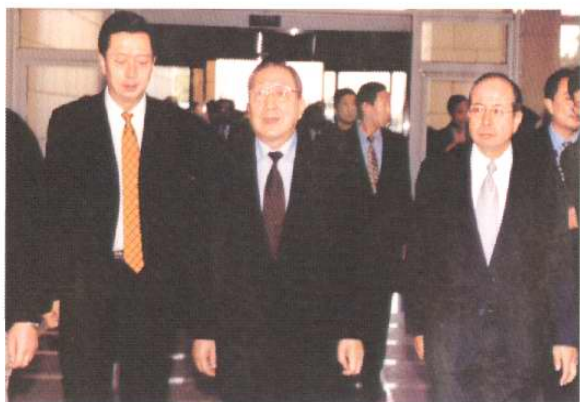
2002年10月13日，中共中央政治局常委、国务院副总理李岚清考察天津开发区。