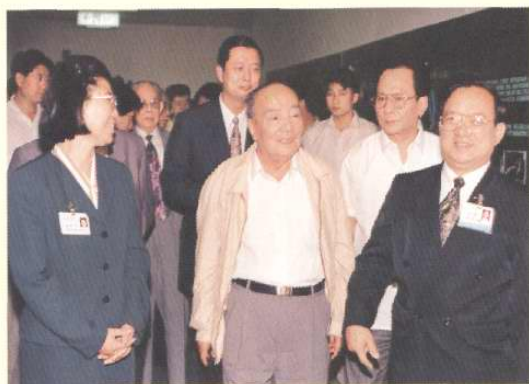
1996年5月27日，原国家主席杨尚昆考察天津开发区。