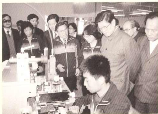
1991年4月18日，中共中央政治局委员、国家教委主任李铁映考察天津开发区。