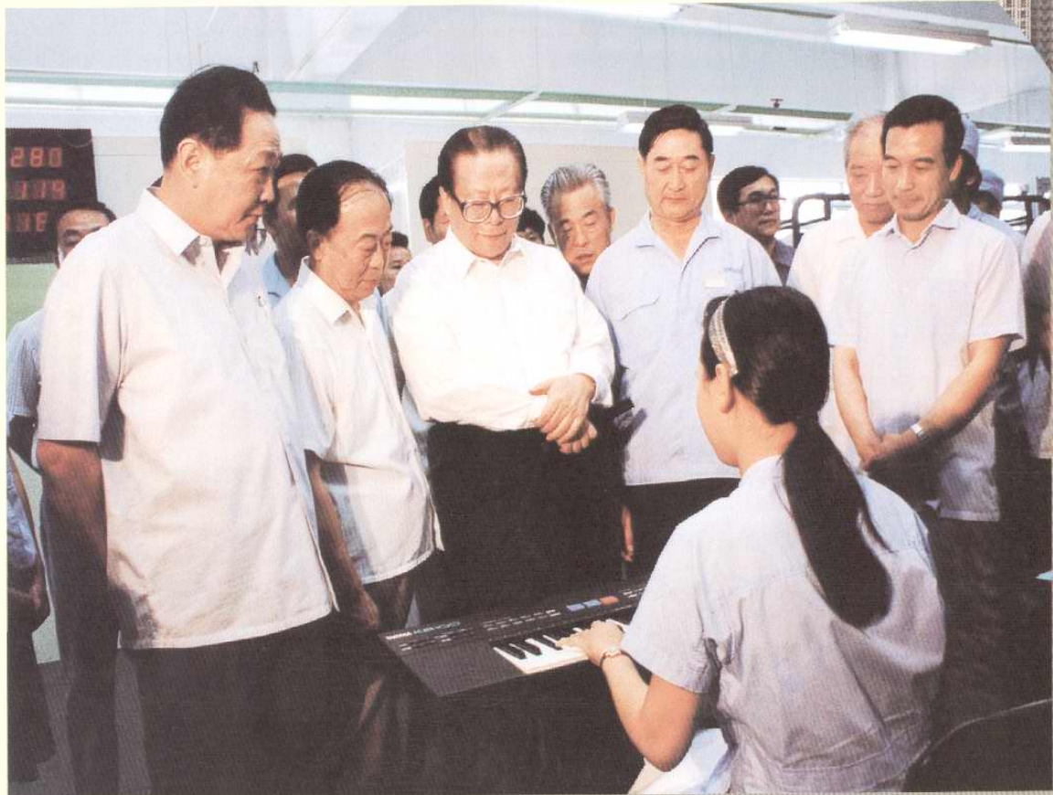
1991年7月21日，中共中央总书记、国家主席江泽民，中央书记处候补书记兼中央办公厅主任温家宝（陪同）考察天津开发区。