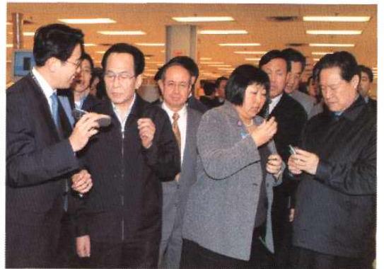
2003年10月27日，中共中央政治局委员、书记处书记、公安部部长周永康考察天津开发区。