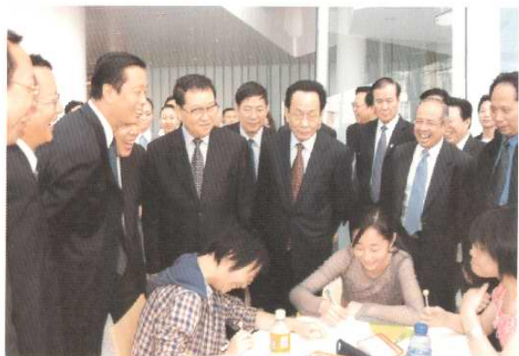
2004年5月22日，中共中央政治局常委李长春考察天津开发区。