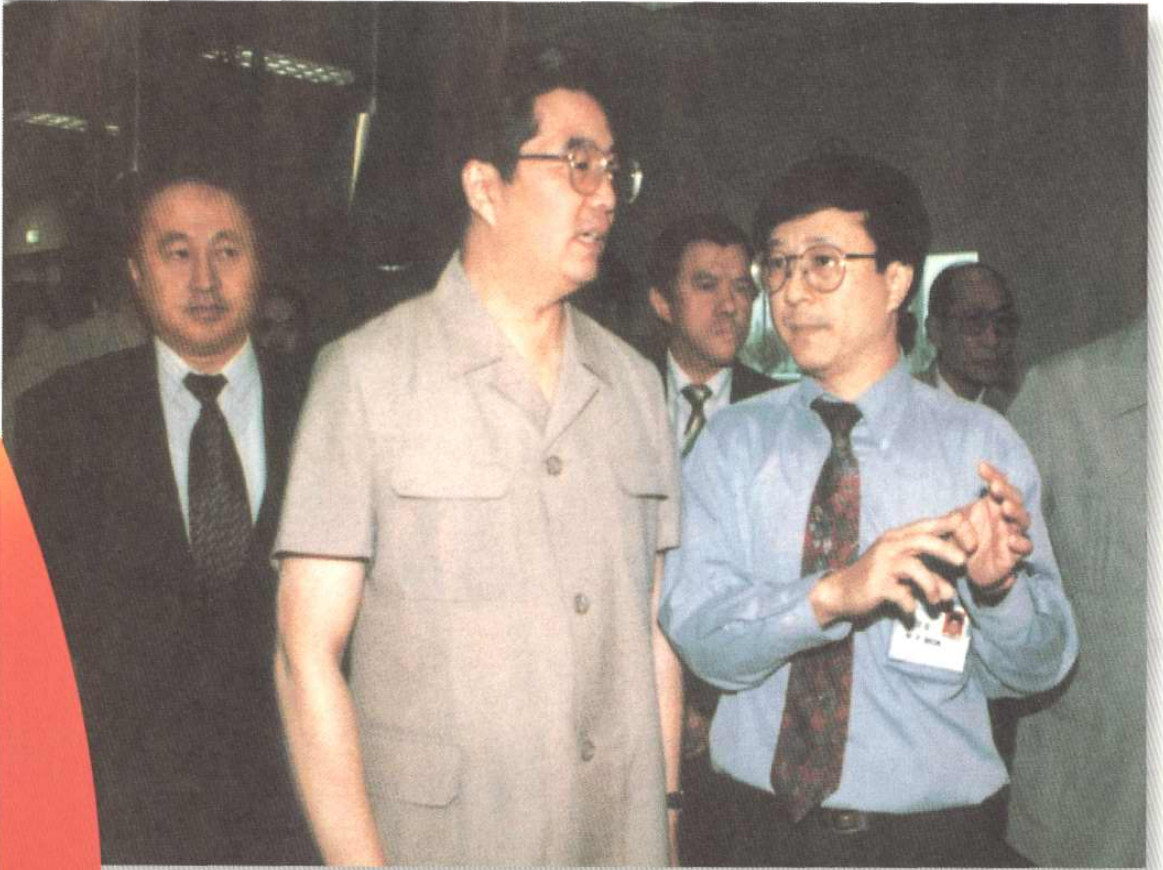
1994年6月23日，中共中央政治局常委、书记处书记胡锦涛考察天津开发区。