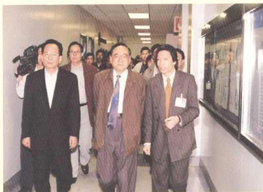
1997年10月15日，中共中央政治局委员、书记处书记丁关根考察天津开发区。