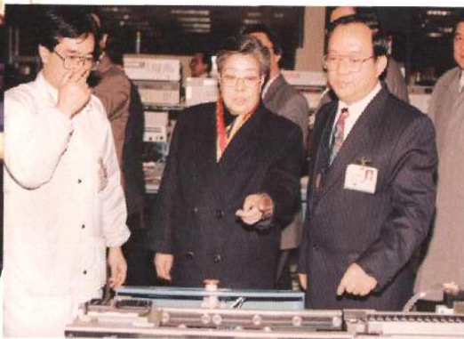
2001年12月25日，中共中央政治局候补委员、国务委员吴仪考察天津开发区。