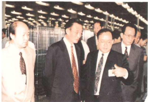
1996年9月12日，中共中央政治局委员，国务院副总理吴邦国考察天津开发区。