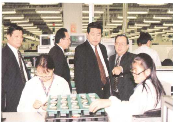
1998年10月24日，中共中央政治局委员，北京市委书记贾庆林考察天津开发区。