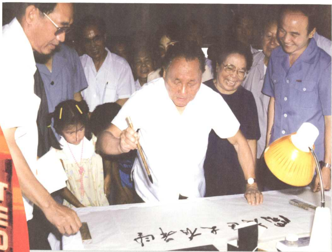
1986年8月21日，邓小平考察天津开发区并题词“开发区大有希望”。