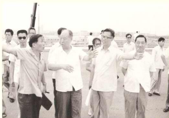
1984年7月1日,全国人大常委会委员长彭真考察天津开发区。图为询问开发区前期准备工作情况。