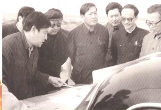
1984年11月9日，中共中央政治局委员、天津市委书记倪志福考察天津开发区。