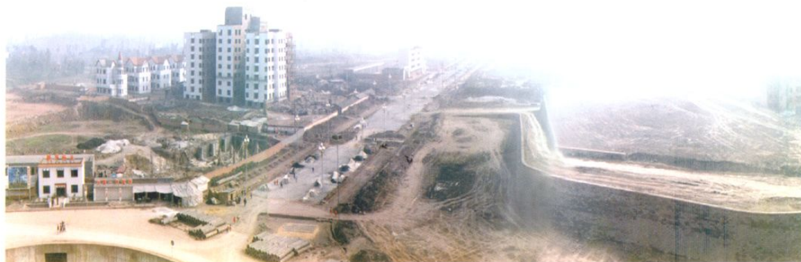
热火朝天的汇龙大道建设全景