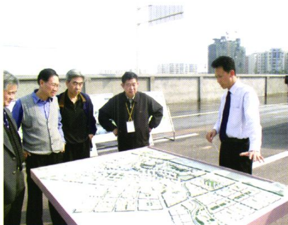
开发区城市规划得到国内专家的高度评价

CHONGQING YONGGHUAN ECONOMIC & TECHNOLOGICAL DEVELOPMENT ZONE