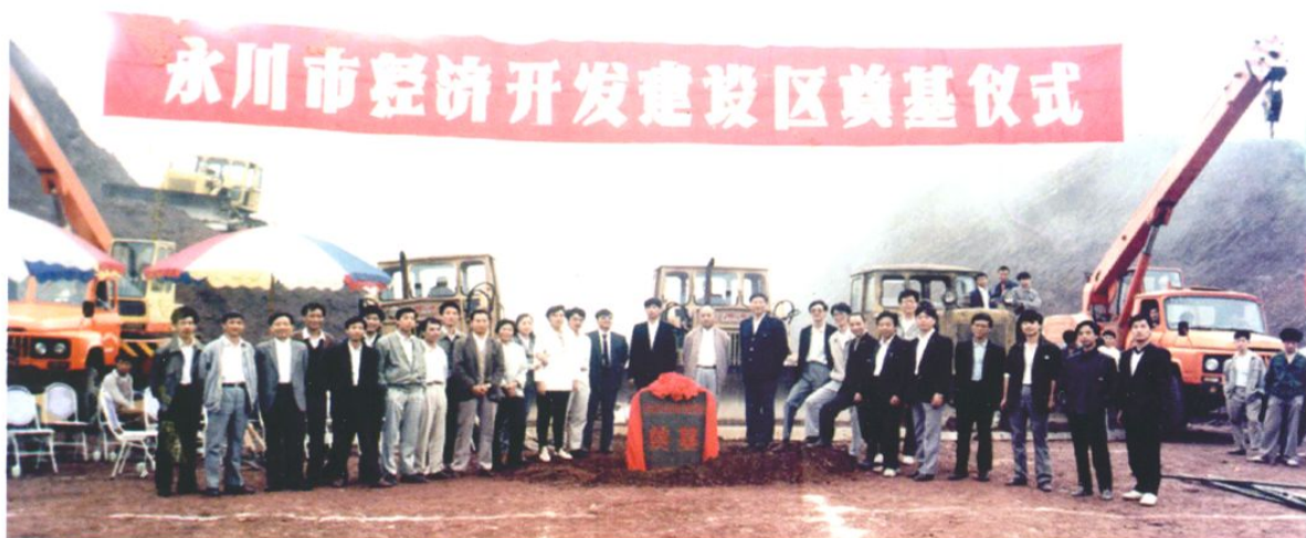
永川开发区的第一批建设者们。

CHONGQING YONGGHUAN ECONOMIC & TECHNOLOGICAL DEVELOPMENT ZONE