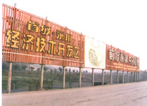
1993年3月，永川开发区经四川省批准成为省级开发区。