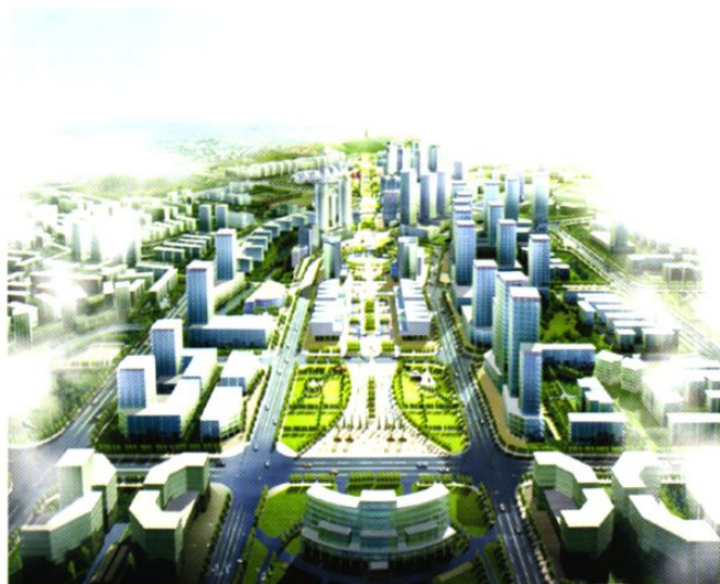
城市中轴线规划图