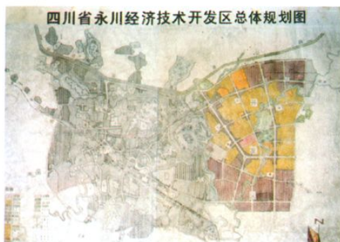
当时的永川开发区总体规划图