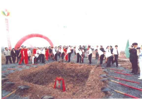
红河小区建设开工