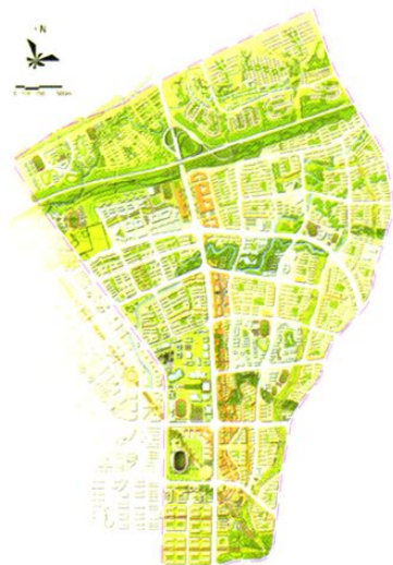
6.27平方公里拓展区总平面图