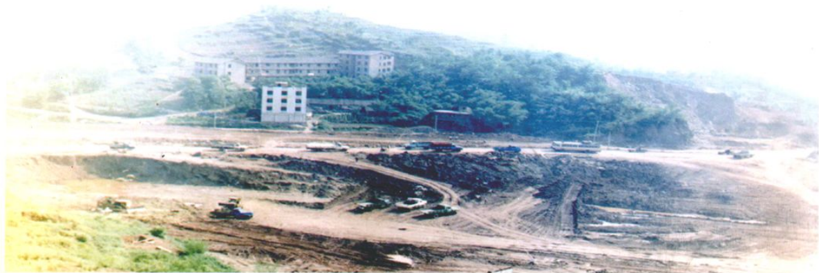
开发区成立后，现高速路口、一转盘片区成为当时开发区建设的主战场。