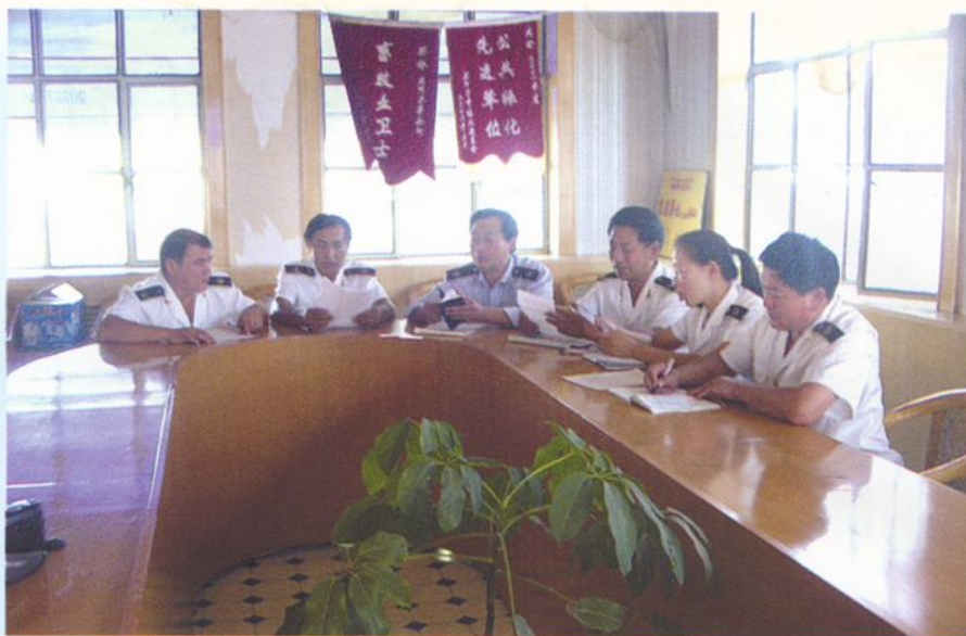
加强政治业务学习 提高整体队伍素质