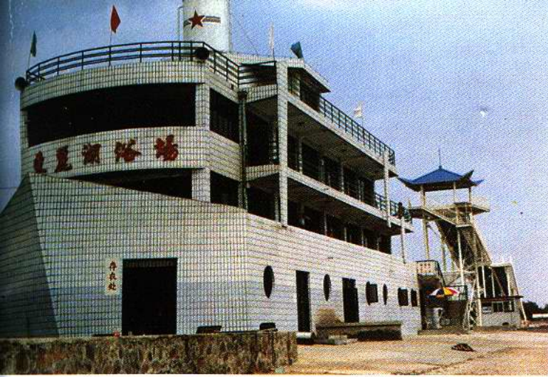
东丽湖温泉度假村船形楼