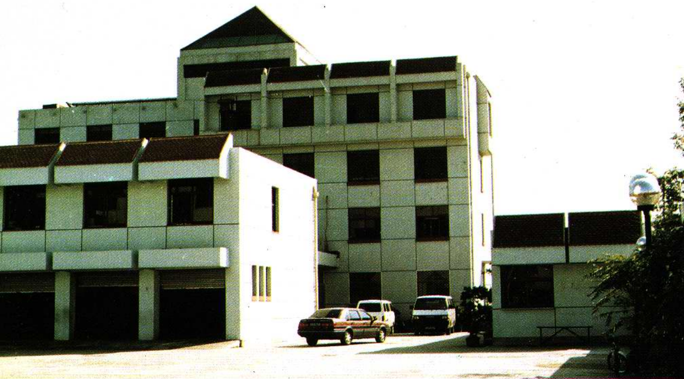
东丽区房管局办公楼