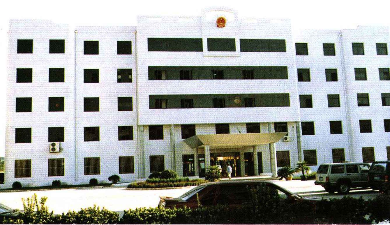
东丽区人民政府办公楼