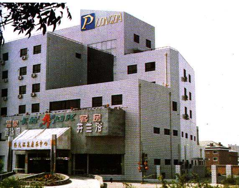
隆达温泉康乐中心