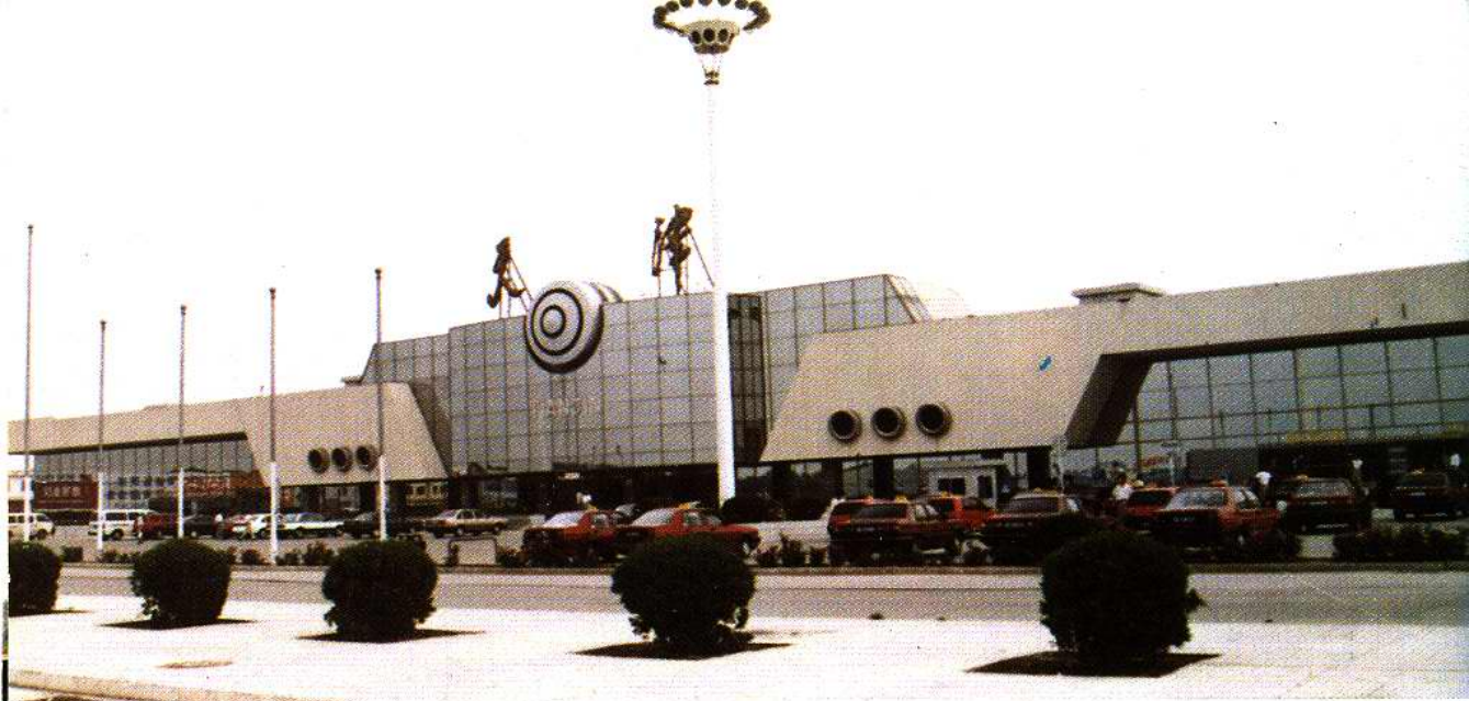
天津滨海国际机场候机大楼