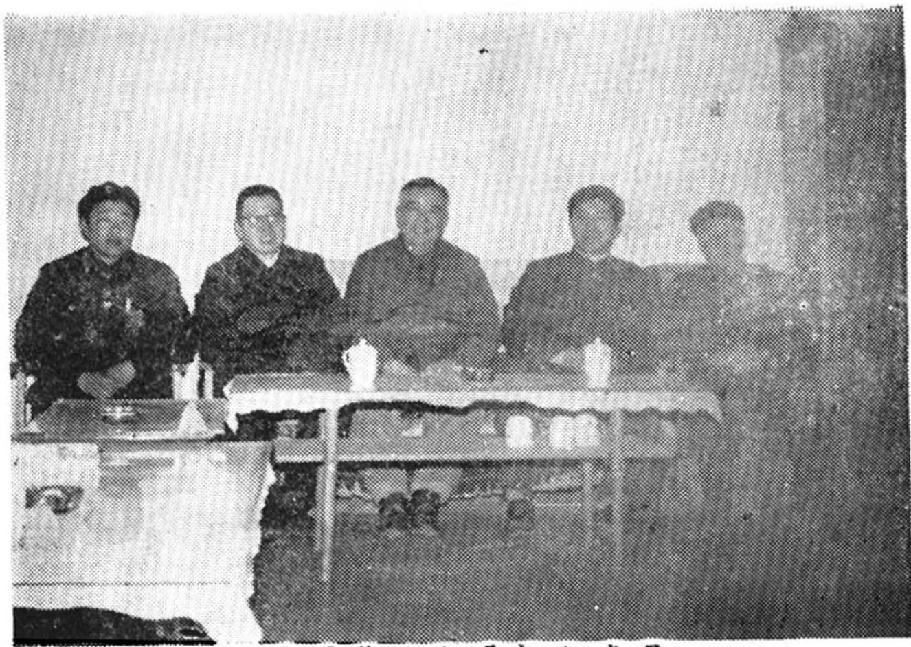
公司修志领导小组成员