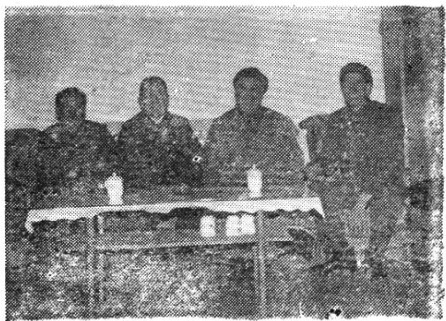
一九八三年调整前的公司部分经理领导成员