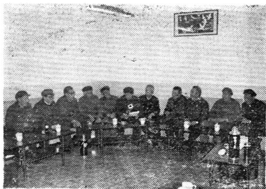
老干部座谈会为编志提供资料