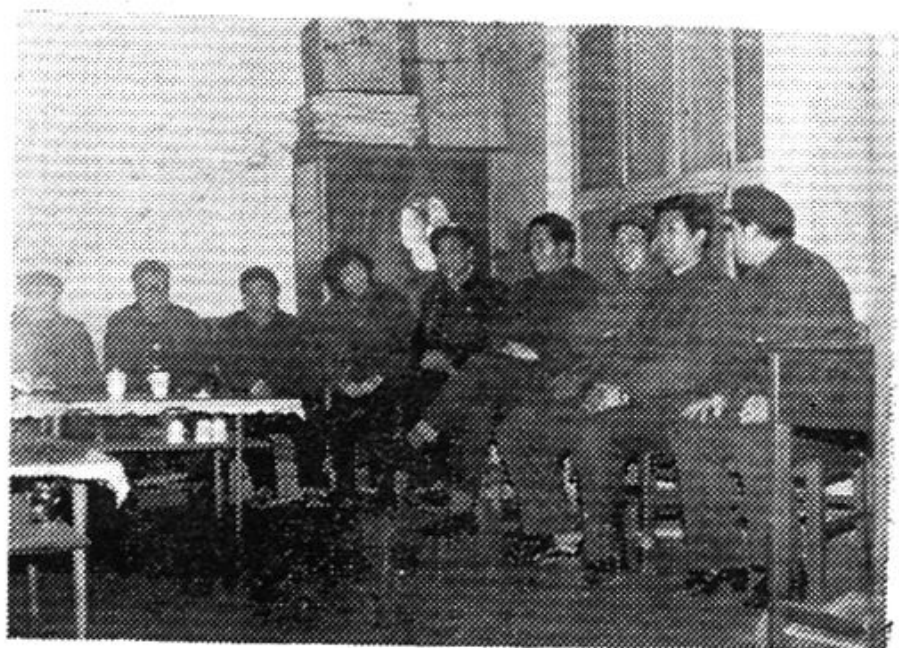
公司领导听取编志情况汇报