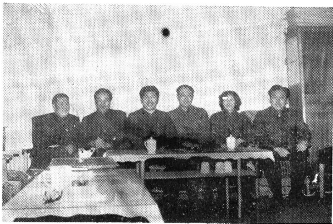
現任公司經理班子成員