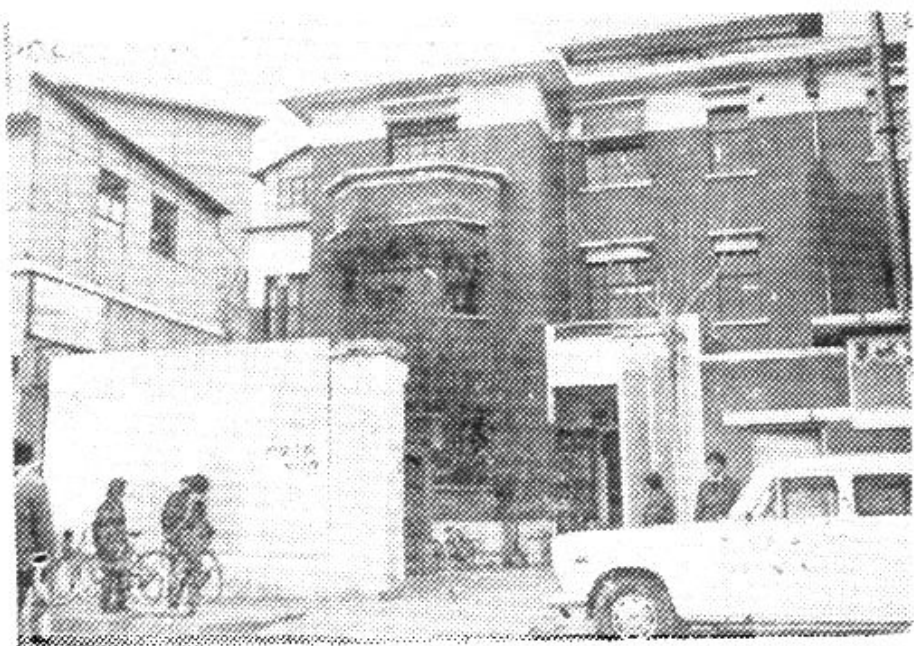
一九六二年至一九六六年公司办公楼—天津市建设路131号