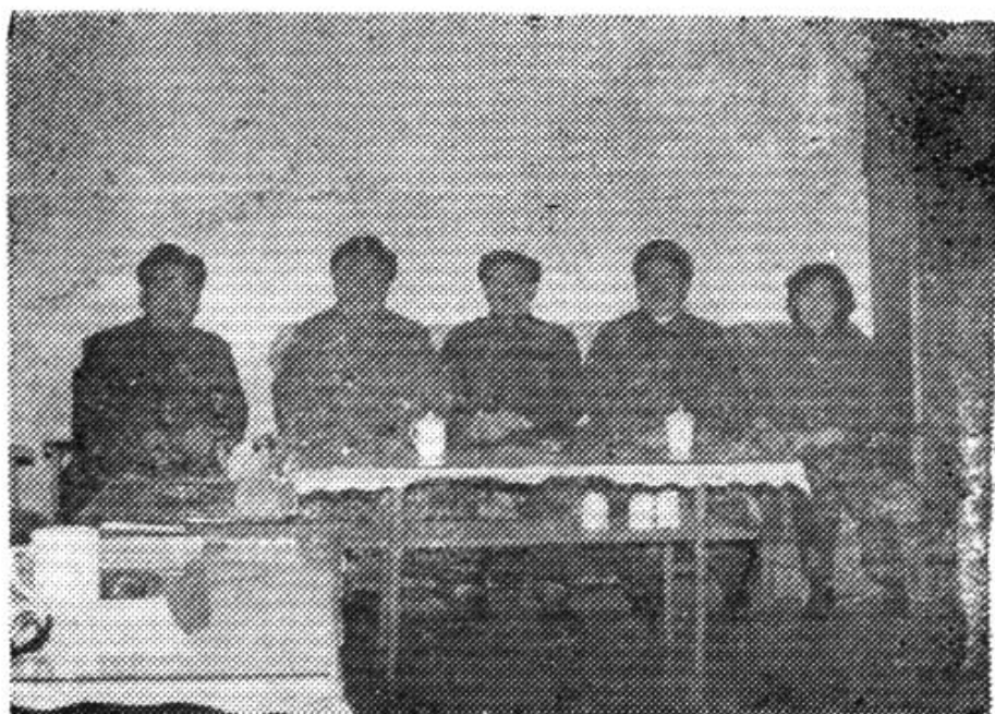
一九八三年调整后的公司经理领导成员