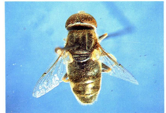
56. 黑绿斑目蚜蝇 Eristalinus aeneus ♂