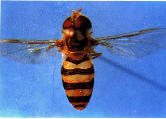
27. 宽腹后蚜蝇 Metasyrphus confrater ♀