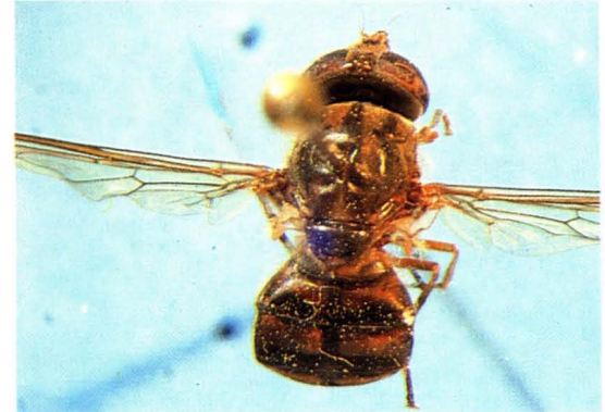
48. 短喙喙额蚜蝇 Rhingia laevigata ♀