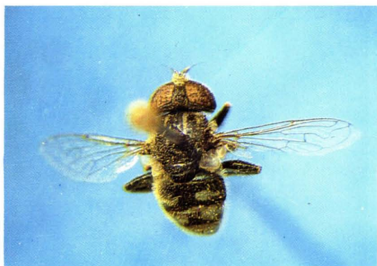
57. 暗纹斑目蚜蝇 Eristalinus sepulchralis ♂