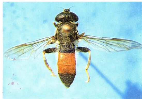
64. 黄颜齿转蚜蝇 Xylota ignava ♀