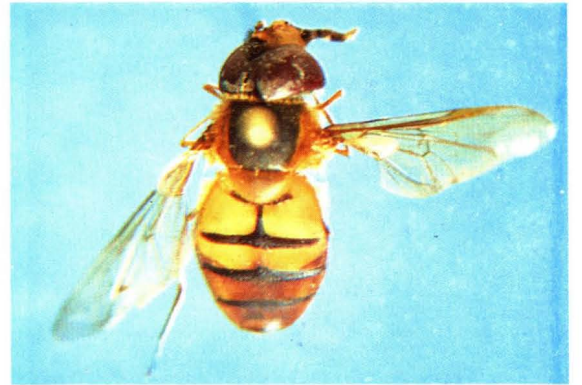
20. 黑额狭口蚜蝇 Asarkina porcina ♂