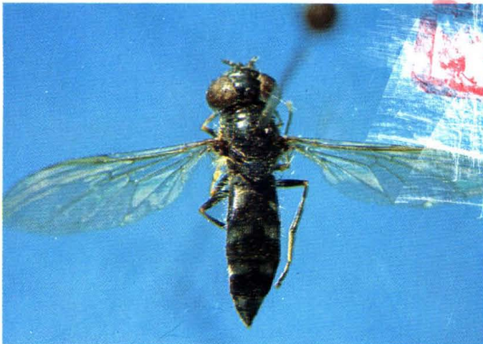
7. 结毛宽跗蚜蝇 Platycheirus albimanus ♀