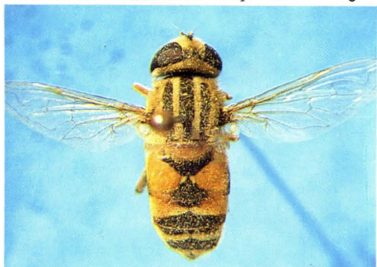
61. 续斑黄条蚜蝇 Helophilus continua ♀