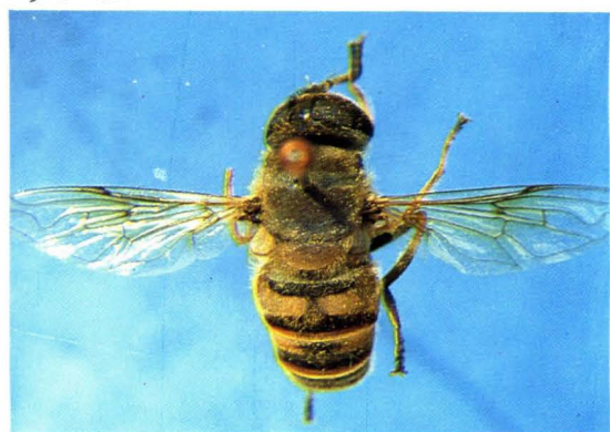
60. 灰被管蚜蝇 Eristalis cerealis ♀