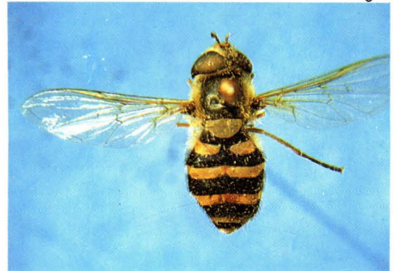
40. 黄腿食蚜蝇 Syrphus ribesii ♀