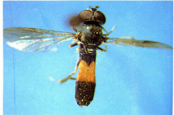
16. 平腹派蚜蝇 Pvrophaena platygastra ♂