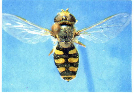
28. 大灰后蚜蝇 Metasyrphus corollae ♀