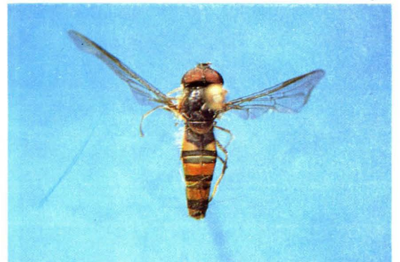
24. 裂带黑带蚜蝇 Episyrphus cretensis ♂