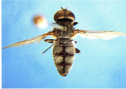
45. 天祝短腹蚜蝇 Brachyopa tianzuensis ♂