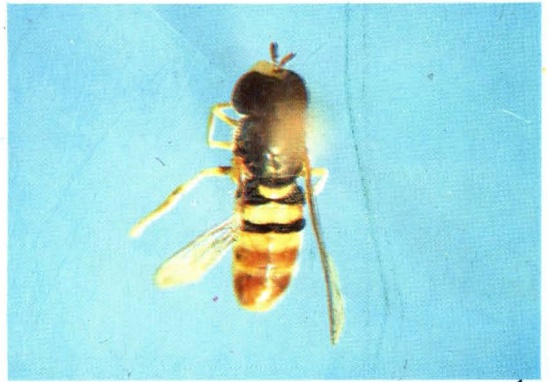
2. 矩舌小蚜蝇 Paragus compeditus ♂