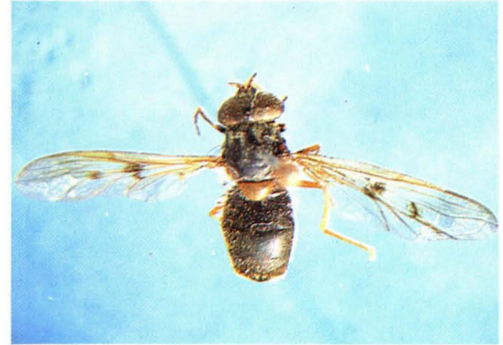
46. 黑额鬃盾蚜蝇 Ferdinandea nigrifrons ♀