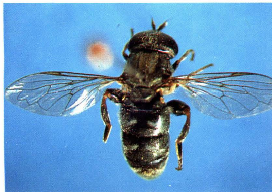
55. 疣腿平颜蚜蝇 Eumerus tuberculatus ♂