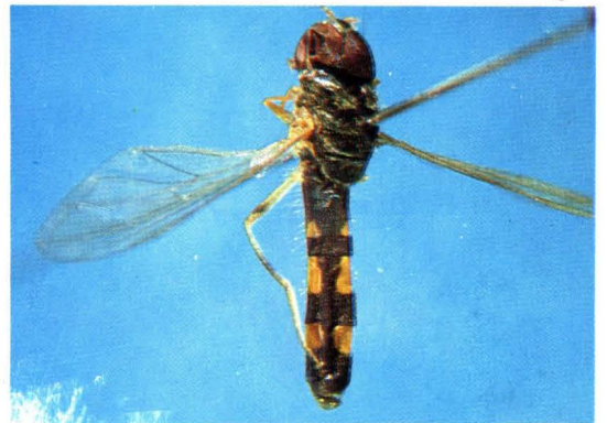
6. 斜斑墨蚜蝇 Melanostoma scalare ♂