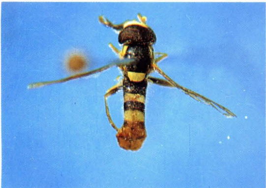
37. 宽尾细腹蚜蝇 Sphaerophoria rueppellii ♀