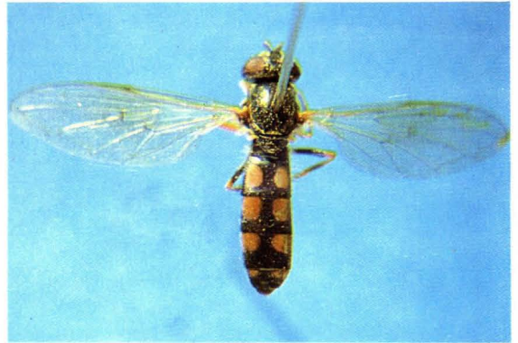
10. 短斑宽跗蚜蝇 Platycheirus clypeatus ♀