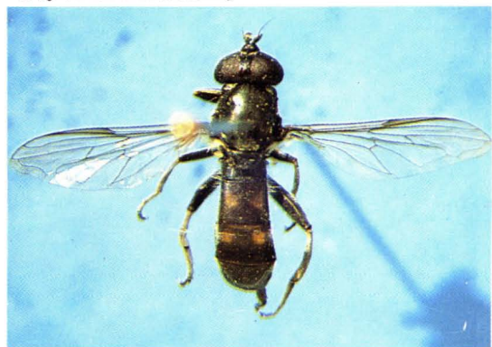
63. 黑颜齿转蚜蝇 Xylota florum ♀