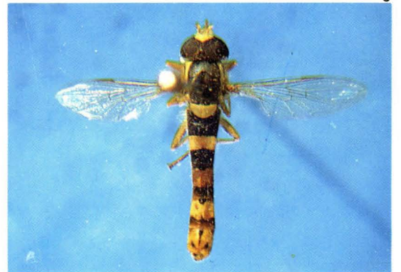
38. 短翅细腹蚜蝇 Sphaerophoria scripta ♂