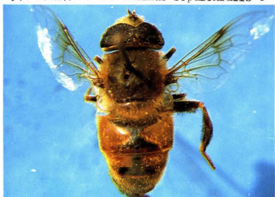
59. 鼠尾管蚜蝇 Eristalis campestris ♀