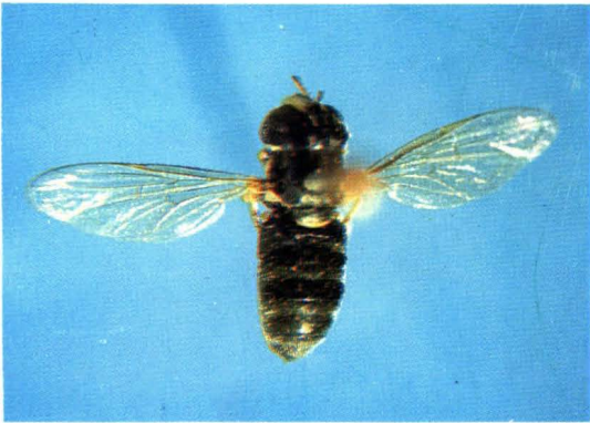
1. 白额小蚜蝇 Paragus albifrons ♀