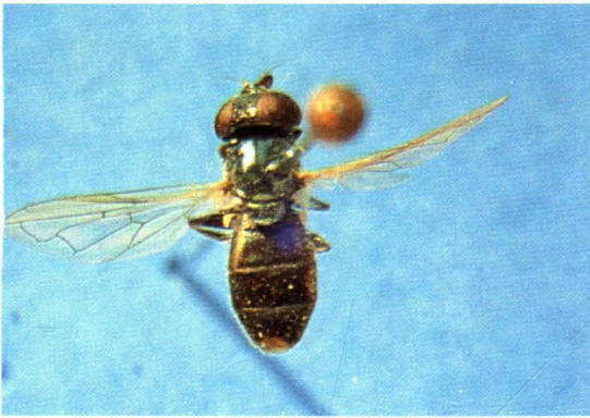
49. 淡跗亮腹蚜蝇 Liogaster splendida ♀