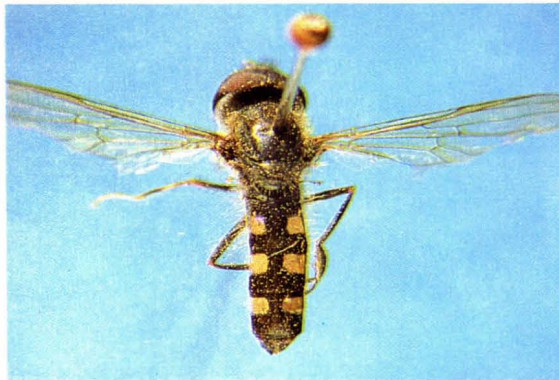
13. 卵圆宽跗蚜蝇 Platycheirus ovalis ♂