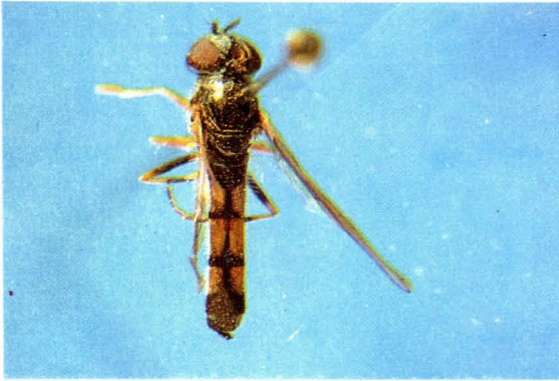
9. 狭腹宽跗蚜蝇 Platycheirus angustatus ♂