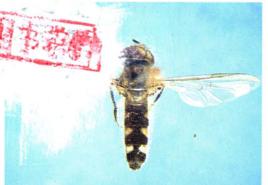
8. 卷毛宽跗蚜蝇 Platycheirus ambiguus ♂