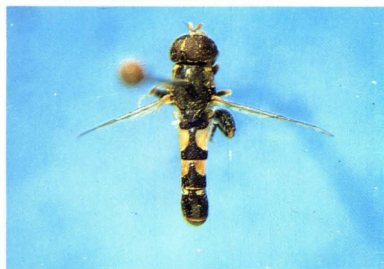
62. 棕环瘦蚜蝇 Syritta pipiens ♂