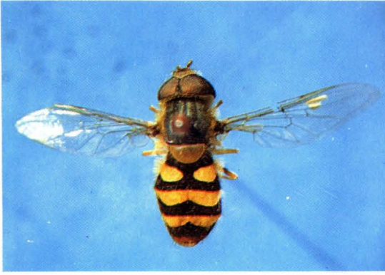
41. 黑腿食蚜蝇 Syrphus vitripennis ♂