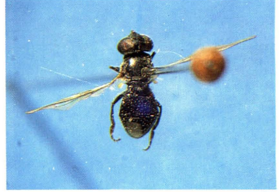
44. 长翅寡节蚜蝇 Triglyphus primus ♀