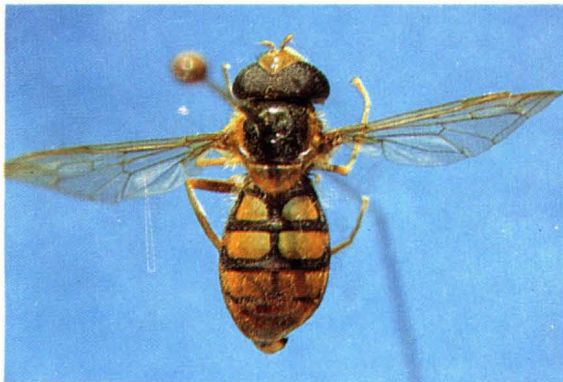
21. 日本弯脉蚜蝇 Asiodidea nikkonensis ♀