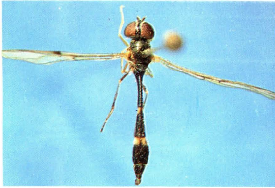
17. 短额巴蚜蝇 Baccha elongata ♀