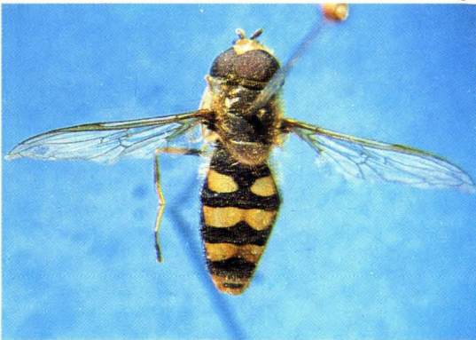
31. 凹带后蚜蝇 Metasyrphus nitens ♂