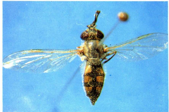
12. 凸颜宽跗蚜蝇 Platycheirus manicatus ♀