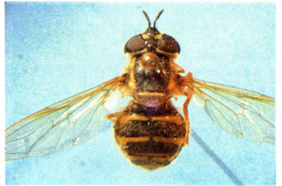
18. 宽腹长角蚜蝇 Chrysotoxum cautum ♀