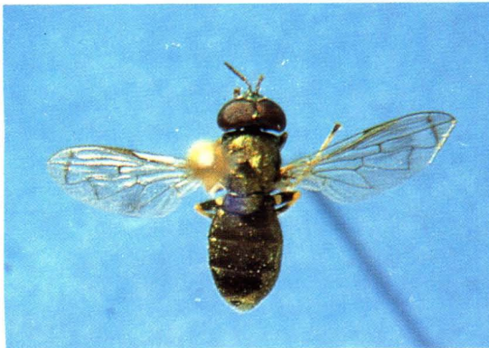
51. 细角闪光蚜蝇 Orthonevra elegans ♂