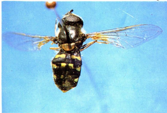
23. 角纹达蚜蝇 Dasysyrphus postclaviger ♀