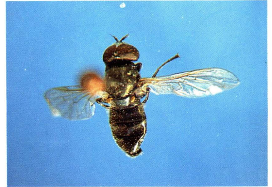
52. 暗腹闪光蚜蝇 Orthonevra nobilis ♂