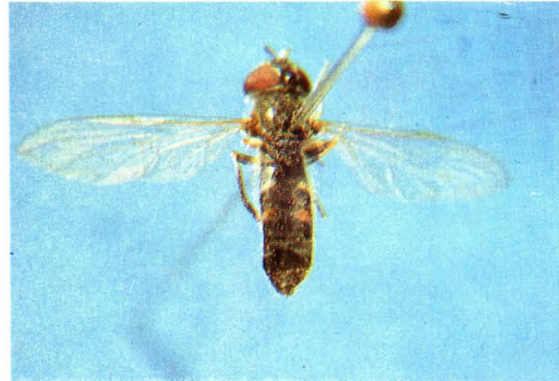
15. 斜斑宽跗蚜蝇 Platycheirus scutatus ♀