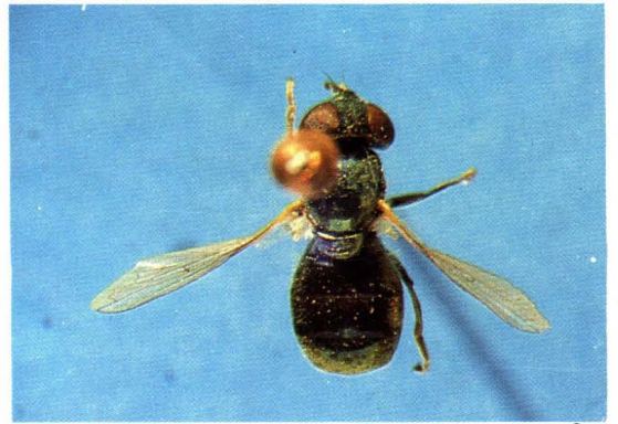
50. 紫腹闪光蚜蝇 Orthonevra aurichalcea ♀