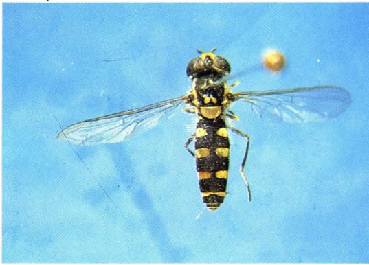
25. 斑盾美蓝蚜蝇 Melangyna guttata ♀