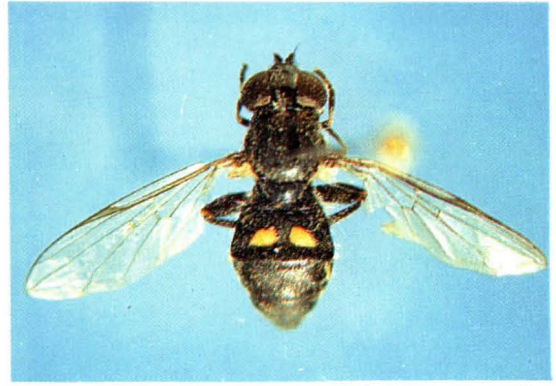
42. 锐角平额蚜蝇 Pipiza noctiluca ♀