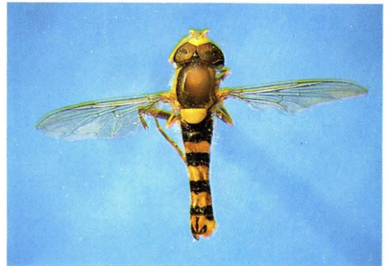
36. 暗跗细腹蚜蝇 Sphaerophoria philanthus ♂