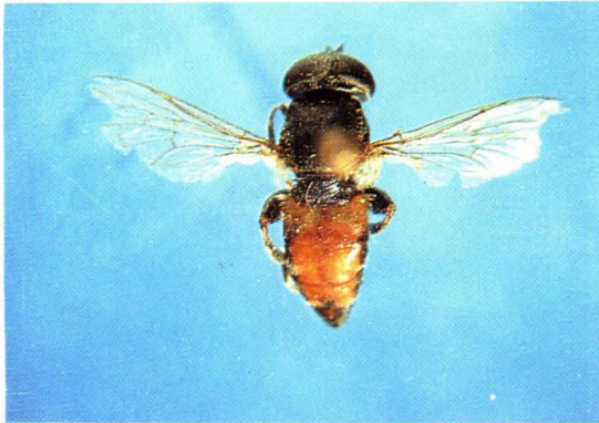
53. 红腹平颜蚜蝇 Eumerus sabulorum ♀