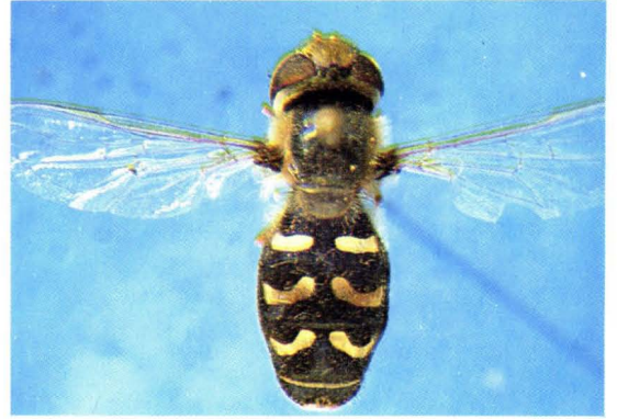
34. 斜斑鼓额蚜蝇 Scaeva pyrastris ♀