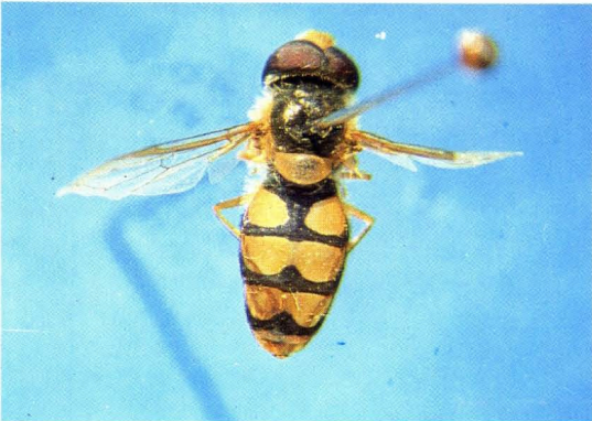
29. 宽带后蚜蝇 Metasyrphus latifasciatus ♂