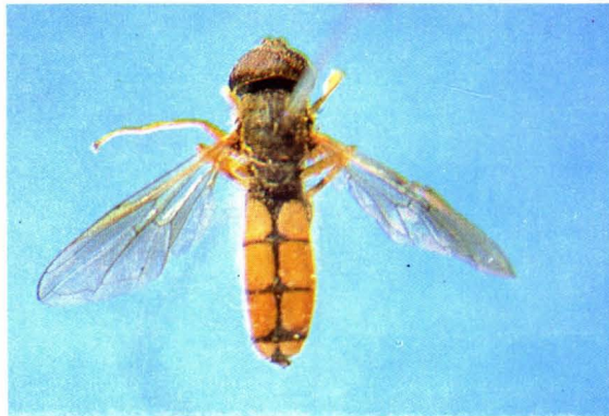
11. 黄腹宽跗蚜蝇 Platycheirus fulviventris ♂