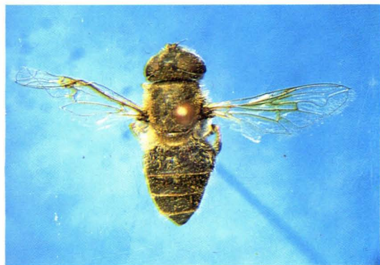
58. 棕边管蚜蝇 Eristalis arbustorum ♀