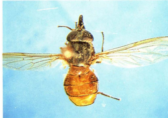
47. 黑边喙额蚜蝇 Rhingia campestris ♀