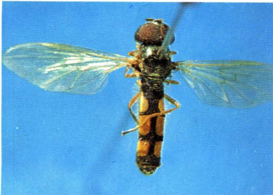
5. 斜斑墨蚜蝇 Melanostoma mellinum ♂