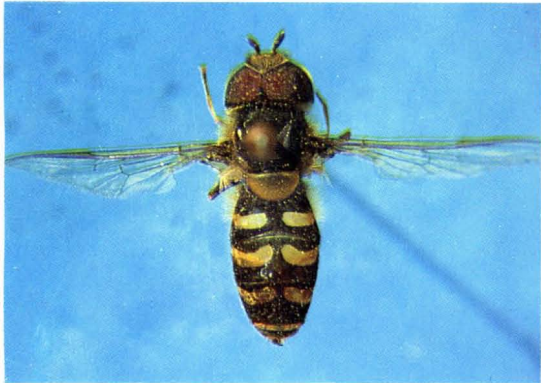
35. 月斑鼓额蚜蝇 Scaeva selenitica ♂