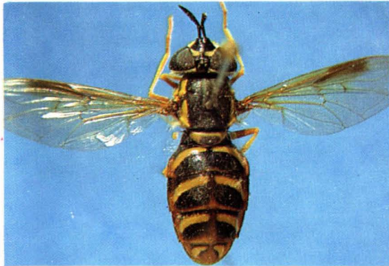
19. 八斑长角蚜蝇 Chrysotoxum octomaculata ♀