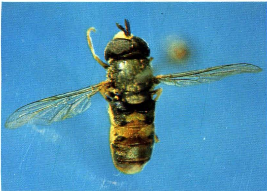
3. 古浪小蚜蝇 Paragus gulangensis ♂