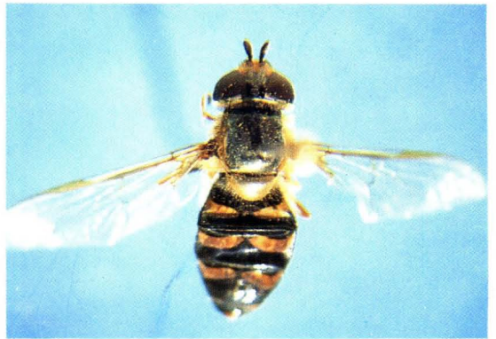
30. 月斑后蚜蝇 Metasyrphus luniger ♀