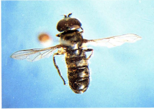
43. 直针额斜蚜蝇 Pipizella varipes ♂