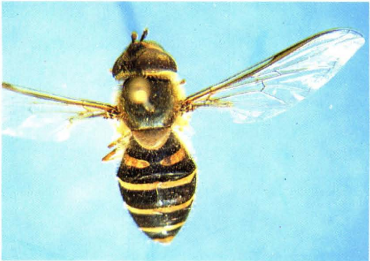
39. 野食蚜蝇 Syrphus torvus ♀