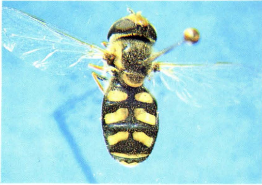
33. 大班鼓额蚜蝇 Scaeva albomaculata ♀