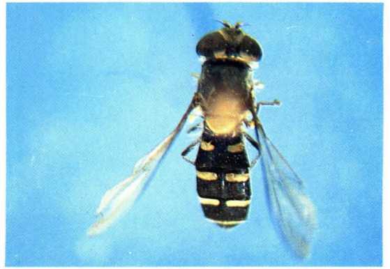
26. 暗盾美蓝蚜蝇 Melangyna lasiophthalma ♀