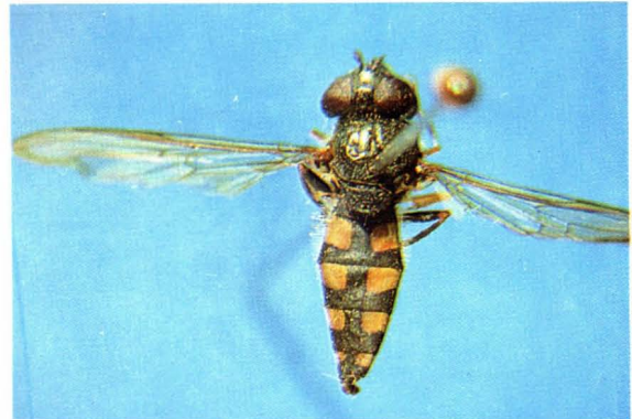
14. 菱斑宽跗蚜蝇 Platycheirus peltatus ♀