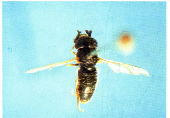
4. 拟刻点小蚜蝇 Paragus haemorrhous ♂