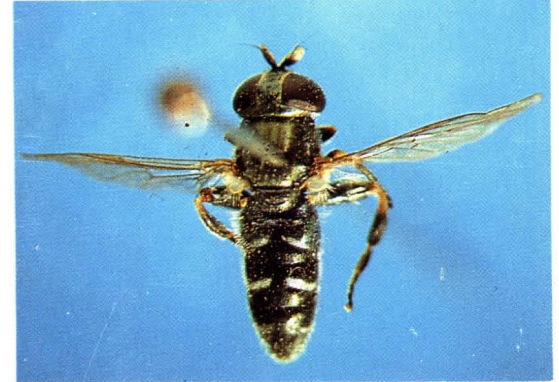
54. 洋葱平颜蚜蝇 Eumerus strigatus ♀