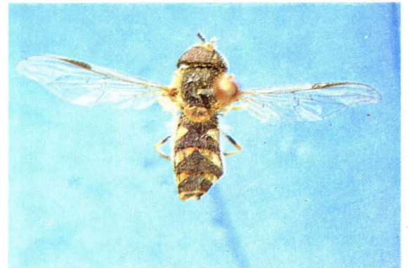
22. 白纹达蚜蝇 Dasysyrphus albostriatus ♂