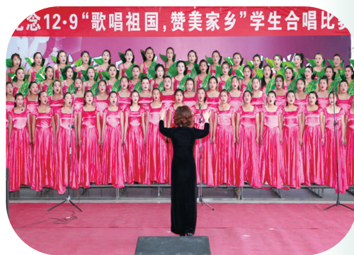
2010年12月,学院学生纪念一二·九合唱比赛