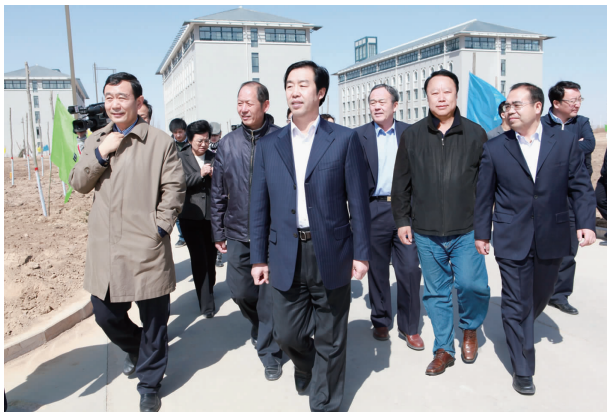
2010年4月,自治区党委书记于革胜(中)在教育厅厅长郭虎(左一)的陪同下视察学院工作