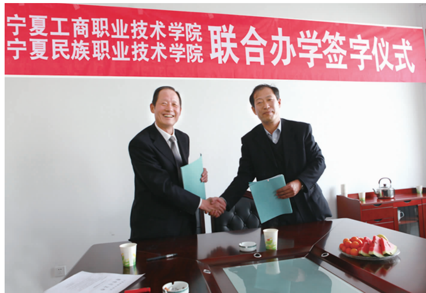
2010年3月，学院与宁夏工商职业技术学院联合办学签字仪式