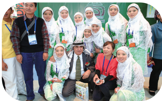
学院青年志愿者服务吴忠市回商大会