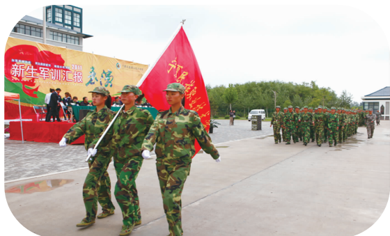
新生军训汇报表演