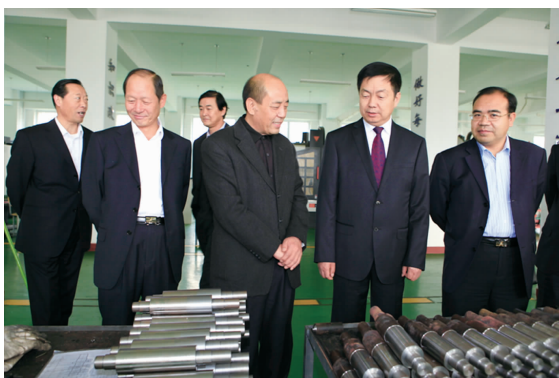
2011年10月,自治区党委常委统战部部长马三刚(中)莅临学院指导工作