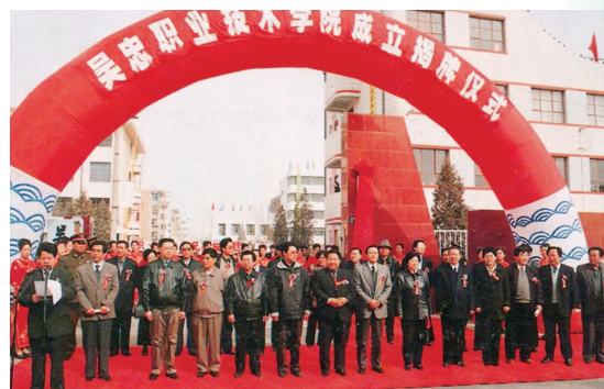
2001年2月22日,自治区副主席刘仲、人大副主任马昌裔、政协副主席金晓昀等区市党政领导参加学院成立揭牌仪式