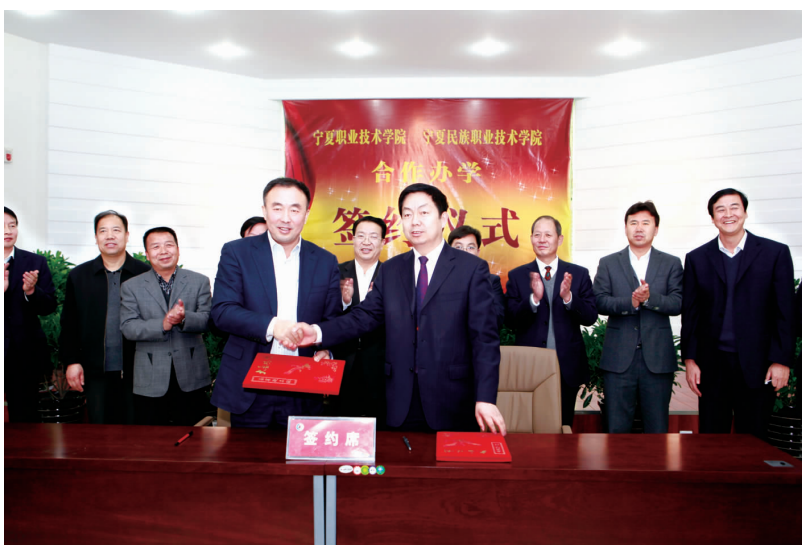
2011 年 12 月,学院与 宁夏职业技术 学院合作办学 签约仪式