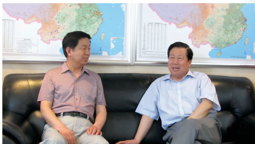
2012年5月,国家环保部部长周生贤(右)与学院党委书记温泽(左)亲切交谈,关心母校发展