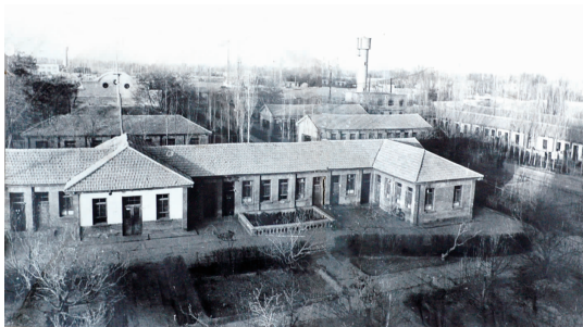
20 世纪 70 年代吴忠师范学校一角