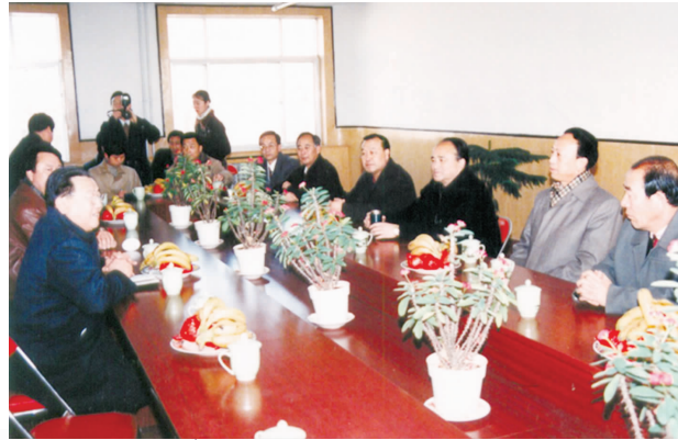
1999年1月，自治区党委书记毛如柏与学校领导座谈