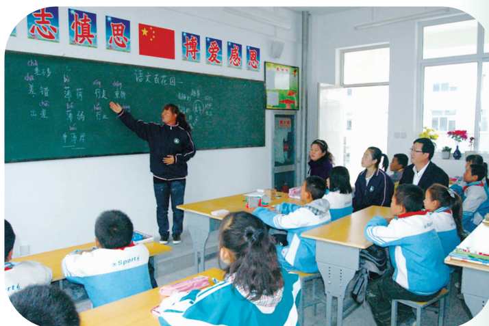
学院学生在吴忠市第15小学实习