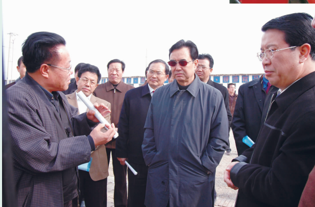
2005年11月，自治区主席马启智(中)视察学院