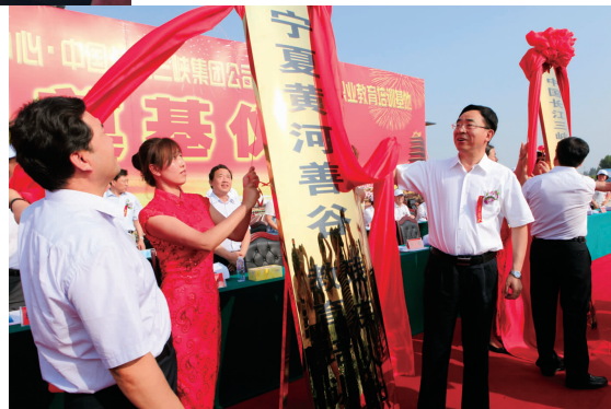
2011年8月，自治区党委书记张毅(右一)、自治区主席王正伟(左一)出席宁夏黄河善谷奠基仪式,并为残疾人培训中心和培训基地揭牌