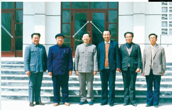
1990年4月，国家教委副主任邹时炎(中)在自治区教育厅厅长王凤峨(左二)、银南行署副专员张万葆(左四)陪同下视察学校