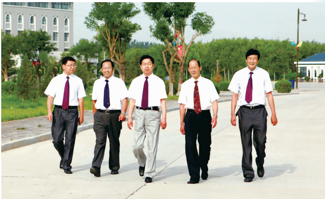
团结奋进的宁夏民族职业技术学院领导班子