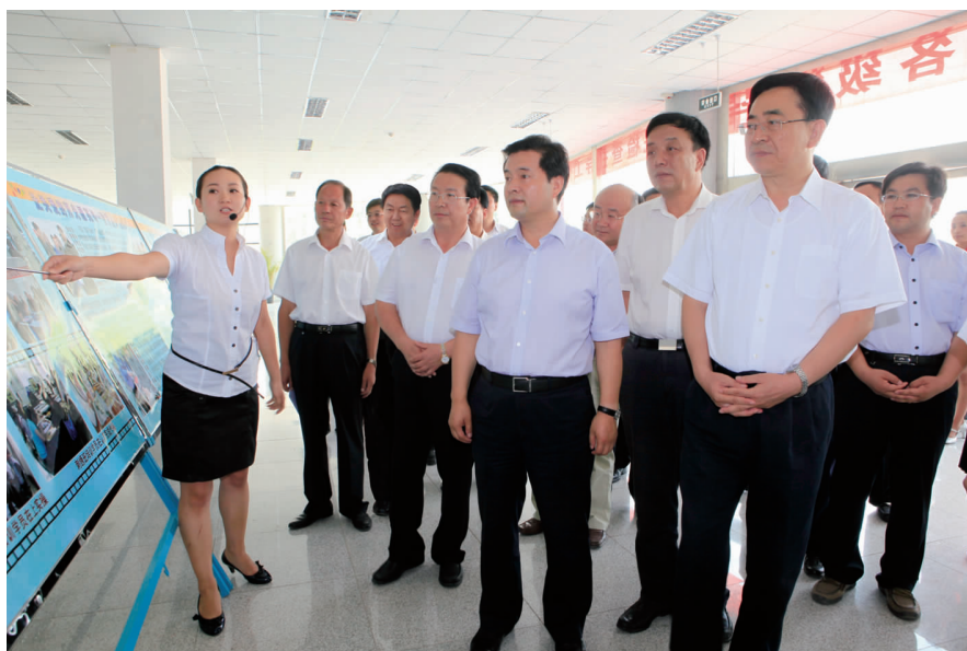
2011年8月,自治区党委书记张毅(右一)、自治区主席王正伟(右三)在吴忠市市委书记白雪山(右二)、吴忠市市长吴玉才(右四)的陪同下莅临学院指导工作