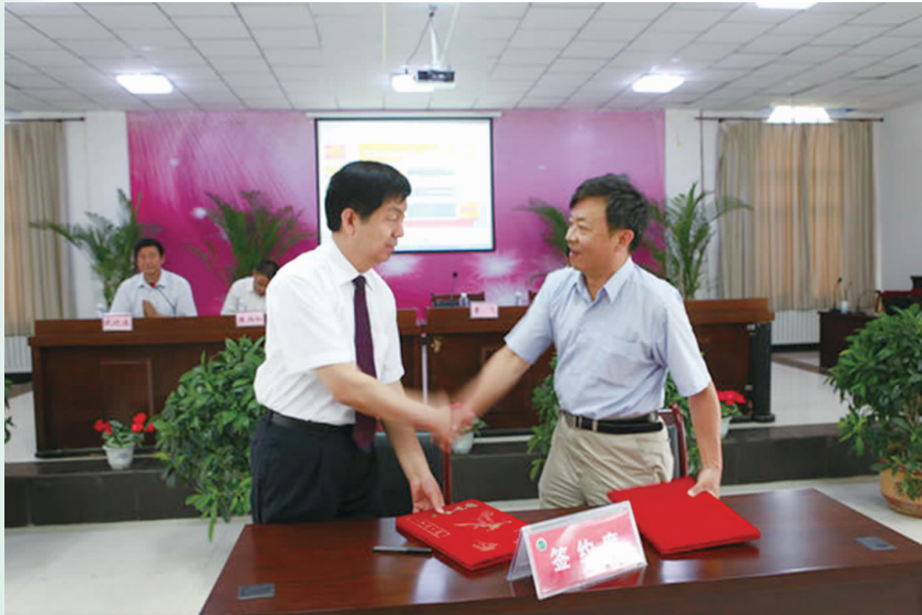
2012年6月，学院与常州工程职业技术学院签订对口支援与友好合作办学协议