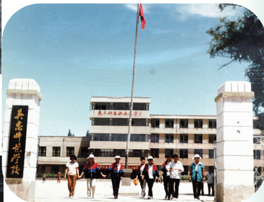
20 世纪 80 年代吴忠师范学校