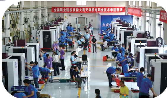
学院学生代表宁夏参加全国职业院校技能大赛