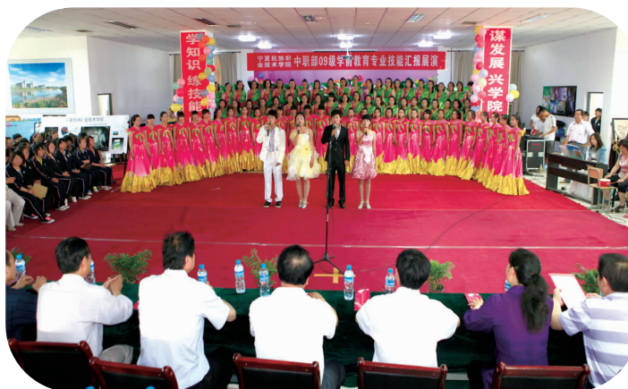
学前教育专业学生技能展示