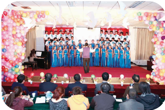
学院学生技能展示活动