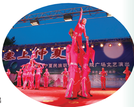
学院师生广场文艺演出