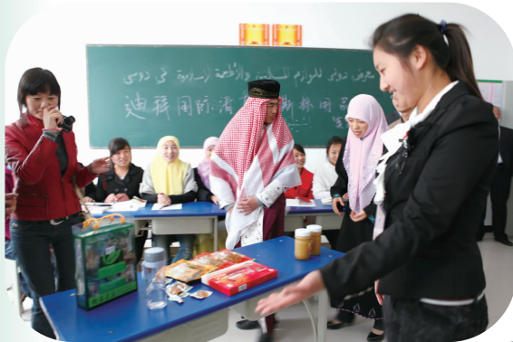
阿语专业学生实景模拟阿语导购