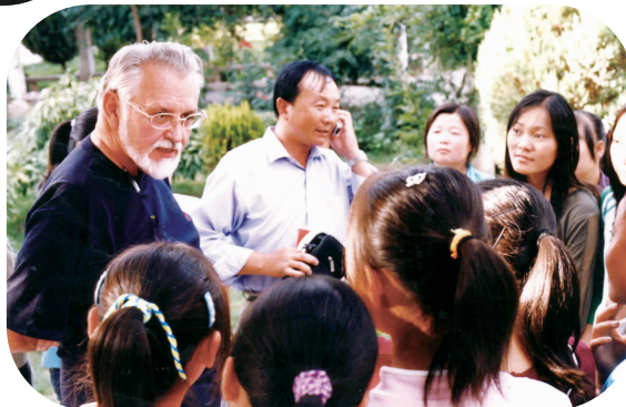
外籍教师与学生英语对话练习