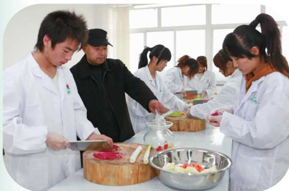
食品加工专业学生技能展示