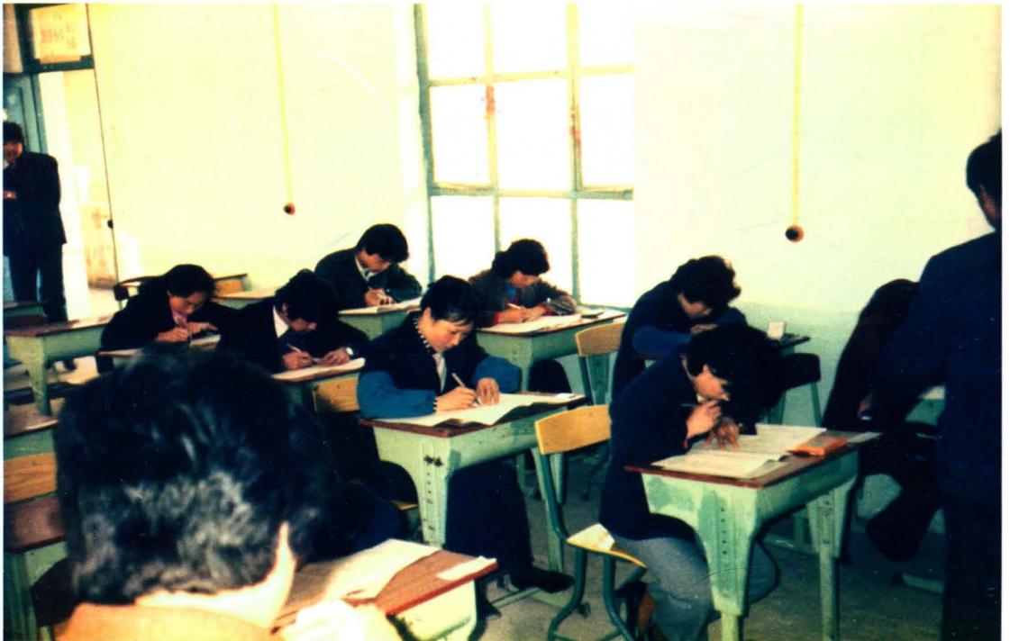
统计系统重视提高自身和各行业统计人员的业务能力，统计上岗资格培训考试中