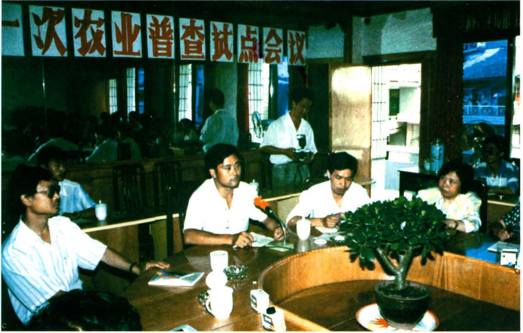
召开第一次农业普查试点会。图中前排右二为时任统计局长王允铨