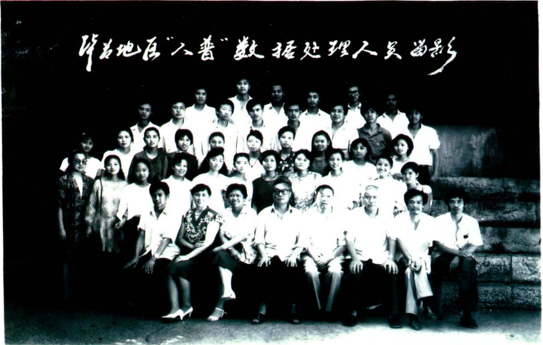
全国第五次人口普查办公室领导和数据处理人员合影（1991年），前排右四为时任统计局局长何家兴