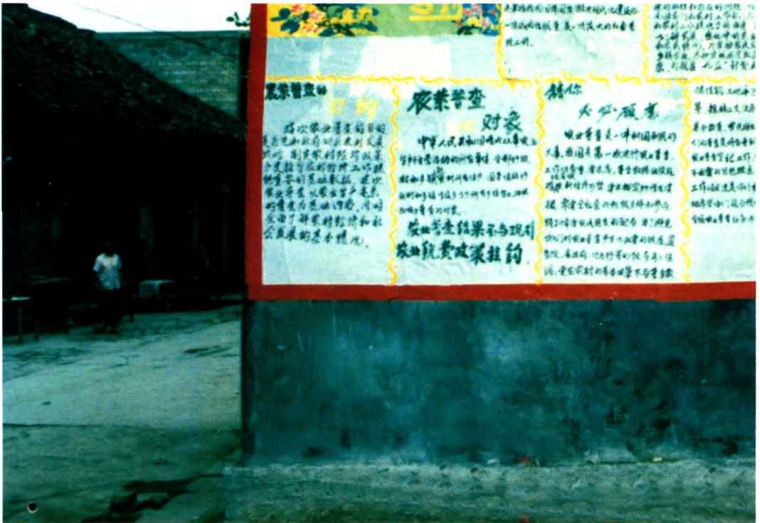
农业普查宣传深入到村户。1996年全国第一次农业普查