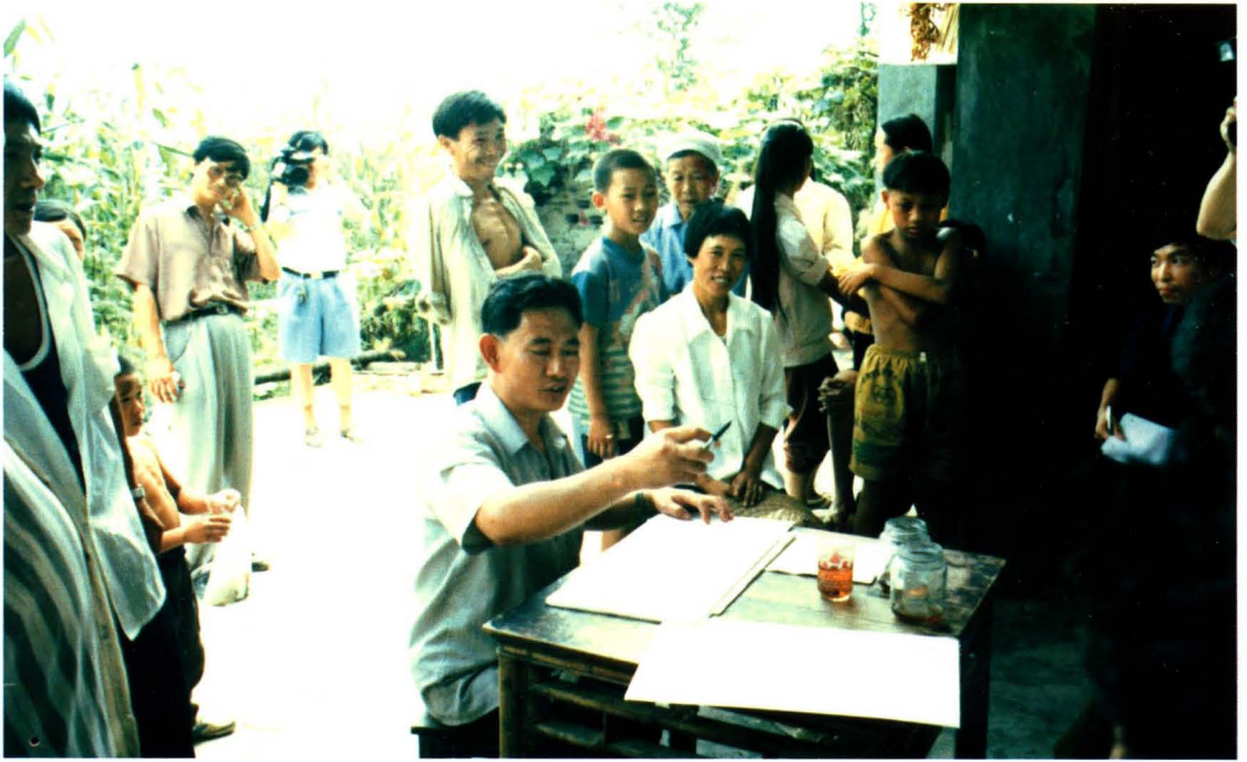
深入农户家中进行普查宣传和示范性培训