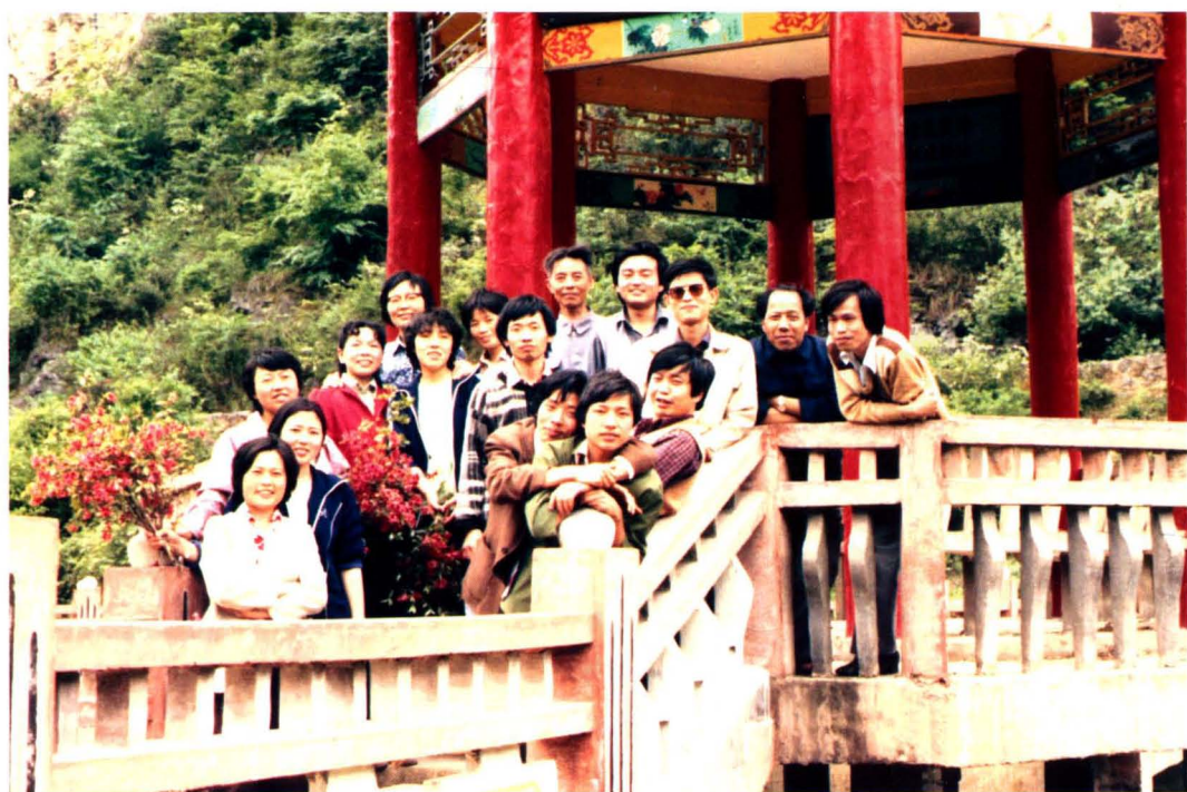
丰富的业余生活。1987年春天的周末，单位同事到天河公园开展活动