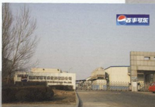
沈阳百事可乐饮料有限公司