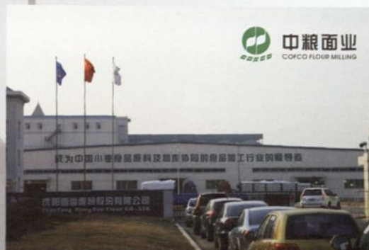
中粮—沈阳香雪面粉股份有限公司