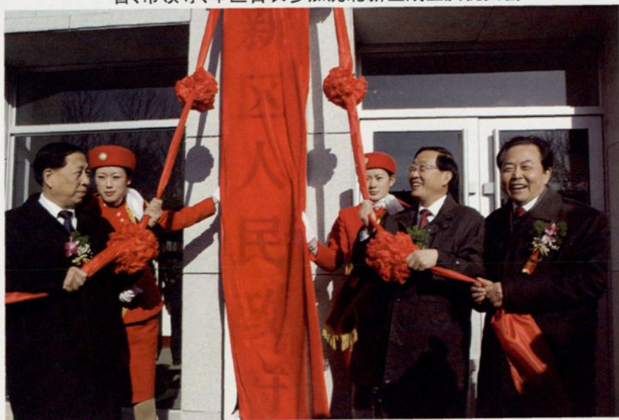
省、市领导为沈北新区成立揭牌