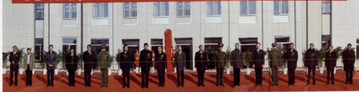
省、市领导、军区首长参加沈北新区成立庆祝大会