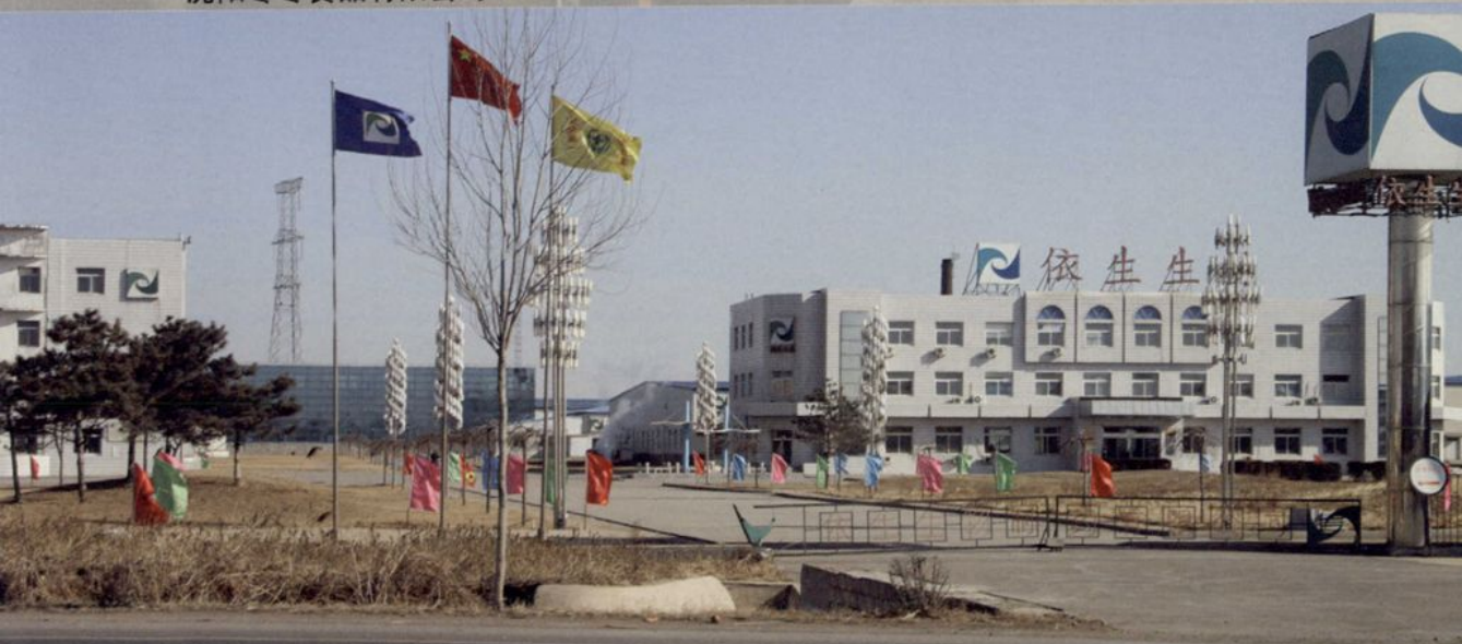
依生生物制药有限公司