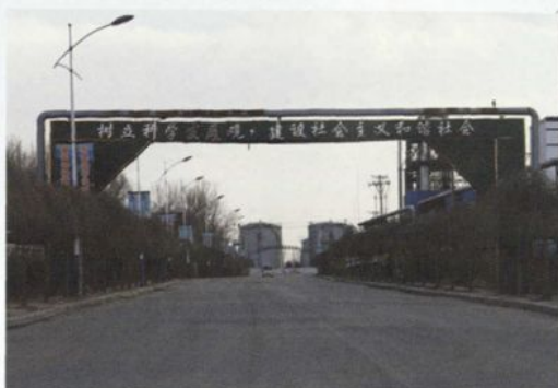
沈阳新城子化工产业集群精细化工园