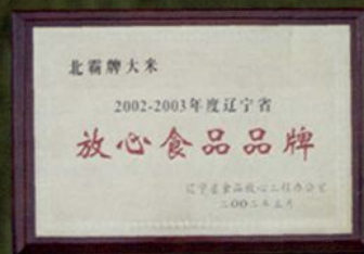
放心食品荣誉证书