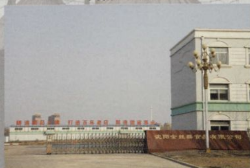
沈阳金丝猴食品有限公司