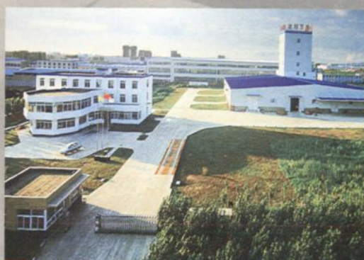
沈阳万千农牧科技有限公司