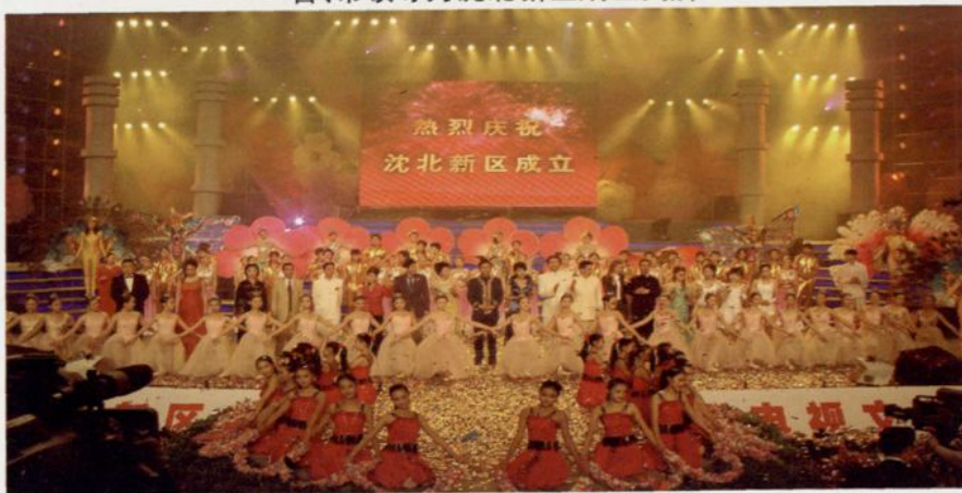
沈北新区成立庆祝活动