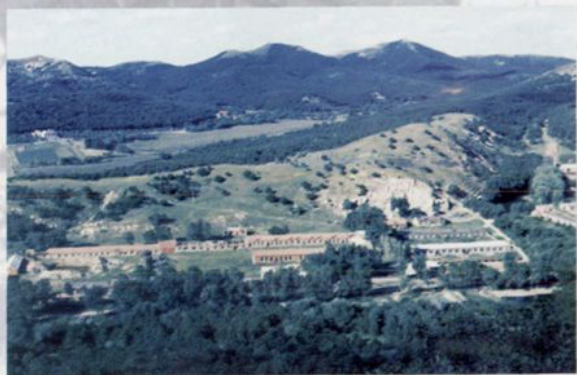
区种畜牧场办公区