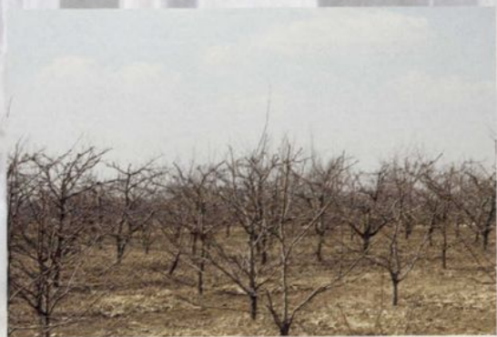
优质果品产业基地