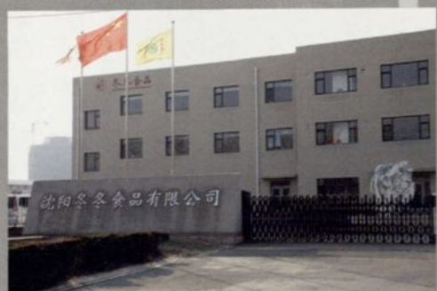
沈阳冬冬食品有限公司