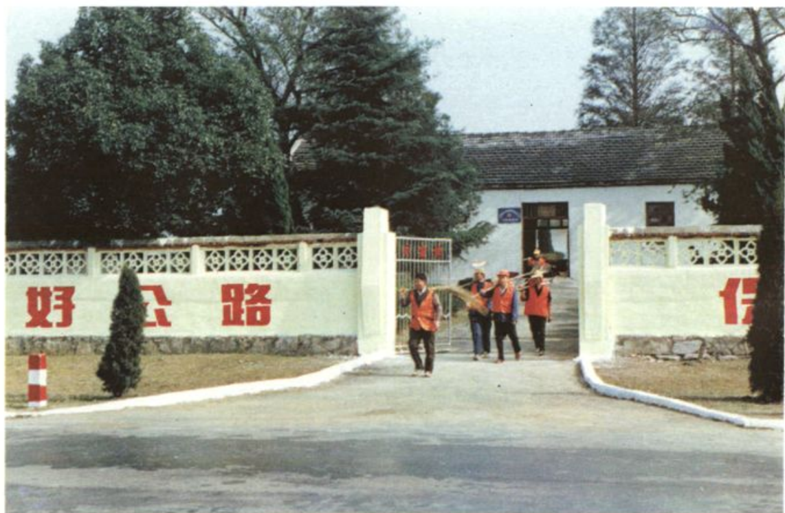
方家铺道班道工出勤