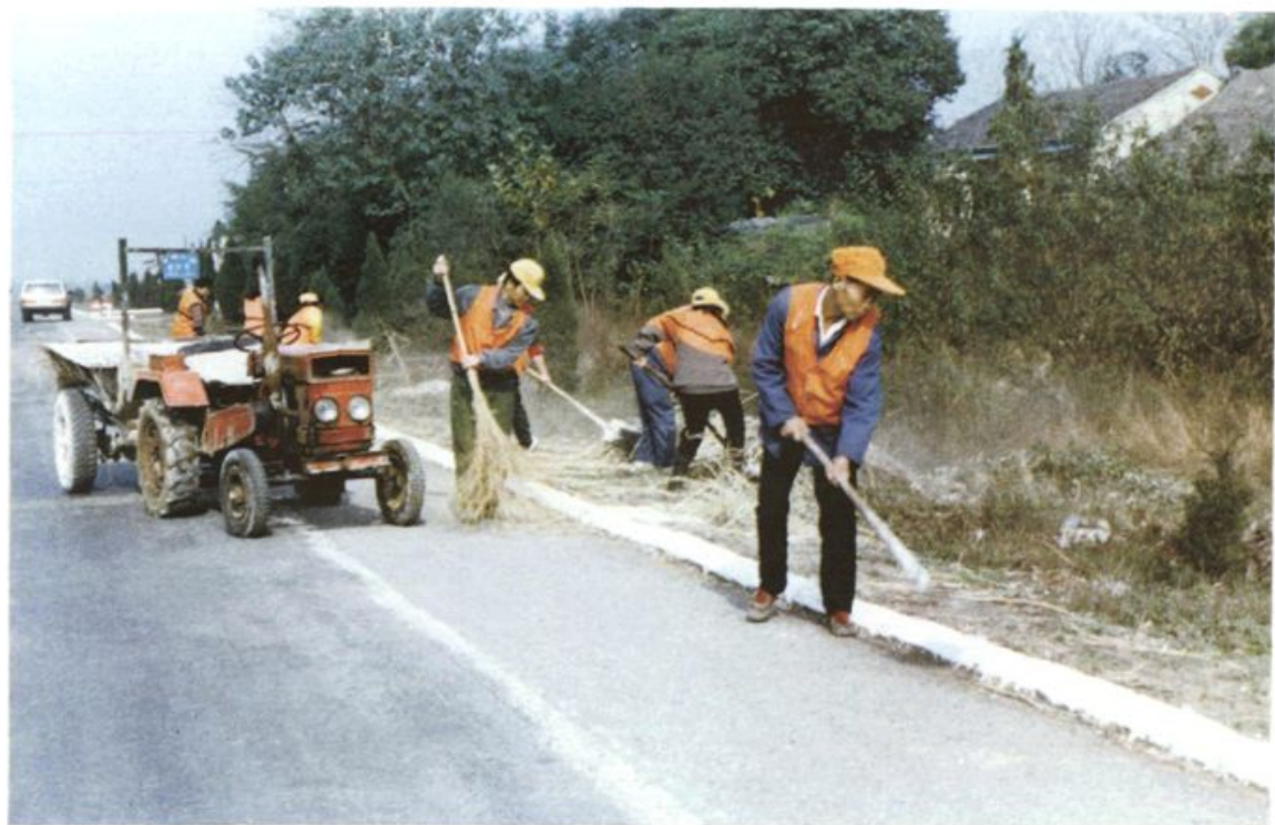
道工清除路肩杂物