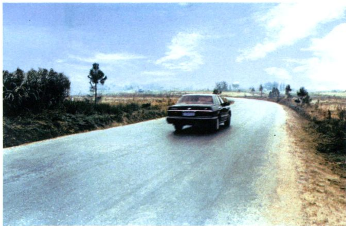
钟（桥）梅（渚）路马义山段