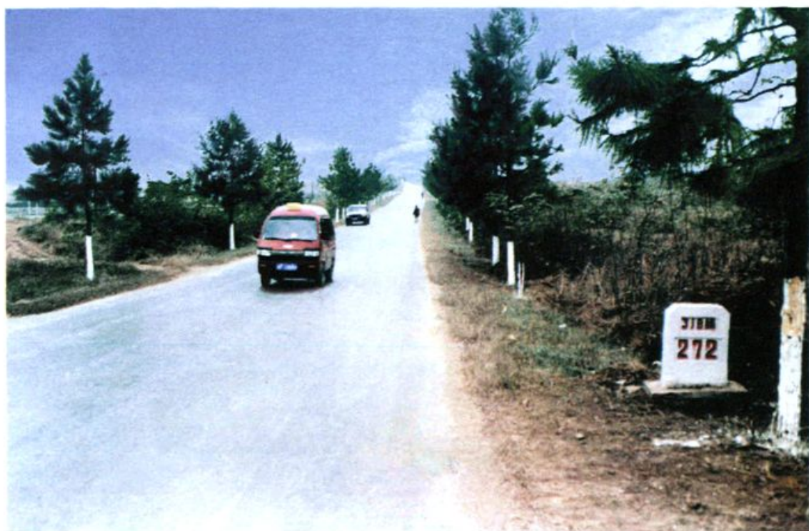
国道 318 线郎溪县十字铺段