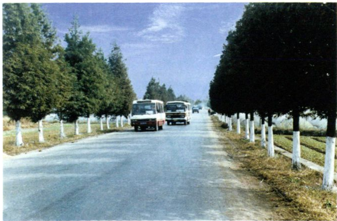
省道望十路水鸣段绿化