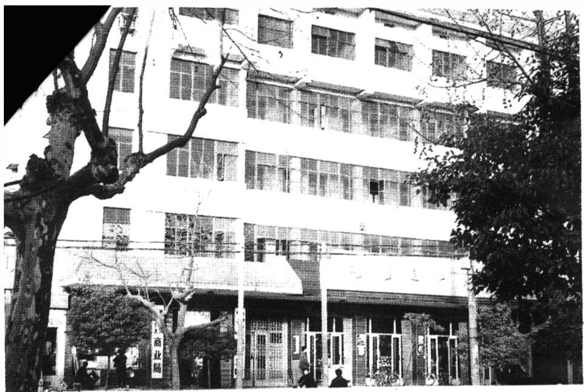
▲ 池州行署商业局办公大楼