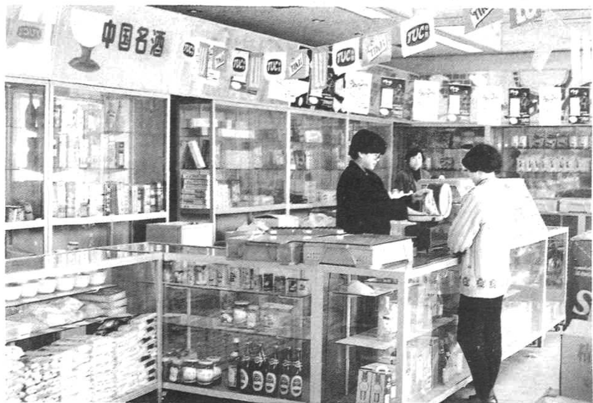
▲ 商业零售网点一瞥