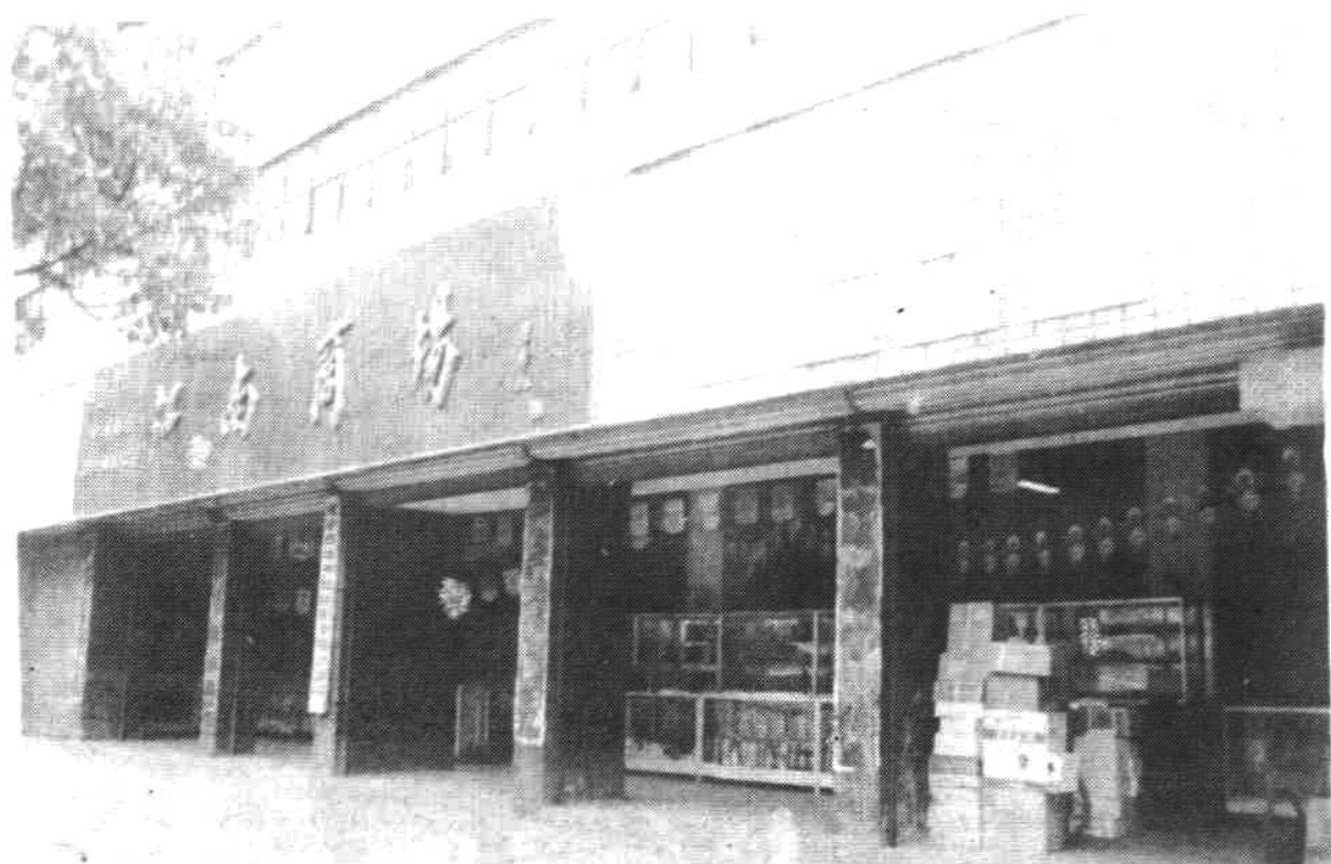
▼ 池州地区糖业烟酒 公司大楼