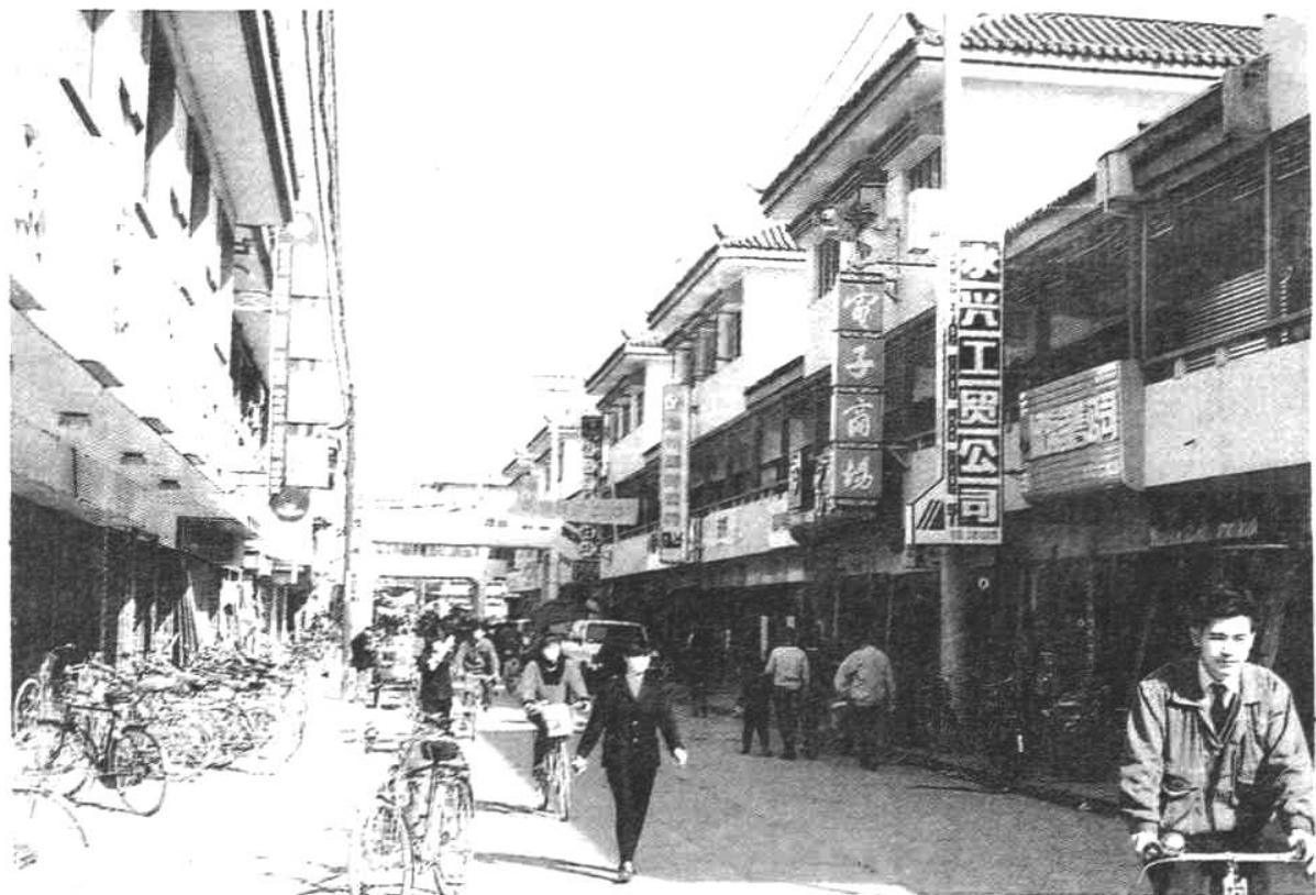
▲繁华的杏花村商业区