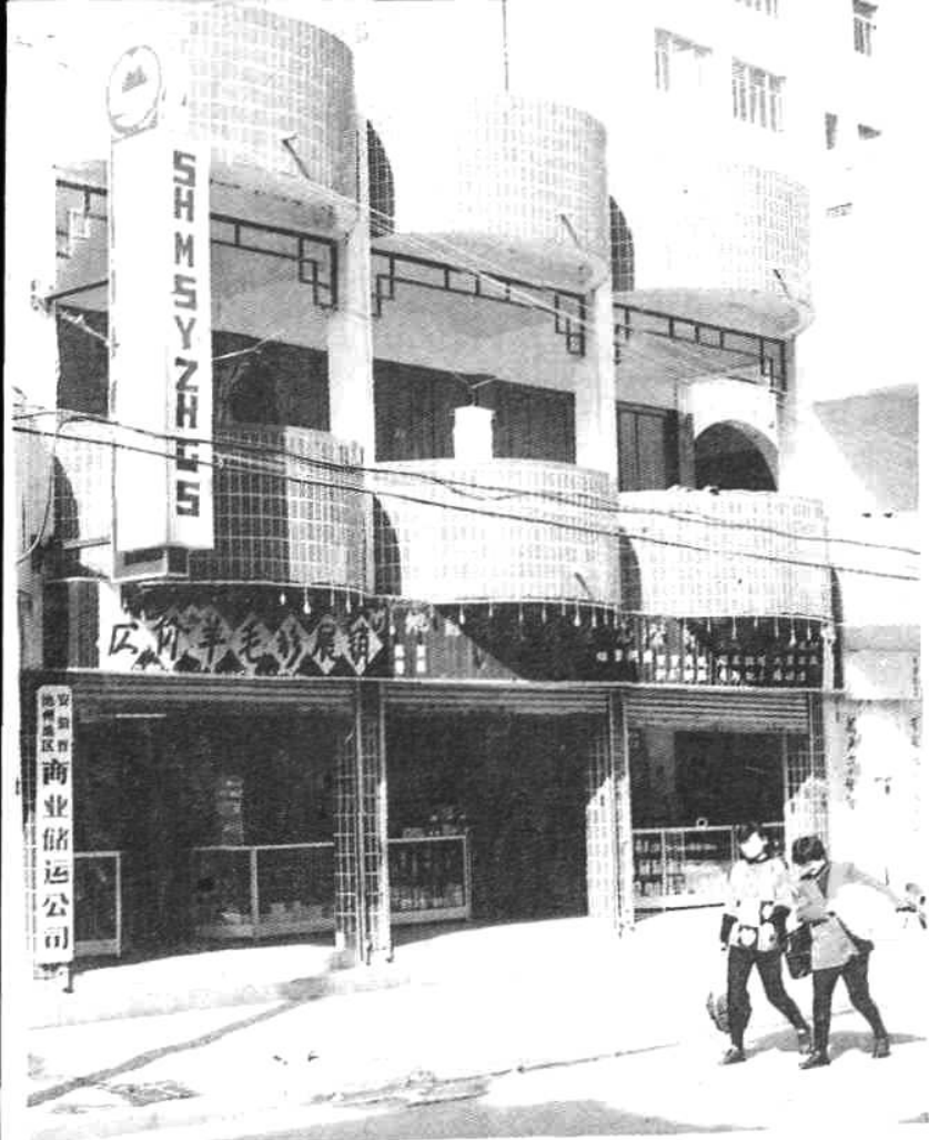
◀池州地区首届商品展销会一瞥