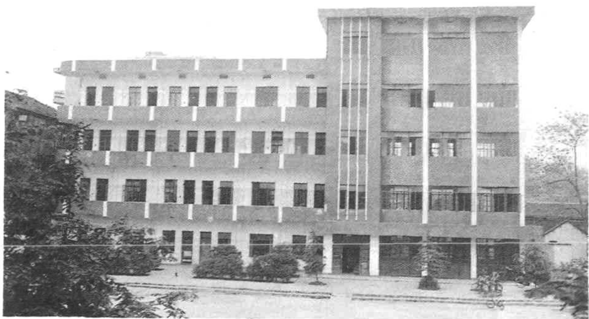
▼ 池州地区商业技工学校教学楼