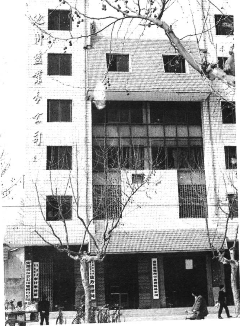
◀ 池州地区盐业 公司大楼