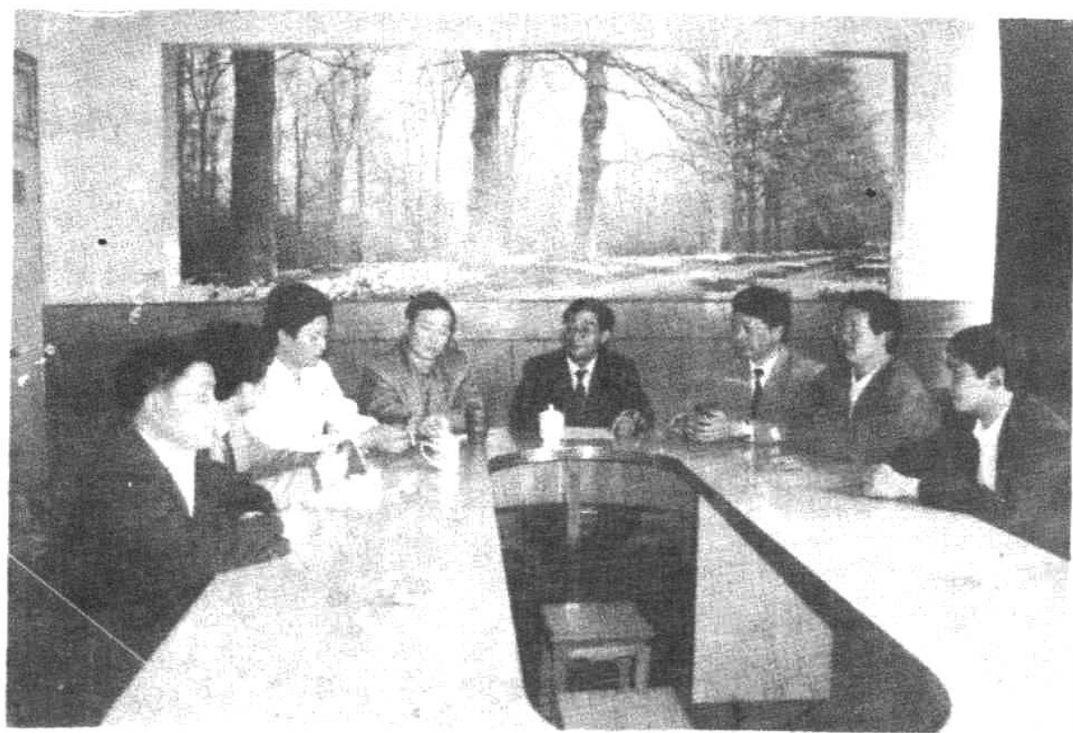
▲商业局领导班子研究、布置工作