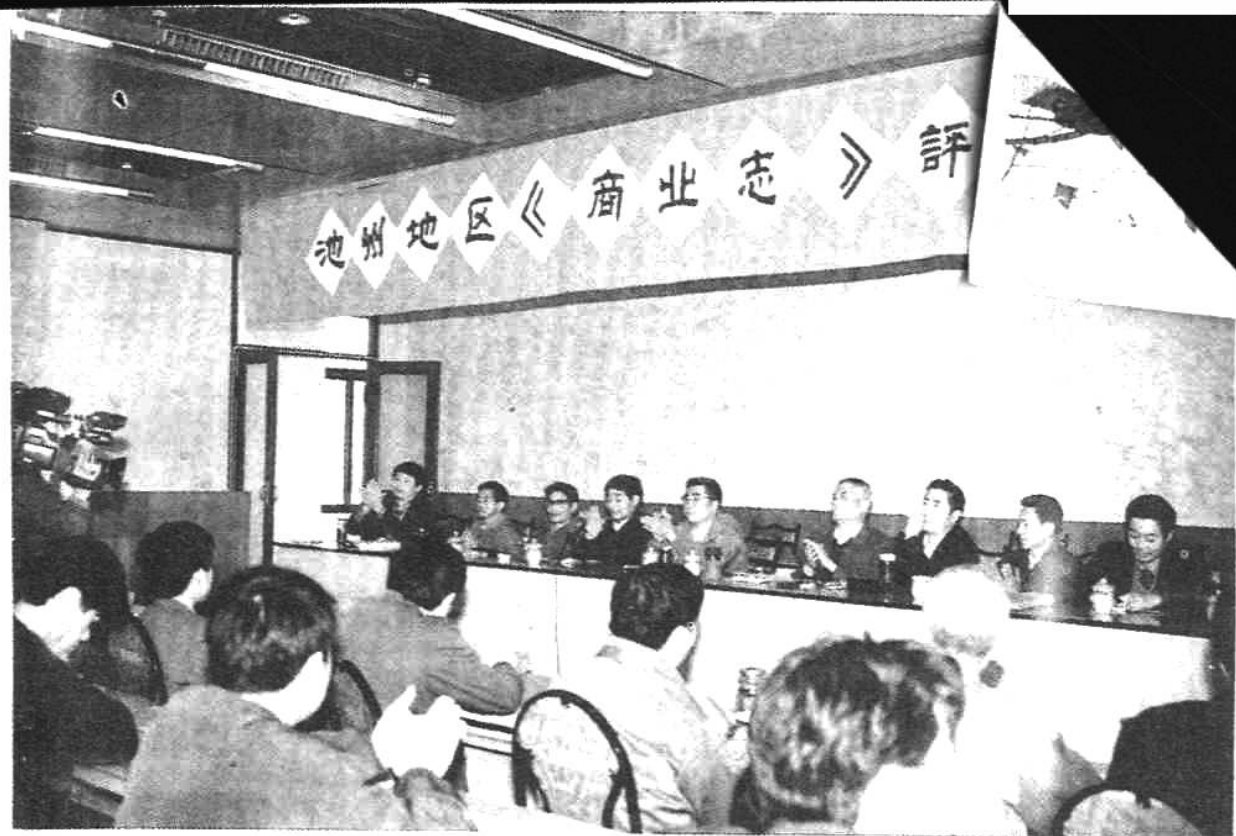
▲《池州地区商业志》评稿会