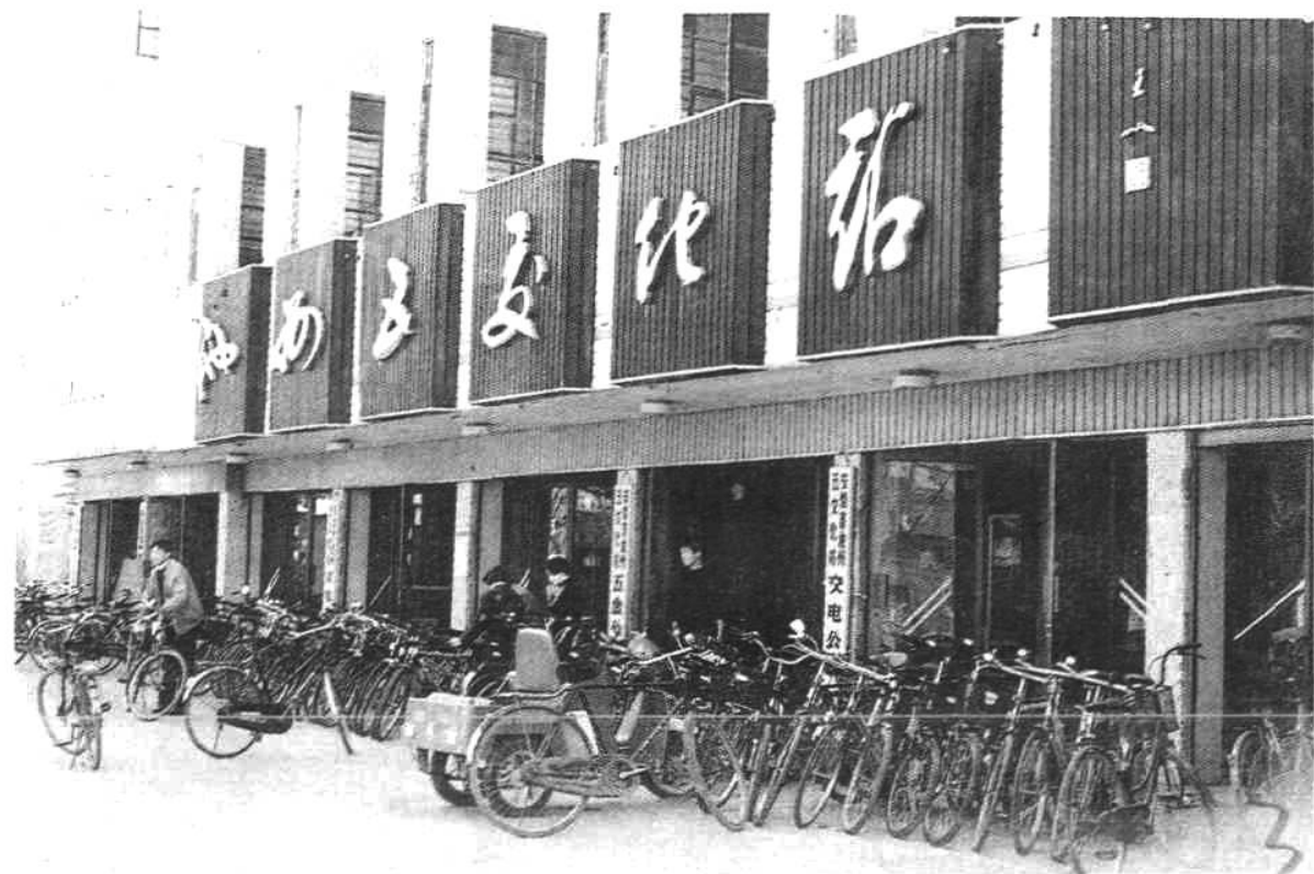
▼池州五交化站大楼