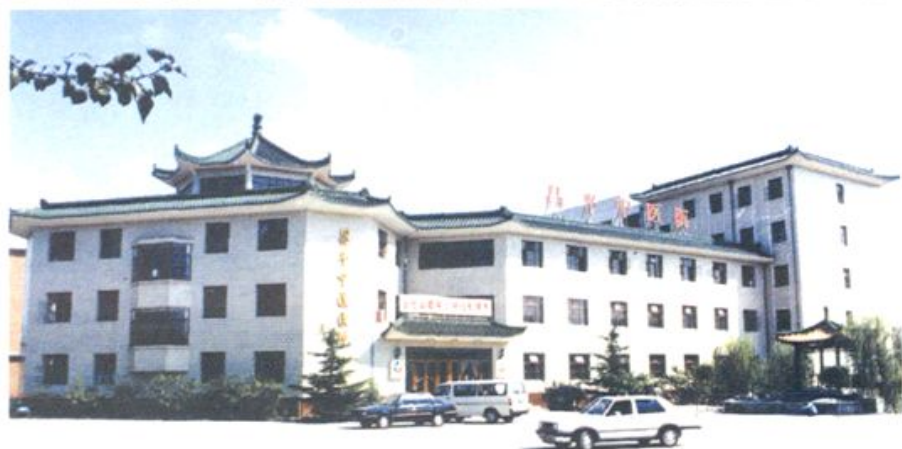
昌平中医院门诊楼