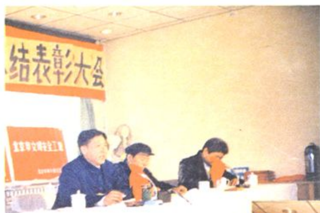
1991年建委召开建设工程质量安全总结表彰大会，建委主任赵仁在会上讲话。