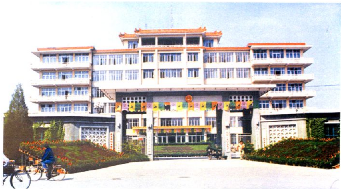
昌平县委、县政府办公楼