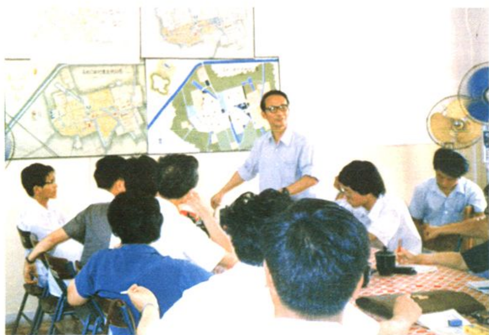
1986年7月国家“星火计划”马池口新村建设领导小组成员讨论村镇建设规划。