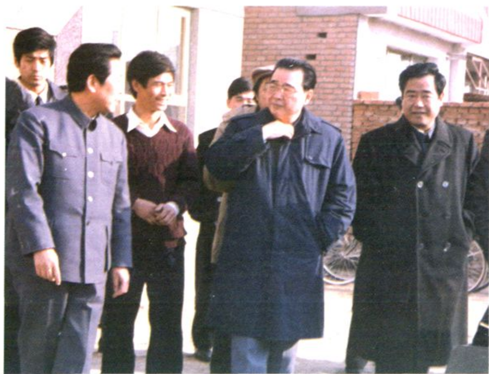
1989年2月8日，李鹏视察马池口新村。