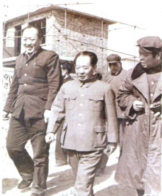
1984年3月12日，胡耀邦视察踩河新村。