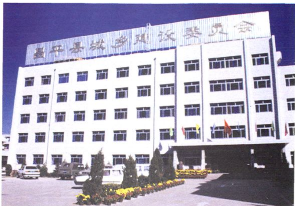
昌平 县城乡建设 委员会办公 楼