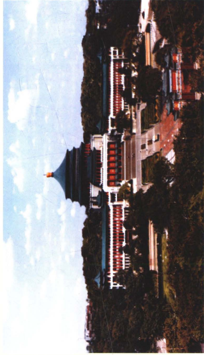
重庆市人民大礼堂及人民广场