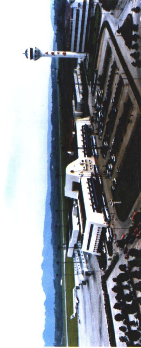
重庆江北国际机场