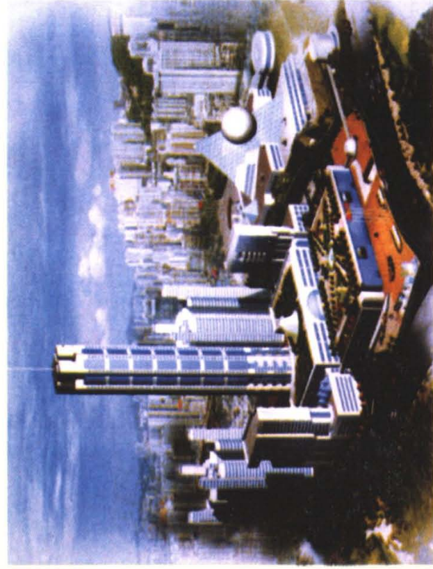
建设中的重庆国际会展中心