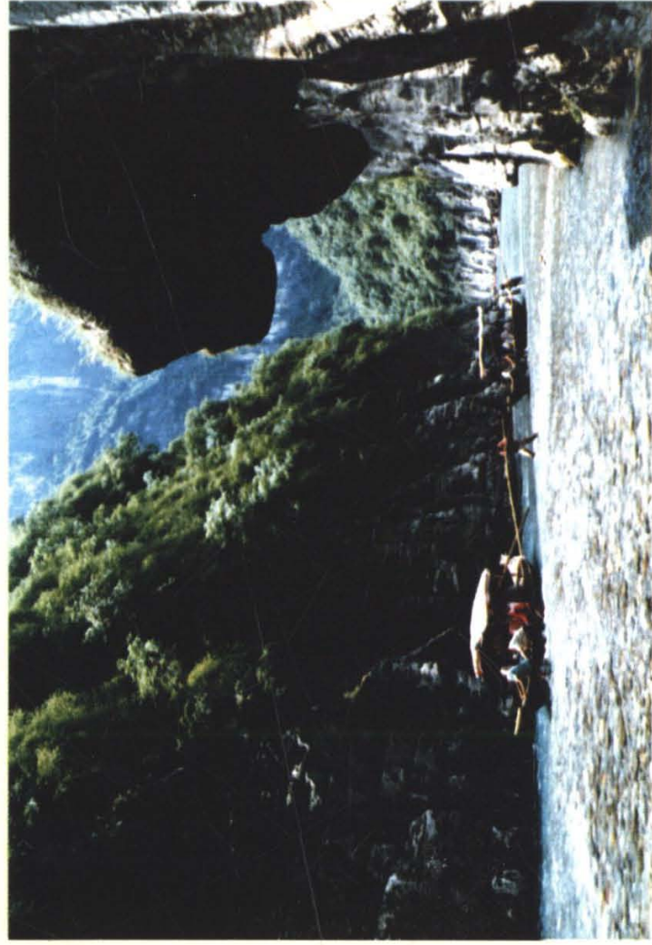
巫山小小三峡秀色