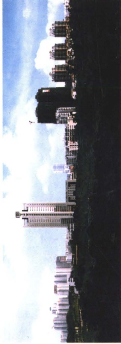
建设中的北部新城