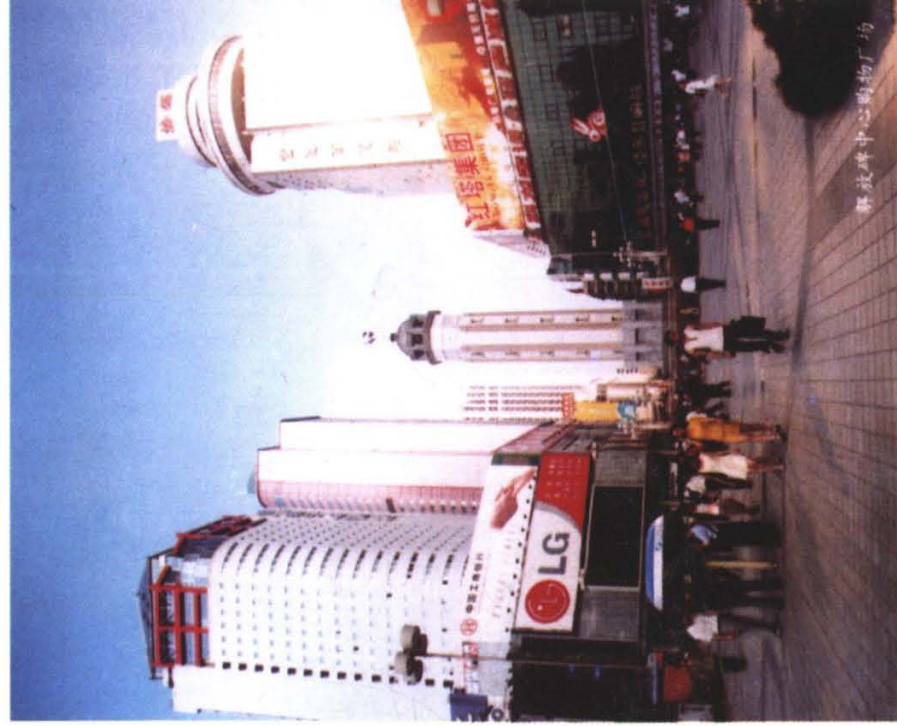
西南地区最大的购物中心——解放碑中心购物广场