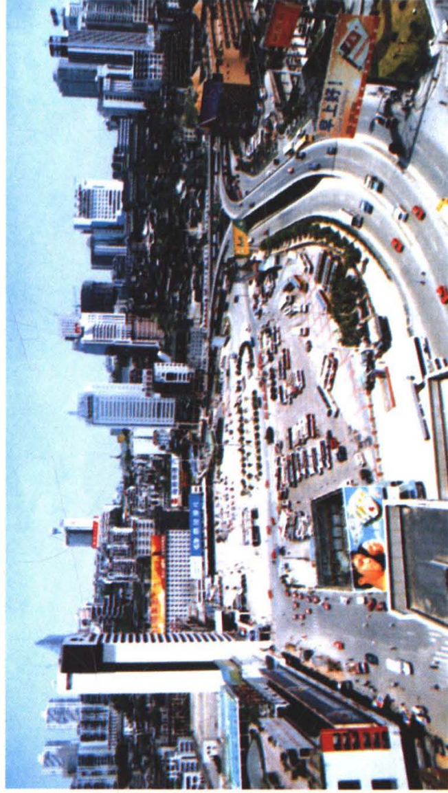
重庆火车站菜元坝广场