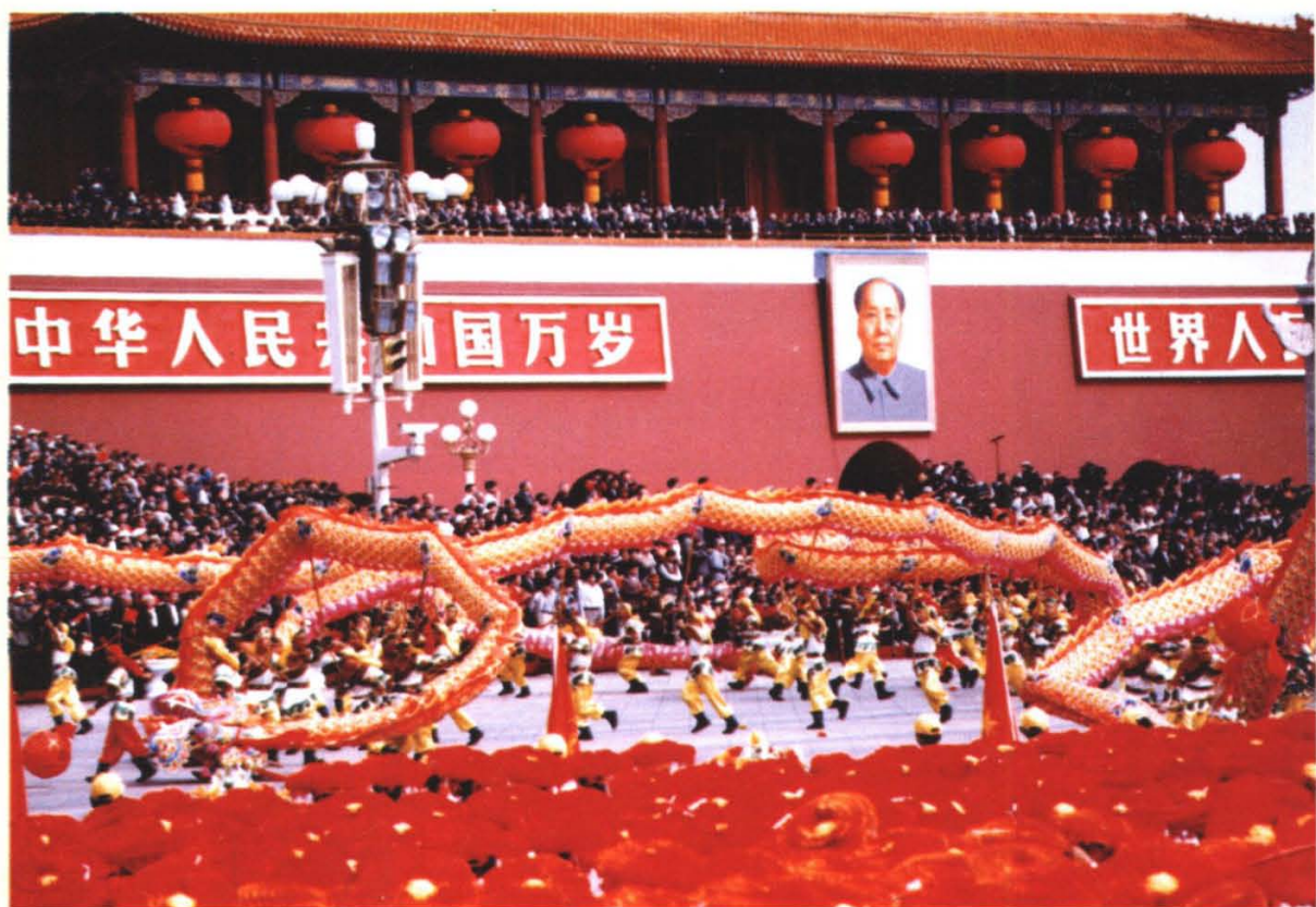
重庆铜梁龙在国庆 50 周年盛典上翻腾飞舞通过天安门城楼的雄姿