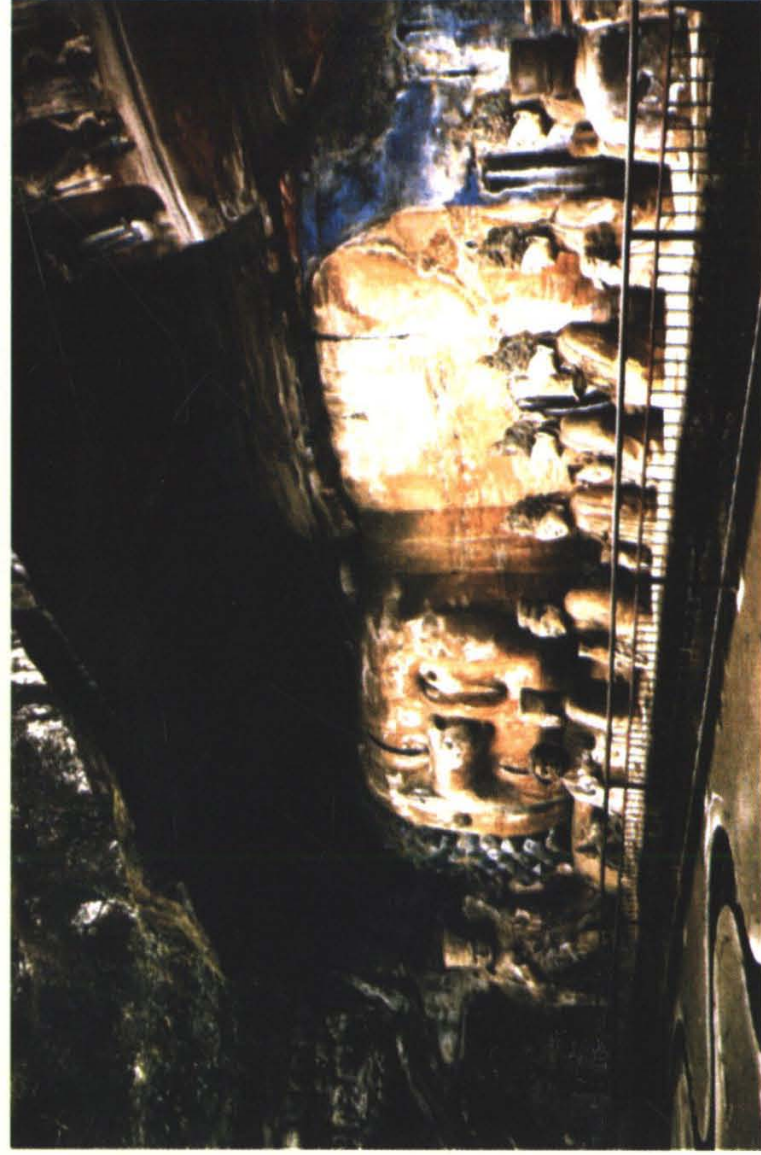
我国古代晚期石窟造像艺术的优秀代表作——大足石刻