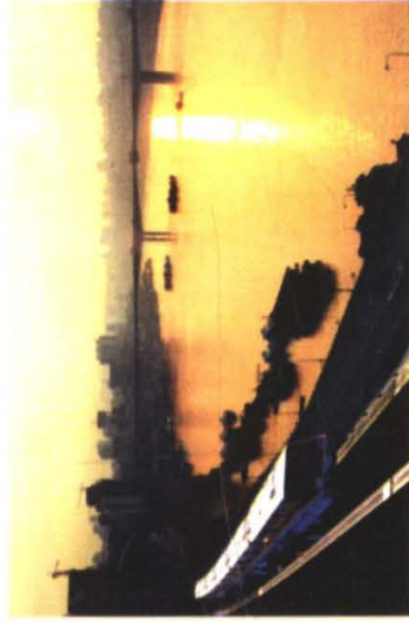
建设中的轻轨较—新线新景