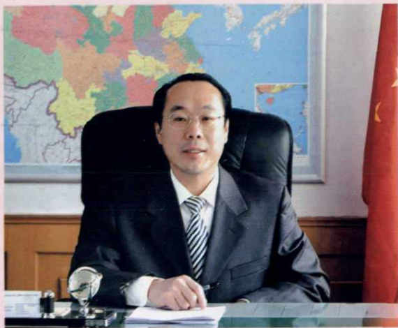
井陉区人民政府区长 朱献军