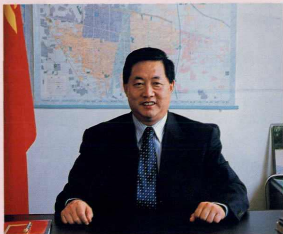
中共井陉区委书记 贾连海