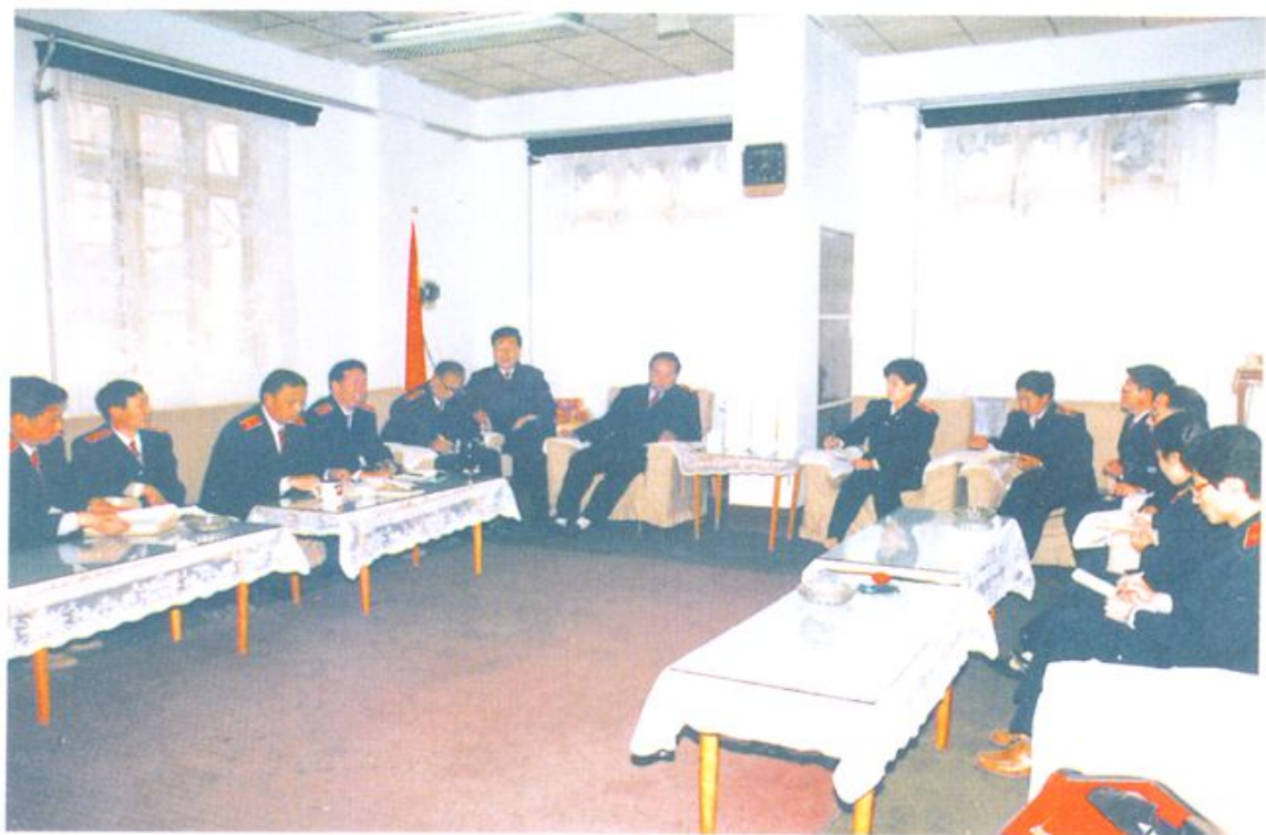
审判委员会在讨论研究案件