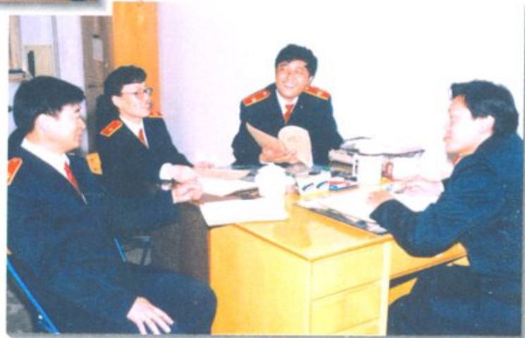
民事审判庭"新、特、奇" 合议庭在讨论研究工作