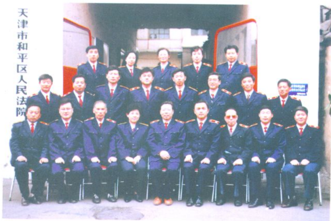
1995年和平区人民法院中层以上领导干部