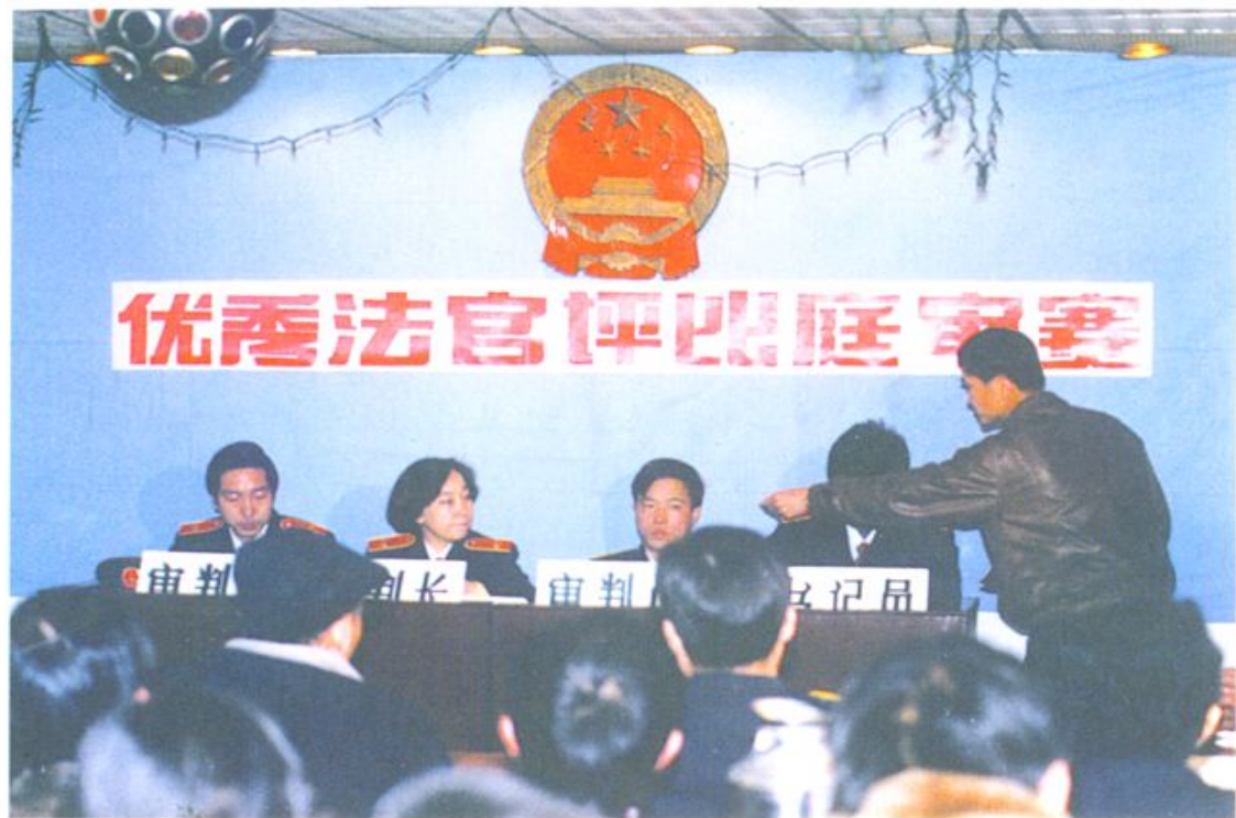
1994年12月，和平区人民法院开展优秀法官评比庭审实况。右一：当事人的代理人在向审判长出示书证