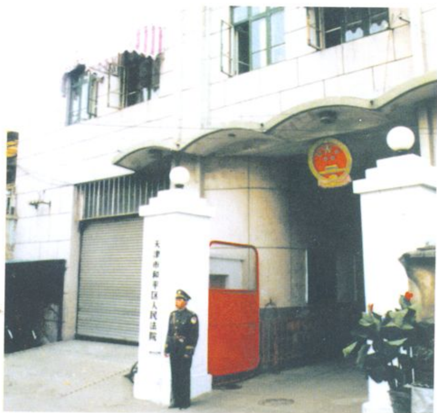
1989年和平区人民法院迁至华安街264号办公，图为法院办公楼现址