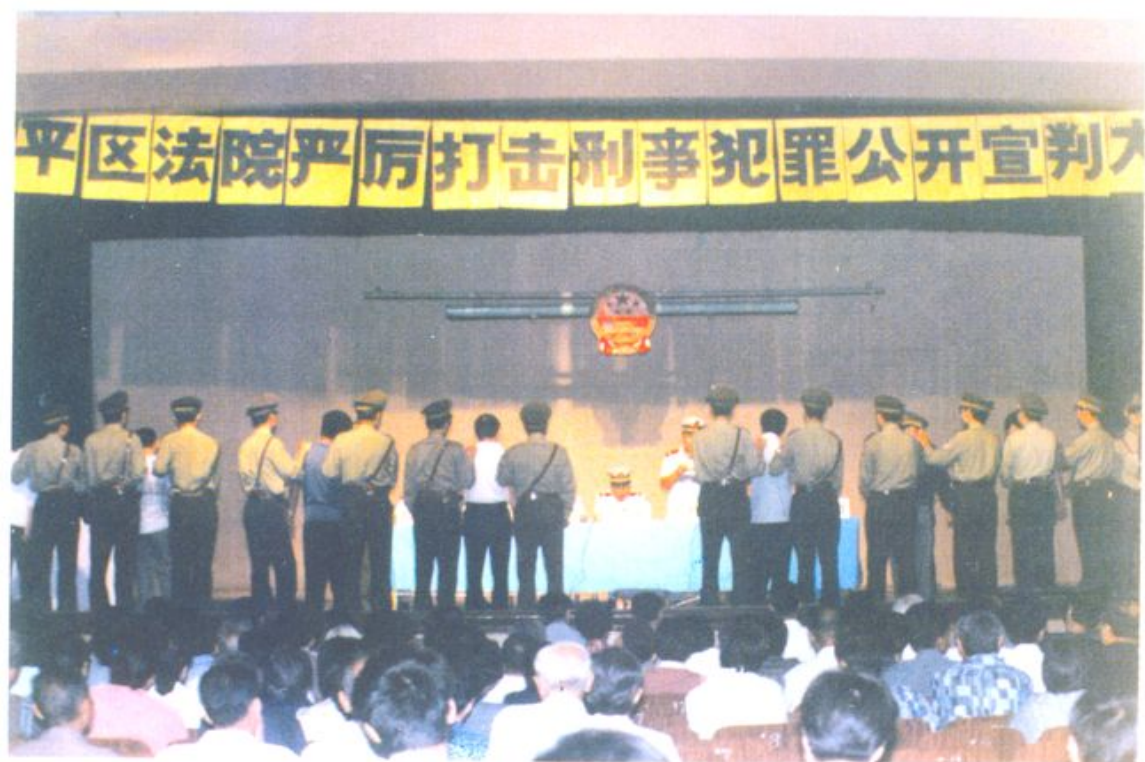
1994年8月，刑事审判庭在仁立毛纺织厂礼堂对八名罪犯进行公开宣判