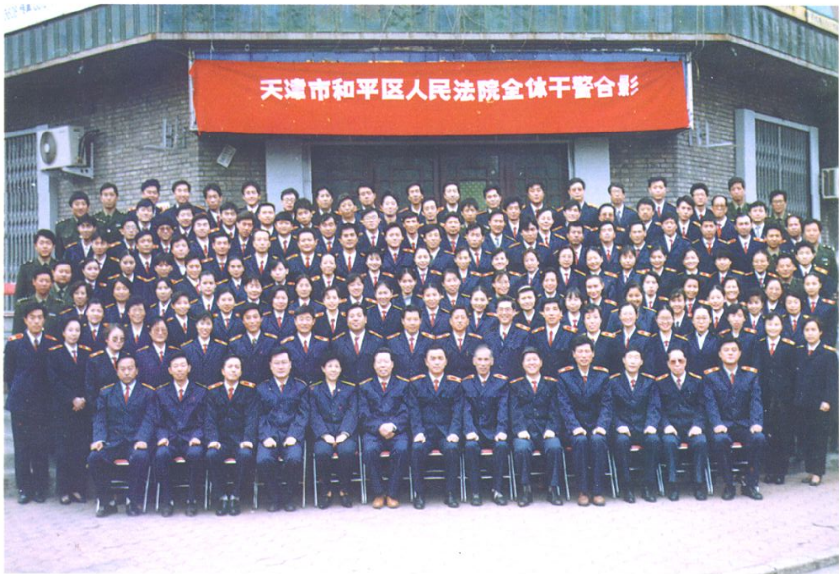
1995年和平区人民法院在岗全体干警合影