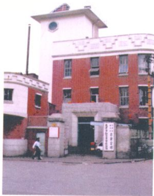
1952年和平区人民法院建院后在此楼（和平路20号）办公