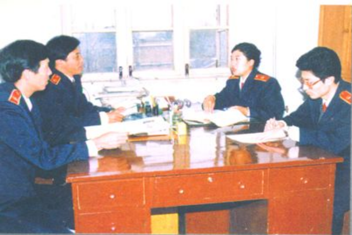
刑事审判庭未成年人 犯罪合议庭在评议案件