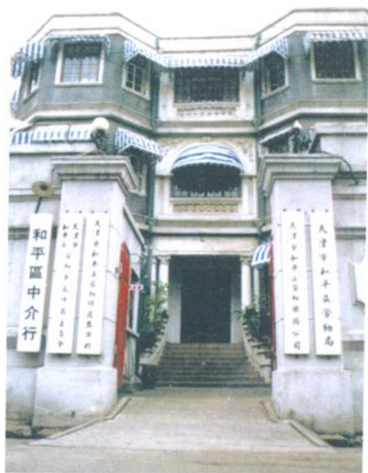
1960年和平区人民法院迁至沈阳道68号办公，图为法院办公楼原址