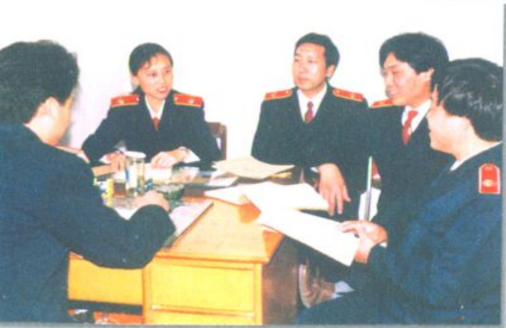
经济审判庭庭长在 主持研究审判工作