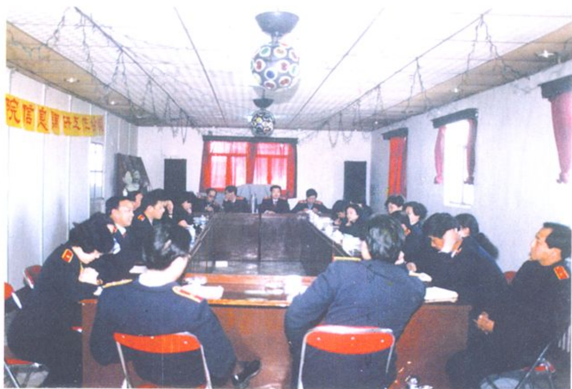
區人民法院召開調研信息工作會議