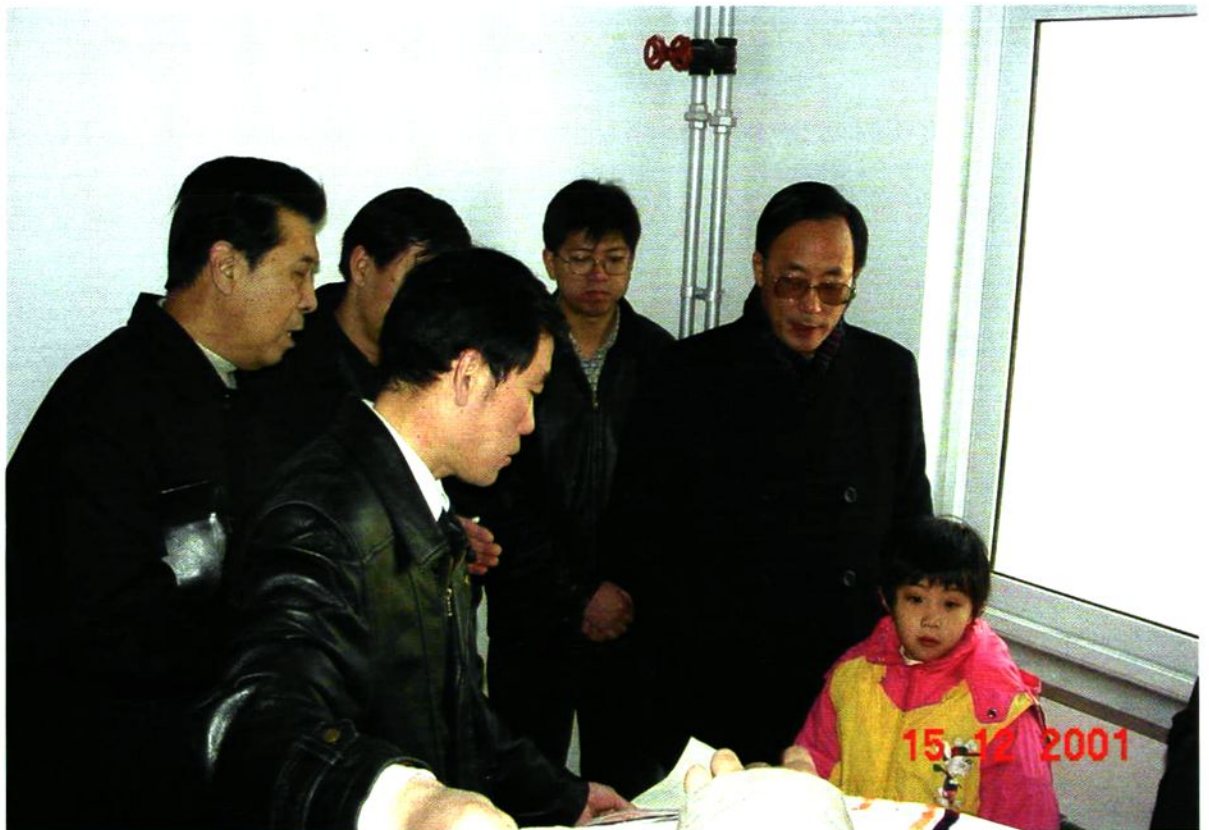
2001年12月15日刘敬民副市长视察开阳里小区