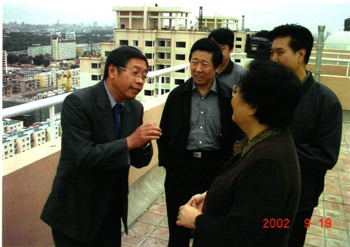
2002年9月19日翟鸿祥副市长视察开阳里小区