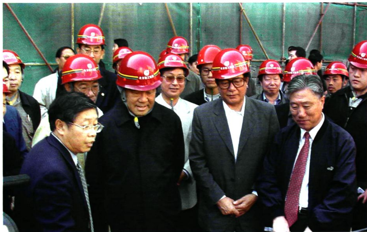
2001年10月11日北京市委书记贾庆林到丰台区进行调研时，视察右安门外开阳里小区一区危改施工现场