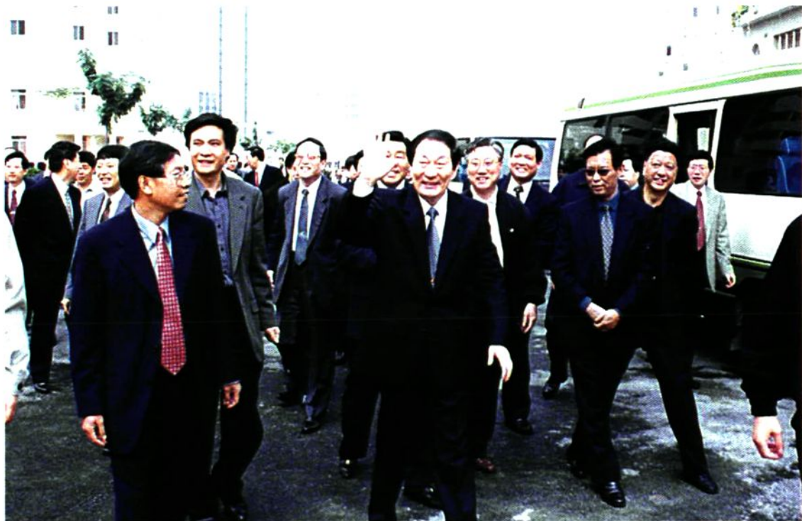
1999年9月28日国务院总理朱镕基视察望京西园四区（A5区）和望京南湖东区