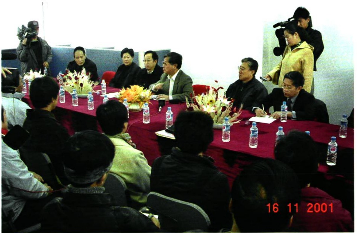
2001年11月16日北京市副市长汪光焘等领导接待右安门外西庄三条危改区居民代表