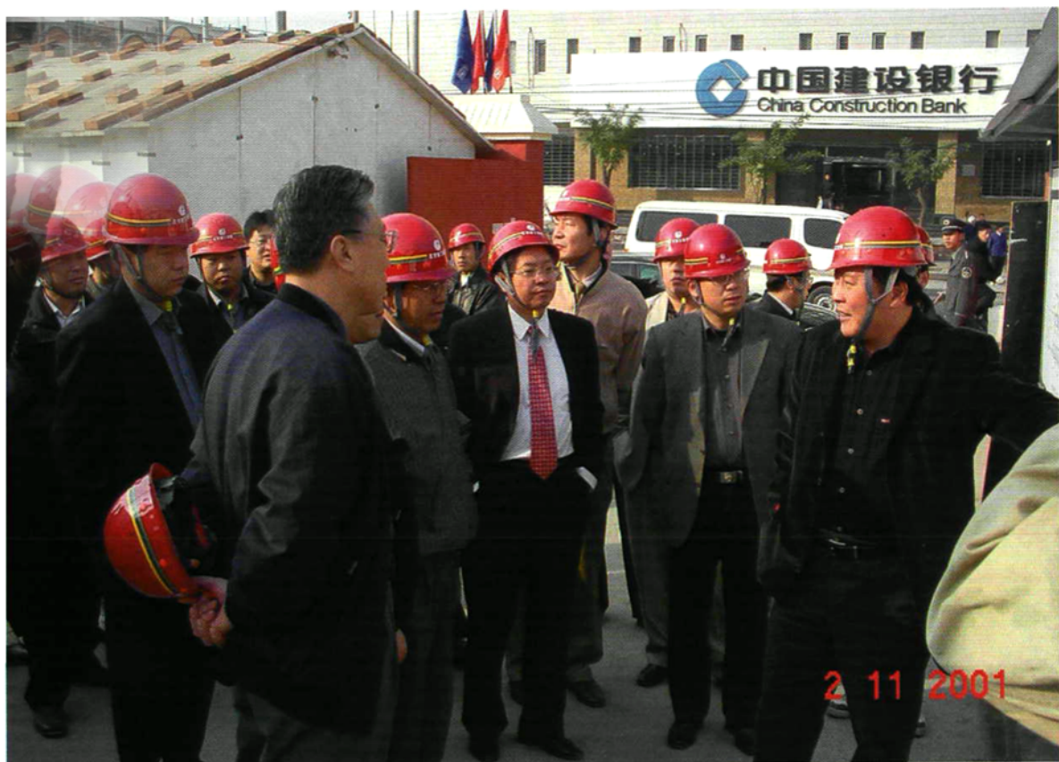
2001年11月2日阳安江书记视察右外项目