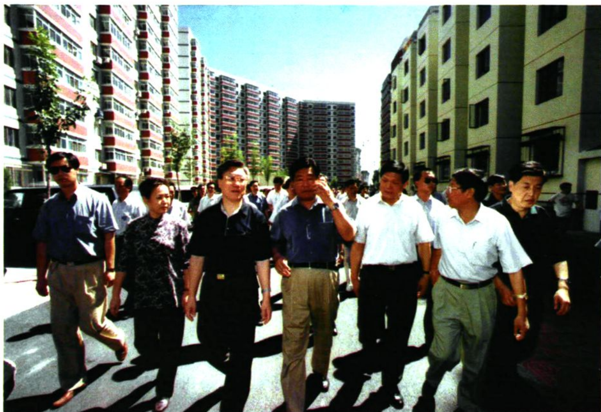
1999年8月21日北京市委书记贾庆林、北京市长刘淇视察望京新城安居工程