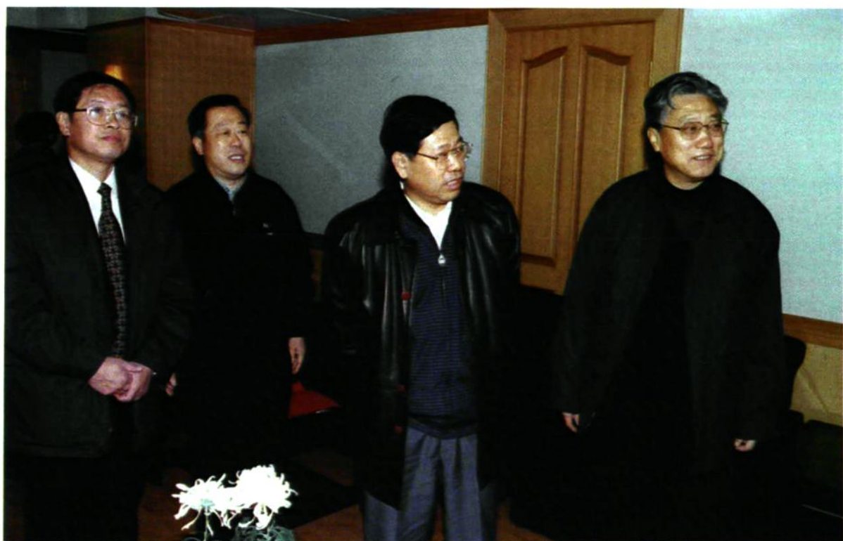
2000年1月15日北京市市委常委、市总工会主席阳安江到望京新城调研