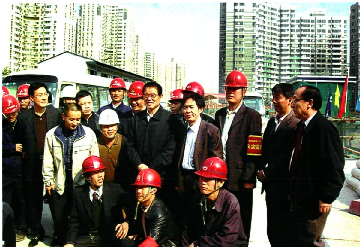
2005年10月19日全国人大常委会副委员长李铁映由北京市副市长孙安民陪同，到望京B区商业广场施工现场调研外来务工人员权益问题