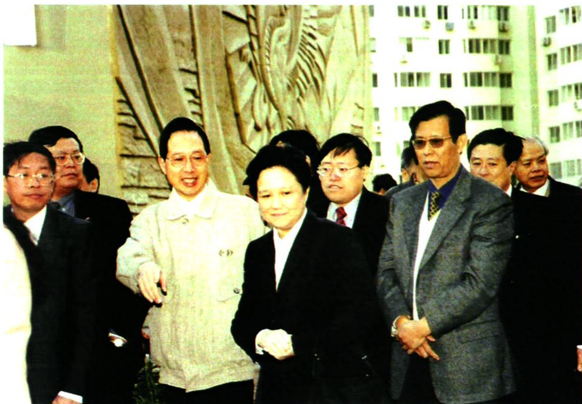
1999年10月29日建设部副部长叶如棠、科技部副部长邓楠视察望京西园四区，参观智能化中心控制室和中心广场