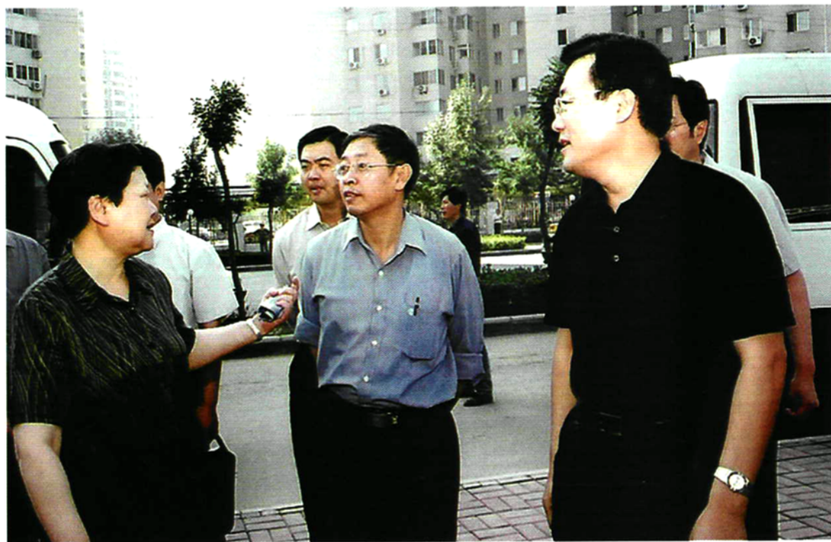
2003年9月11日北京市政协主席程世峨和部分市政协委员视察望京市政道路建设