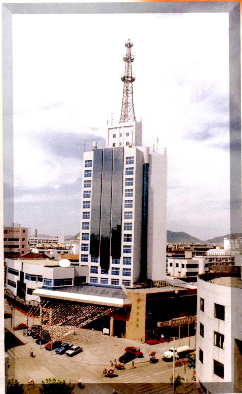
新建的邮电大厦高高矗立于余姚市中心