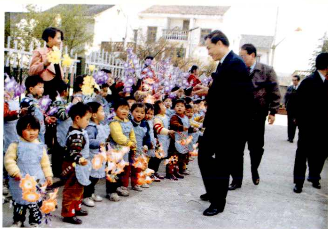
邮电部副部长杨贤足视察到 余姚邮电幼儿园受到小朋友 热烈欢迎