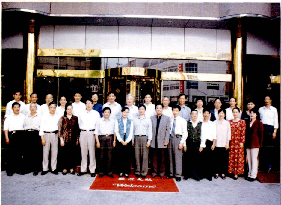
1998年4月，余姚邮电志评审会议在余姚河姆渡宾馆举行