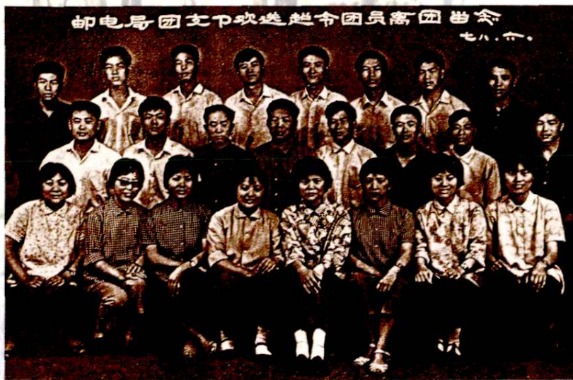
余姚邮电局第一批超龄团员离团留念