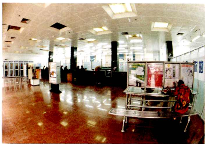
明亮优美的营业大厅