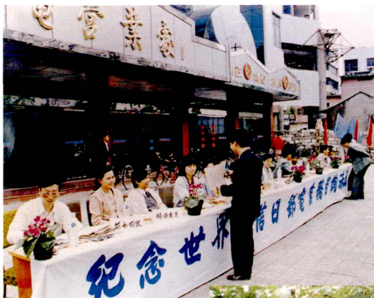
上街宣传邮电业务