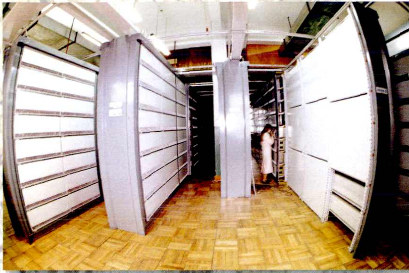
现代化的程控交换设备