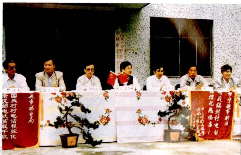
四明山革命老区实现村村通电话