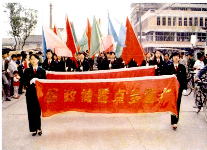
上街宣传邮政储蓄