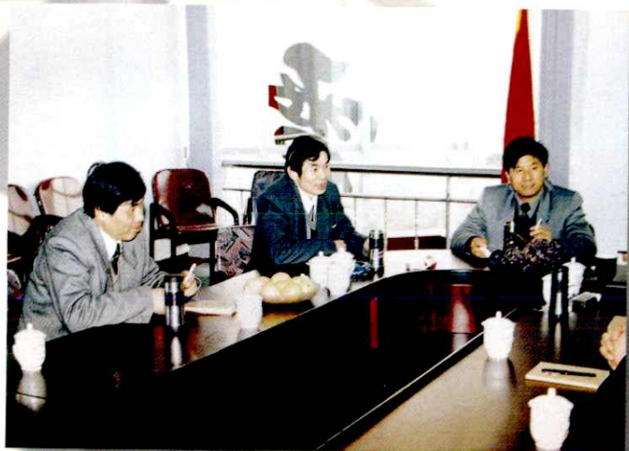
省邮电管理局局长胡旺山 到余姚市邮电局检查工作