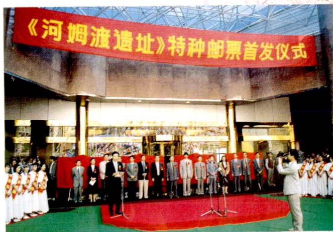
一九九六年五月十二日《河姆渡遗址》特种邮票首发式在余姚隆重举行