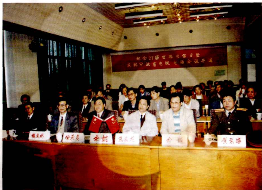
电视电话会议开通