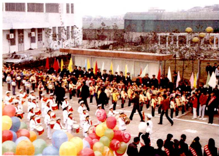
余姚人民隆重庆祝 万门程控电话开通