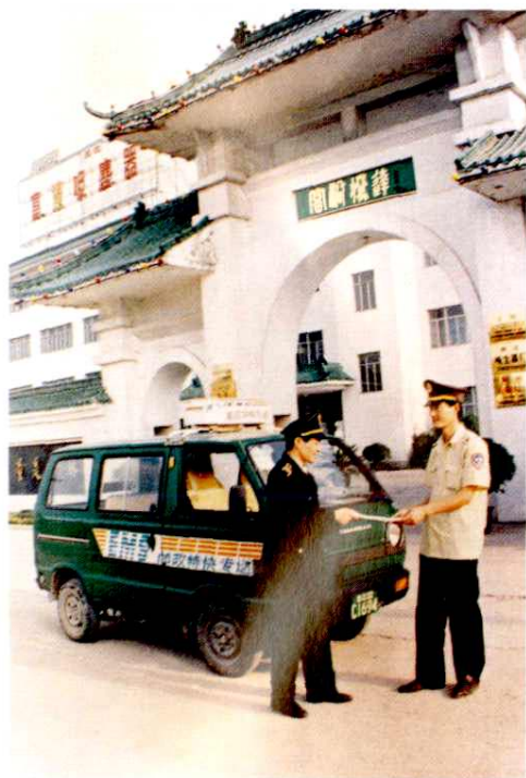
特快专递业务迅速发展