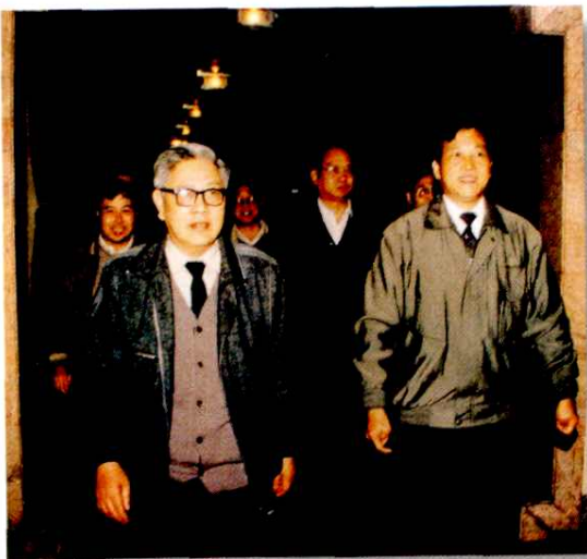
原邮电部副部长宋直元在 市委书记徐杏先陪同下视 察余姚电信大楼