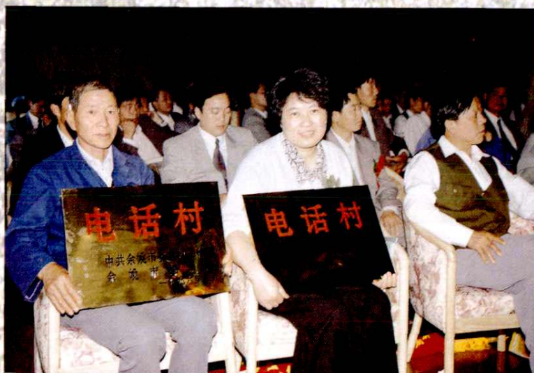
大力发展电话村、 努力创建电话市