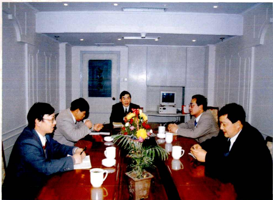
邮电合营前，余姚邮电局领导研究合营方案