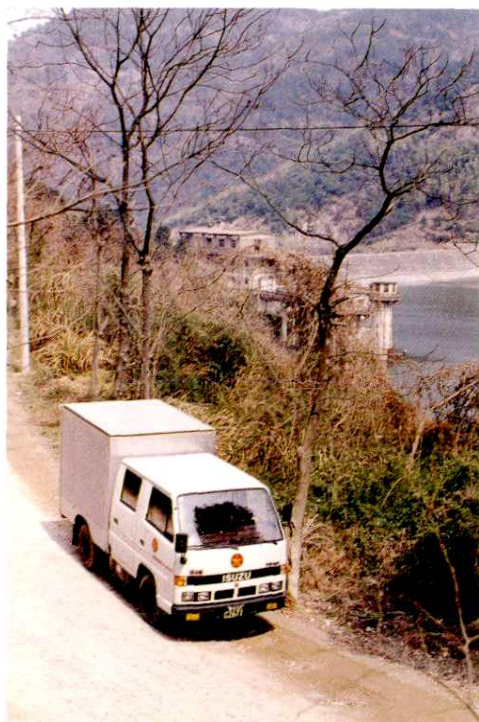
汽车邮路遍布全市