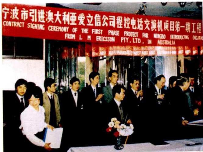
一九九一年余姚开始引进程控电话。图为设备签字仪式