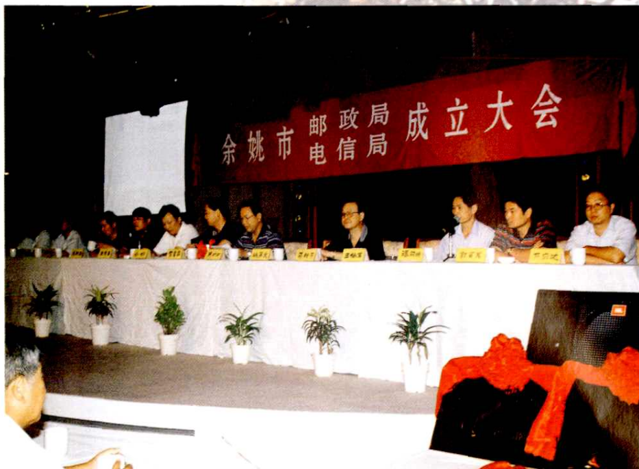
1998年9月邮电分营余姚市邮政局余姚市电信局正式成立