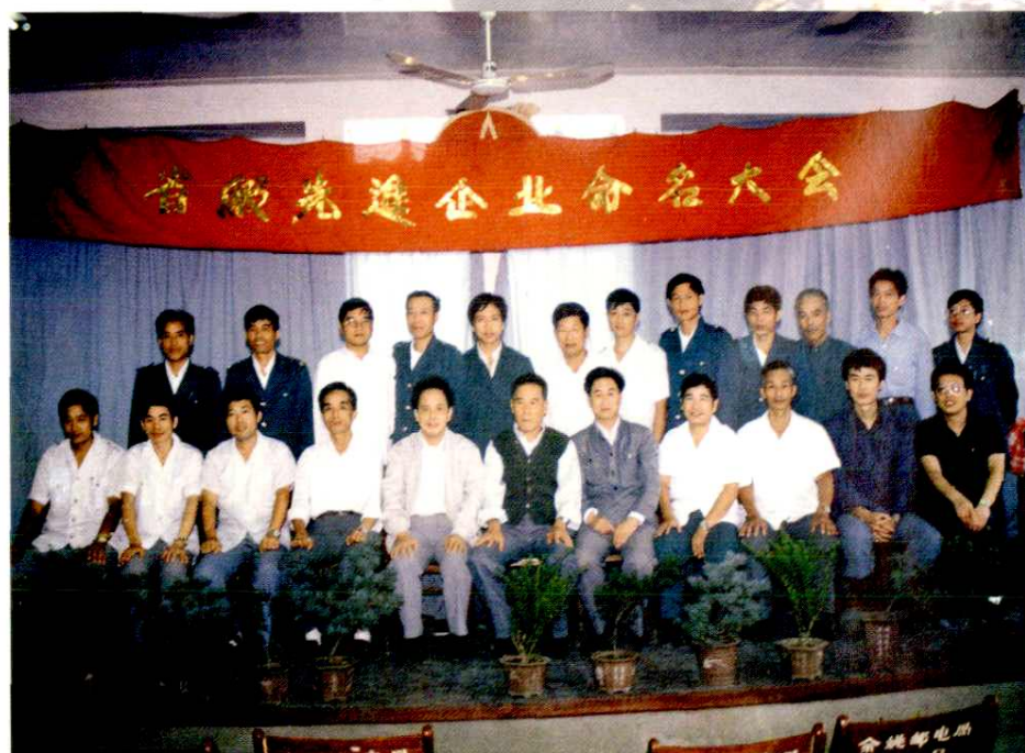
参加省级先进企业命名大会的省局、宁波局领导与余姚局干部合影