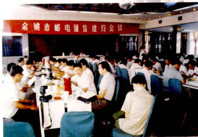
市政府为发展通信事业多次召开全市通信建设会议