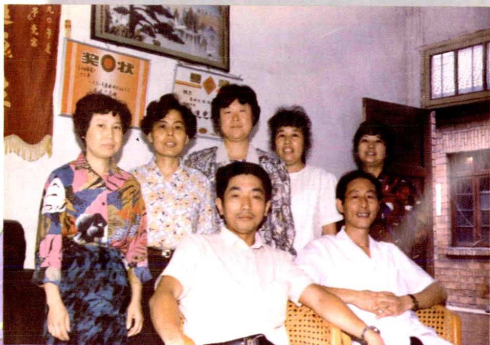
1991年，省邮电系统“先进党支部”全体党员