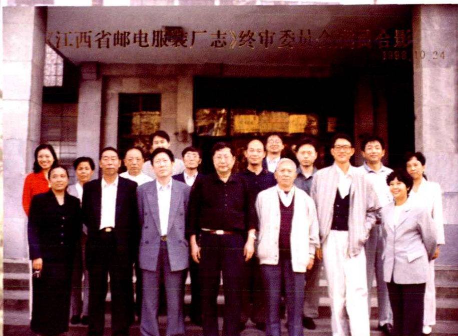
《江西省邮电服装厂志》终审委员会成员合影