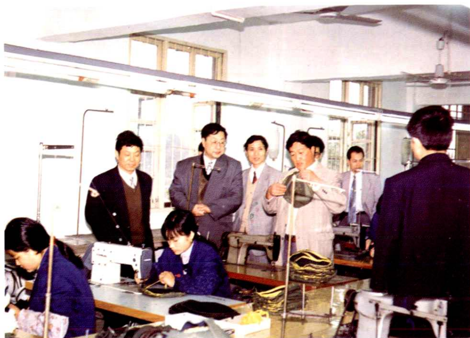
邮电部劳资司、省局劳资处、公司领导视察工厂