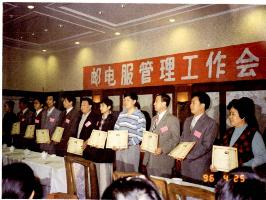
1996年，邮电部召开邮电服管理工作会