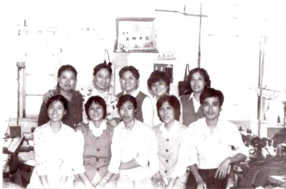
1985年，省邮电系统“六好集体”全体成员