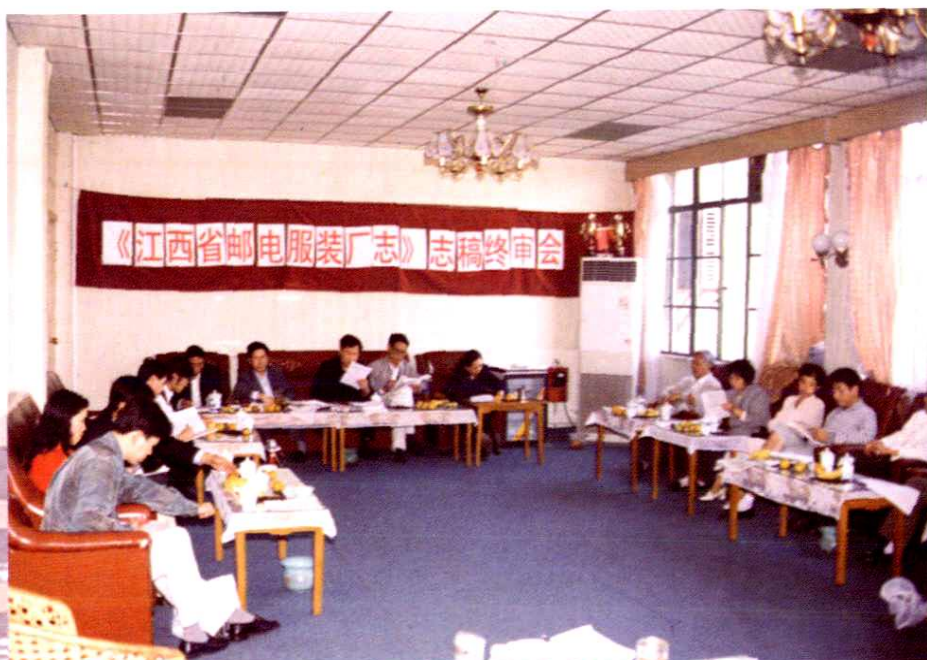
《江西省邮电服装厂志》稿终审会现场