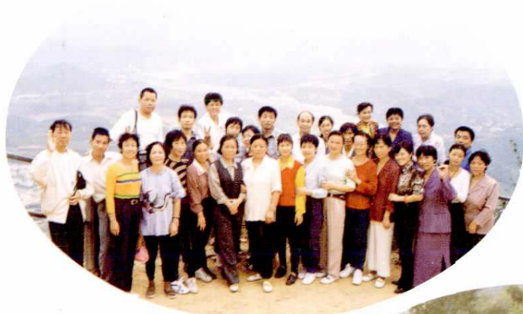
工会组织职工到五夷山春游