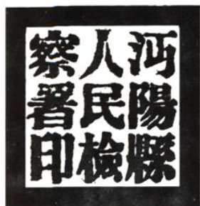
1954年 沔阳县人民檢察署印模