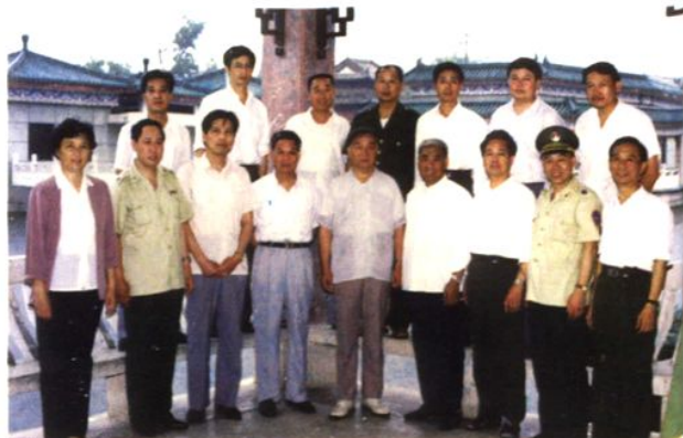
1992年6月16日，最高人民检察院副检察长王文元（前排中）来荆州视察工作