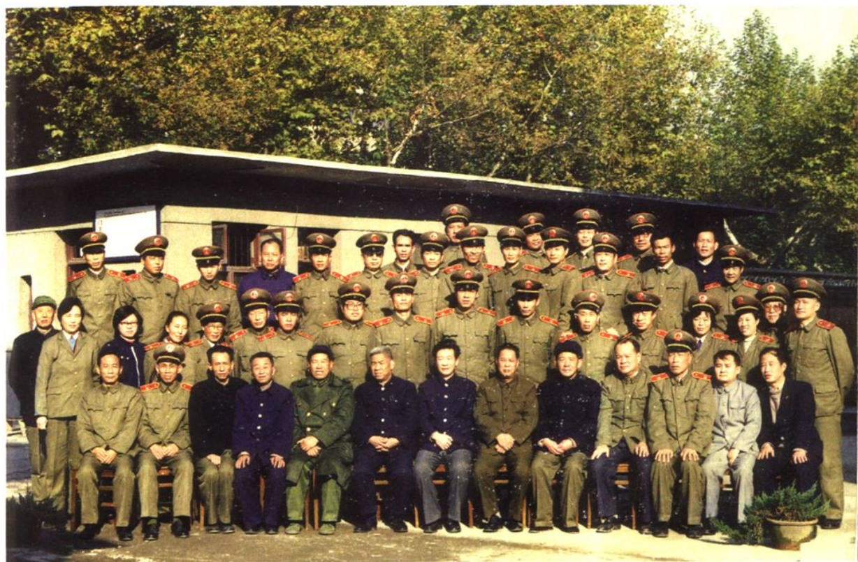
1987年10月，最高人民检察院副检察长梁国庆（前排中）视察荆州时与部分检察干警合影