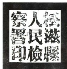
1954年松滋县人民檢察署印模