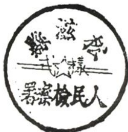
1954年 松滋县人民檢察署印模