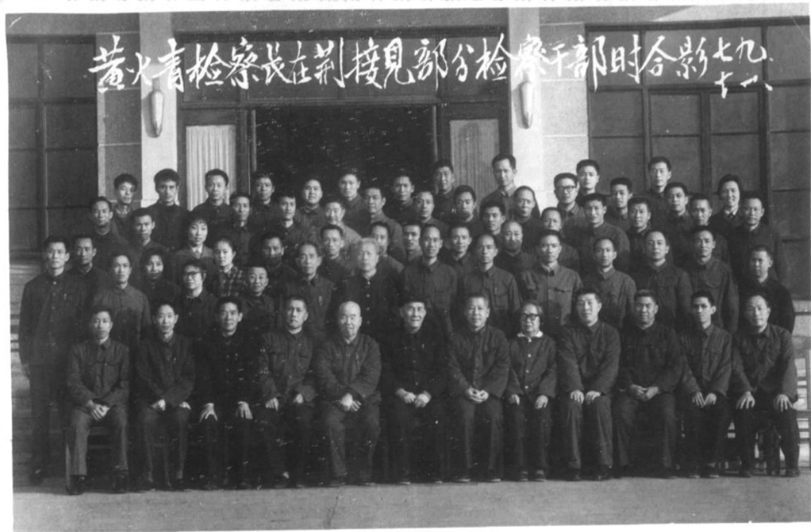
1979年11月，最高人民检察院检察长黄火青（前排左六）视察荆州时与全区检察长及部分检察干部合影（前排左五为省检察院检察长古博，前排右六为中共荆州地委副书记赵富林）