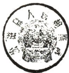
1955年 松滋县人民檢察院印模