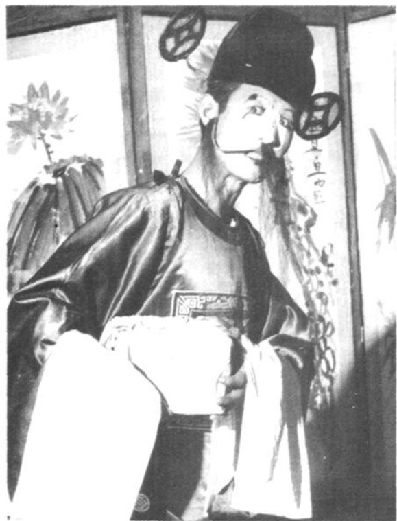
淮海戏人物造型(三)