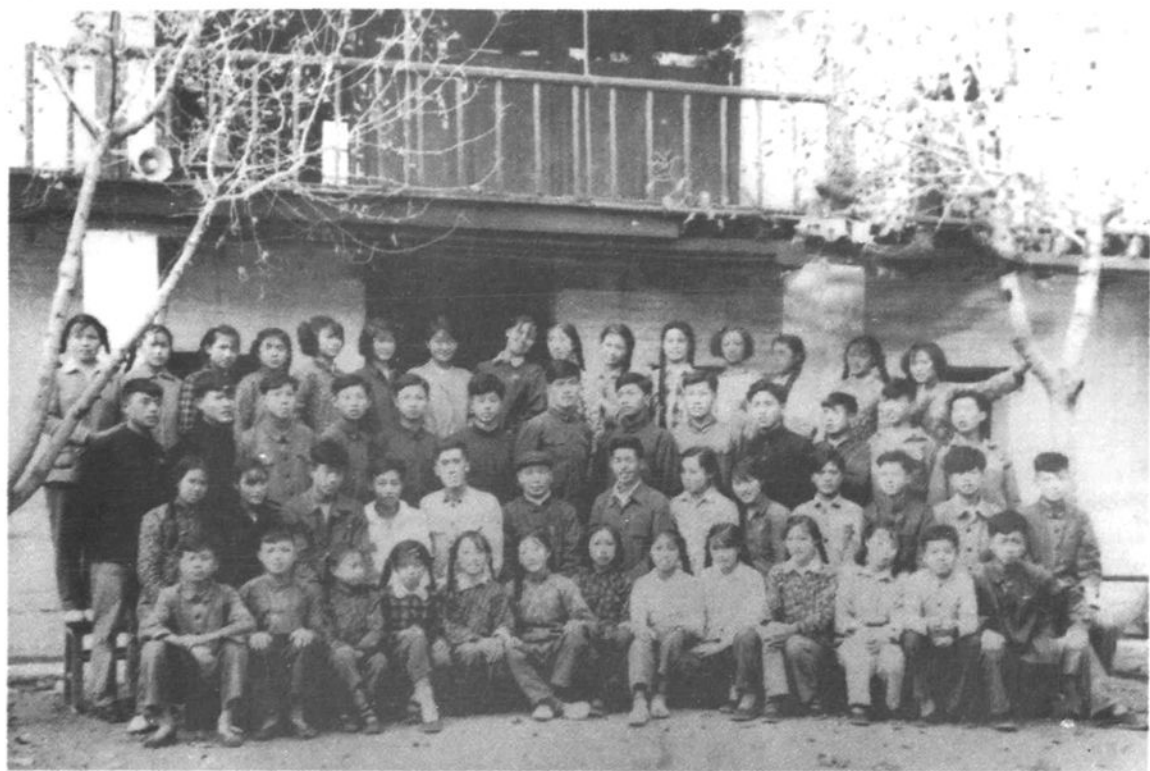
原新海连市戏剧学校淮海戏班师生合影