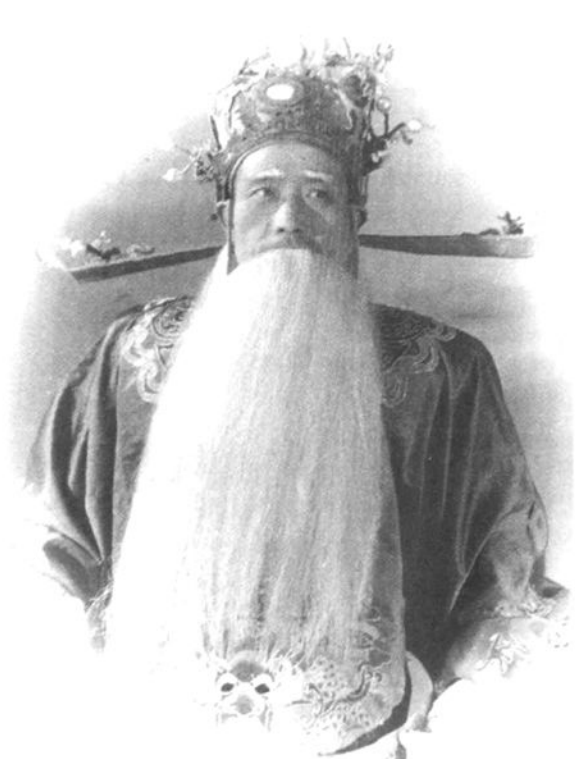
淮海戏人物造型(四)