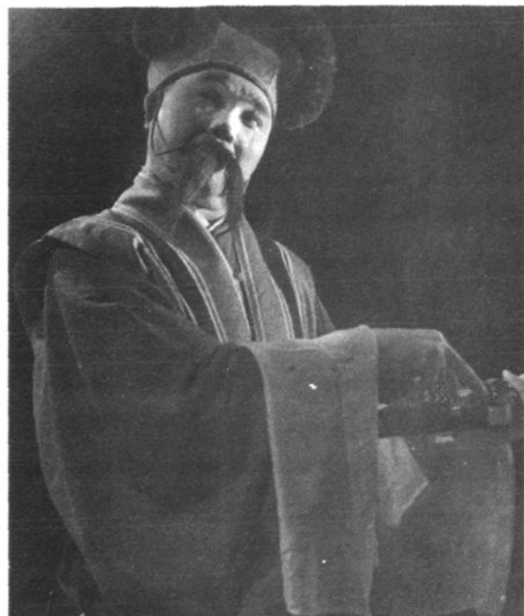
淮海戏人物造型(一)