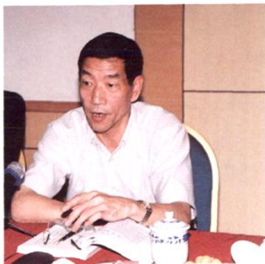
▲ 方金贵同志原任中共余杭市委常委、市纪委书记，曾任中共余杭市委副书记兼区政法委书记，现任临安市政协主席。