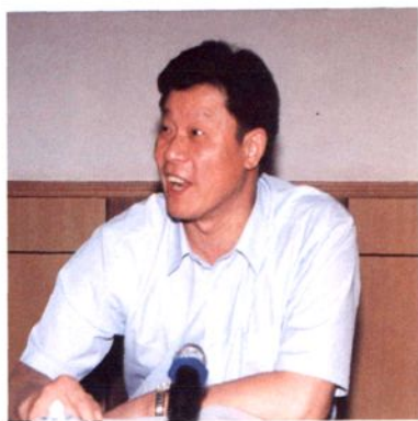
▲ 洪吉根同志原任中共余杭县委常委、县纪委书记，曾任中共余杭市委副书记、市长。现任浙江国际信托投资公司党委书记、总经理