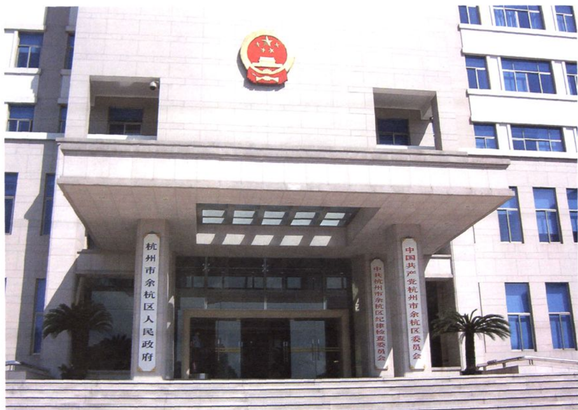
▲ 余杭区纪委、监察局办公楼(10—11层楼)