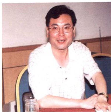
▲ 汪宏儿同志现任中共杭州市余杭区委副书记、区纪委书记。