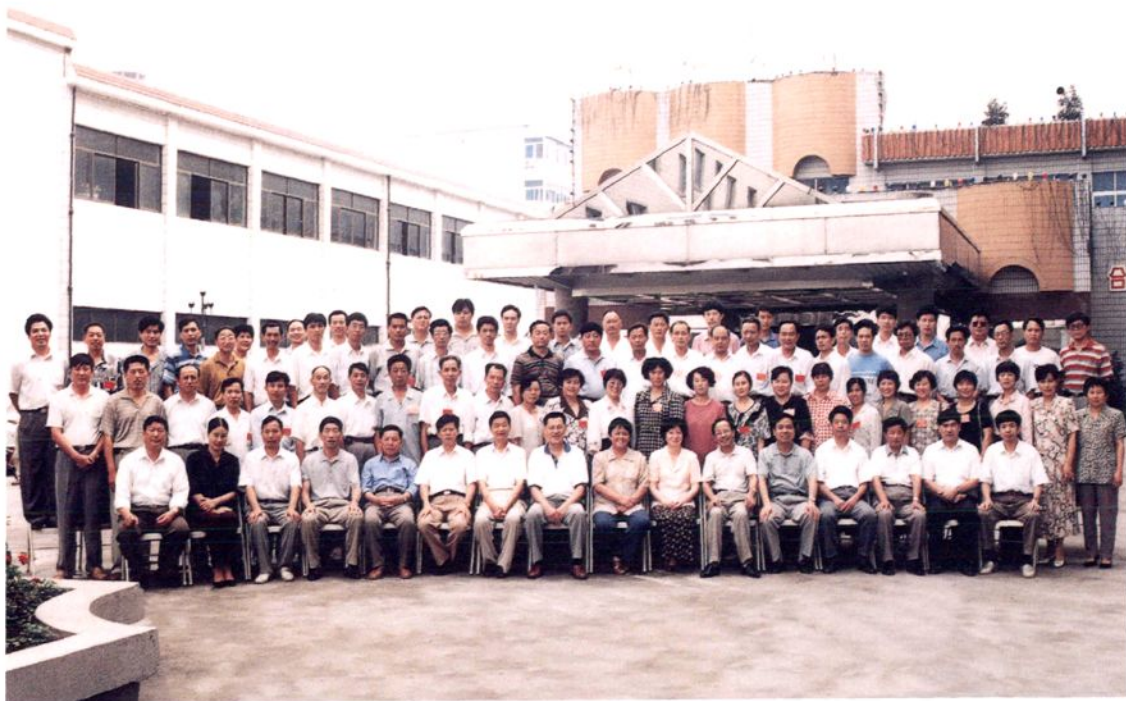
▲ 全国部分县(市、区)第七次纪检监察工作联谊会在余杭召开。