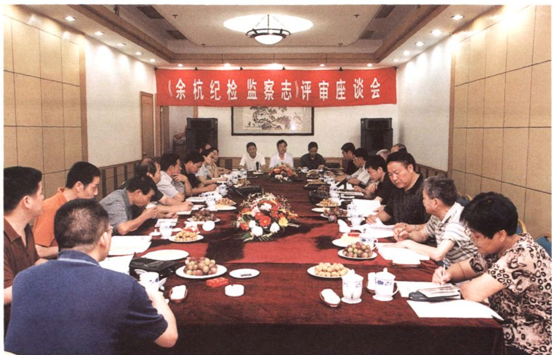
▲ 《余杭纪检监察志》评审座谈会会场。