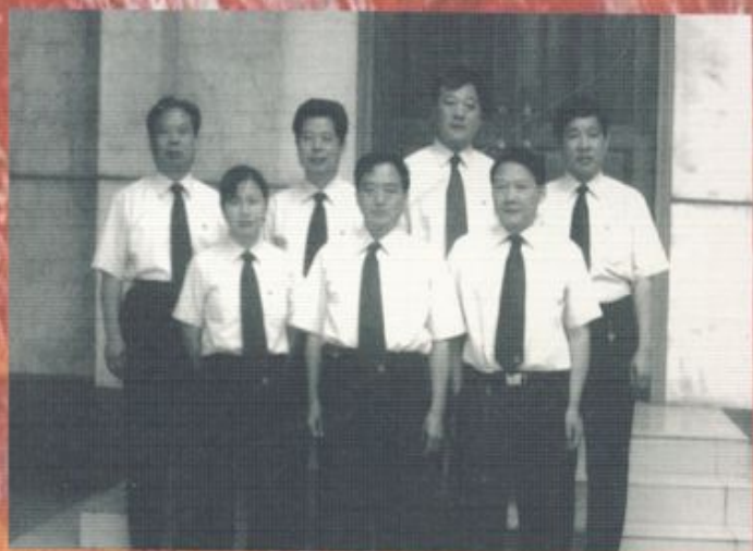
平顶山煤矿机械厂志编纂小组成员合影