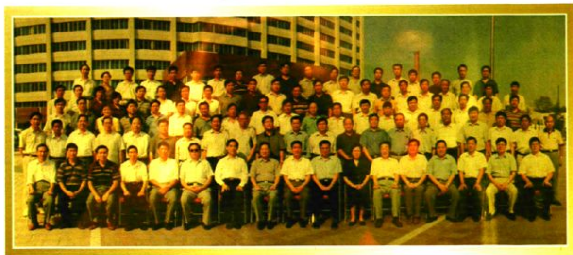
现任政治局常委、国务院副总理时任河南省省长李克强1998年会见中央煤炭下放企事业单位负责人 (第三排左起第4位平煤机厂长钟东虎)