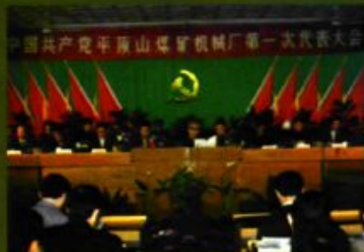
1991年5月10日，中国共产党平顶山煤矿机械厂第一次代表大会会场。