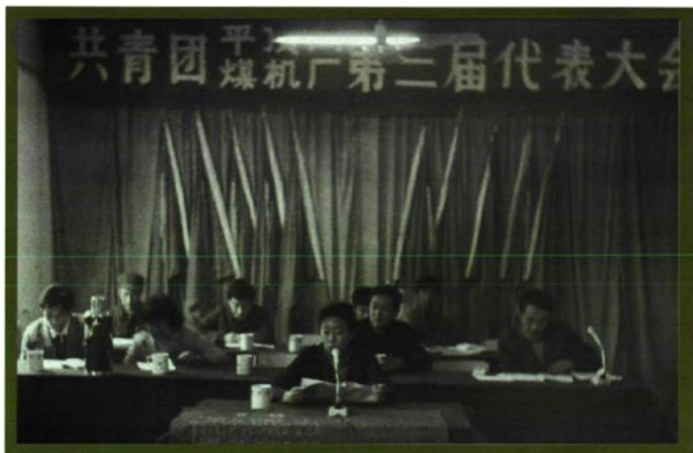
共青团平顶山煤矿机械厂第三届代表大会会场