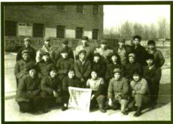
度机 先加 进工 小车间 组在 老车 厂工 办二 公组 楼荣 获 1973 年 影