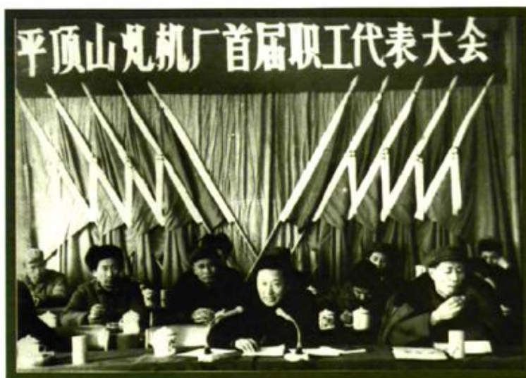
1983年12月28日平顶山煤矿机械厂首届职工代表大会会场