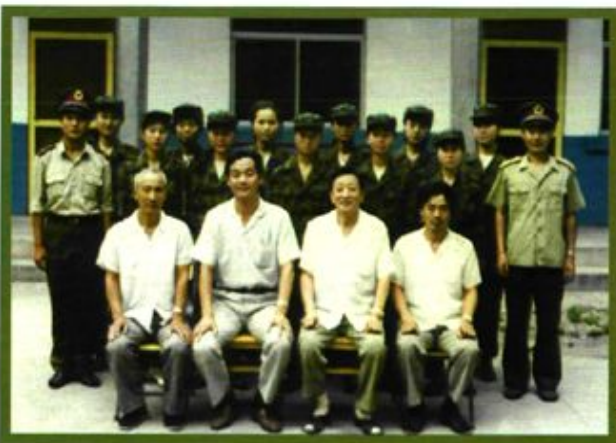
1981年，厂领导与女子基干民兵班合影。