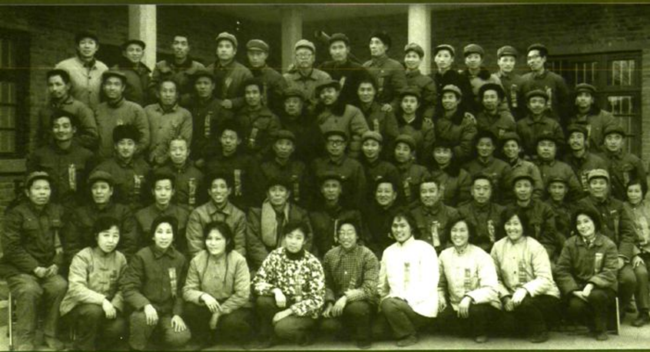
1982年12月28日，平顶山煤矿机械厂首届职代会全体代表合影。