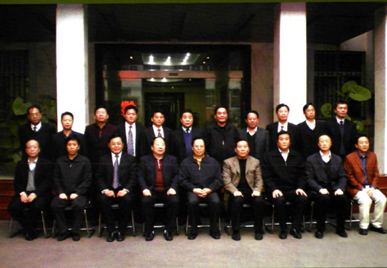
2006年6月河南省省委书记徐光春等省领导会见平煤机、郑煤机企业负责人