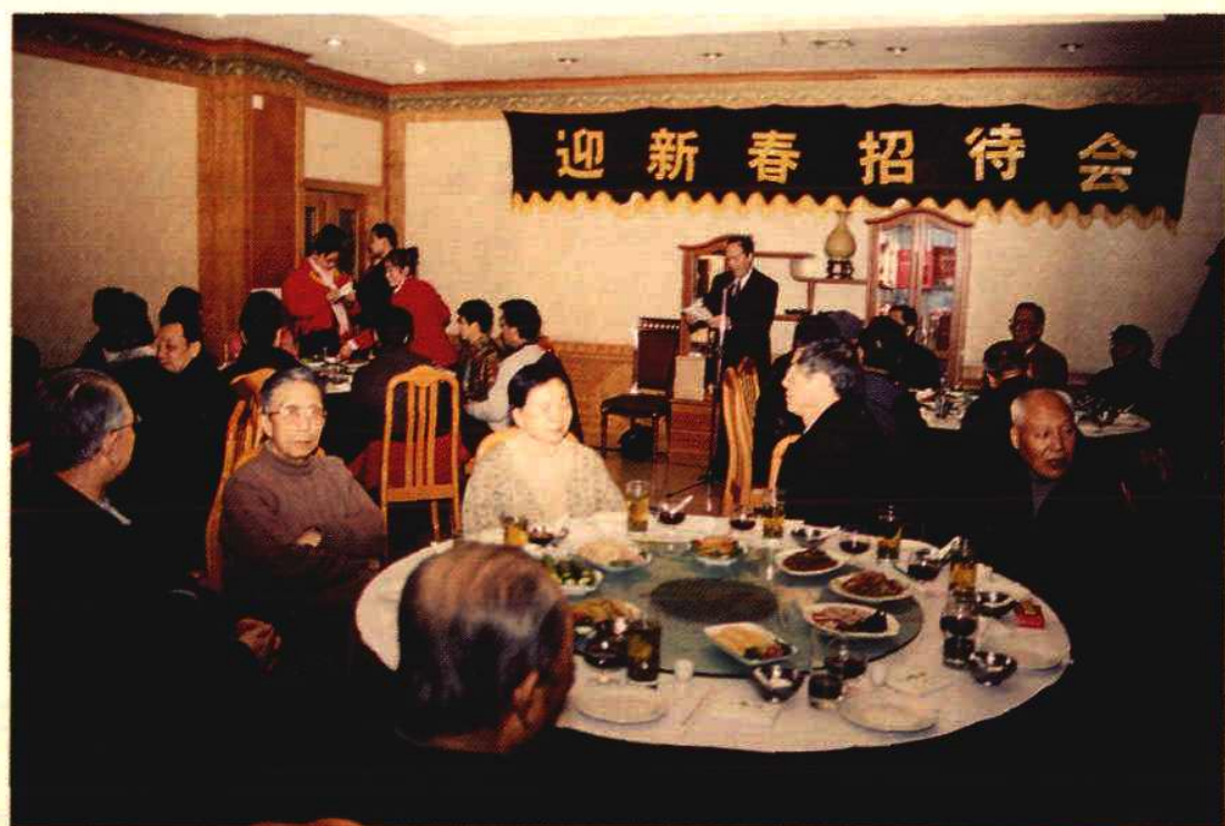
2003年1月29日,自治区党委统战部、自治区办公厅在银川万隆州大酒店,举行参事、文史馆员迎新春招待会,自治区领导冯炯华、马占山出席招待会。图为冯炯华副主席在招待会上致词。