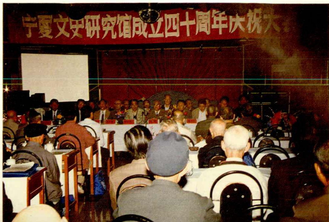
1993年9月22日至24日，本馆成立40周年庆祝大会在宁夏电力宾馆召开，自治区领导黄璜、马思忠、刘国范、程法光、吴尚贤、全开锦到会祝贺。图为庆祝大会开幕式。