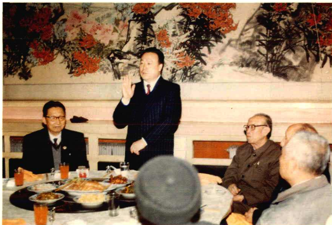
1993年2月25日至27日，全体馆员年度会议在宁夏宾馆召开，自治区政府主席白立忱、自治区政协副主席吴尚贤到会看望并设宴招待馆员。图为白立忱主席在宴会上致词。