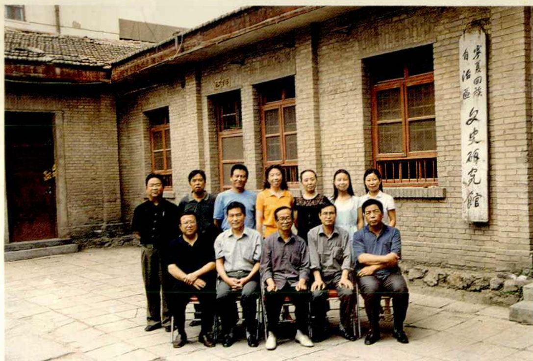
本馆全体在职工作人员合影(2003.7)