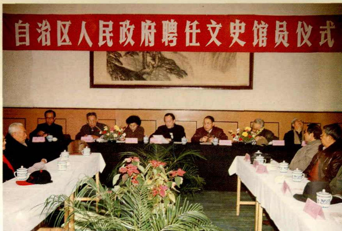
2000年1月28日,自治区政府在宁夏宾馆礼堂举行聘任文史馆员仪式,自治区政府副主席冯炯华受马启智主席委托,向新聘的7位馆员颁发了聘任书,并发表讲话。