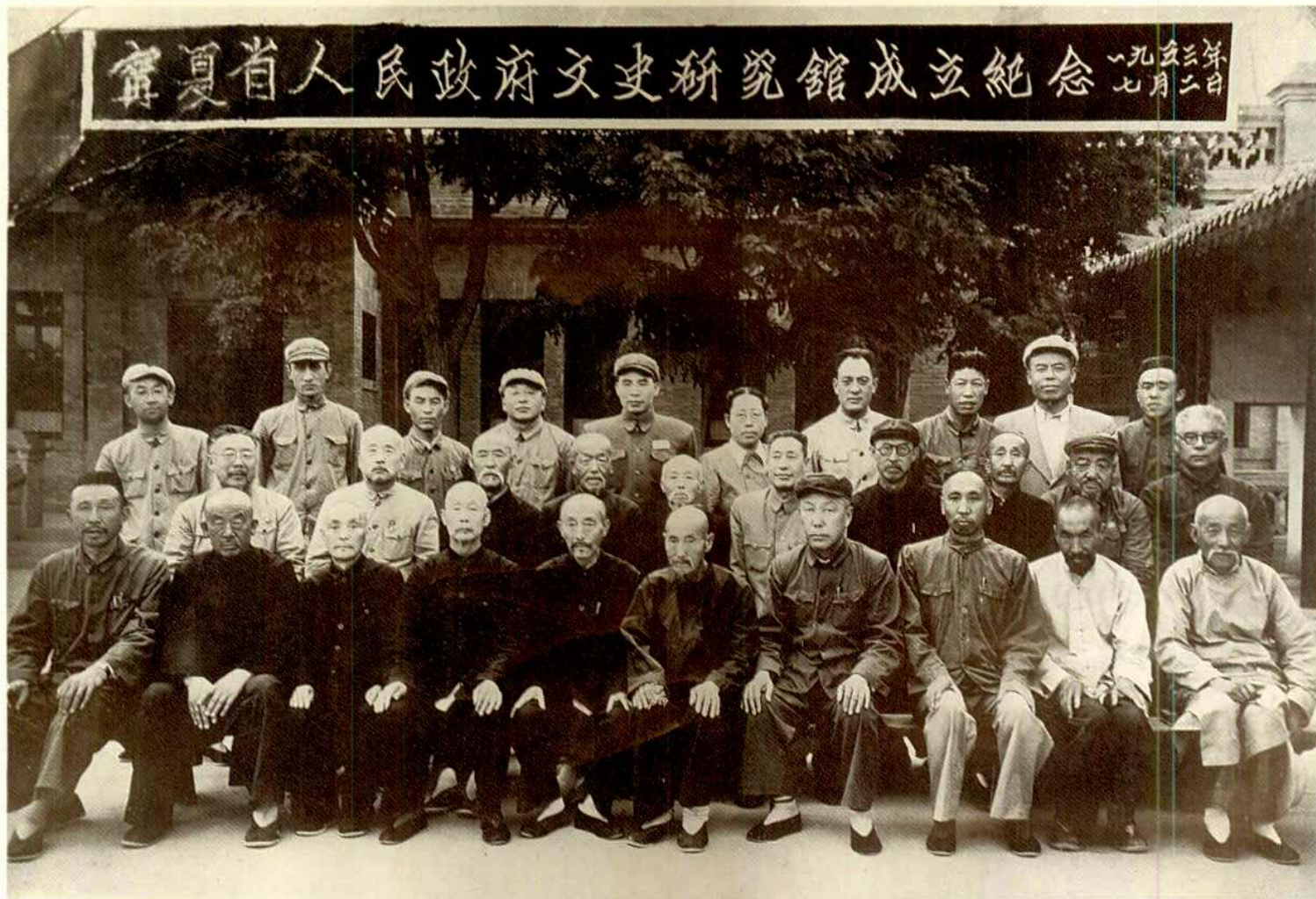
1953年7月2日,宁夏省人民政府文史研究馆正式成立。省政府主席邢肇棠(二排右五)、省委副书记黄罗斌(三排左五)、省政府副主席马腾霭(三排右四)、省协商委员会副主席徐宗孺(二排左二),以及有关部门负责人到会祝贺。图为成立纪念合影。