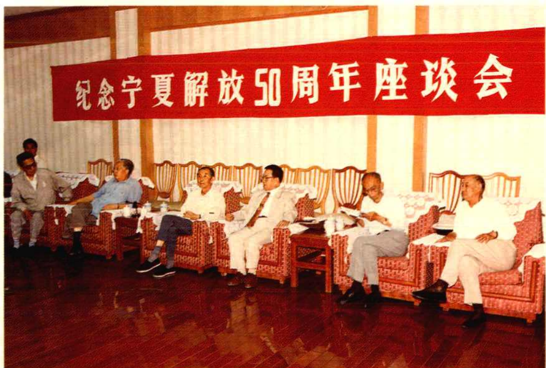
1999年9月8日,本馆在宁夏宾馆接待厅召开纪念宁夏解放50周年座谈会。