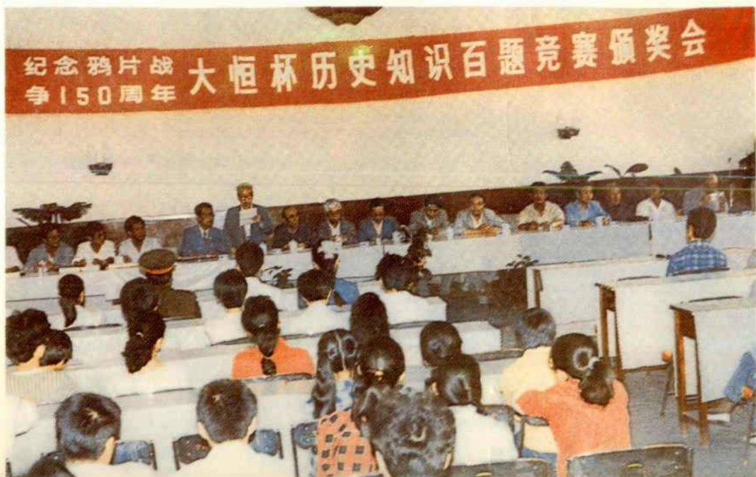
1990年5月至8月,本馆与银川晚报社联合举办纪念鸦片战争150周年“大恒杯”历史知识百题竞赛活动。图为颁奖会场面。