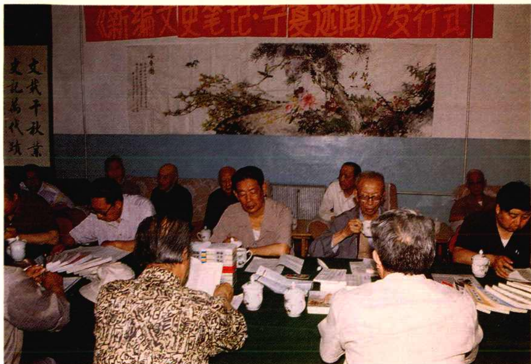
1994年10月,本馆主编的《宁夏述闻》作为《新编文史笔记丛书》第4辑中的一册,由上海书店出版发行。图为1995年6月8日,本馆在会议室举行发行式。