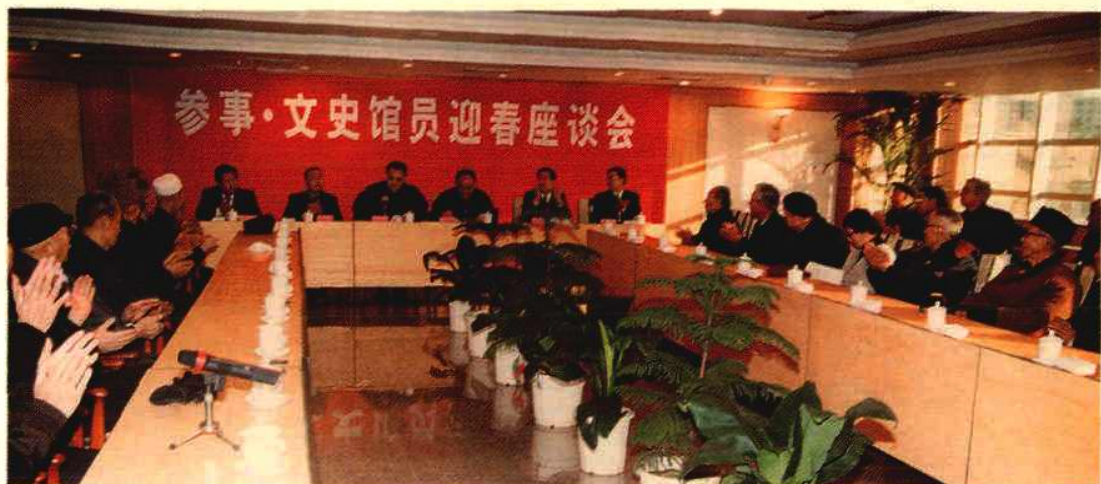
1999年2月12日,自治区党委统战部、自治区政府办公厅在宁夏人民会堂召开参事、文史馆员迎春座谈会,自治区领导毛如柏、马启智、马文学、周生贤、刘仲、周文吉出席座谈会。毛如柏书记和周生贤副主席分别在座谈会上发表讲话。