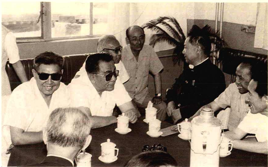
1984年本馆恢复工作后，于11月24日至27日在宁夏宾馆召开首次工作会议。图为会议期间，自治区领导黑伯理、郝廷藻、丁毅民及有关部门负责人与馆领导和馆员亲切交谈，共商文史馆发展大计。