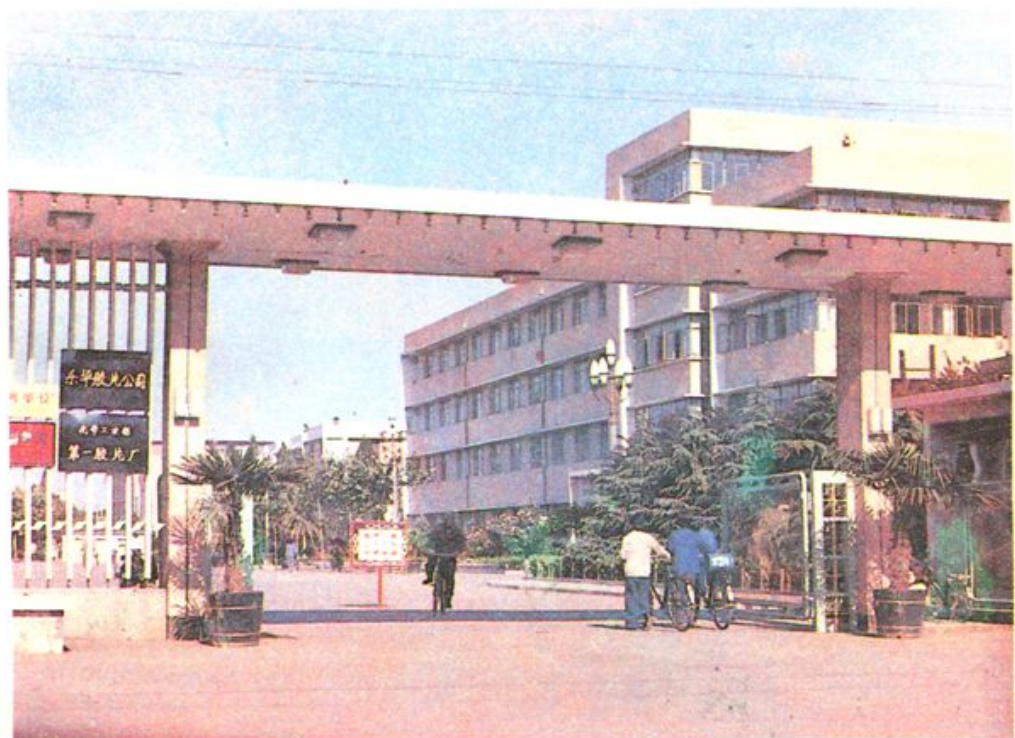
化学工业部第一胶片厂