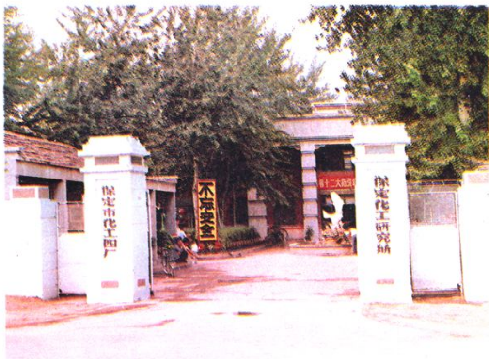
保定市化工四厂。 保定市化工研究所。