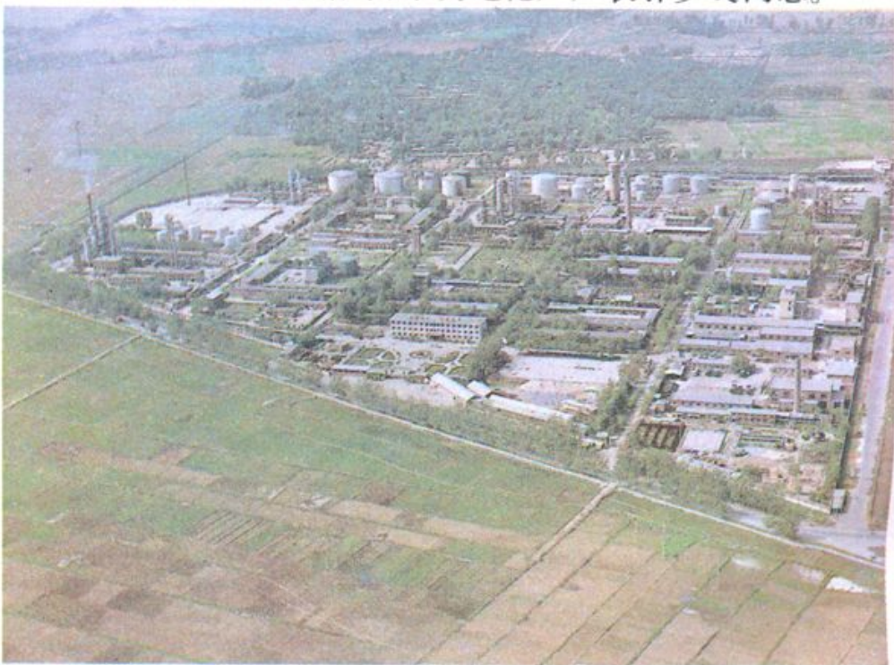
保定石油化工厂鸟瞰图