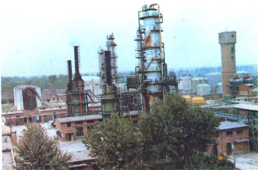
保定石油化工厂常减压装置