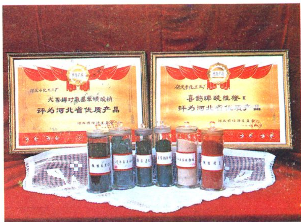
保定市化工三厂生产的染料及中间体。