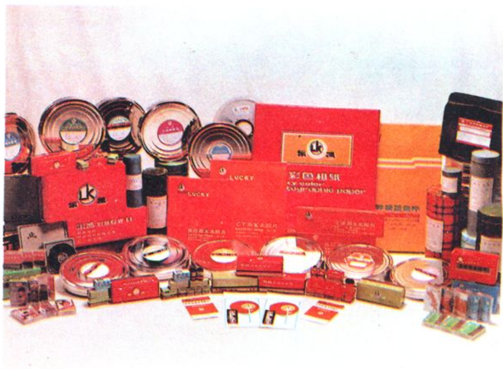
化工部第一胶片厂“乐凯”系列产品