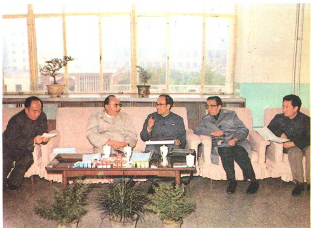
人大常委会副委员长赛福鼎由保定市市长田福庭 (右二) 陪同视察化工部第一胶片厂。