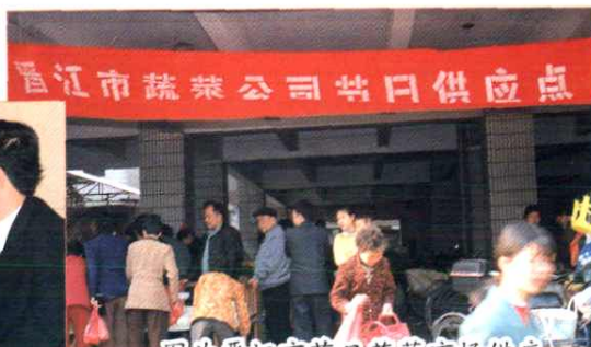
图为晋江市节日蔬菜市场供应