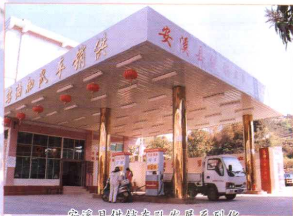
安溪县供销社车队发展系列化服务的加油站