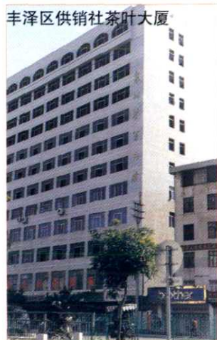
丰泽区供销社茶叶大厦