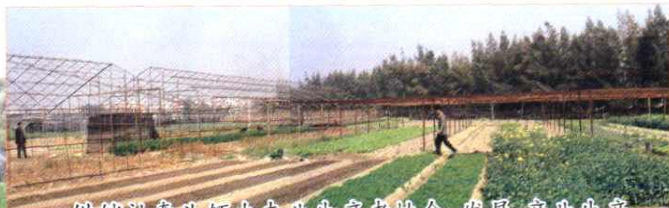
供销社牵头领办专业生产者协会,发展产业生产,推进农业结构调整,增加农民收入。图为蔬菜生产基地