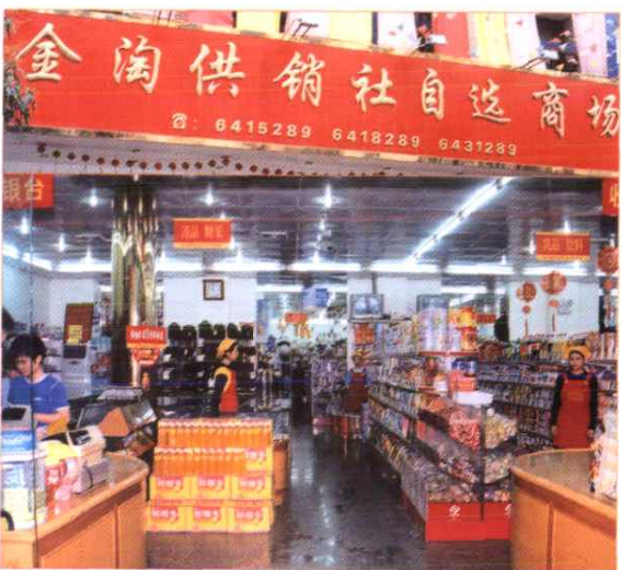
图为南安市金淘供销社自选商场