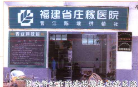
图为晋江市陈埭供销社庄稼医院