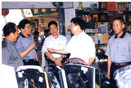
泉州市政府副市长黄维礼(右二) 到石狮市祥芝供销社调研