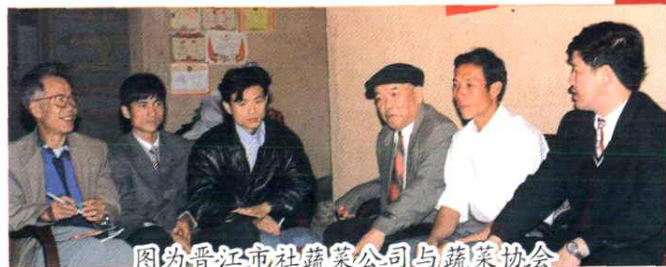
图为晋江市社蔬菜公司与蔬菜协会领导研究生产计划