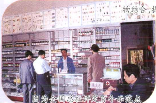
图为全国总社评定百个示范点之一的安溪县新溪供销社庄稼医院