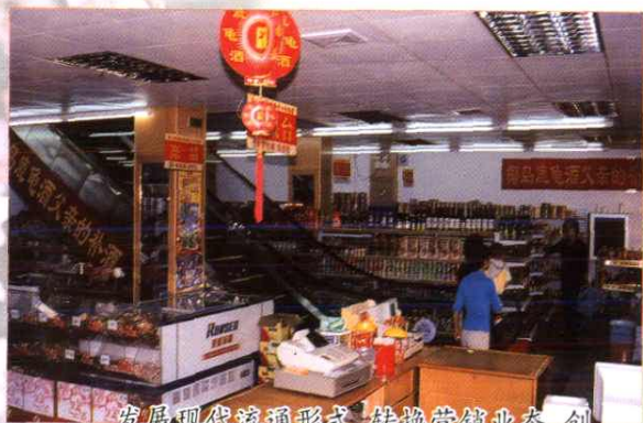
发展现代流通形式,转换营销业态,创办超市、自选商场。图为南安市诗山供销社购物中心