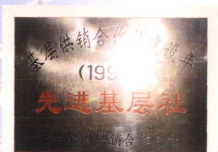
晋江市青阳供销社获全国总社“先进基层社”称号