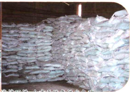
坚持服务“三农”，组织化肥淡季储备，全市系统年供应各种化肥 20 多万吨，保证农业生产需要