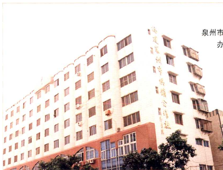
泉州市供销合作社 办公大楼