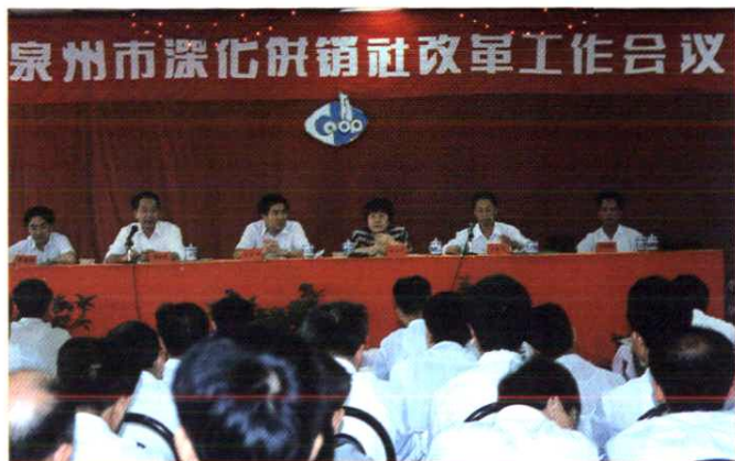
1995年6月14日~15日,泉州市委、市政府召开 全市深化供销社改革工作会议