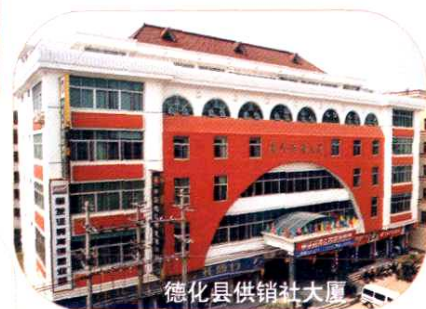
德化县供销社大厦