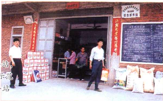
基层社延伸服务平台,创办村级综合服务站,方便农民生产、生活。图为全国总社评定百个示范单位之一的安溪县金谷供销社洋内村综合服务站