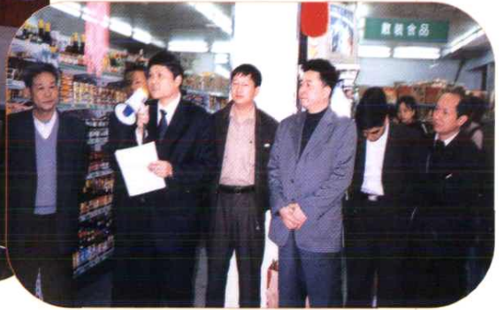
省联社在泉州召开现场会。图为参观南安市基层社创办的超市