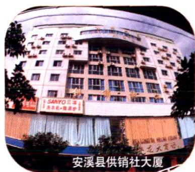
安溪县供销社大厦