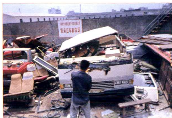
市再生资源公司报废汽车解体场