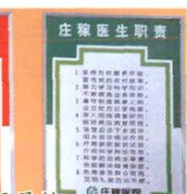
供销社规范庄稼医院建设，开展技