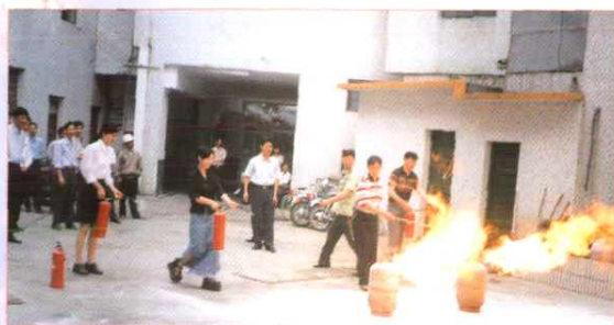
开展消防演练。图为南安市召开的消防演练现场会