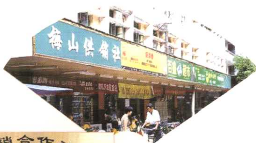
南安市梅山供销社被全国总社授予“示范基层社”之一