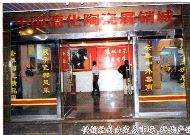
供销社创办交易市场,提供产销见面、系列服务,引导农民进入流通领域。图为德化县供销社创办的陶瓷展销城