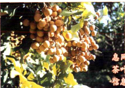
泉州市社建设农产品信息网站,为全市龙眼、柑桔、茶叶等大宗农产品产销提供信息服务