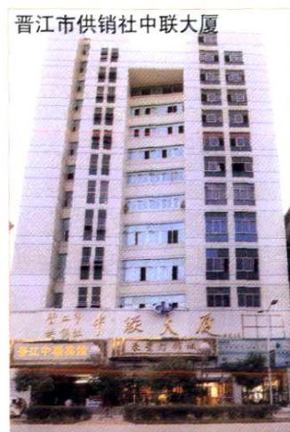
晋江市供销社中联大厦