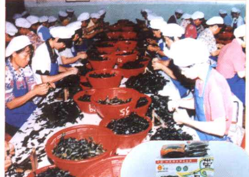
积极参与推进农业产业化，发展公司 + 基地 + 农户的经营形式。图为泉港“鑫盛海洋食品有限公司”生产现场