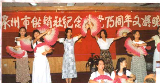
泉州市社机关及直属单位举办“怀念建党75周年文艺晚会”