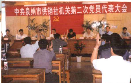
泉州市社机关党委召开第二次党代会