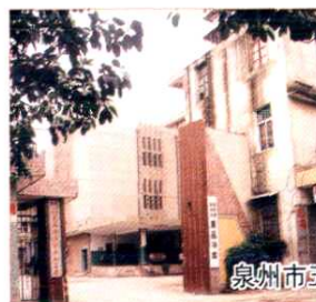
泉州市五丰果品综合冷冻有限公司