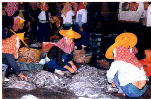
图为惠安县小岞水产品专业市场