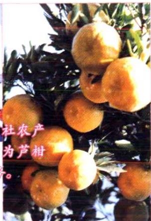
永春县供销社农产品信息服务中心为芦柑促销提供信息服务。