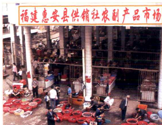
图为惠安县联社农副产品市场