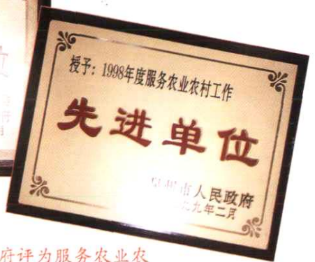
泉州市社多次被泉州市委、市政府评为服务农业农村工作“先进单位”称号