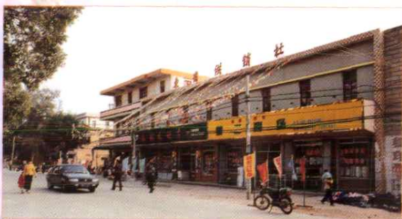
图为惠安县东岭供销社便民超市