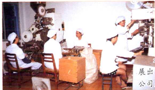
社办工业努力开发研制新产品,发展出口创汇。图为丰泽区泉州市茶叶公司生产现场