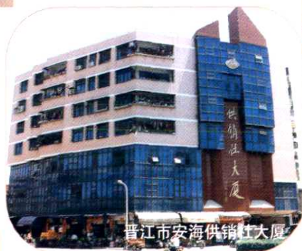
晋江市安溪供销社大厦