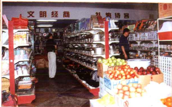
图为晋江市青阳供销社自选商场