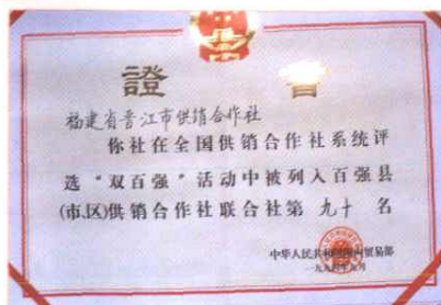
晋江市供销社获全国总社“百强县级市联社”称号