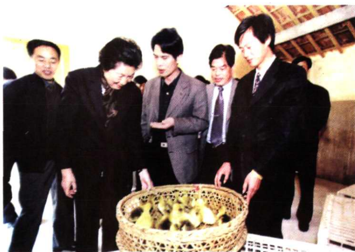
2001年4月26日， 原全国人大常委会副 委员长陈慕华，在区 人大副主任王仁庆的 陪同下，视察钱江水 禽驯养繁殖场。