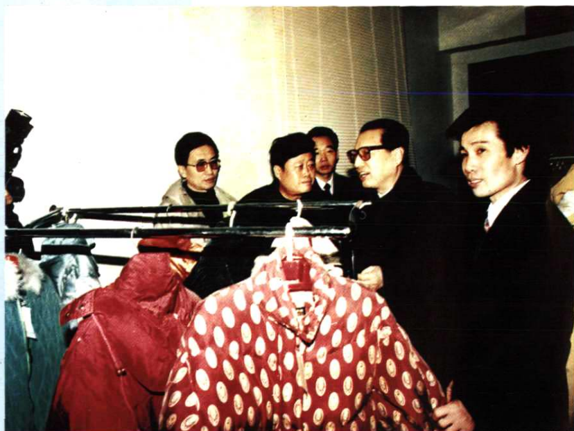
1993年2月， 全国人大常委会 委员长乔石同志 视察浙江北天鹅 集团公司