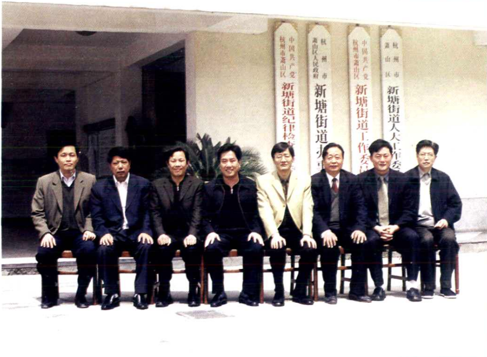
《新塘羽绒志》编纂委员会成员