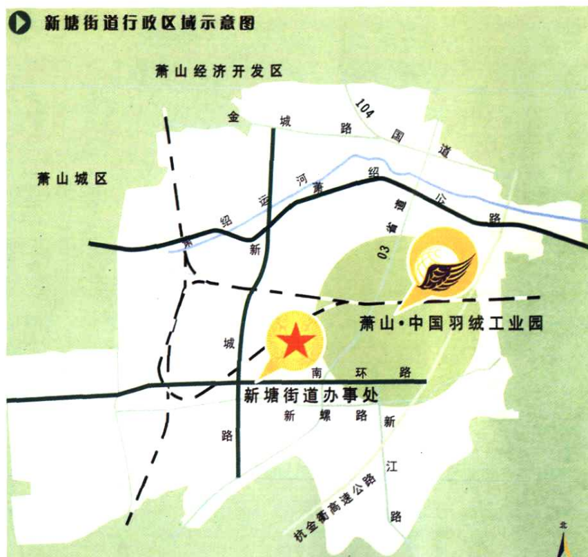
新塘街道行政区域示意图