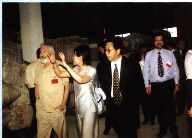
国际羽毛羽绒 局第46届年会与会 代表参观新塘羽绒 企业