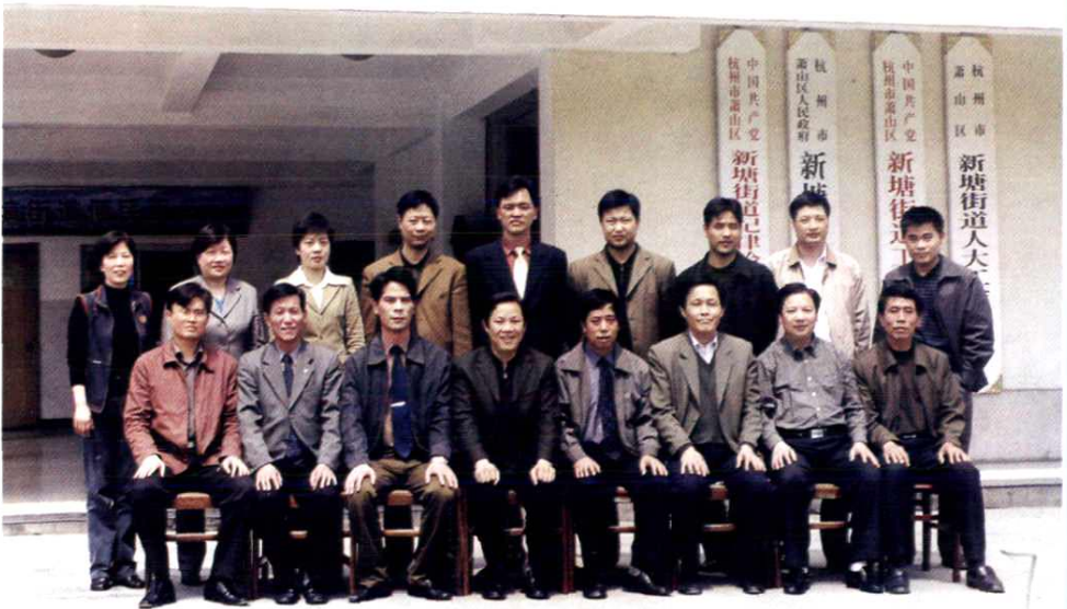
新塘街道办事处经营管理科全体人员