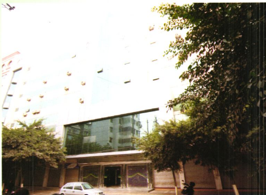
位于胜利北路202号的永川市国家税务局办公大楼