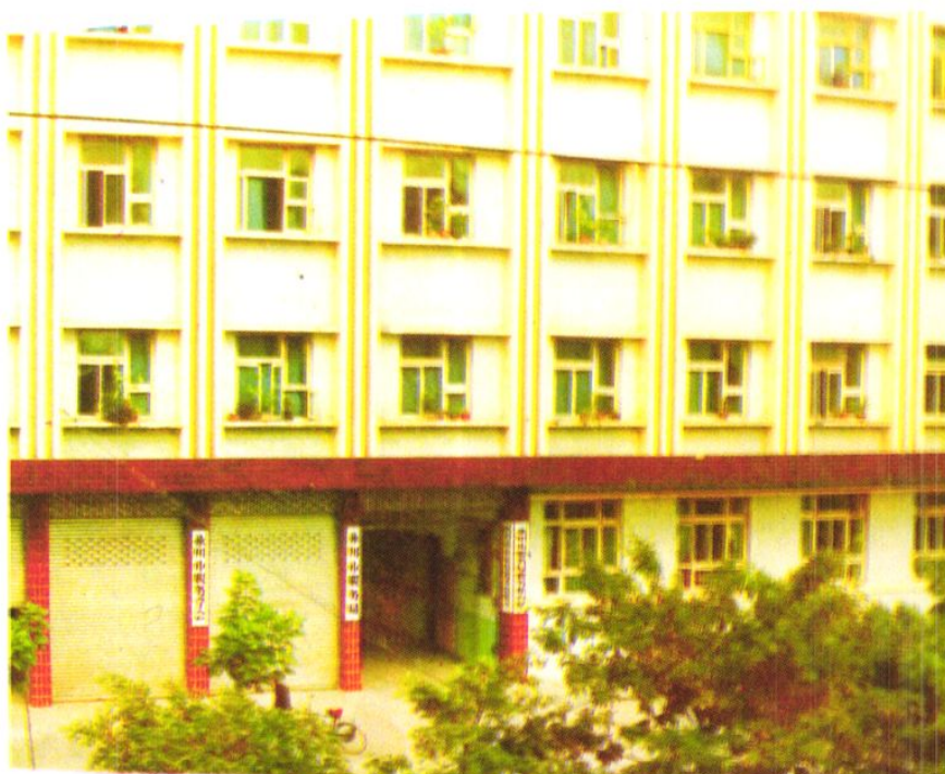
位于玉屏路4号的永川市国家税务局办公大楼 注:摄于国地税机构分设前,2000年8月搬 迁到胜利北路44号,现胜利北路202号