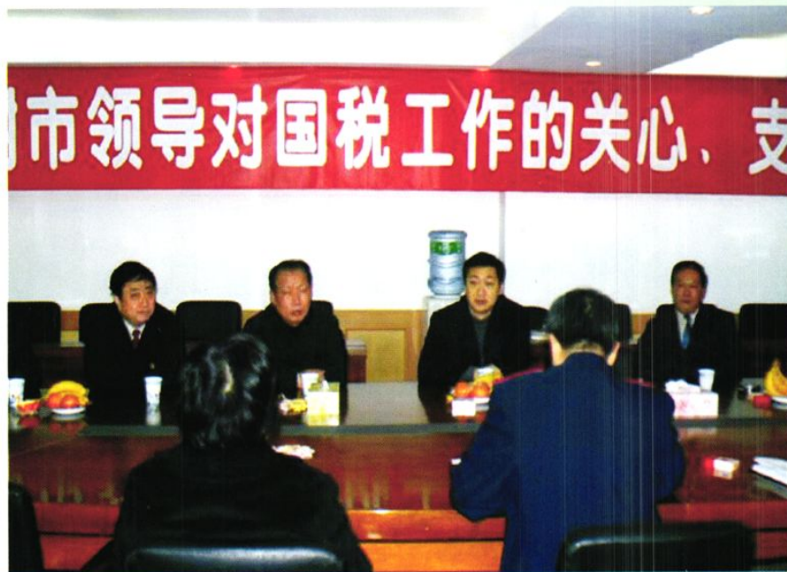
时任永川市委书记刘强(左三)等领导视察国税工作