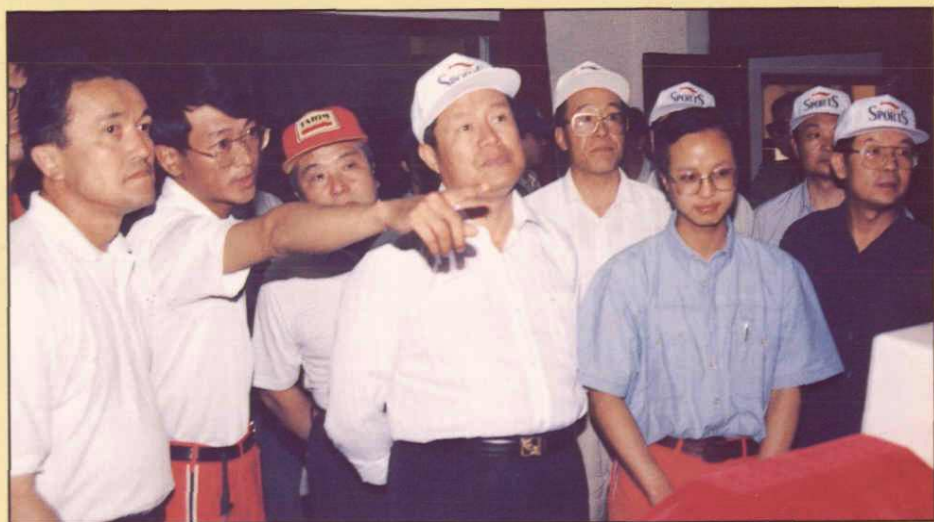
1995年6月26日，中国石油天然气总公司副总经理周永康在东河塘油田视察工作。