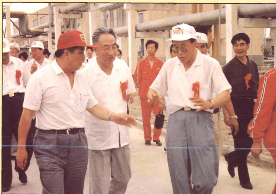
1994年7月12日，中共中央政治局委员、国务院副总理邹家华（中）在邱中建（左）、邱超（右）等同志陪同下，在轮南油田轮一联合站视察工作。