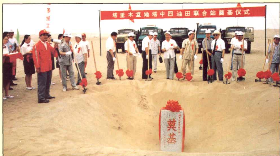
1994年7月12日，邹家华、王恩茂、阿不来提·阿不都热西提、王涛、周永康、邱中建等领导在塔克拉玛干大沙漠腹地，参加塔中四油田联合站奠基仪式。