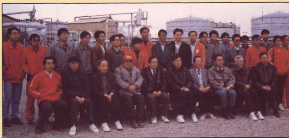
1994年12月25日，中国石油天然气总公司及指挥部部分领导到东河作业区视察工作时与职工合影留念。