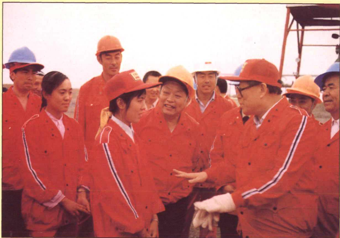
1990年8月23日，中共中央总书记、中央军委主席江泽民在全国政协副主席王思茂，自治区党委书记宋汉良，自治区主席铁木尔·达瓦买提，兰州军区司令员傅全友，国家计委副主任叶青，中国石油天然气总公司总经理王涛等陪同下，视察了轮南油田。图为江总书记正与油气开发公司职工方柯亲切交谈。