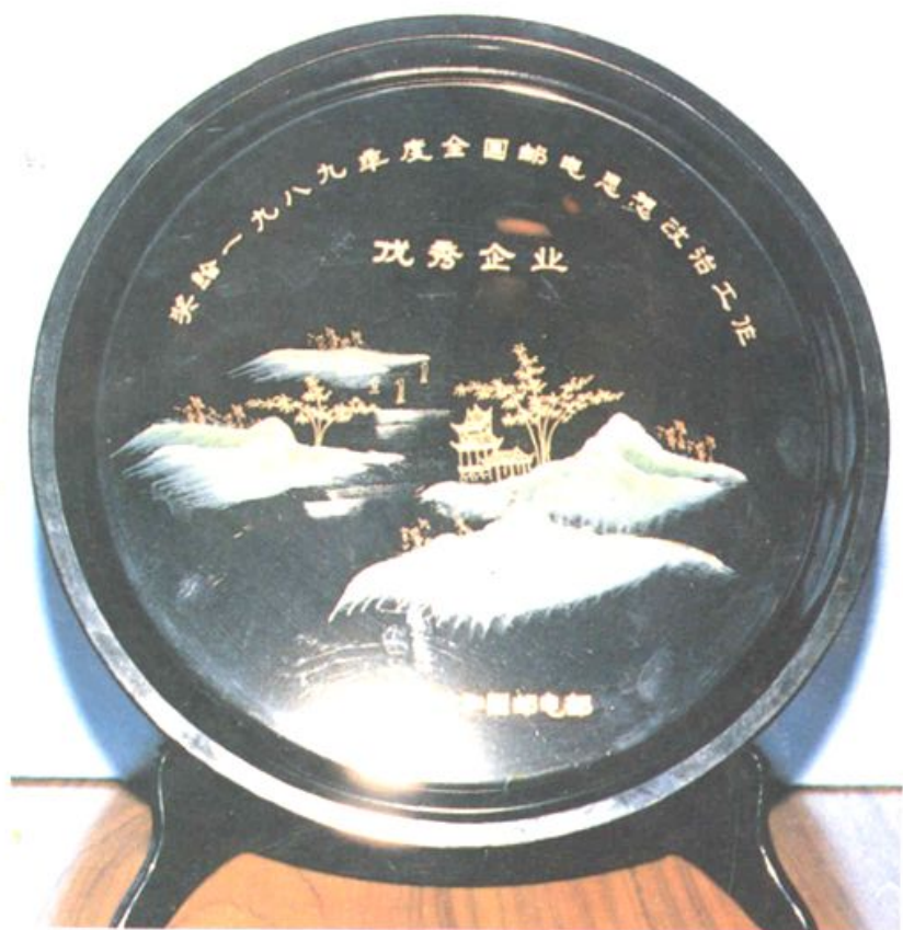
中华人民共和国邮电部授予扎兰屯市邮电局为 “1989 年度全国邮电思想政治工作优秀企业”