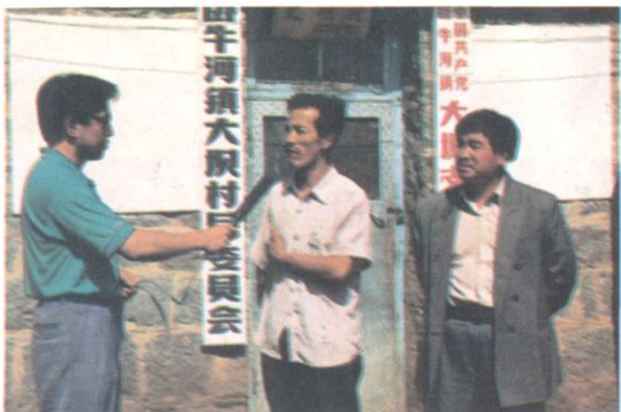
记者采访呼盟第一个电话村—— 扎兰屯市卧牛河镇大坝村村长