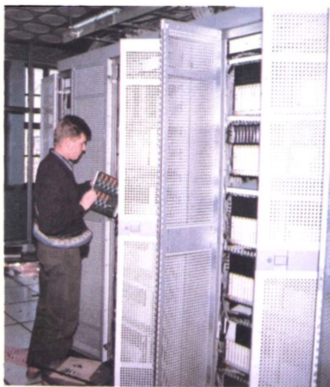
芬兰诺基亚公司专家协助调试程控电话交换机