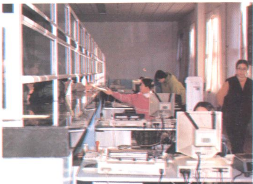
扎兰屯市邮电局邮政电子化营业厅