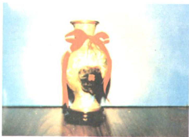
中华人民共和国邮电部授予扎兰屯市邮电局为 1989 年度全国邮电思想政治工作先进集体奖杯