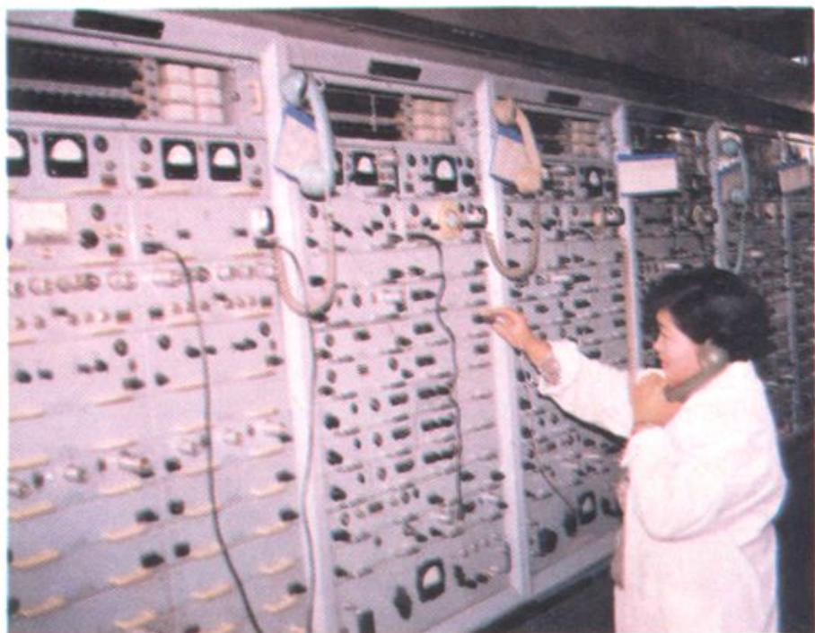
扎兰屯市邮电局载波室