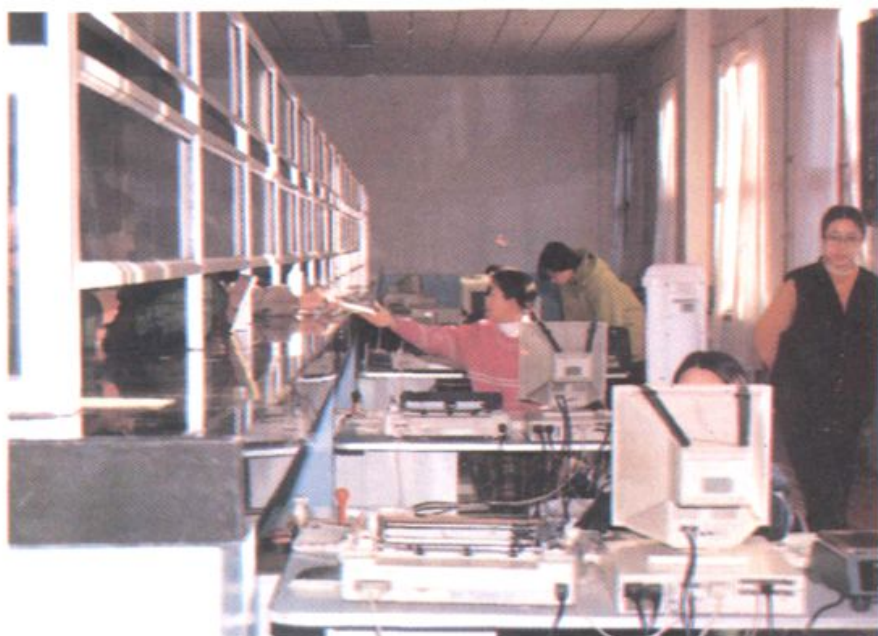
扎兰屯市邮电局邮政电子化营业厅