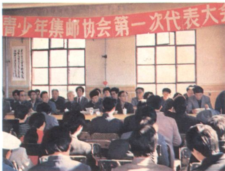
扎兰屯市青少年集邮协会第一届代表大会