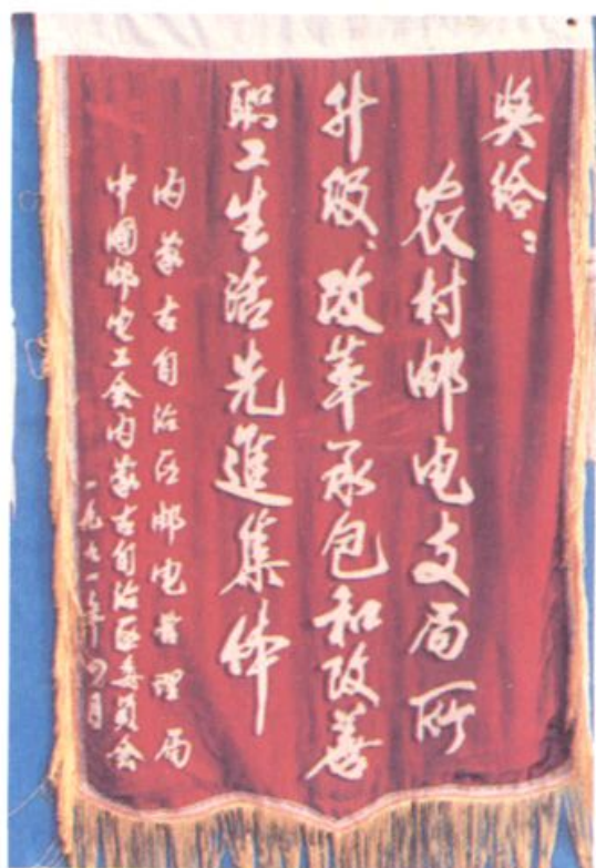
扎兰屯市邮电局“农村邮电支局所升级、改革承包和改善职工生活先进集体”