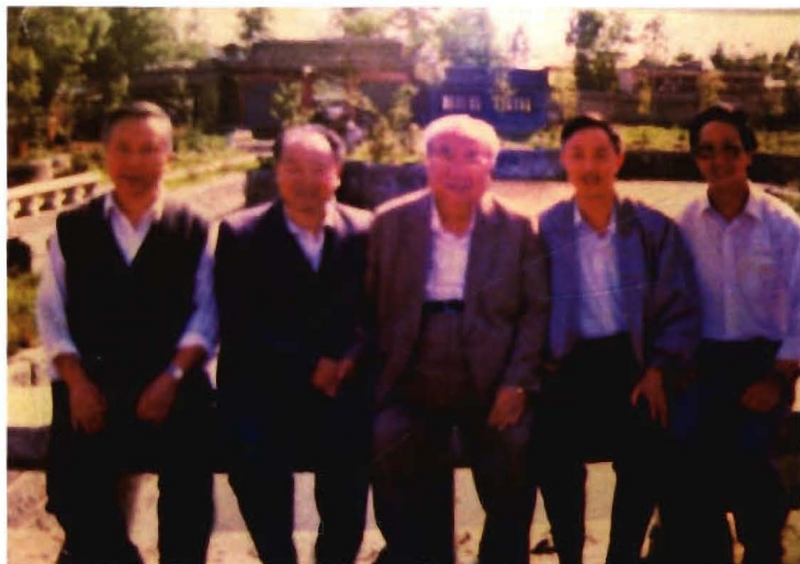
全国人大副委员长、民盟中央主席费孝通（中）参观奢香墓，在奢香博物馆前小憩。