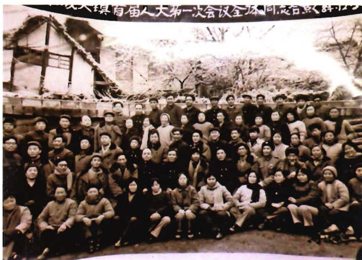
1984年城关镇升格为区级镇，12月30日，首届人大一次会议与会代表合影。