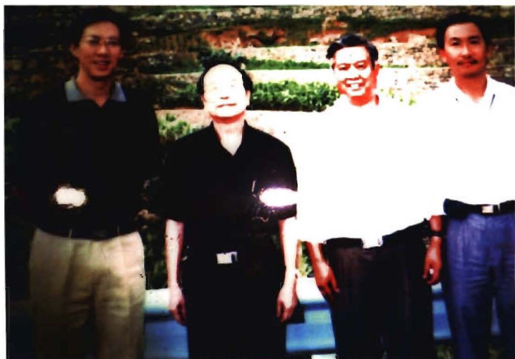
全国人大副委员长蒋正 华(左二)在大方县调研。