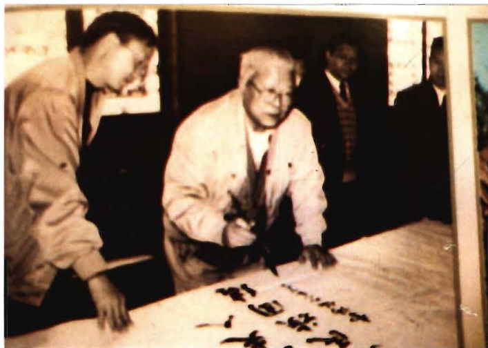
全国人大副委员长李锡铭 在奢香博物馆题词。