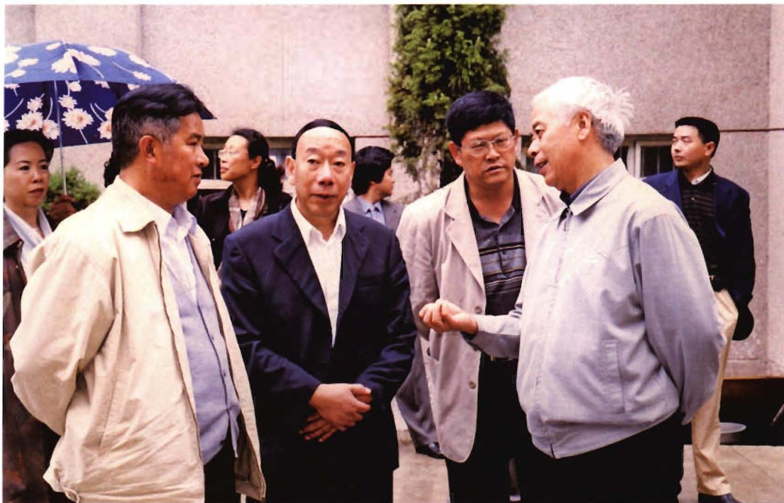
省人大副主任杨序顺（前右一）来大方指导工作。