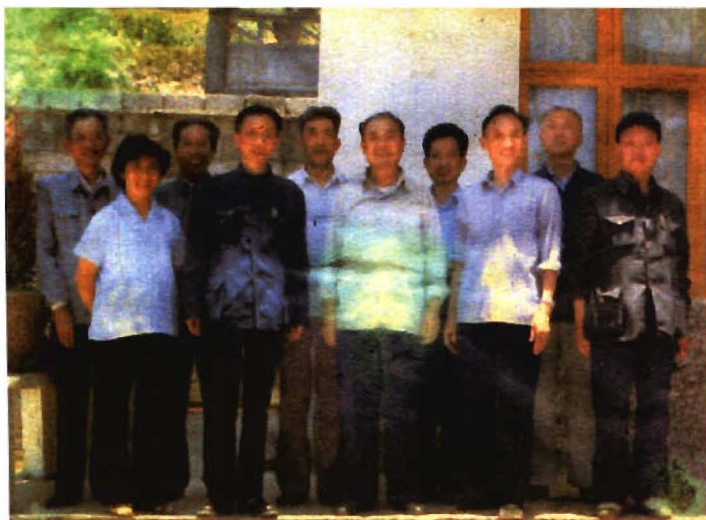
县第十届人大主任李相尧(前排中)与十届人大常委部分人员合影。