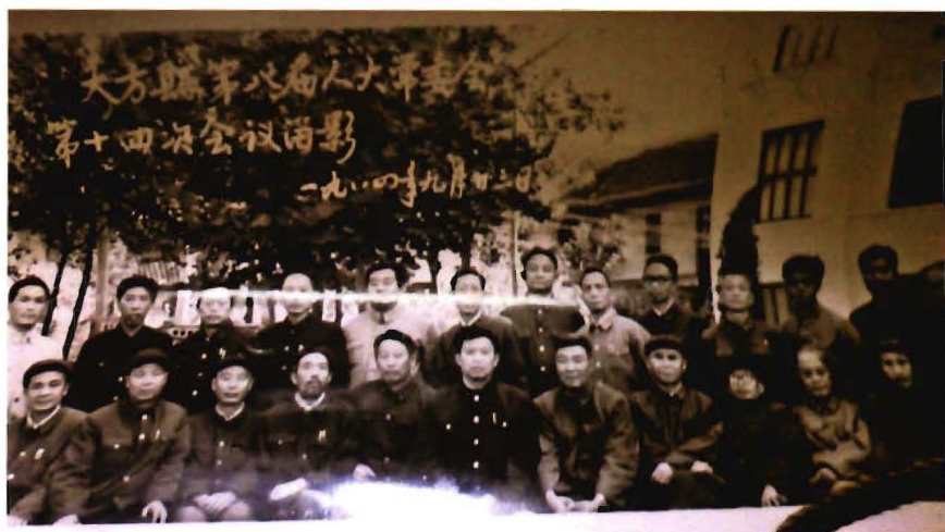
1984年9月23日，第八届人大常委会第十四次会议留影。