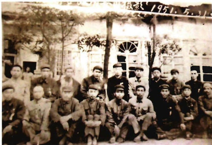
1951年5月31日，大定县民族民主联合政府委员留影。