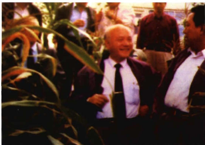
全国人大副委员长、民革中央主席李沛瑶在大方农村考察。