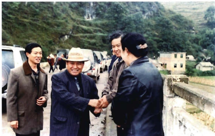
县人大领导迎接省人大副主任禄文斌(左二)来大方指导工作。