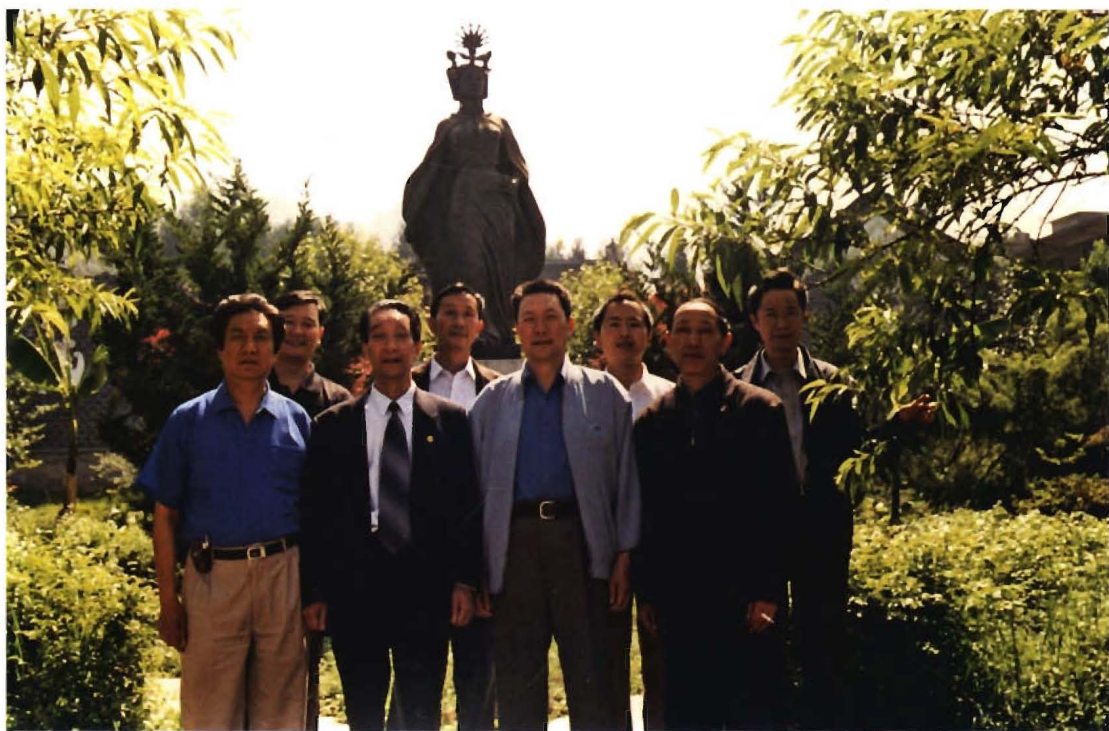
地、县人大领导在奢香夫人铜像前留影。