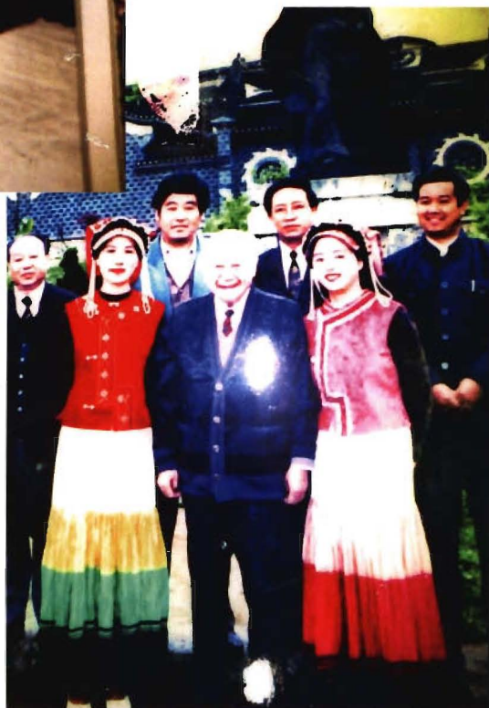
全国人大副委员长钱伟长 (前排中)在大方县调研。