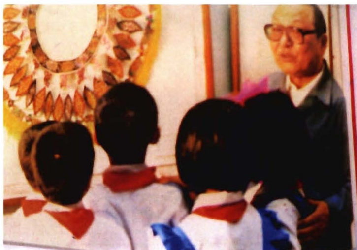
全国人大副委员长习仲勋在大方参观少数民族服饰。