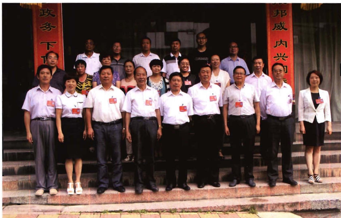
县十六届人大常委会部分委员与原主任高兴全（前排左四）、新任主任陈祖军（前排左五）合影。