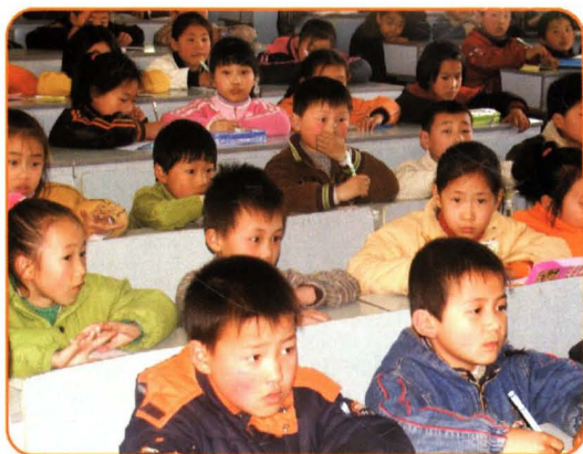
1995年起，本县适龄儿童、少年百分之百入学，接受义务教育。