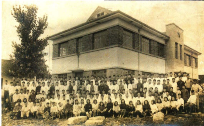
繁昌初中1955届 学生毕业与教师合影。