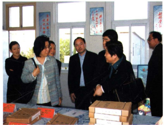
2006年4月，教育部副部长陈小娅（左前）考察本县农村远程教育和中考改革工作。