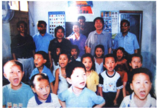
2002年6月12日，国务院总理朱镕基（后右二）视察长江大堤时，称赞本县小洲新镇幼儿园“办得好”，并与孩子们合影。