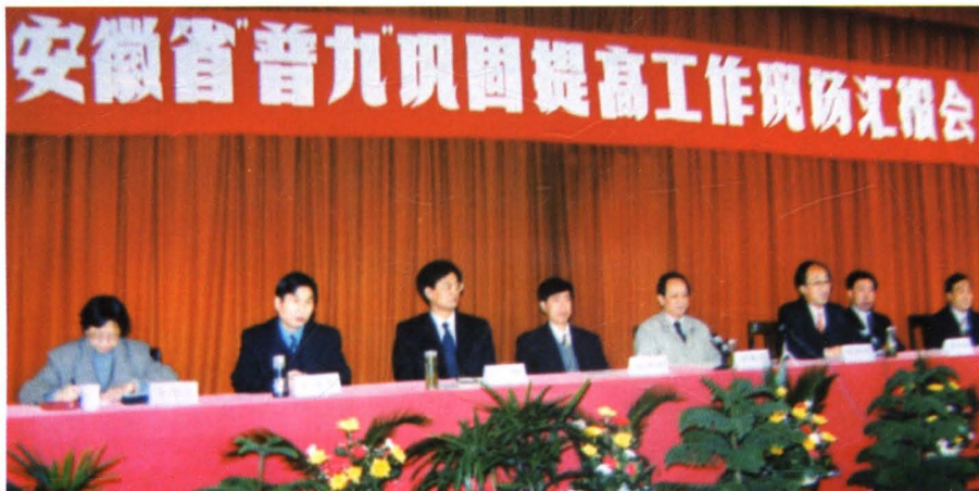
1996年全省普及九年义务教育巩固提高工作现场会在本县召开。