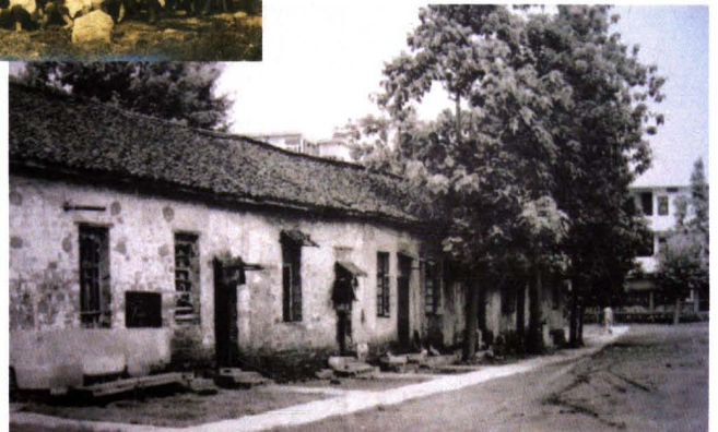
创办于1958年的 三山初中（今三山 中）原校舍。