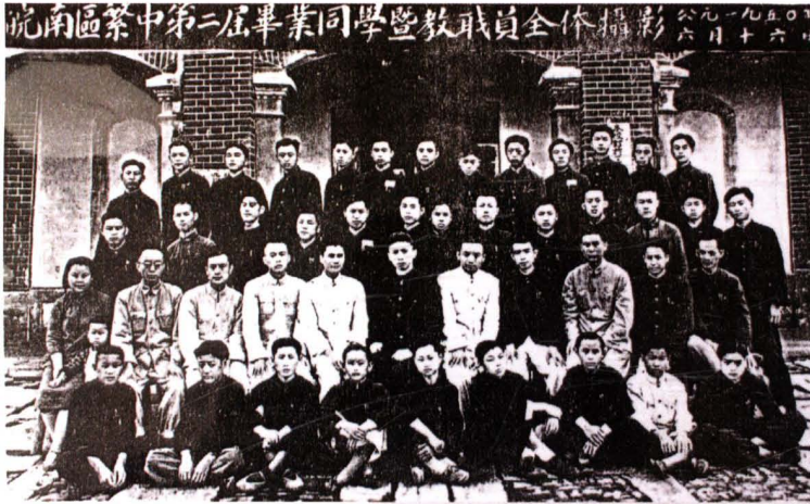
1950年，繁昌初中 第二届毕业生与教职 工合影。