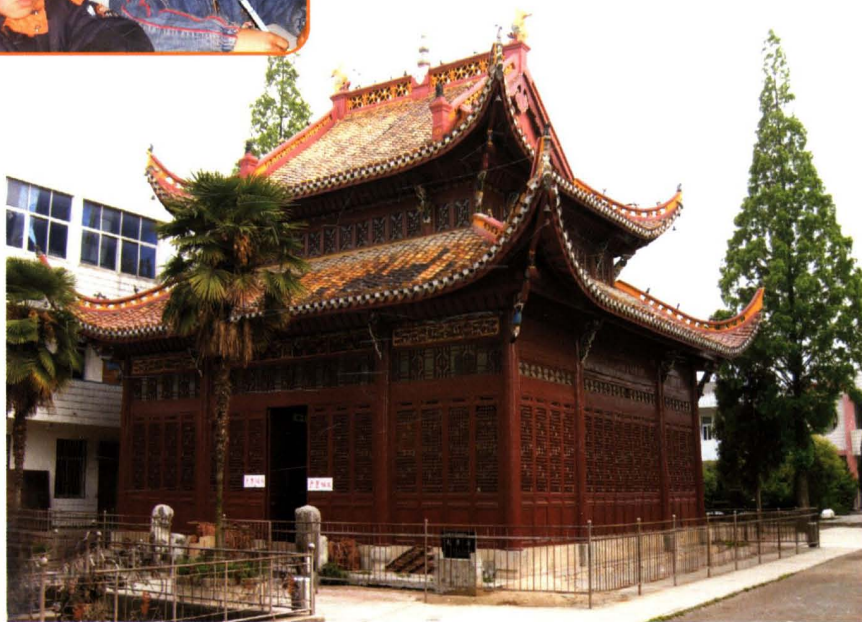
始建于明代嘉靖四十五年（1566）座落在城关一小内的夫子庙大成殿。