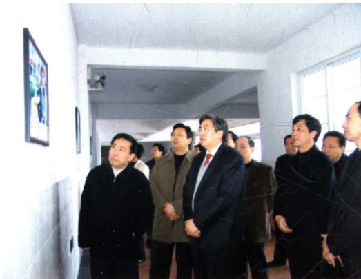
2005年3月23日，省委书记郭金龙（前中）在芜湖市委书记詹夏来、繁昌县委书记朱诚陪同下视察县一中。