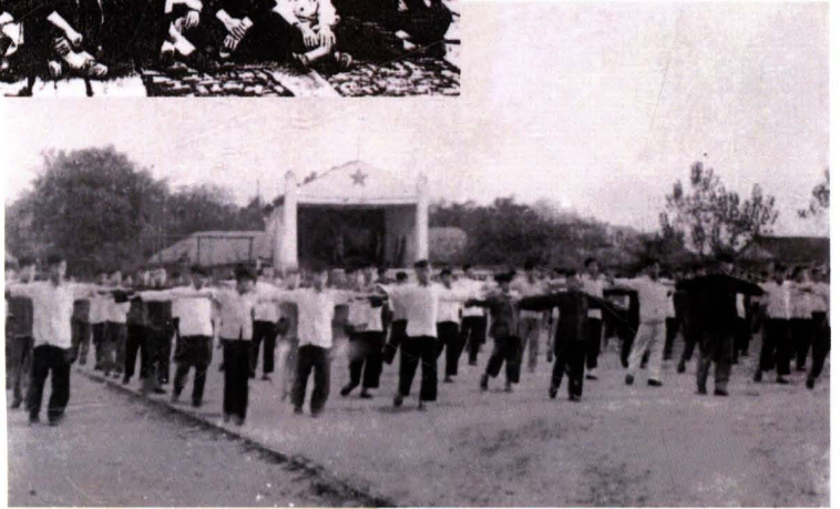
1957年繁昌初中 学生在解放台前广场 做广播体操。