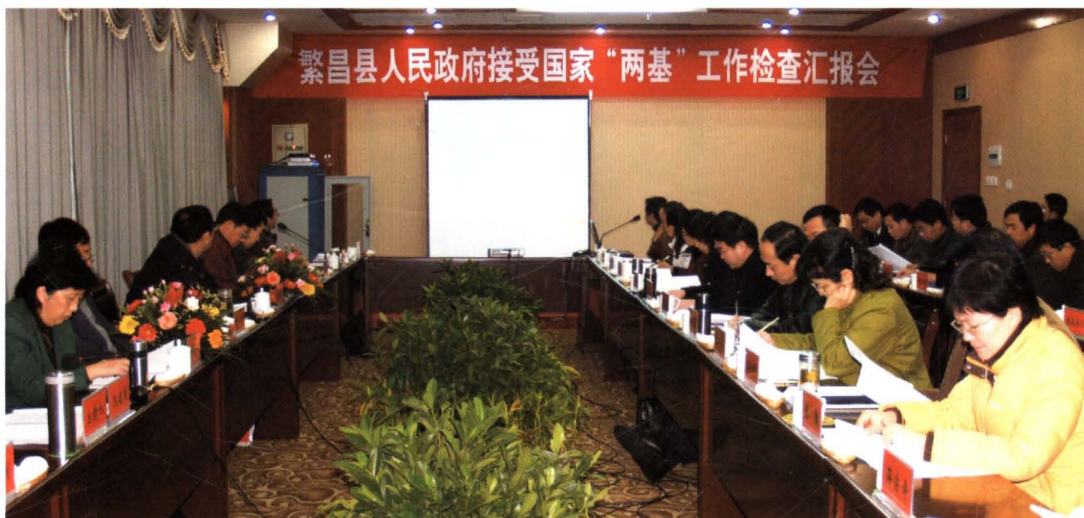
2006年12月，本县“两基”（基本普及九年义务教育、基本扫除文盲）工作接受国家复查验收。图为验收组在听取汇报。