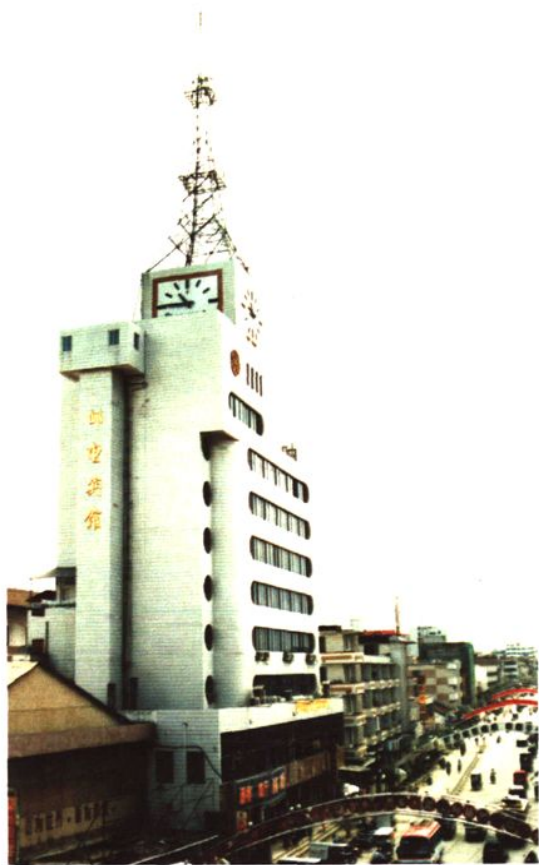
▲ 1995年田东县邮电局邮电综合楼。