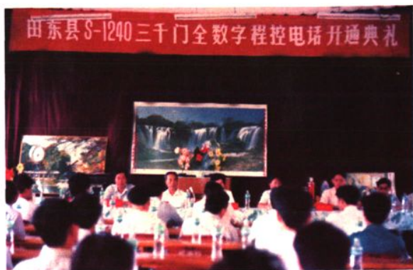
▲ 1994年5月8日零时，田东S—1240三千门全数字程控电话割切开通。