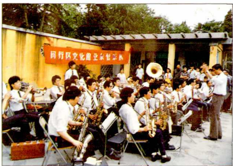
闵行区文化馆业余管弦乐队