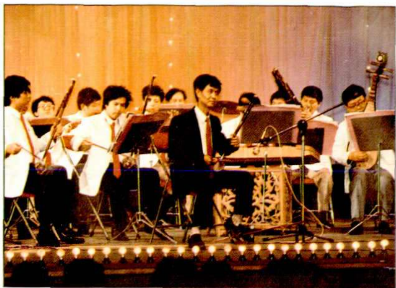
吴泾文化馆民乐队