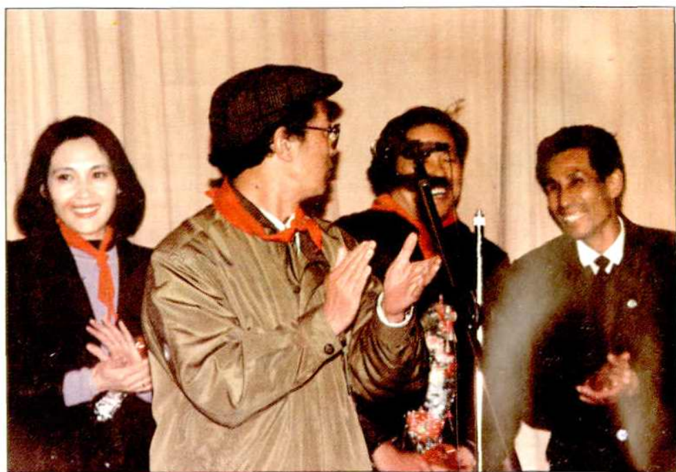
电影《烛光里的微笑》在闵行区举行首映式，导演吴天忍、