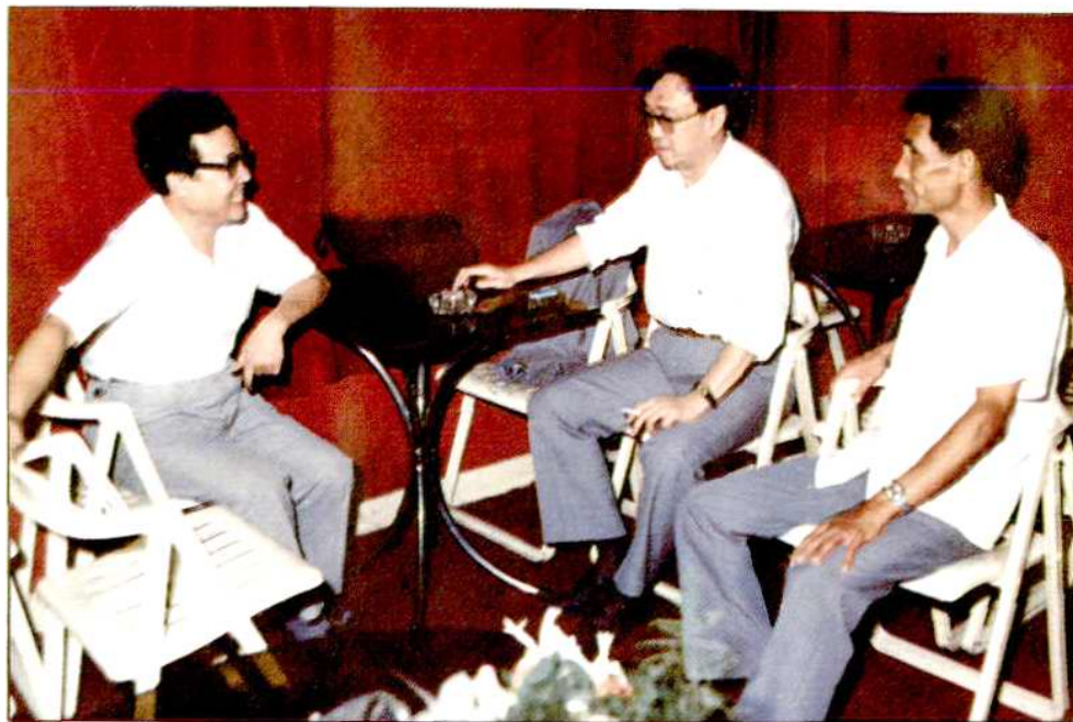
著名导演谢晋在闵行与区文化局长胡正宏交谈