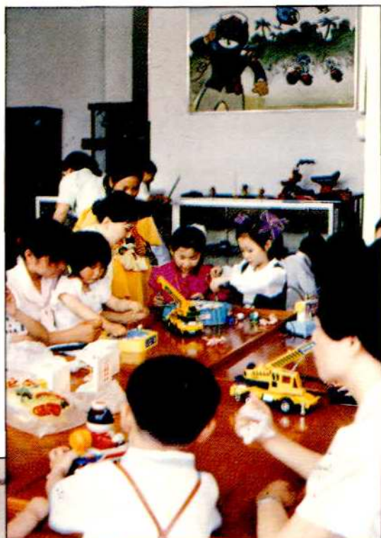
闵行区儿童玩具图书馆