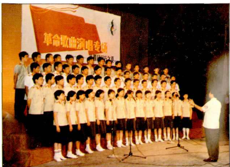
闵行区公安分局歌咏队