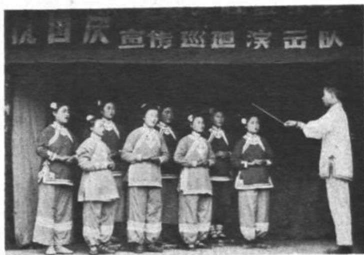
(7) 一九五六年十月，文化馆“社会主义巡回演出队”，演出合唱《山歌不唱心不开》