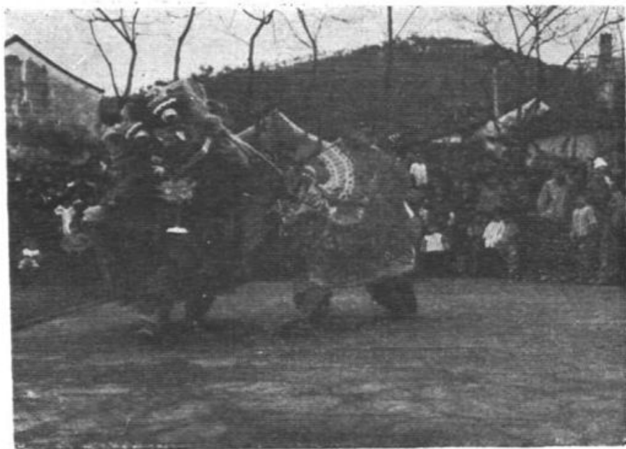
(14) 一九八二年南岙村狮子队在宁波地区《四明之春》会演中获优秀演出奖