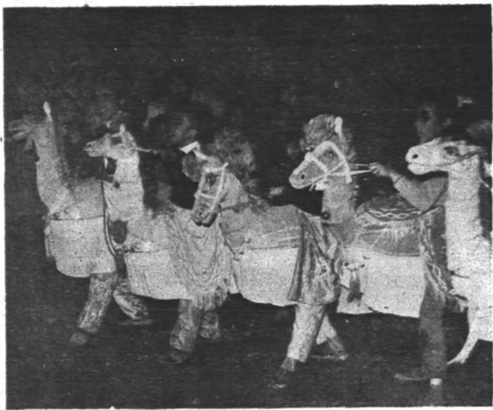
(12) 在一九七九年一月的“元宵民间文艺大会串”中的大湖马灯队