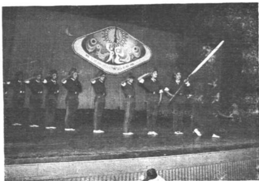
(15) 一九八八年文化馆创作的群舞《军花》在宁波市《国防杯》会演中获演出一等奖、优秀创作奖