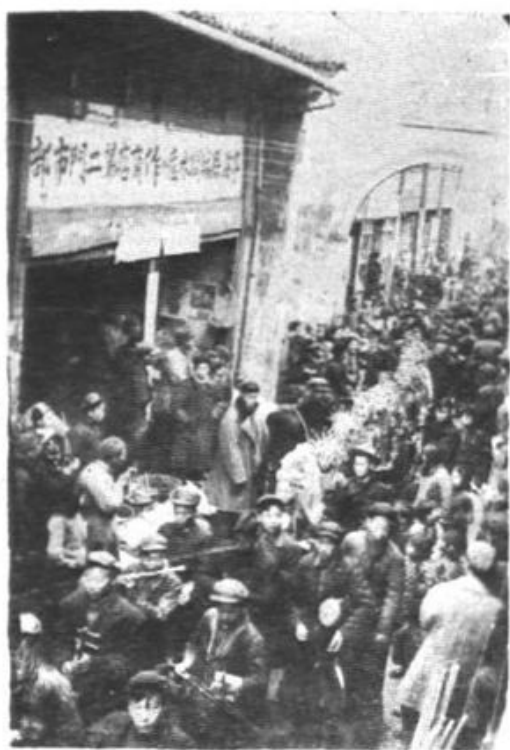
(9) 一九五四年一月，为宣传总路线、城关地区首次组织民间文艺会串。总任务。