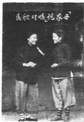
(8) 一九五四年，文化馆组织巡回辅导队，下为演出的《亲家母》