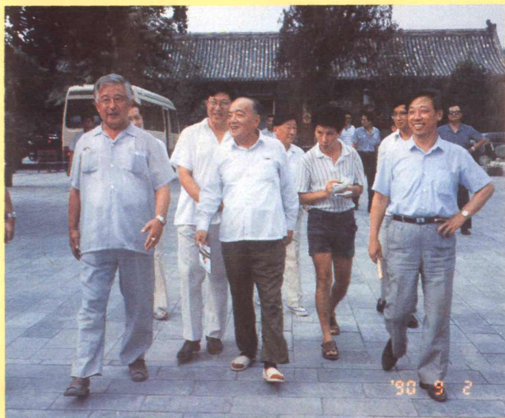
⇐ 杨尚昆主席在 区委书记许海峰陪 同下参观北京蜡像 馆