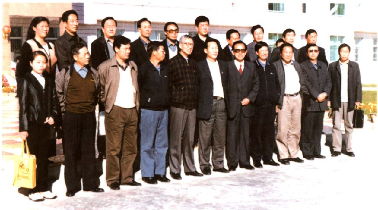
国家副总督学马钊（前排左五）等来校检查工作