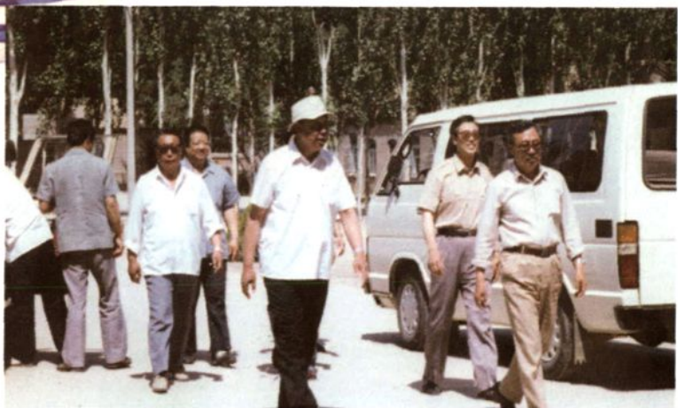
区教育局领导来校指导工作