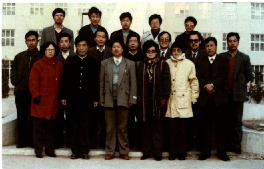
奈曼一中教师来访