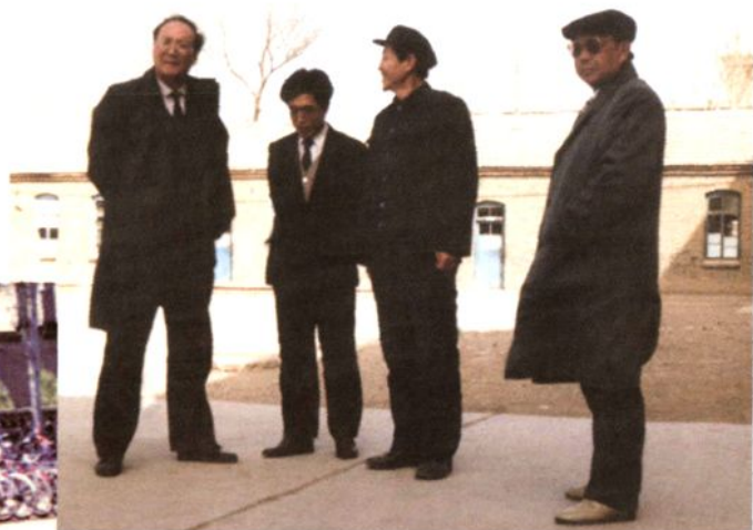
自治区政府副主席赵志宏（左一）来校视察