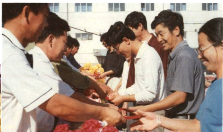
为高考状元辅导教师颁奖