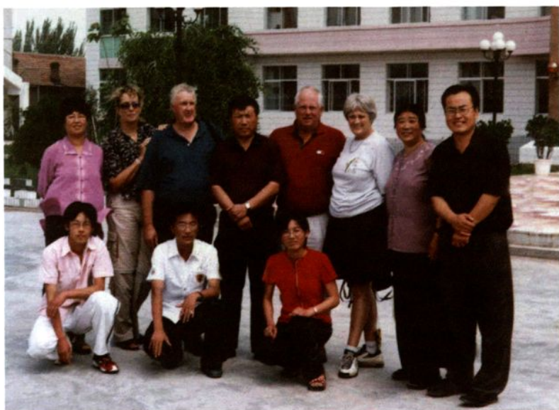
澳大利亚友人访新惠中学