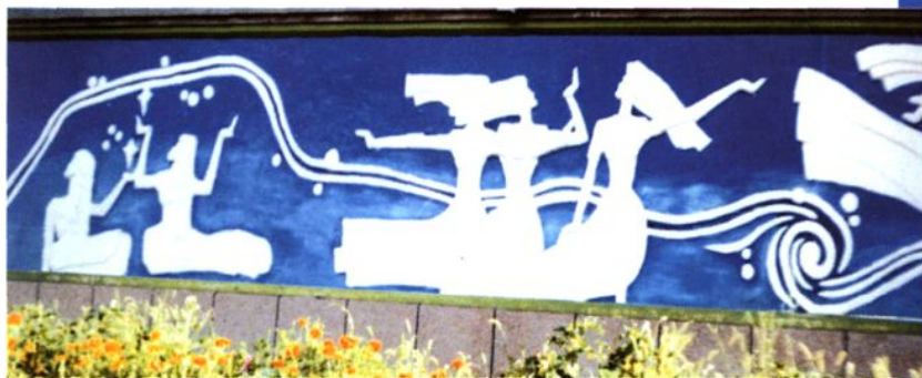
校园浮雕一角（知识女神）