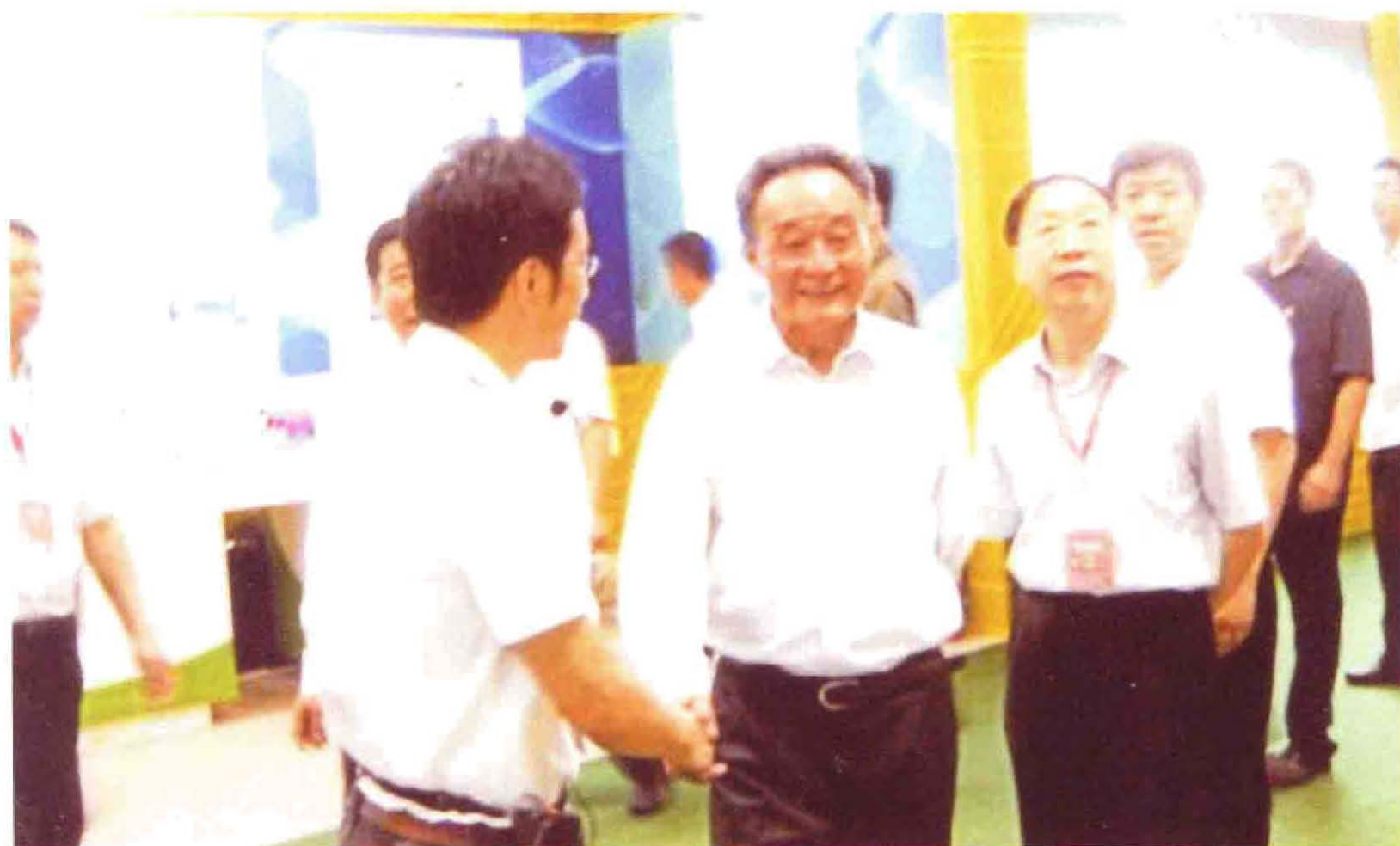
图为2012年6月29日，全国人大常委会委员长吴邦国（左2）观看在北京举行的金山科技产品展，并与金山科技董事长王金山（左1）亲切握手。