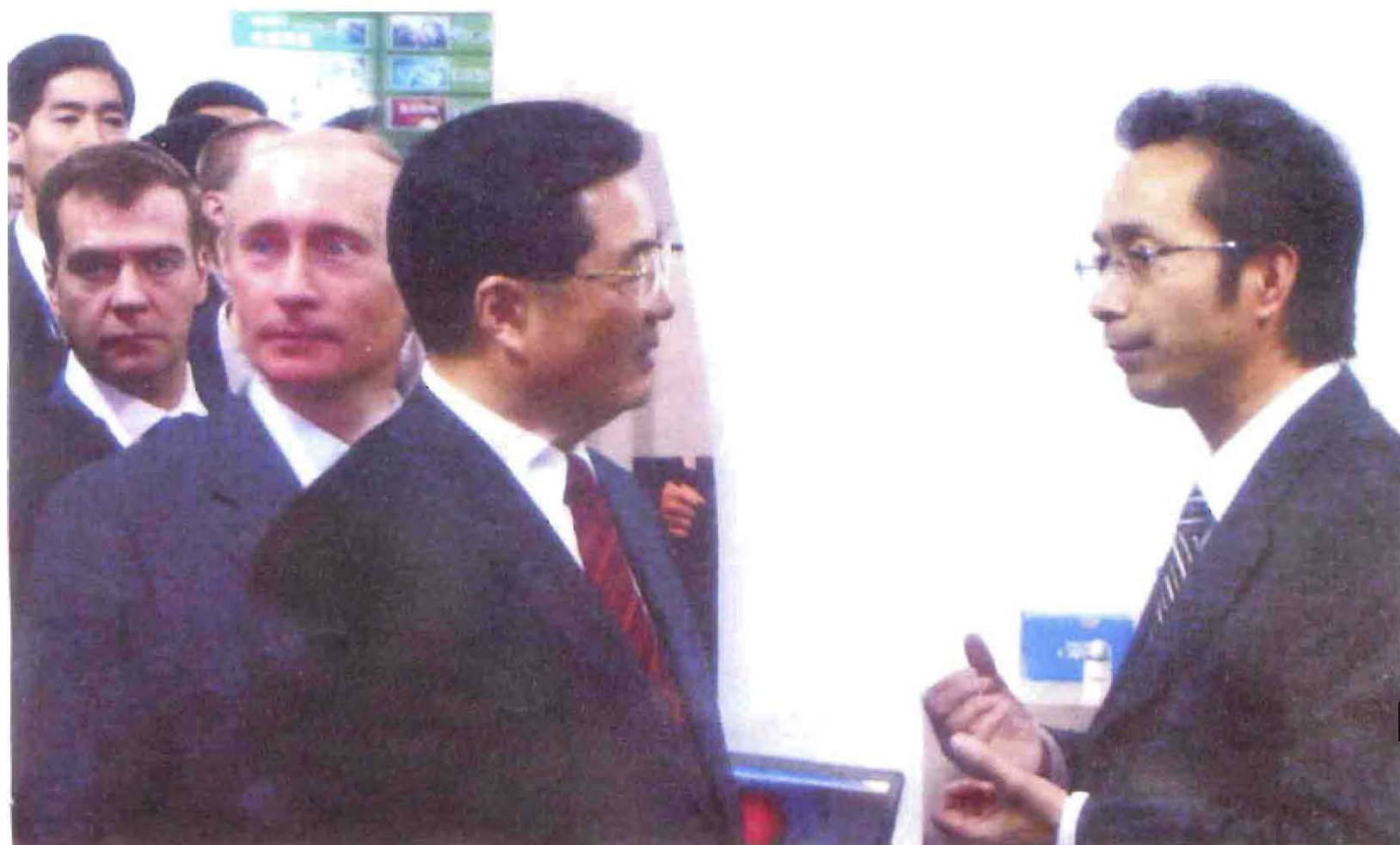
2007年3月27日，胡锦涛总书记出访俄罗斯，金山科技集团董事长王金山（右1）前往，并向总书记胡锦涛（右2）、俄罗斯总统普京（右3）、总理梅德韦杰夫（右4）汇报该集团产品情况。