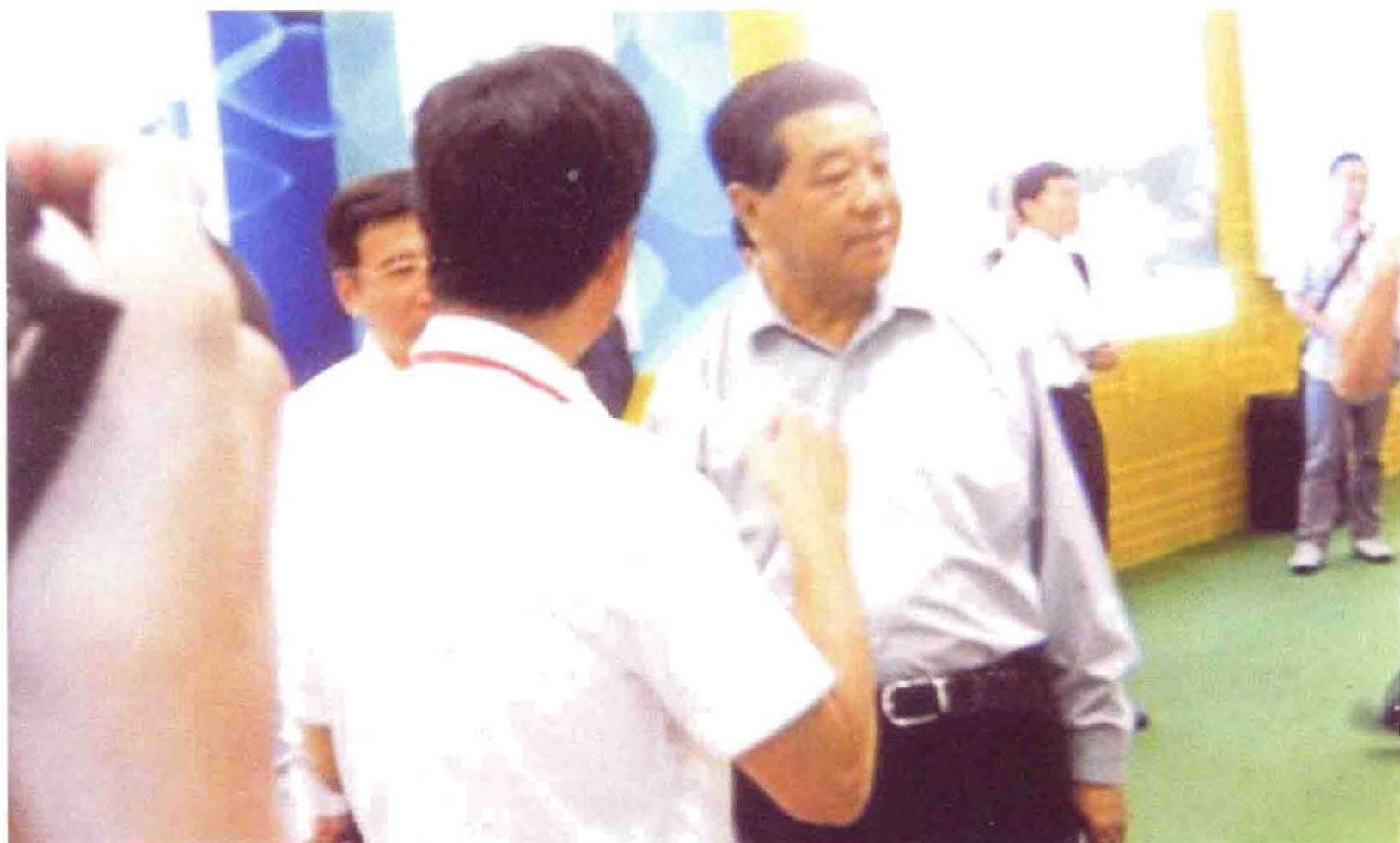
2012年6月29日，全国政协主席贾庆林（左2）观看在北京举行的金山科技产品展览，图为金山科技董事长王金山（左1）向贾庆林主席介绍金山科技最新科研成果。