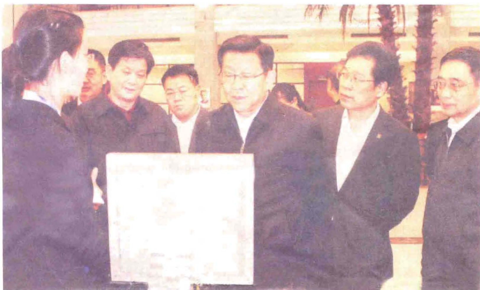
2012年10月25日，国家商务部部长陈德铭（右3）在金山科技公司视察。