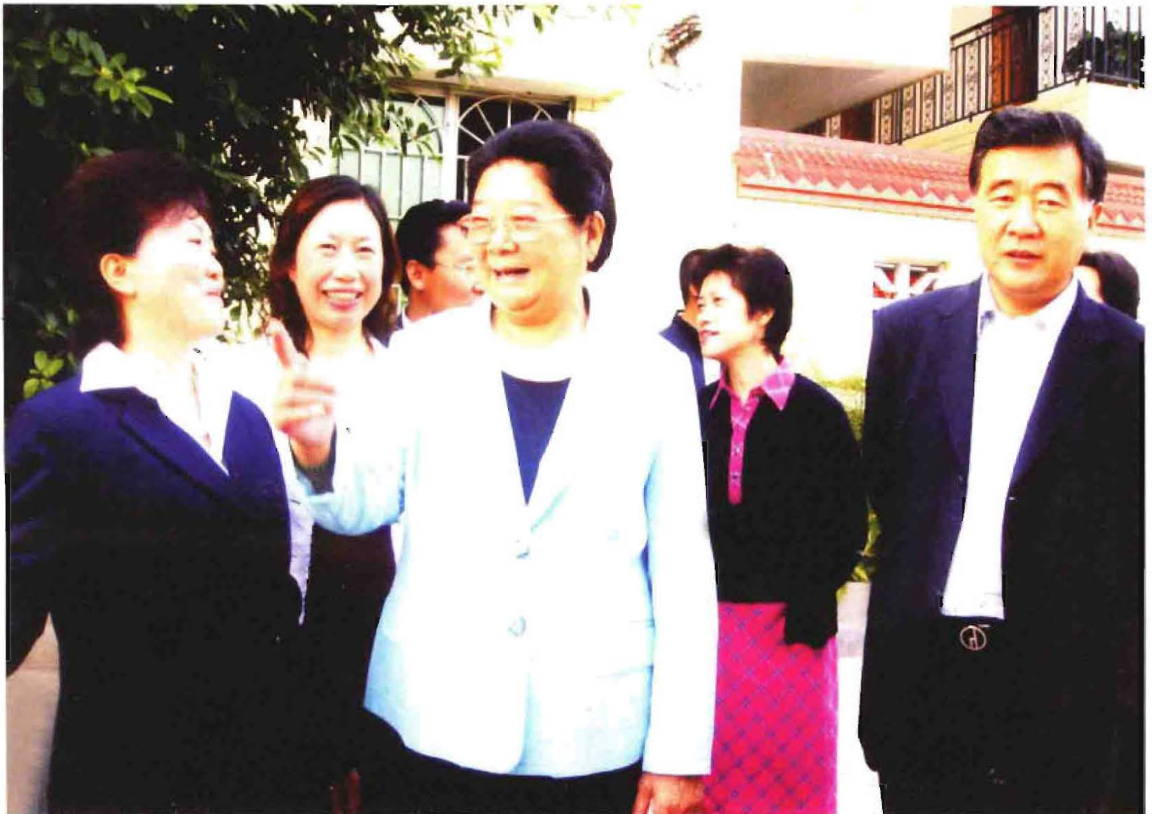
2006年11月，全国人大副委员长顾秀莲（左3）来回兴街道双湖社区视察，陪同人员有重庆市委书记汪洋（右1）、副书记刑元敏（右2）。