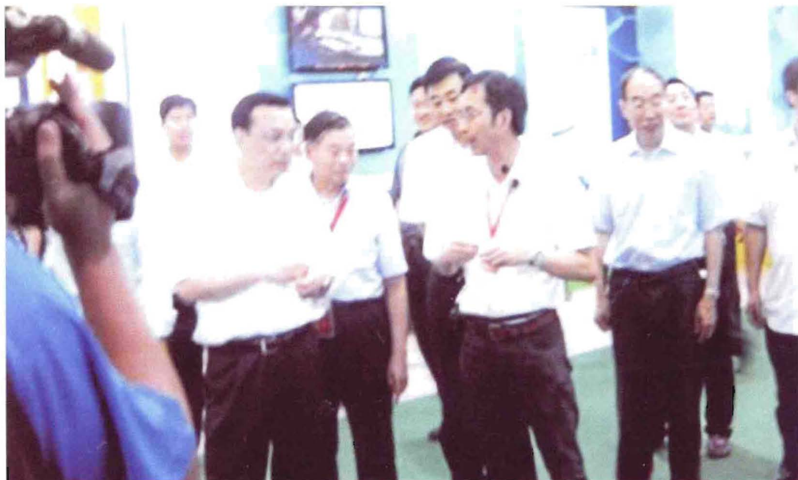
2012年6月29日，国务院副总理李克强（前排左2）观看在北京举行的金山科技产品展览，图为李克强副总理与金山科技董事长王金山（前排右1）亲切交谈。