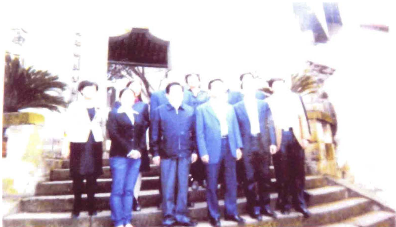
2012年4月19日，全国人大副委员长，民建中央主席陈昌智（前排左3）视察中华职业学校后，重庆市委统战部长范照兵（前排左2）、渝北区长黄玉林（前排左1）等合影。