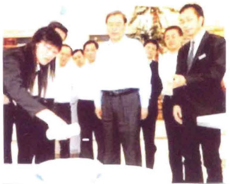
2012年10月，张德江副总理（前排左2）在金山科技集团听取金山科技集团董事长王金山（左1、右1）汇报产品情况。