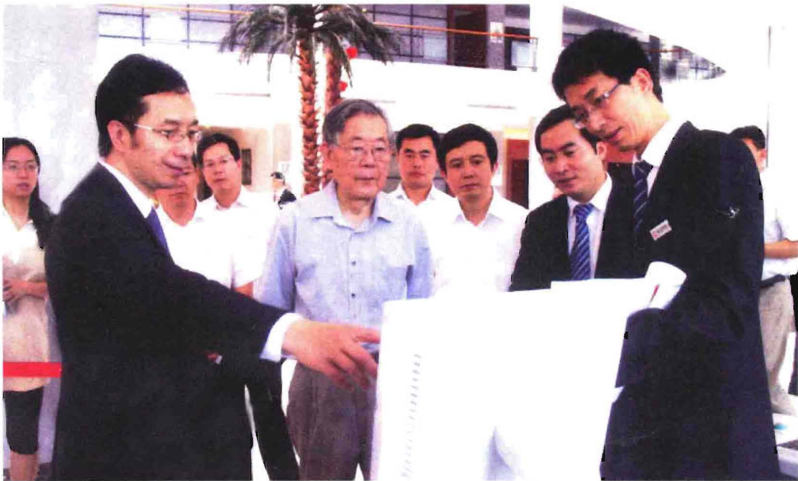
2011年4月29日，全国人大副委员长周光召（前排左2）来金山科技集团考察。