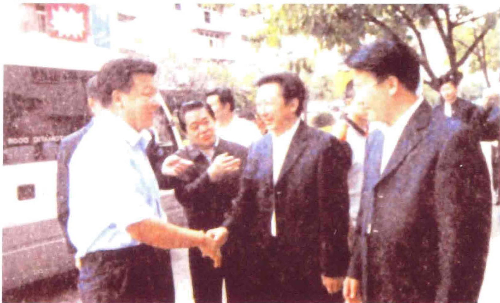
2006年4月28日下午，中央政治局委员、书记处书记、中宣部部长刘云山（左1），在渝北区委书记刘光全（中）、区长吴亚（右1）等领导陪同下，视察重庆市两路工业园区和社区精神文明建设情况。