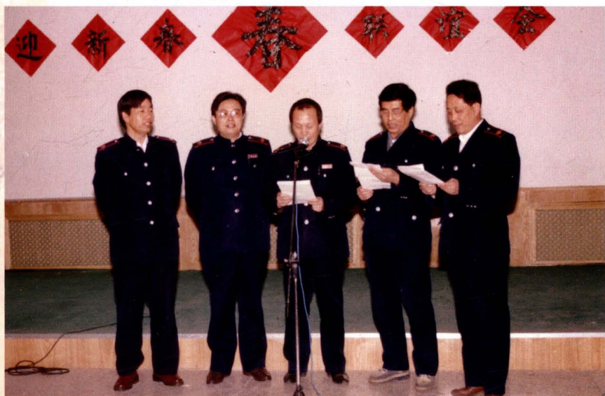
1999年2月1日，领导班子成员在迎新春晚会上表演节目。