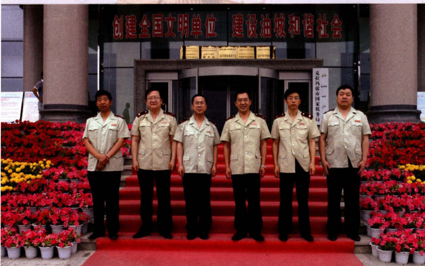
2008年6月16日，领导班子成员合影。