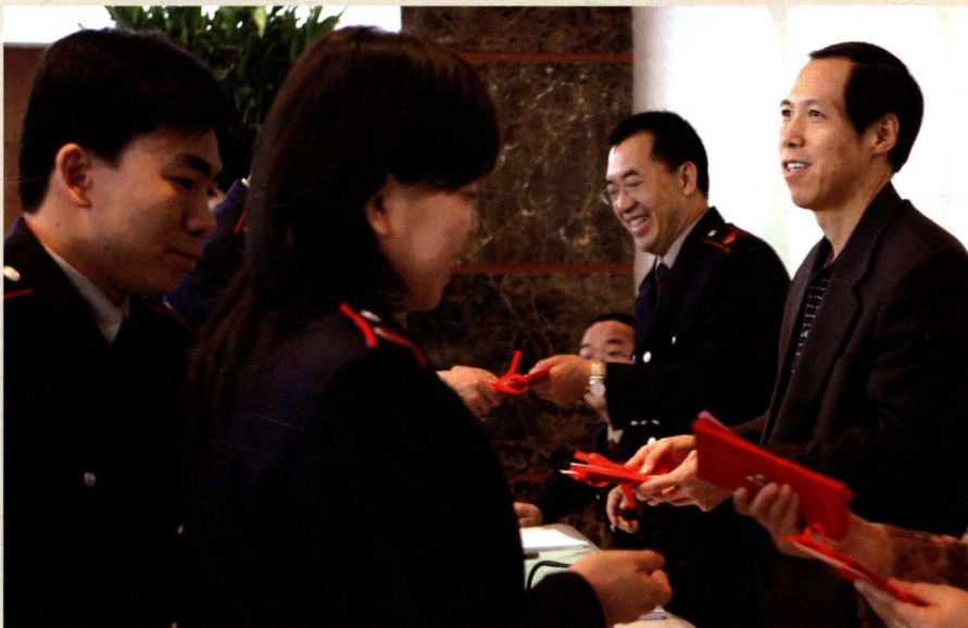
2007年2月14日，王新民常务副市长（右一）在市国税局工作会议上颁奖。