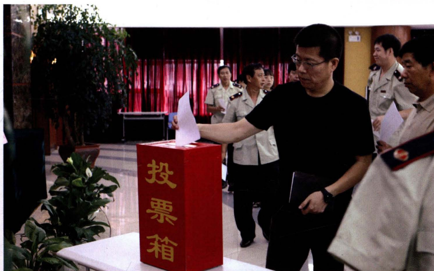
2008年6月20日，市国税局召开干部大会，对领导干部进行民主测评。