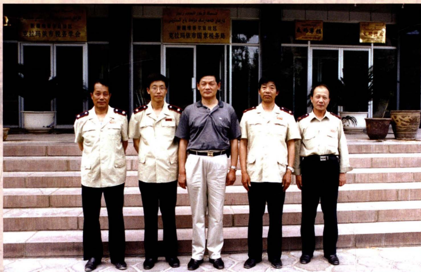
2001年1月5日，领导班子成员合影。