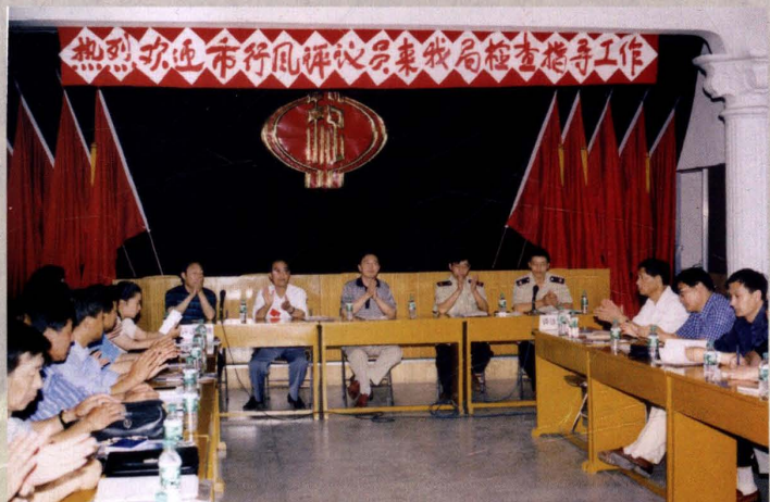
1999年6月1日，市人民政府行风评议组进驻市国税局开展工作。