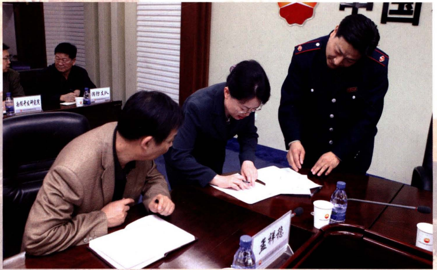
2008年4月8日，北疆分局干部 在新疆油田公司进行纳税辅导。