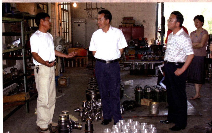
2006年6月13日，市国税局领导到 纳税企业了解生产经营情况。