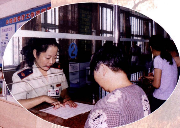
1999年8月24日，独山子区 国税局办税服务厅工作人员在 办理纳税业务。