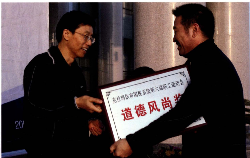
2007年10月27日，市国税系统举办第六届职工运动会，图为领导向基层局颁奖。