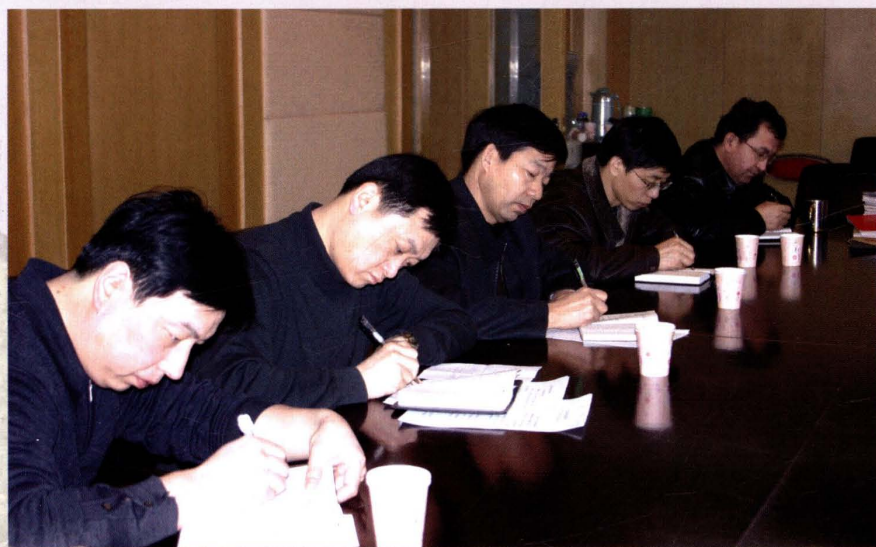
2005年3月14日，市国税局领导集体学习。