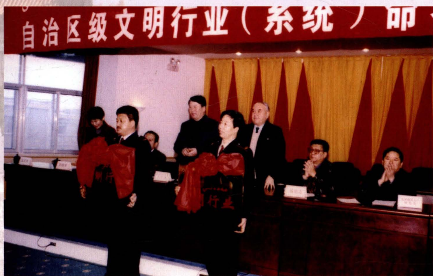
2000年12月15日，市国税系统荣获自治区级文明行业（系统）称号，图为命名大会。