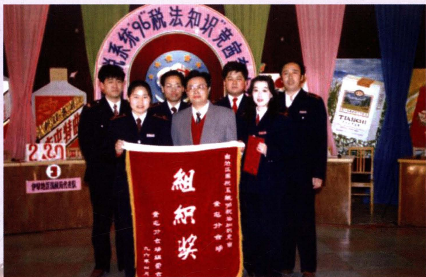
1996年4月6日，市国税局代表队参加自治区国税系统（奎屯）“税法知识竞赛”。