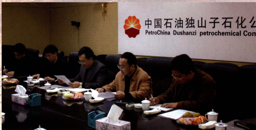
2006年12月14日， 国税局领导在独 子石化公司调研。