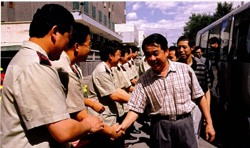
2002年7月30日，国家税务总局程法光副局长（右一）看望市国税局机关干部。