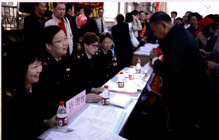
2007年4月22日，市国税局参加市政府组织的构建和谐克拉玛依启动仪式。