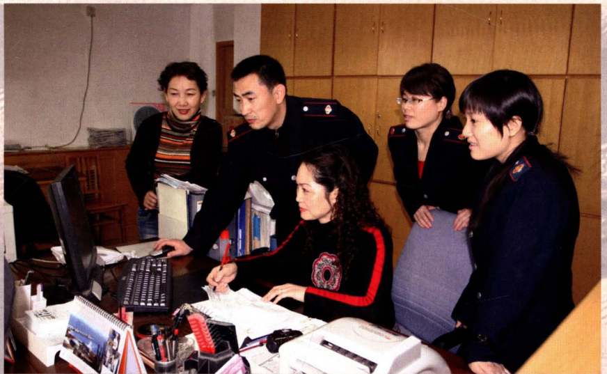
2008年4月29日，独山子区 国税局干部在纳税企业工作。