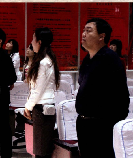
2008年5月4日，组织青年干部参观矿史馆。