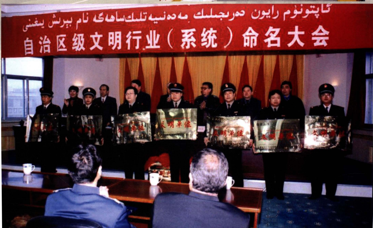
2000年12月15日，克拉玛依市人民政府召开自治区级文明行业（系统）命名大会。