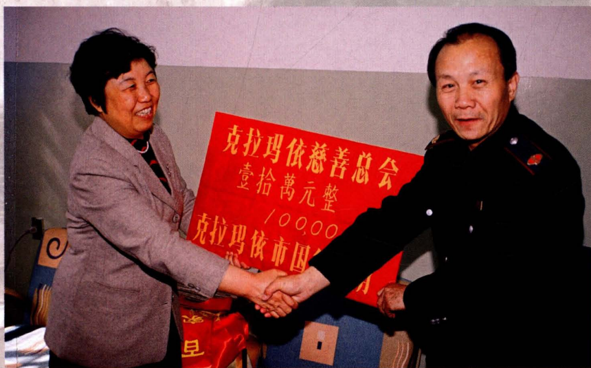
2001年3月28日，市国税局向克拉玛依市慈善机构捐款。