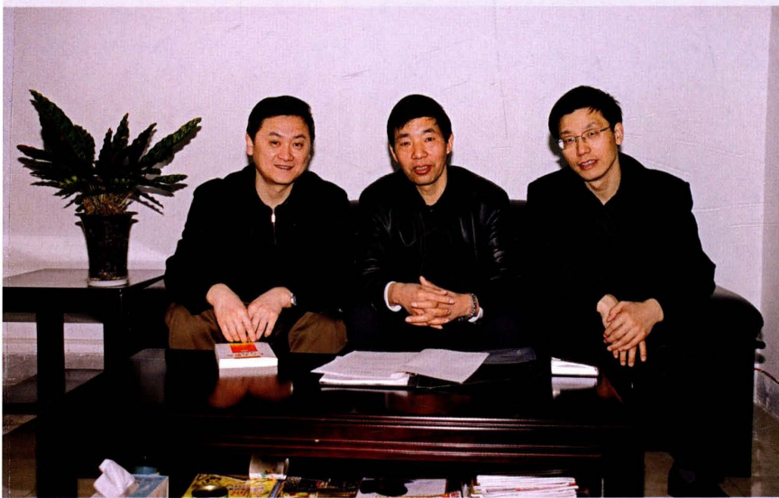
2003年3月25日，领导班子成员合影。