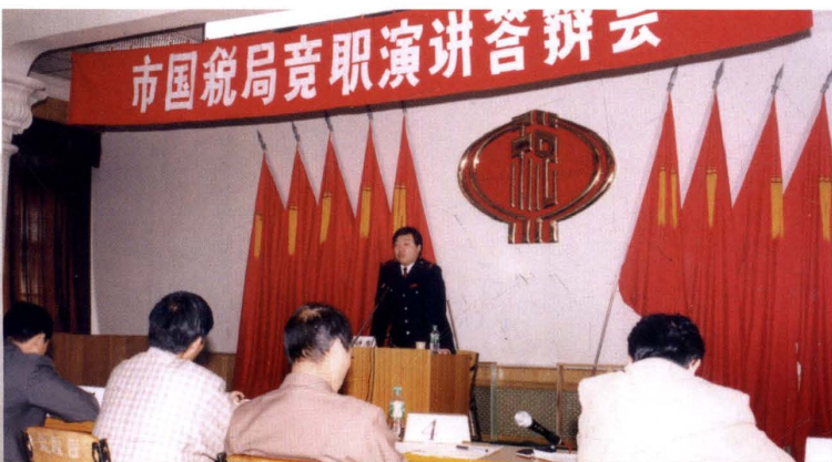
1999年4月，市国税局启动第一轮人事制度改革，图为税务干部在竞聘上岗演讲答辩。