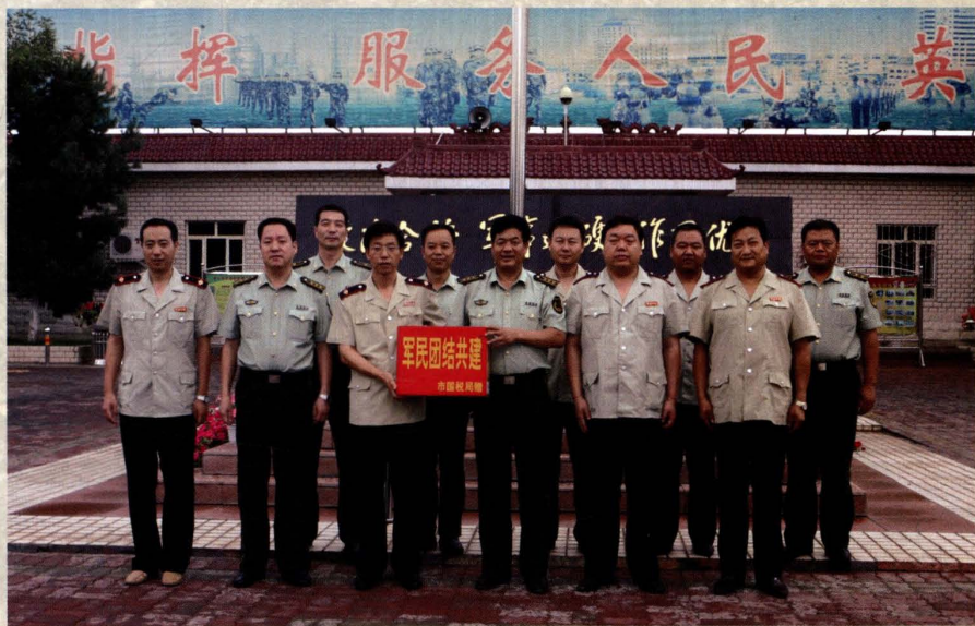
2008年7月25日，市国税局慰问驻市部队。