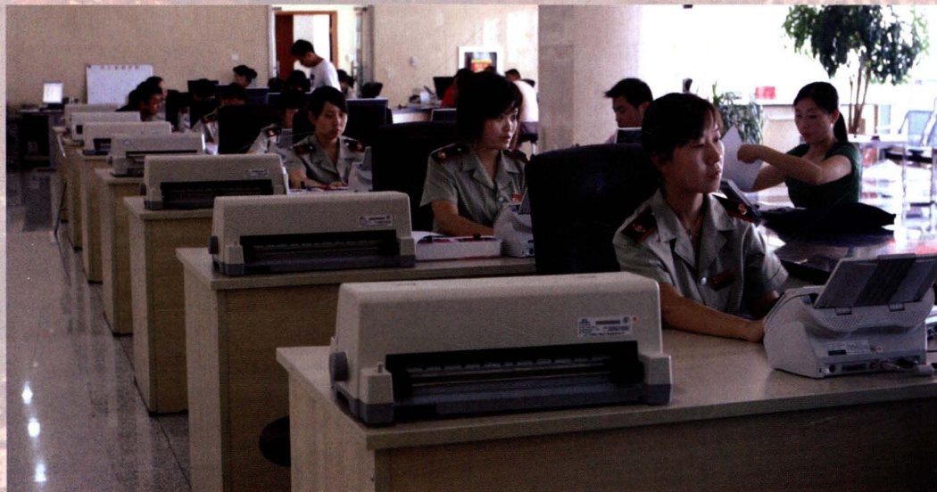
2008年6月12日， 克拉玛依区国税局办 税服务厅工作人员在 办理纳税业务。