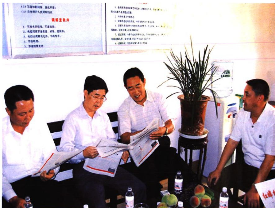
市委副书记王永生、区委书记李学海视察社区工作