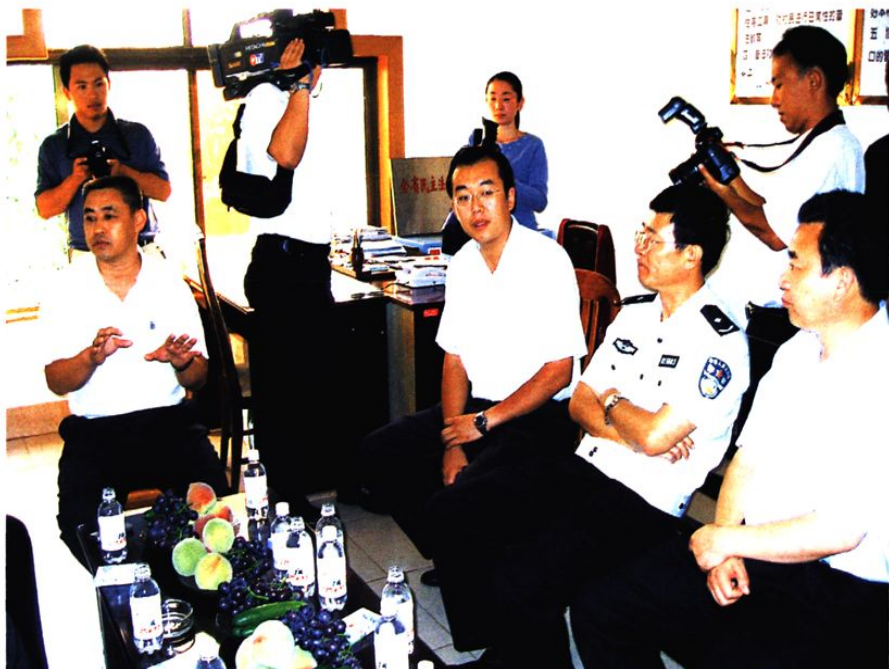
市、区街道主要领导陪同省公安厅领导考察社区平安创建工作