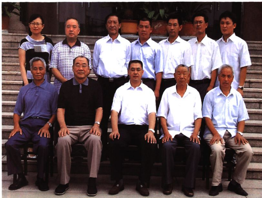
村志编纂委员会全体成员