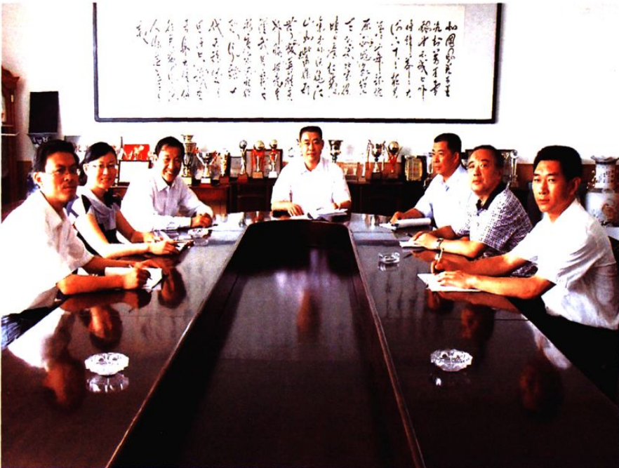
社区两委研讨工作