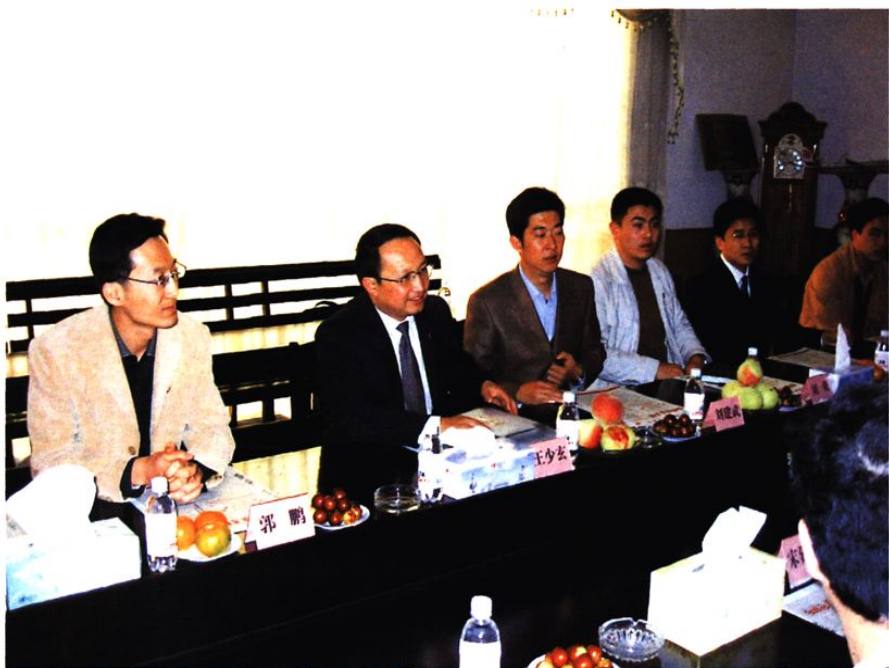
团中央督导组指导社区工作