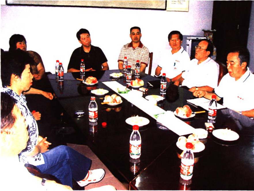
区政协领导同志视察社区企业发展情况