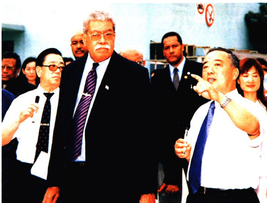
斐济群岛共和国总理莱赛尼亚·恩加拉塞亲临社区企业——青岛良木集团考察投资合作事宜