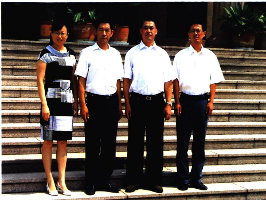
红埠社区居委会成员