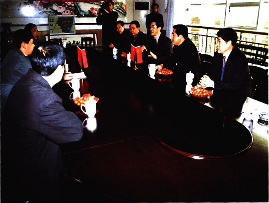
青岛市政法委书记（原城阳区委书记）李增勇视察社区工作