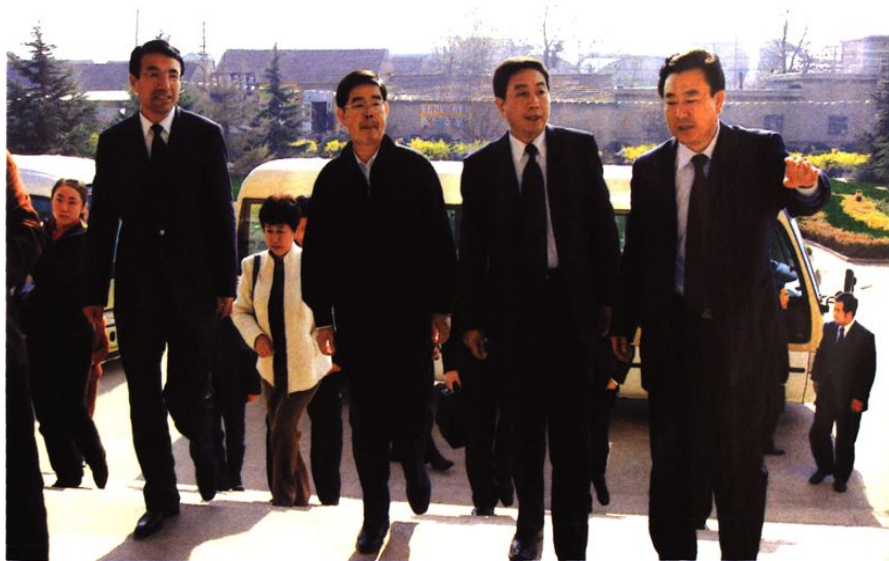
省、市、区三级领导来社区考察社会治安综合治理工作