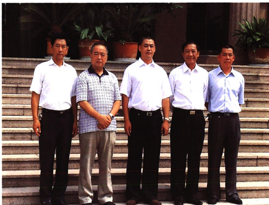
红埠社区党委成员