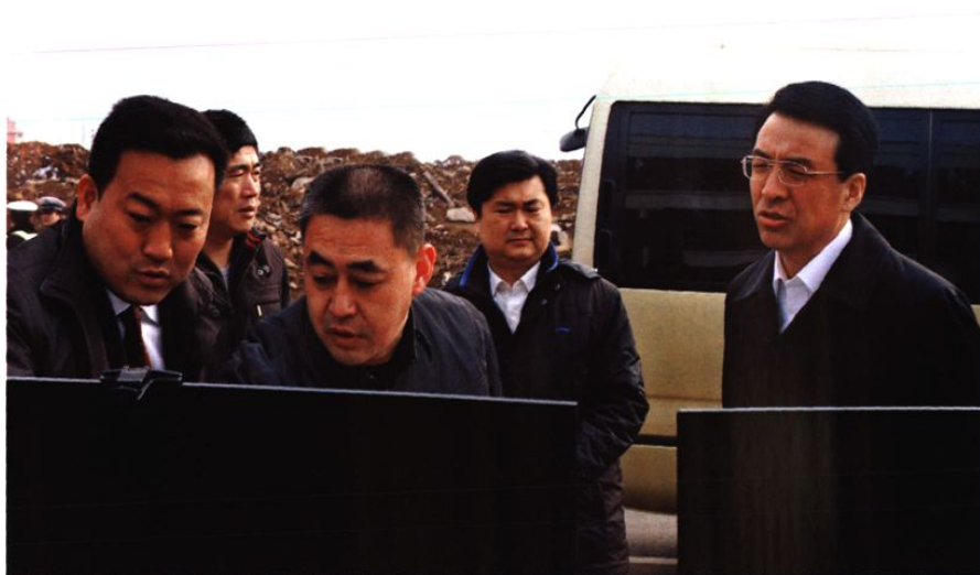
市委常委、城阳区委书记王鲁明到社区调研旧村改造进展情况