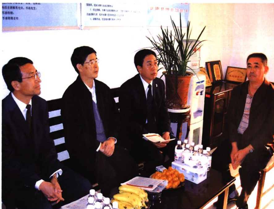
市委副书记王永生、区长王鲁明指导社区工作