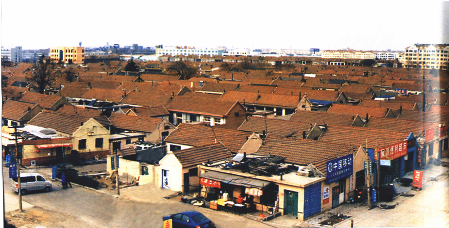
1950~1987年红埠村居民住房旧貌