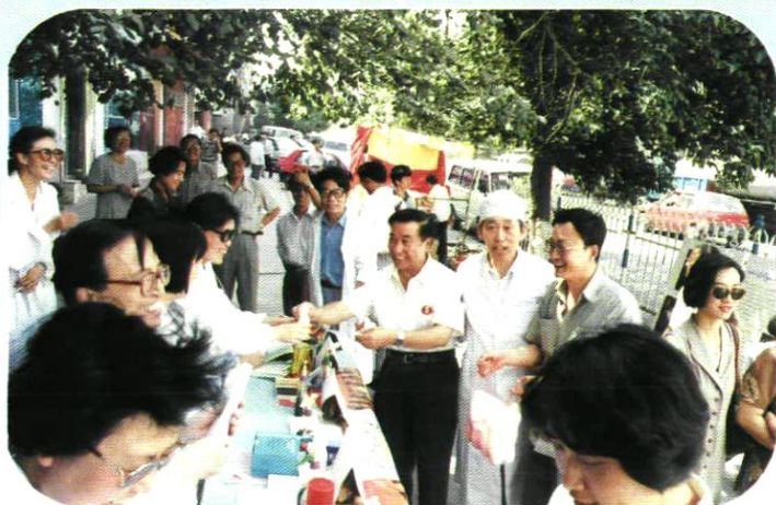
市卫生局领导参加卫生宣传咨询活动