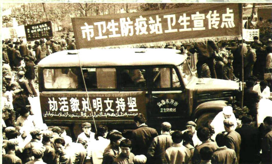
开展讲文明、讲礼貌、讲卫生、讲秩序、讲道德活动