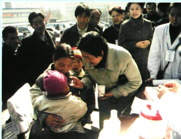
杜秦瑞副市长给儿童喂服脊髓灰质炎糖丸疫苗