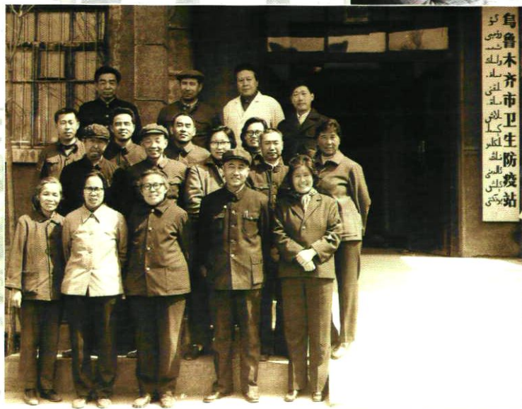
市站部分老一代卫生防疫工作者