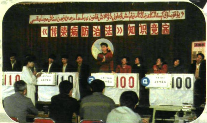
《传染病防治法》知识竞赛