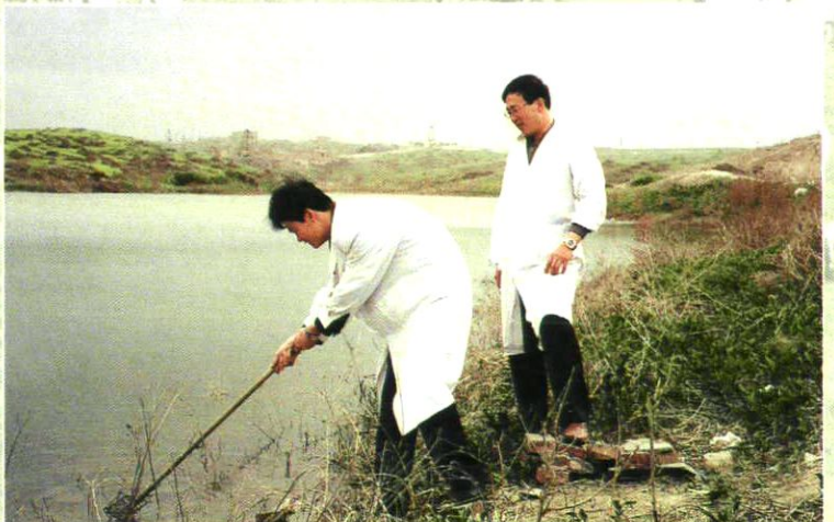
采水磨沟河水样进 行霍乱监测