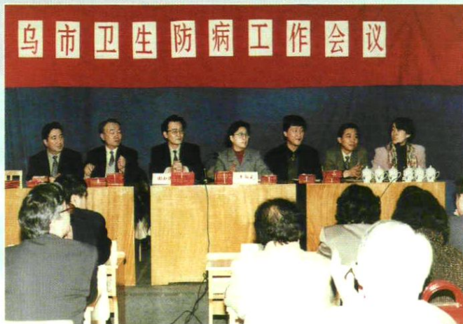
卫生防疫工作会议