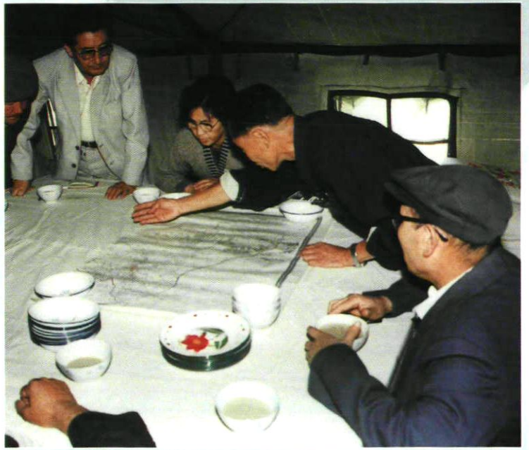
王淑元副市长(右三)等领导在鼠防第一线部署防治工作