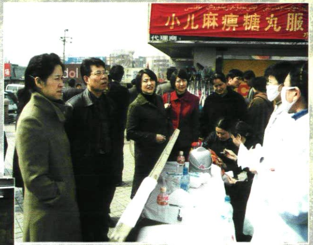
站领导督导脊髓灰质炎强化免疫