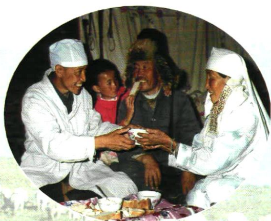
卫生防疫人员在牧区巡回医疗