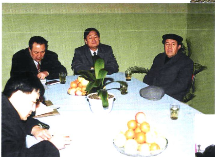
1991年3月卫生部孙隆椿副部长(右二)来我站检查指导工作