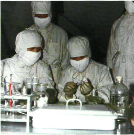
鼠防人员在野外实验室工作