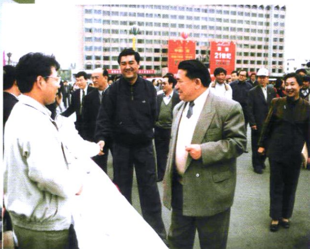
努尔·白克力市长陪同自治区党委副书记克尤木·巴吾东参加我市卫生宣传咨询活动