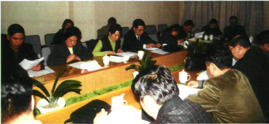
市预防与控制艾滋病领导小组 部署防治工作