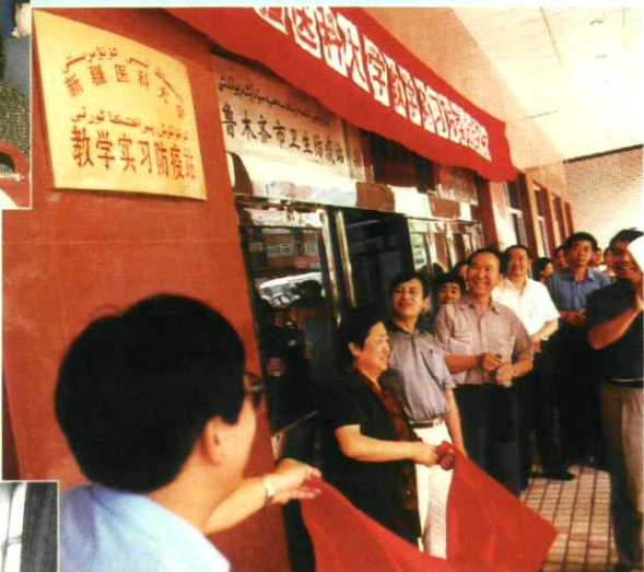
市政府和新医大领导为教学实习防疫站揭牌