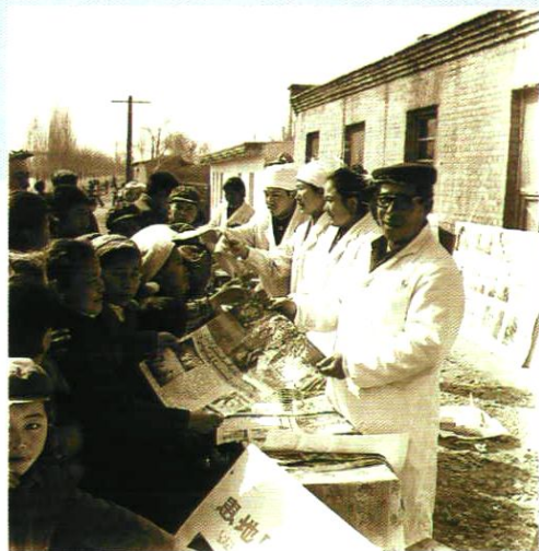
开展农村卫生科普宣传