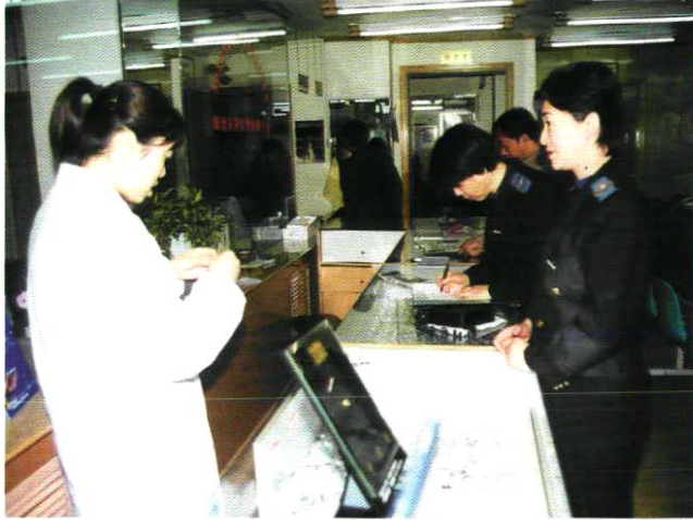
卫生监督员监测眼镜卫生质量