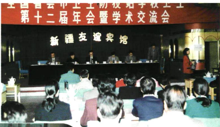
1997年10月,市站承办省会市站学校卫生年会