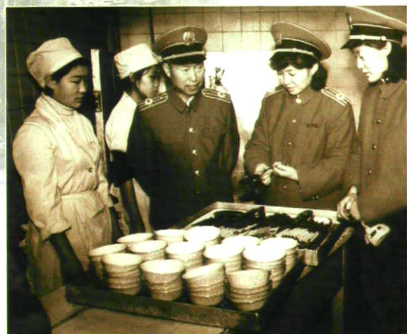
食品卫生监督员检查餐具卫生