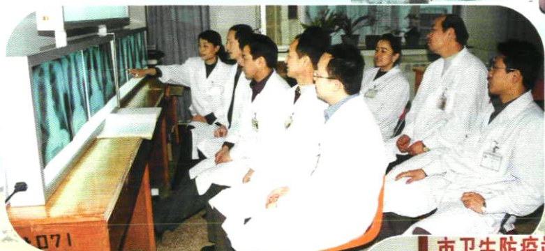
劳动卫生科在集体读片