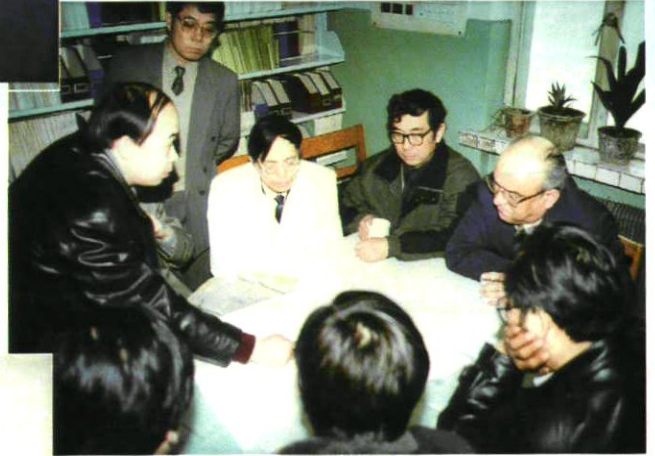
1998年,中共乌鲁木齐市委热夏提·依那吐拉副 书记和规划设计部门来站研究业务大楼基建方案