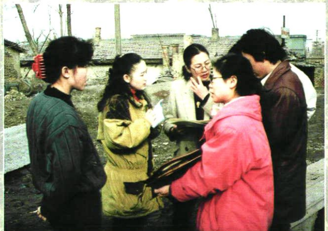
儿童计划免疫考核