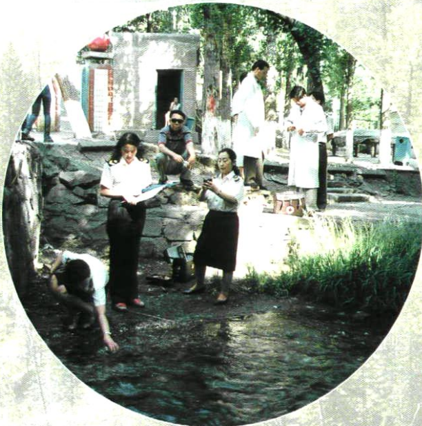
卫生监督员监测水质状况