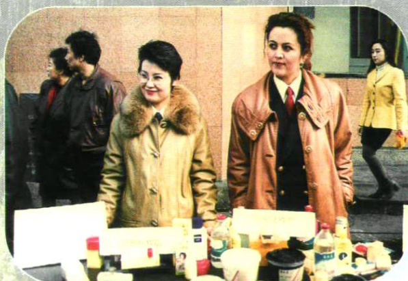
卫生监督员进行化妆品咨询服务