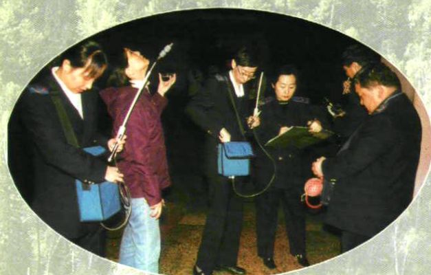
娱乐场所环境状况监测