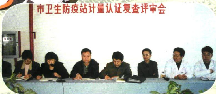
2001年11月,市站通过计量认证复审