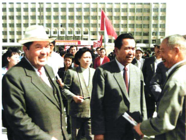
全国人大铁木尔·达瓦买提副委员长参加我市卫生宣传咨询活动