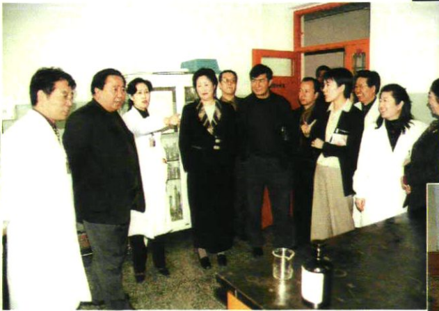
市委、市人大和市政协主管领导到市站调研