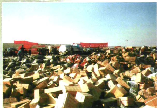
假冒伪劣商品销毁现场