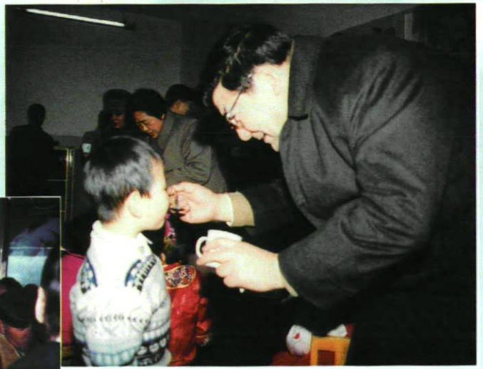
自治区人民政府买买提明·扎克尔副主席给儿童 喂服脊髓灰质炎糖丸疫苗