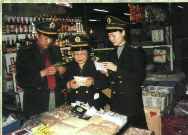
食品卫生监督员检查商场食品卫生质量