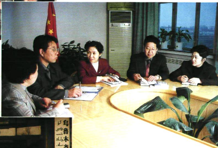
站党支部在研究工作