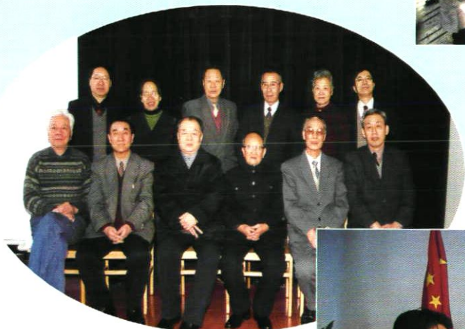
市卫生防疫站部分离退休老领导合影