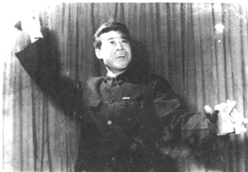
1976 年冬,胡印瑞在中原宾馆剧场演出照