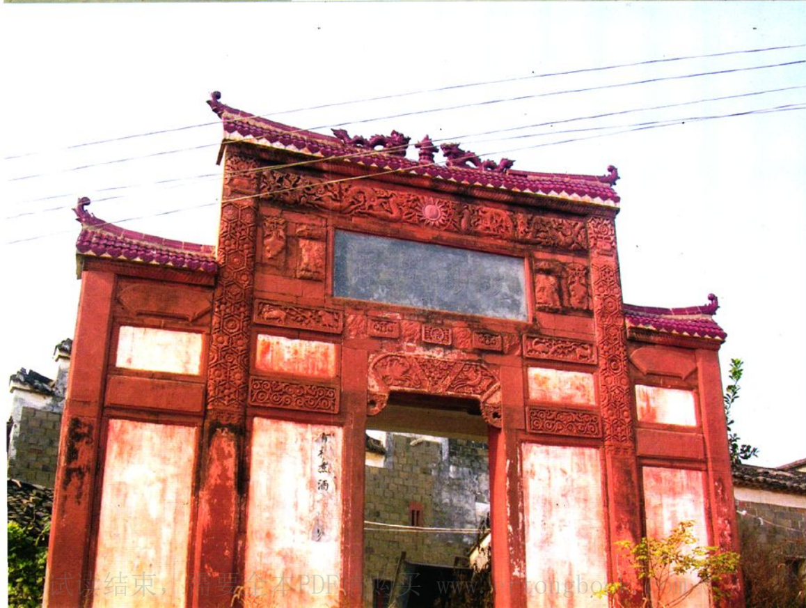
明清时期建造的程厅门楼