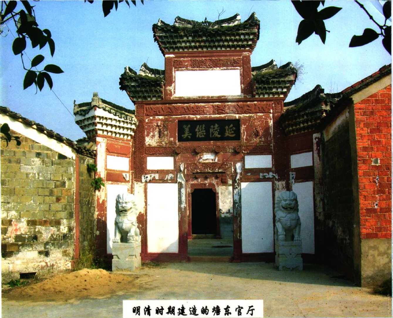
明清时期建造的塘东官厅