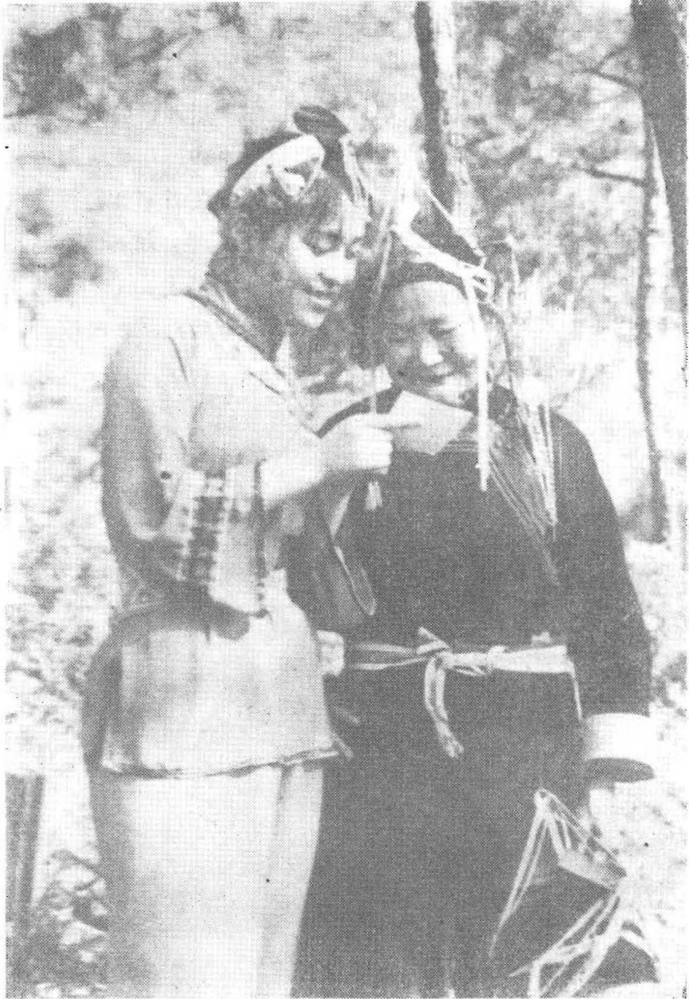
阿佳（祖母）快看好消息