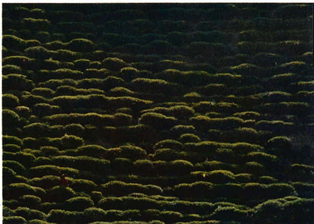
茶的海洋 惠明茶山