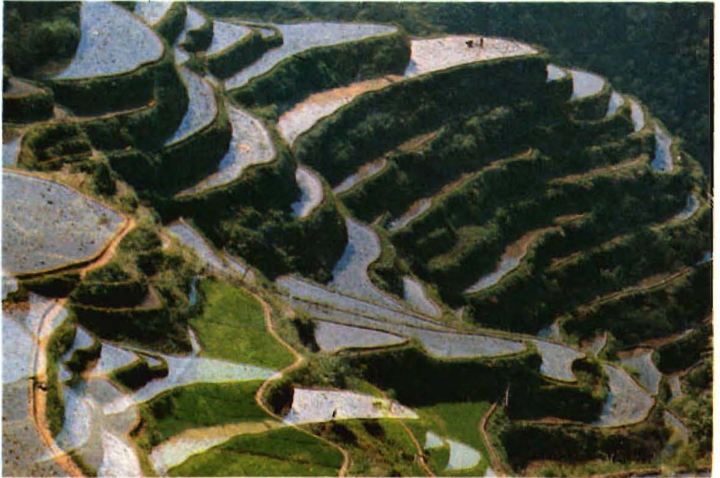
畚乡梯田 大均风光