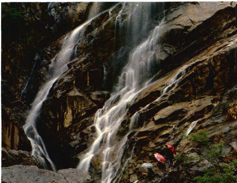
雪花瀑 欢乐的畲家女