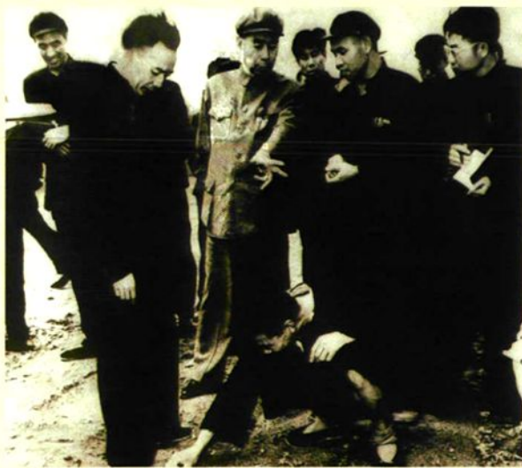
1958年4月24日，周恩来总理到大营农业社访问，一下火车就到田间看社员在棉田间苗。