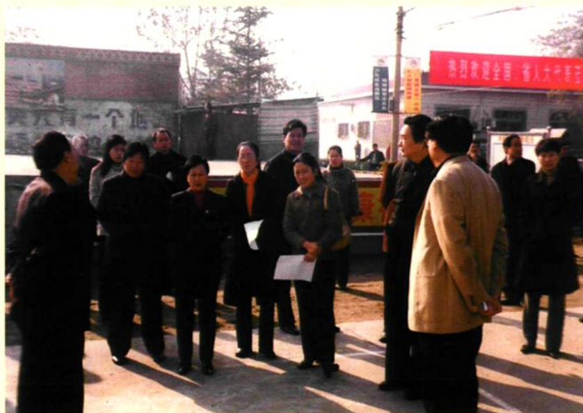
2005年11月,全国和省人大代表到新店村视察。