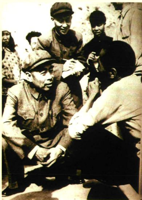
周总理同新店村民王有才亲切交谈。