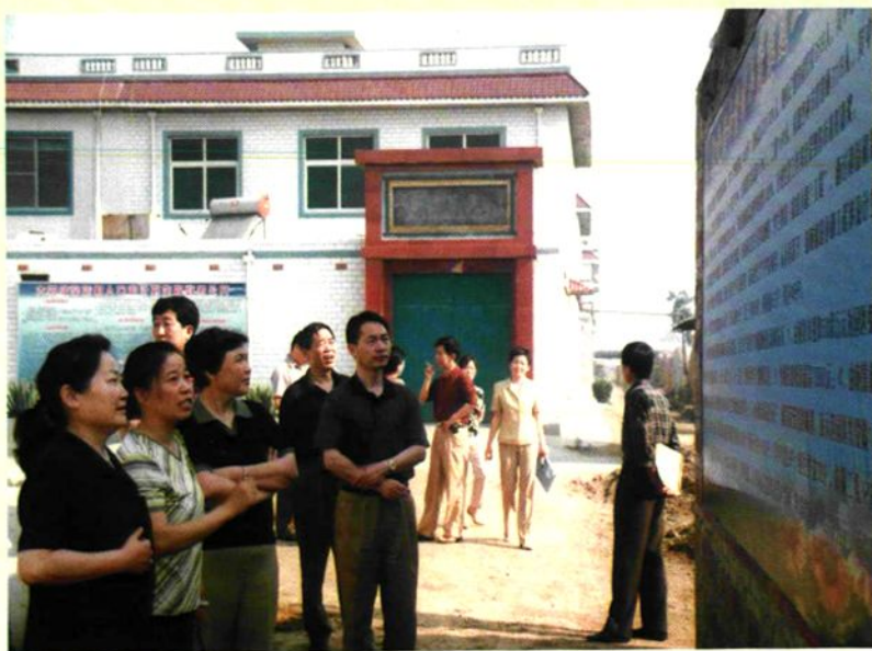
省市计生委领导到新店村检查计划生育工作。