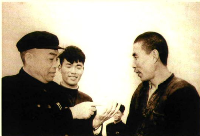
彭德怀副总理向苏殿池详细询问农民生产、生活情况。