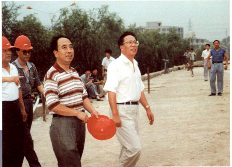
市委书记米凤君▶ 视察汽贸开发区