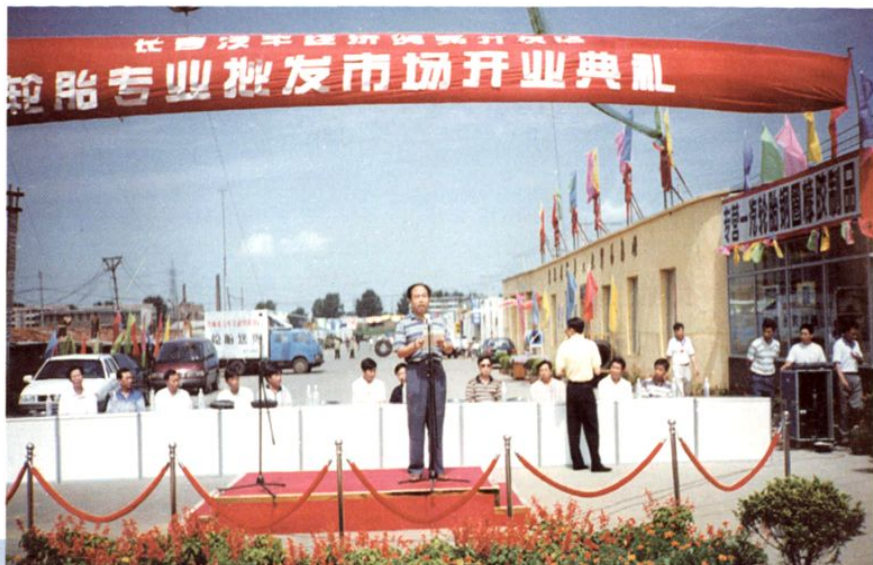
长春汽贸 开发区轮胎批 发市场开业典 礼