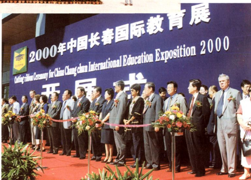
2000年中 国长春国际教 育展开式