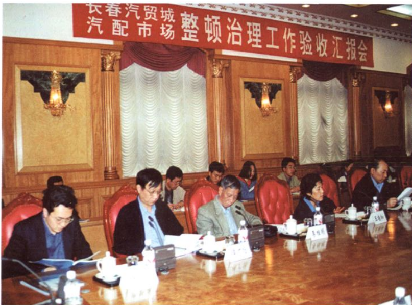
长春汽贸城汽车配 件市场整顿治理工 作验收汇报会