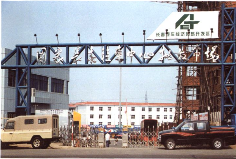
◀国家长春汽车中心 批发市场