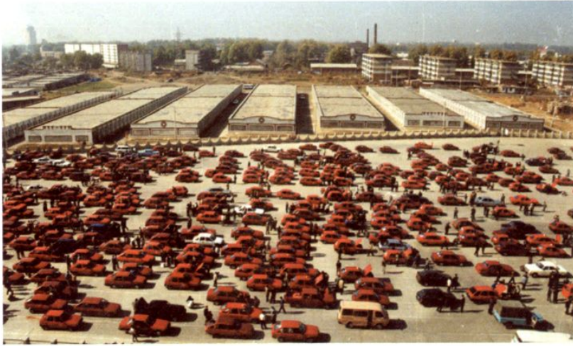
◀ 长春汽贸城批发市场