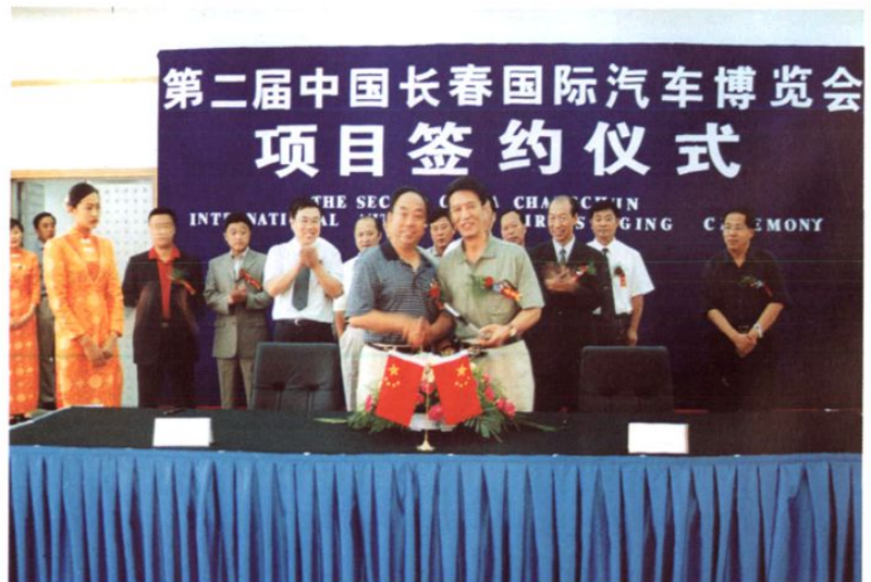
第二届中国长▶ 春国际汽车博览会 项目签约仪式