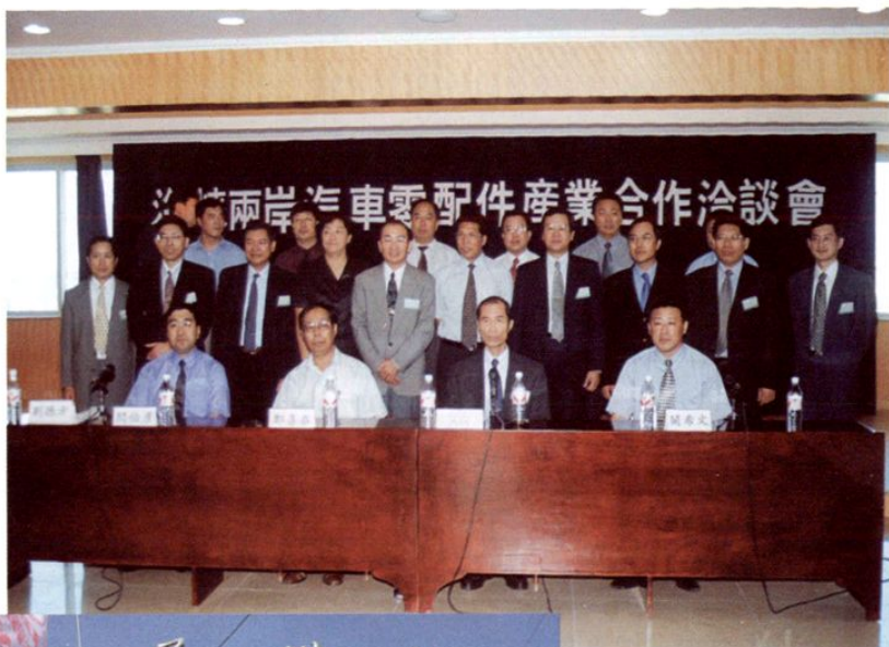
◀第四十七届全国 汽车配件交易会