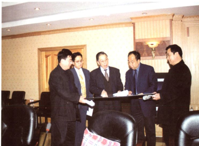
◀市长李述在长春汽贸 开发区进行工作调研