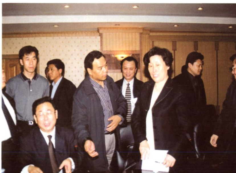
◀市委书记杜学芳、 市长祝业精视察 长春汽贸开发区