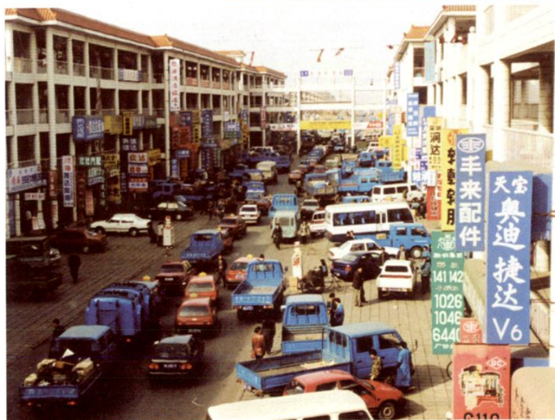
◀长春汽贸开发区汽车 配件商街