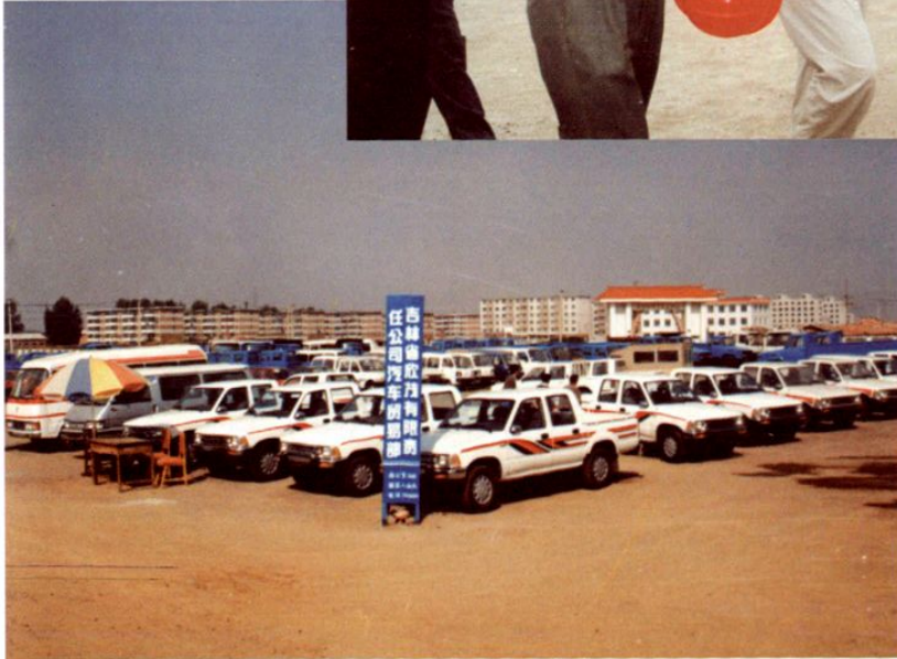
◀ 长春汽贸开发区 整车市场