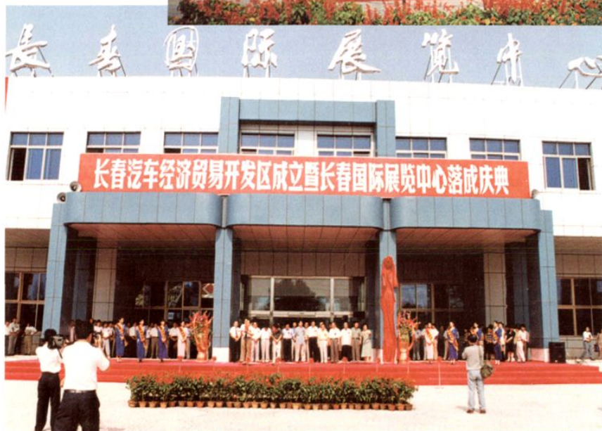
◀长春国际展览 中心落成