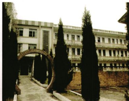
20世纪 80年代建设 的干部病房