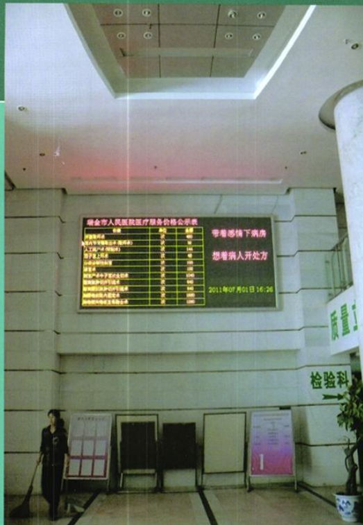
住院部电子公示栏