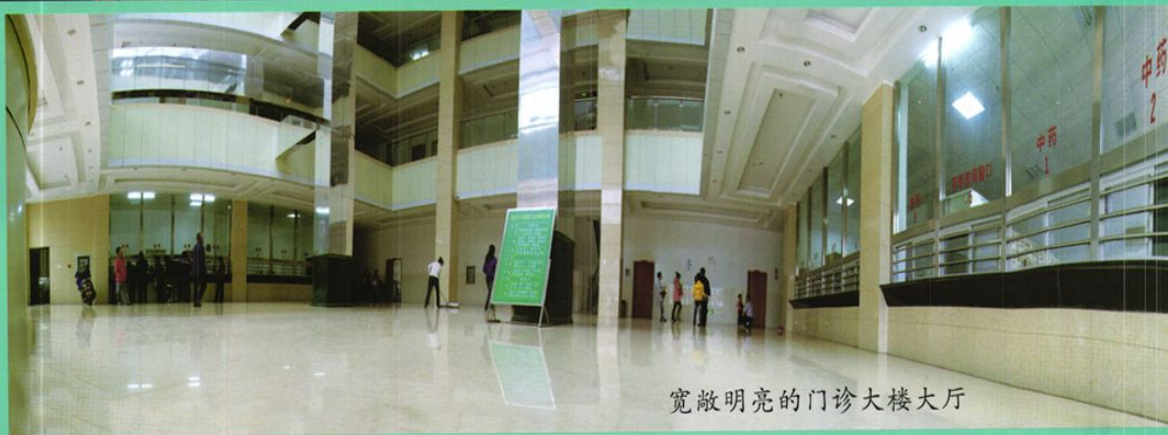
宽敞明亮的门诊大楼大厅