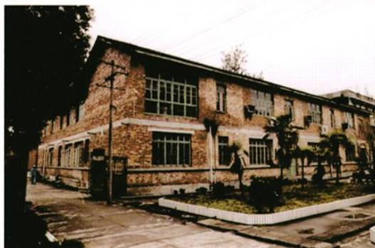
建于70年代的检验科和手术室