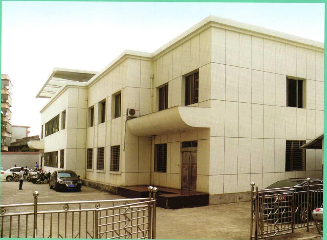
2006 年落成的传染病住院部病房