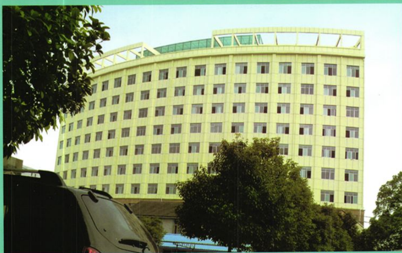
门诊大楼背面一景