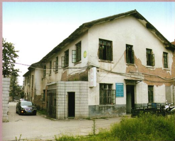
使用至2011年6月的医院办公楼