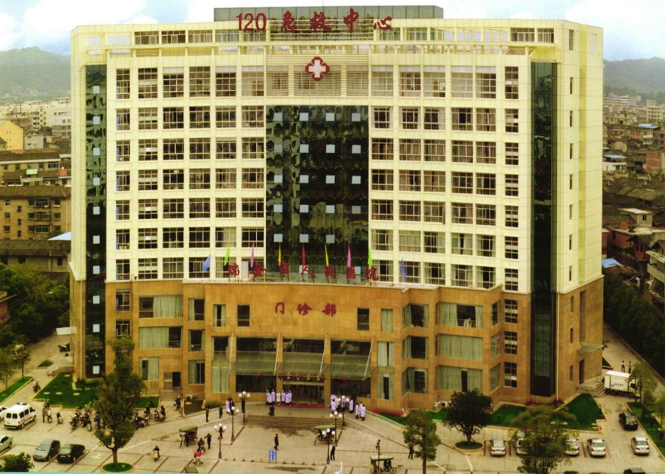
2011年投入使用的门诊大楼