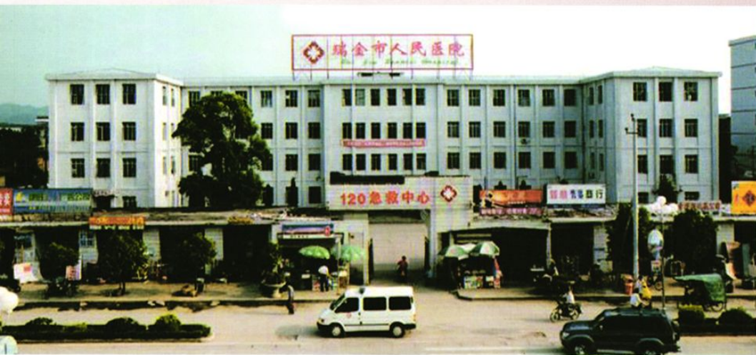
始建于 1959年的医 院门诊大楼 (2008年拆除 重建)