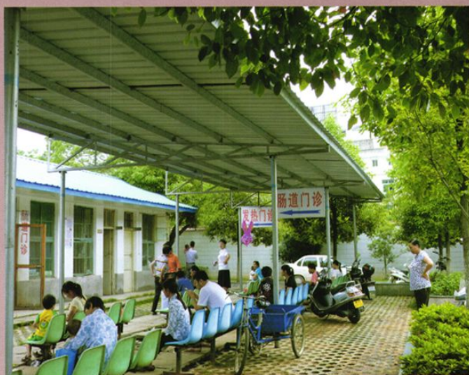
临时搭建的门诊阳棚