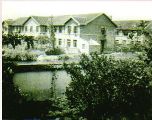
建于50年代初期的医院住院部