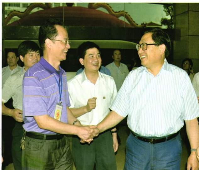
2011年6月7日，全国人大副委员长、中国红十字会会长华建敏到院视察工作。左起：李光、钟炳明、华建敏。