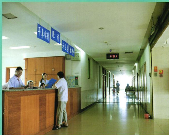
标准化住院部内景一角