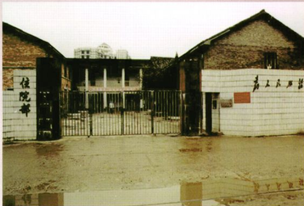
建于70年代的住院部