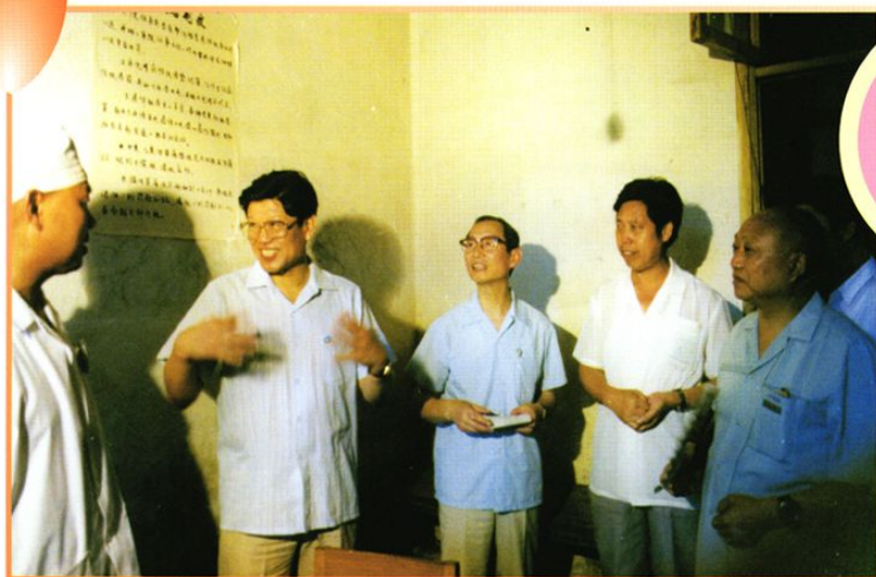
1991年7月9日，中央政治局委员、国务委员李铁映（左二）和国家卫生部长陈敏章（左三）到医院视察。